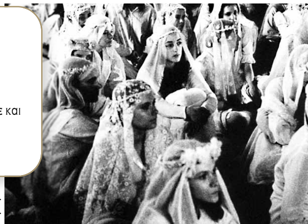
Π. Βούλγαρης, «Νύφες».

-Αξίζει τον κόπο, παιδιά, να δείτε τις ταινίες Μία αιωνιότητα και μια μέρα , με την οποία πήρε το Χρυσό Φοίνικα στο Φεστιβάλ Καννών, και Ο Μελισσοκόμος . -Επίσης αφού αγαπάτε τον κινηματογράφο δείτε και την ταινία Νύφες , ενός επίσης σημαντικού σκηνοθέτη του Παντελή Βούλγαρη.