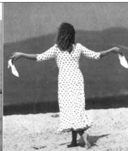
Θ. Αγγελόπουλος, «Μια αιωνιότητα και μια μέρα».

-Αξίζει τον κόπο, παιδιά, να δείτε τις ταινίες Μία αιωνιότητα και μια μέρα , με την οποία πήρε το Χρυσό Φοίνικα στο Φεστιβάλ Καννών, και Ο Μελισσοκόμος . -Επίσης αφού αγαπάτε τον κινηματογράφο δείτε και την ταινία Νύφες , ενός επίσης σημαντικού σκηνοθέτη του Παντελή Βούλγαρη.