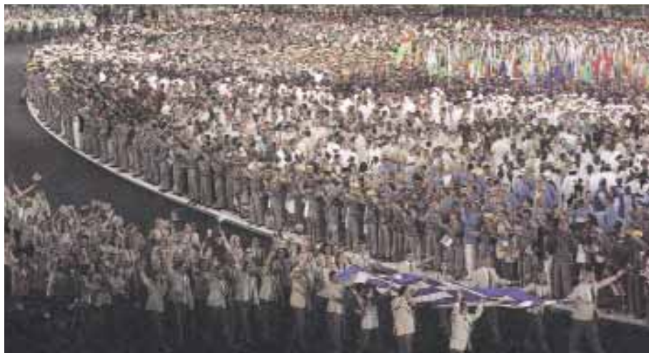
Στιγμιότυπα από την τελετή έναρξης των 28ων Ολυμπιακών Αγώνων στην Αθήνα, στις 13 Αυγούστου 2004.

Το 1997, έγινε δεκτή η πρόταση της Ελλάδας στην Ολυμπιακή επιτροπή, να αναλάβει τη διεξαγωγή των Ολυμπιακών Αγώνων στην Αθήνα. Έτσι το καλοκαίρι του 2004, έγιναν οι Ολυμπιακοί Αγώνες στην Ελλάδα. Η ελληνική κυβέρνηση συνεργάστηκε με επιτυχία με τις διεθνείς υπηρεσίες στον τομέα της ασφάλειας. Τα δημόσια έργα έγιναν στην ώρα τους. Την τελετή έναρξης, που ήταν ιδιαίτερα φαντασμαγορική, παρακολούθησαν χιλιάδες κόσμος, ντόπιοι αλλά και ξένοι. Η χώρα απέκτησε ευρύτατη αποδοχή, και το όνομά της ακούστηκε παντού. Η φήμη της ενισχύθηκε και με τη συμμετοχή πολλών αθλητών της στους αγώνες, οι οποίοι, μάλιστα, πήραν πολλά μετάλλια.