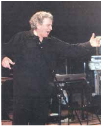
Ο Μίκης Θεοδωράκης.

Την ίδια εποχή, το λεγόμενο ελαφρό τραγούδι περνούσε μέσα από τις επιθεωρήσεις και τις κινηματογραφικές ταινίες. Αλλά και συνθέτες του λαϊκού τραγουδιού δέχτηκαν επιρροές από το ελληνικό ή το ξένο ελαφρό τραγούδι. Χαρακτηριστική ήταν η περίπτωση του Μανόλη Χιώτη. Έγραψε λαϊκά τραγούδια σε ρυθμούς της λατινοαμερικάνικης μουσικής. Μετά το τέλος του Εμφύλιου, δημιουργήθηκαν οι συνθήκες για την άνθηση ενός νέου μουσικού είδους, το οποίο αργότερα ο Μίκης Θεοδωράκης ονόμασε «έντεχνο λαϊκό τραγούδι».