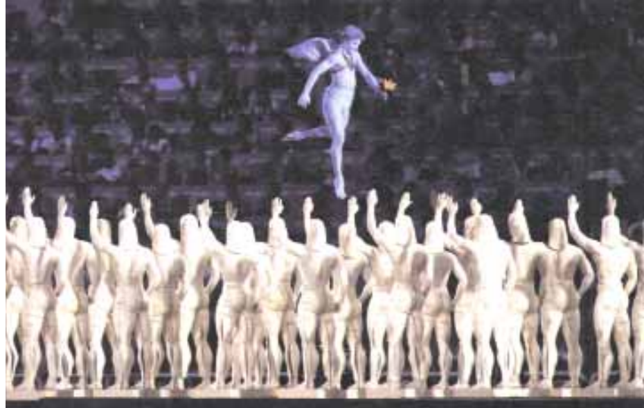
Εικόνες από την τελετή έναρξης των Ολυμπιακών Αγώνων στην Αθήνα, το 2004.