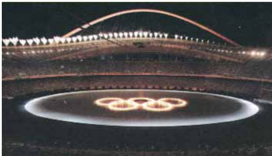
Από τα σημαντικότερα έργα αθλητικής υποδομής που έγιναν ποτέ στην Ελλάδα είναι η δημιουργία του Ολυμπιακού Αθλητικού Κέντρου Αθήνας (ΟΑΚΑ). Στις εγκαταστάσεις του έγιναν πολλά αγωνίσματα, καθώς και οι τελετές έναρξης και λήξης των αγώνων.