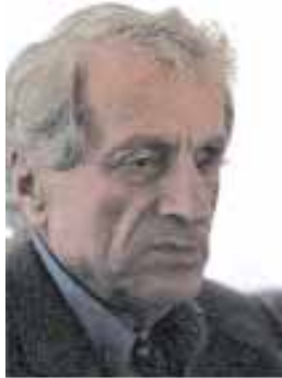
Ο Ιάνης Ξενάκης.

Έντονη κινητικότητα παρουσιάστηκε στη δεκαετία του 1960. Εμφανίστηκαν στο ελληνικό κοινό πρωτοποριακοί συνθέτες, όπως ο Ιάνης Ξενάκης.