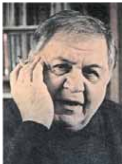
Ο Μάνος Χατζηδάκης.

Την περίοδο της Δικτατορίας, η μουσική του Μίκη Θεοδωράκη απαγορεύτηκε. Ο Μάνος Χατζηδάκης έφυγε για την Αμερική. Οι νεαροί Έλληνες ακροατές του αμερικάνικου ραδιοφωνικού σταθμού, που εξέπεμπε από τη στρατιωτική βάση του Ελληνικού, γοητεύτηκαν από τον έντονο ρυθμό και το κλίμα αμφισβήτησης των τραγουδιών της ποπ – ροκ μουσικής. Ταυτόχρονα, ανταποκρίθηκαν στα μουσικά ερεθίσματα του βρετανικού συγκροτήματος Μπήτλς. Όπως ήταν αναμενόμενο δημιουργήθηκαν τα πρώτα ελληνικά γκρούπ. Μετά την πτώση της Δικτατορίας υπήρξε μια αύξηση του ενδιαφέροντος για το έντεχνο και πολιτικοποιημένο τραγούδι. Στο μεταξύ, η ανάμειξη στοιχείων του ελαφρού και του λαϊκού τραγουδιού οδήγησε σ' ένα νέο είδος μουσικής, που ονομάστηκε «ελαφρολαϊκή». Αυτό το είδος της μουσικής κυριαρχεί ως τις μέρες μας. Μια ιδιαίτερη περίπτωση αποτελεί η μουσική του Βαγγέλη Παπαθανασίου. Είναι μουσικός διεθνούς φήμης, γνωστός στο εξωτερικό και απλά ως Vangelis.