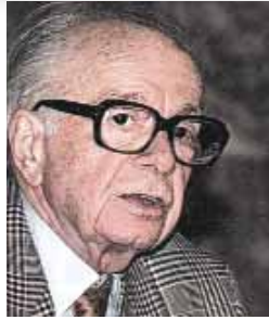
Ο Αντώνης Σαμαράκης.

-Ένα σημαντικό πρόσωπο των γραμμάτων ήταν και ο Αντώνης Σαμαράκης.