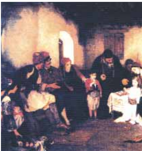
Νικόλαος Γύζης. «Τα αρραβωνιάσματα των παιδιών».

- Για δείτε, παιδιά, την Αντιγόνη του Λύτρα. Ποια ήταν άραγε τα συναισθήματά της; Ποιο στοιχείο του πίνακα του Βολανάκη νομίζετε ότι αποδίδεται με μεγαλύτερο ρεαλισμό;