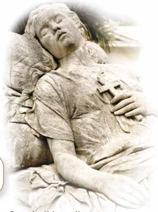
Γιαννούλης Χαλεπάς. «Κοιμωμένη».

Αφιέρωμα του περιοδικού "La Semaine Egyptienne" στον Καβάφη 1-7-1933.