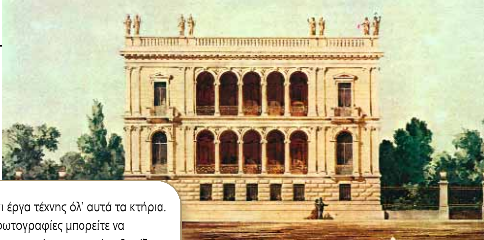
Ιλίου Μέλαθρον (1878-1879). Έργο του Ε. Τσίλερ.