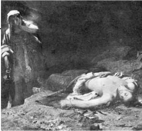
Νικηφόρος Λύτρας. «Η Αντιγόνη εμπρός στον νεκρό Πολυνείκη».

- Για δείτε, παιδιά, την Αντιγόνη του Λύτρα. Ποια ήταν άραγε τα συναισθήματά της; Ποιο στοιχείο του πίνακα του Βολανάκη νομίζετε ότι αποδίδεται με μεγαλύτερο ρεαλισμό;