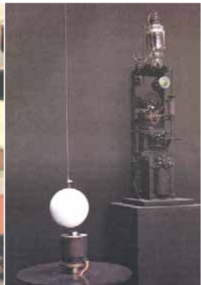
Νίκος Κεσσανλής, «Σύνθεση».