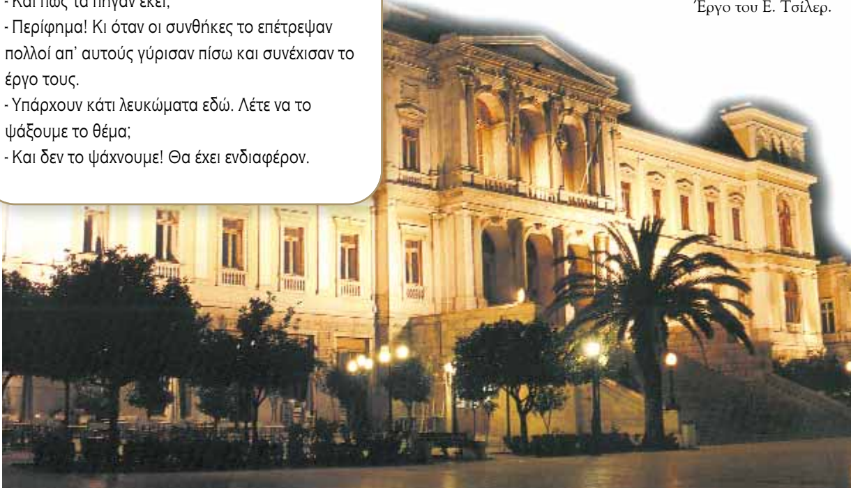
Δημαρχείο της Ερμούπολης Σύρου (1876-1891). Έργο του Ε. Τσίλερ.

Μετά τα μέσα του 19ου αιώνα εμφανίστηκε στην ελληνική αρχιτεκτονική ο Γερμανός αρχιτέκτονας Ερνέστο Τσίλερ. Ο Ε. Τσίλερ κατόρθωσε να δώσει στα κτήριά του κλασικές αναλογίες. Στις πρώτες δεκαετίες του 20ού αιώνα, εμφανίζεται ένα νέο οικοδομικό υλικό το τσιμέντο. Αυτό έδωσε στην αρχιτεκτονική καινούριες δυνατότητες, για την αναζήτηση νέων μορφών.