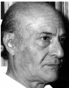
Ο Οδυσσέας Ελύτης.

Ο Οδυσσέας Ελύτης ήταν ο δεύτερος Έλληνας ποιητής που πήρε το Νόμπελ Λογοτεχνίας, το 1979. Γεννήθηκε στο Ηράκλειο Κρήτης το 1911. Σε ηλικία 13 ετών άρχισε να δημοσιεύει ποιήματα του στη «Διάπλαση των Παίδων». Τις καλοκαιρινές του διακοπές τις περνούσε στα νησιά του Αιγαίου. Αυτή θα είναι η πρώτη του επαφή με τη θάλασσα, η οποία αργότερα έπαιξε σημαντικό ρόλο στο έργο του. Ξεκίνησε σπουδές στη Νομική τις οποίες όμως δεν ολοκλήρωσε. Το «Ελύτης» ήταν το ψευδώνυμό του. Το επίθετο του ήταν Αλεπουδέλης. Το 1950 στη Γαλλία άρχισε να γράφει το «Άξιον Εστί». Το ολοκλήρωσε και το δημοσίευσε, δέκα χρόνια αργότερα, το 1960. Την ίδια χρονιά, κέρδισε το Α' Κρατικό Βραβείο Ποίησης. Το 1964, το «Άξιον Εστί» παρουσιάστηκε μελοποιημένο από τη Μίκη Θεοδωράκη στο κινηματοθέατρο ΡΕΞ. Έργα του είναι ο «Ήλιος ο Ηλιάτορας», «Τα ρω του έρωτα», «Το μονόγραμμα» και το «Φωτόδεντρο».