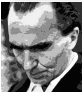
Ο Νίκος Καζαντζάκης.

-Ας προχωρήσουμε παρακάτω. Τώρα θα σας μιλήσω και για κάποιον άλλον, εξίσου σπουδαίο. -Ποιος είναι αυτός; -Ο Νίκος Καζαντζάκης. Τον έχετε ακούσει; Δείτε τη φωτογραφία του.