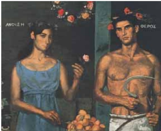
Γιάννης Τσαρούχης, Λεπτομέρεια από τον πίνακα «Οι τέσσερις εποχές».