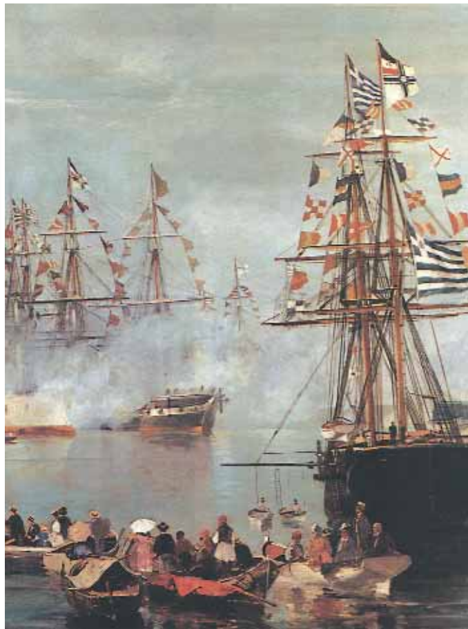
Κωνσταντίνος Βολανάκης. Λεπτομέρεια από την «Αφιξη της πριγκίπισσας Σοφίας».

Πολλοί Έλληνες ζωγράφοι εργάζονταν στο εξωτερικό. Ο Νικηφόρος Λύτρας ήταν ο ζωγράφος, που κυριάρχησε στο δεύτερο μισό του 19ου αιώνα, στην Ελλάδα. Το 1860 γράφτηκε στην Ακαδημία του Μονάχου, με υποτροφία του ελληνικού δημοσίου. Ο Κωνσταντίνος Βολανάκης σπούδασε κι αυτός στο Μόναχο. Ταξίδεψε στο Παρίσι, στη Βιέννη, στο Λονδίνο και αλλού.