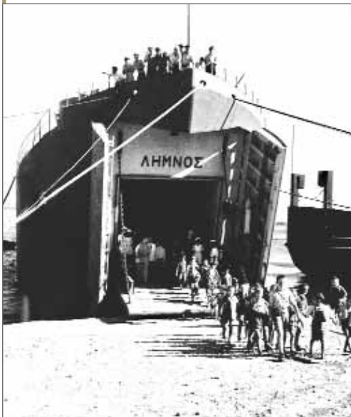
Παιδιά στο δρόμο για τις Παιδοπόλεις.

Επτά Ημέρες, Η Ελλάδα τον 20ό αιώνα. 1945-1950, Εφ. Η Καθημερινή 21 Νοεμβρίου 1999, σ. 22.