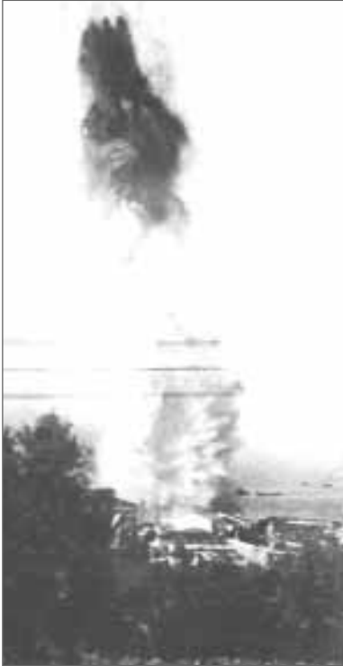
Ο τορπιλισμός της «Ελλης».