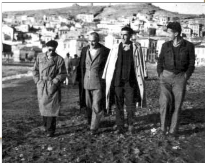
Άνθρωποι των γραμμών εξόριστοι.