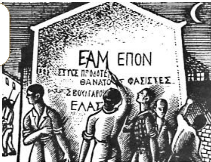
Τα συνθήματα της Αντίστασης.

-Δείτε τις φωτογραφίες και διαβάστε το κείμενο. Με ποιους τρόπους αντιστέκονταν οι Έλληνες κατά την Κατοχή;