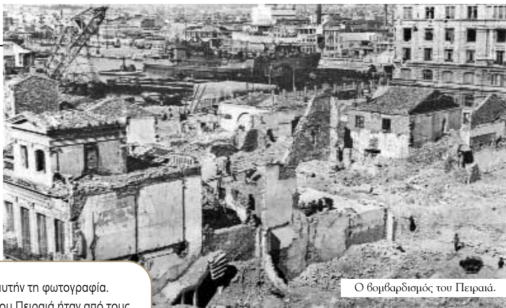
Ο βομβαρδισμός του Πειραιά.

-Κοιτάξτε αυτήν τη φωτογραφία. Το λιμάνι του Πειραιά ήταν από τους πρώτους στόχους των Γερμανών. -Και πώς αντέδρασαν οι Έλληνες στη γερμανική Κατοχή, παππού;