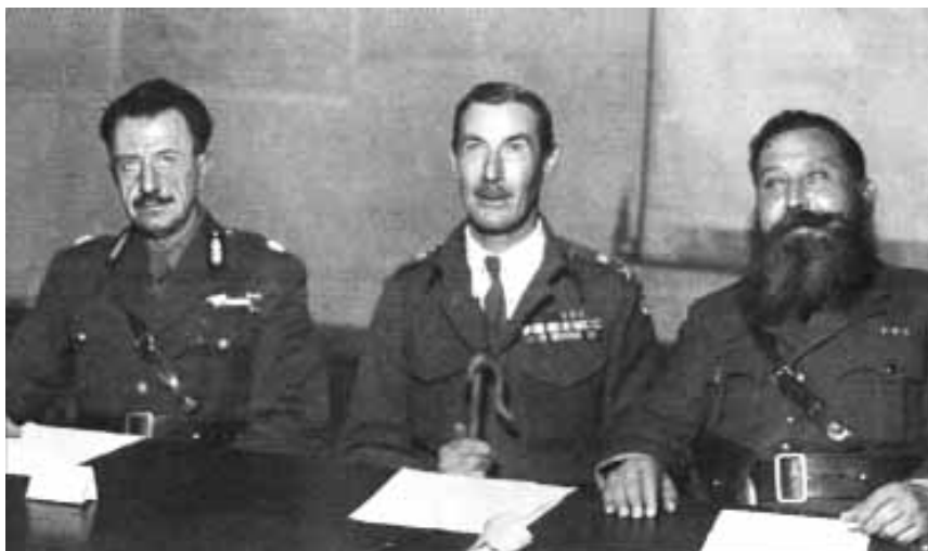
Στιγμιότυπο από την Υπογραφή της Συμφωνίας της Βάρκιζας. Από αριστερά ο στρατηγός Στέφανος Σαράφης, αρχηγός του Ε.Λ.Α.Σ., στη μέση ο Ρόναλντ Σκόμπι, διοικητής των βρετανικών δυνάμεων και δεξιά ο Ναπολέων Ζέρβας, αρχηγός του Ε.Δ.Ε.Σ.