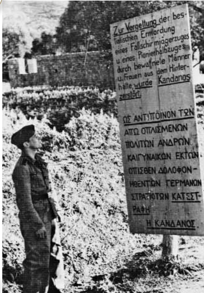
Η καταστροφή της Κανδάνου από τους Γερμανούς.

-Παπού, πήγαμε πριν λίγες μέρες στο Εβραϊκό Μουσείο. Εκεί είδαμε ότι οι Ναζί προσπάθησαν να εξολοθρεύσουν τους Εβραίους. Το γεγονός αυτό έμεινε στην ιστορία ως το Ολοκαύτωμα. Στην Ελλάδα υπήρχαν Εβραίοι; -Βεβαίως, παιδιά, ακούστε!