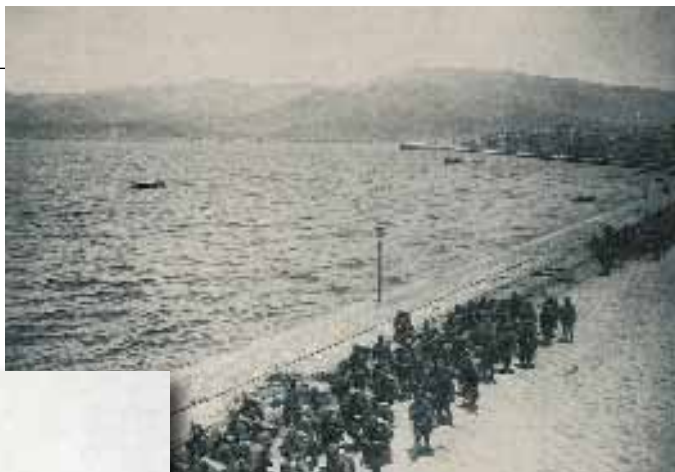
Ελληνικά στρατεύματα παρελαύνουν στην παραλία της Σμύρνης.

-Παιδιά! Έχει κάτι φωτογραφίες εδώ. Δεν ξέρω πού τις βρήκε η μητέρα μου, μάλλον από εφημερίδες. Πάντως απ' ό,τι έλεγε είχαν χαρεί όλοι οι Έλληνες τότε, με τον ερχομό των Ελλήνων στρατιωτικών.