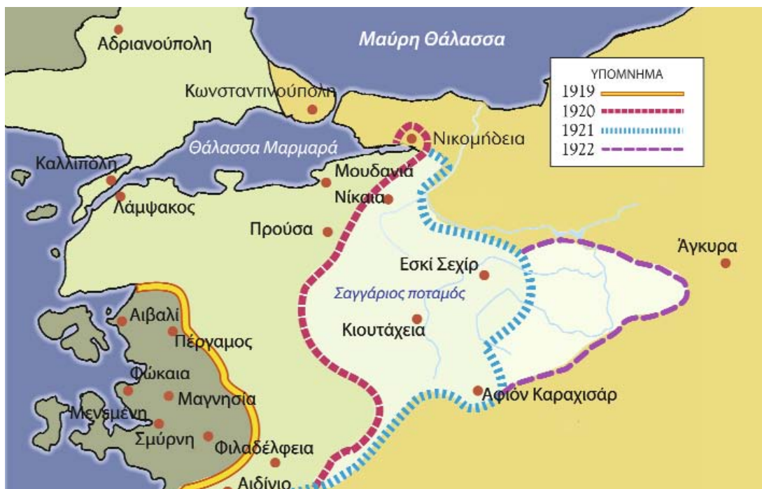
Χάρτης των κινήσεων του ελληνικού στρατού κατά τη διάρκεια της εκστρατείας στη Μικρά Ασία.