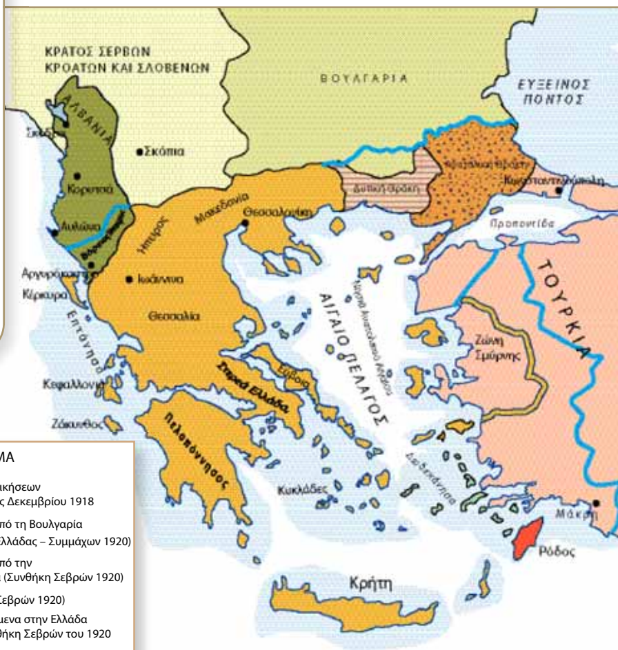
Τα νότια Βαλκάνια μετά τις συνθήκες Νείγυ και Σεβρών.

-Πώς σας φάνηκαν τα κείμενα; Είναι πραγματικές μαρτυρίες ανθρώπων που ήρθαν από τη Μικρά Ασία και με νοσταλγία θυμούνται τη ζωή τους εκεί, πριν από την καταστροφή. Είμαι σίγουρη πως κι εσείς μπορείτε να φανταστείτε τη ζωή τους και να την περιγράψετε. -Και τι έγινε μετά γιαγιά; Αφού ζούσαν τόσο όμορφα εκεί, γιατί έφυγαν; -Δεν ήθελαν, αλλά έπρεπε. Όλα αυτά που βλέπετε καταστράφηκαν. Δεν τους απόμεινε τίποτα. -Μα πώς;