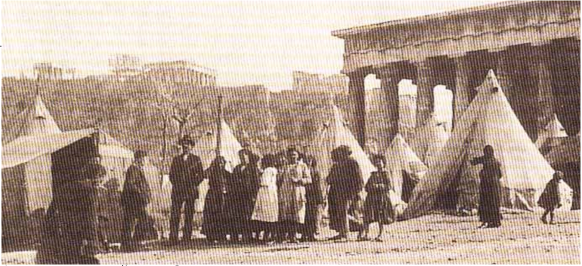
Αντίσκηνα προσφύγων έξω από το Θησείο.