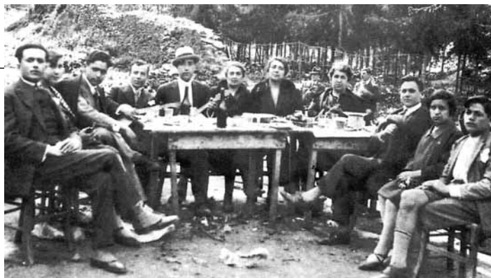
Γλέντι μικρασιατών προσφύγων στην Καισαριανή, Μάιος 1929.

- Είναι εύκολο, φαντάζομαι, να καταλάβετε, πόσο μεγάλη προσπάθεια έκαναν οι Έλληνες που ήρθαν από τη Μικρά Ασία για να ξαναρχίσουν τη ζωή τους στην Ελλάδα; -Στο τέλος το βιβλίο λέει κάτι πολύ σημαντικό.