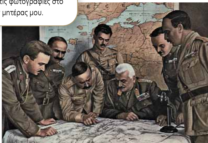
Το Ελληνικό Επιτελείο κατά τις επιχειρήσεις του Ιουνίου του 1920.

-Δείτε αυτές τις φωτογραφίες στο λεύκωμα της μπτέρας μου.