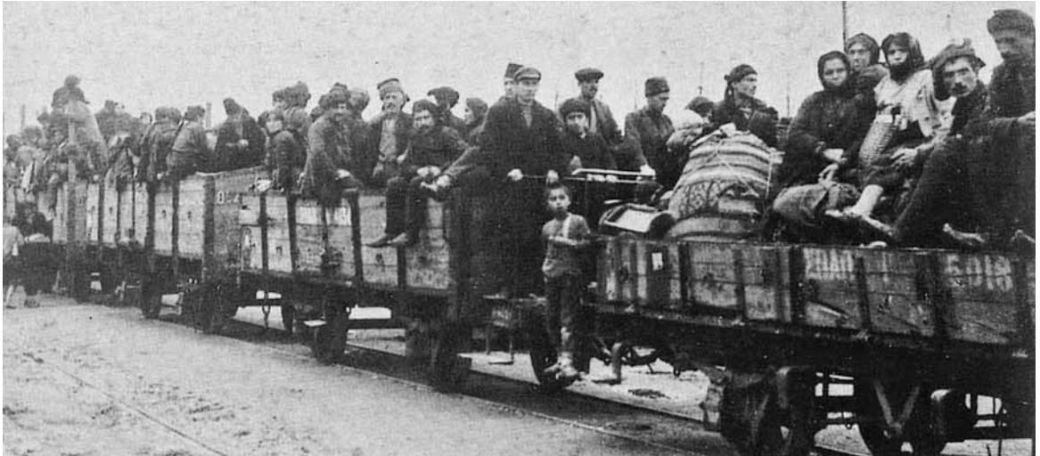
Καραβάνια προσφύγων φτάνουν στη Θεσσαλονίκη.