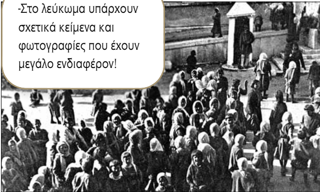
Διανομή βοήθειας σε πρόσφυγες.

-Στο λεύκωμα υπάρχουν σχετικά κείμενα και φωτογραφίες που έχουν μεγάλο ενδιαφέρον!