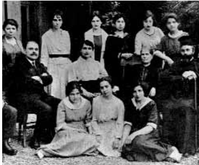
Καθηγητές και καθηγήτριες ελληνικού γυμνασίου στη Μικρά Ασία.