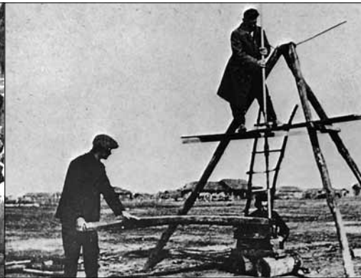
Η αναζήτηση νερού.