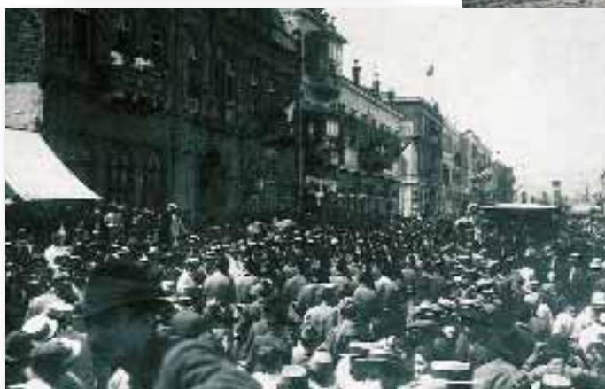
Εκδήλωση ενθουσιασμού από τον λαό στη Σμύρνη για την ελληνική παρουσία.

-Για διαβάστε τα λόγια που είπε ο Ελευθέριος Βενιζέλος στους Έλληνες που ζούσαν στη Σμύρνη, μόλις έφτασε εκεί ο στρατός από την Ελλάδα. Είμαι σίγουρη πως αν σας εξηγήσω μερικές άγνωστες λέξεις, θα μπορέσετε να καταλάβετε τι επιθυμούσε ο Βενιζέλος, αλλά και τι συμβούλευε τους πολίτες να κάνουν.