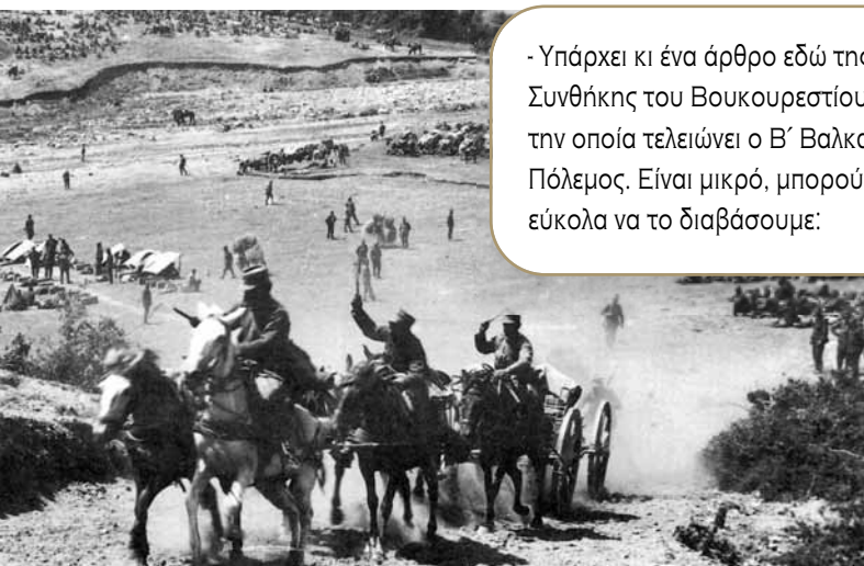
Έφοδος πυροβολικού στην Κρέσνα.

- Υπάρχει κι ένα άρθρο εδώ της Συνθήκης του Βουκουρεστίου, με την οποία τελειώνει ο Β΄ Βαλκανικός Πόλεμος. Είναι μικρό, μπορούμε εύκολα να το διαβάσουμε: