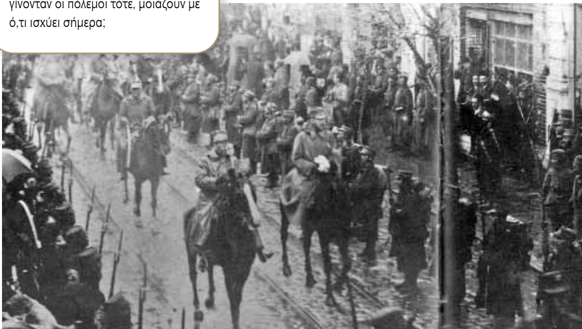
Είσοδος του βασιλιά Γεωργίου του Α΄ στη Θεσσαλονίκη.

- Αλήθεια, τα μέσα, ο τρόπος και οι συνθήκες κάτω από τις οποίες γίνονταν οι πόλεμοι τότε, μοιάζουν με ό,τι ισχύει σήμερα;