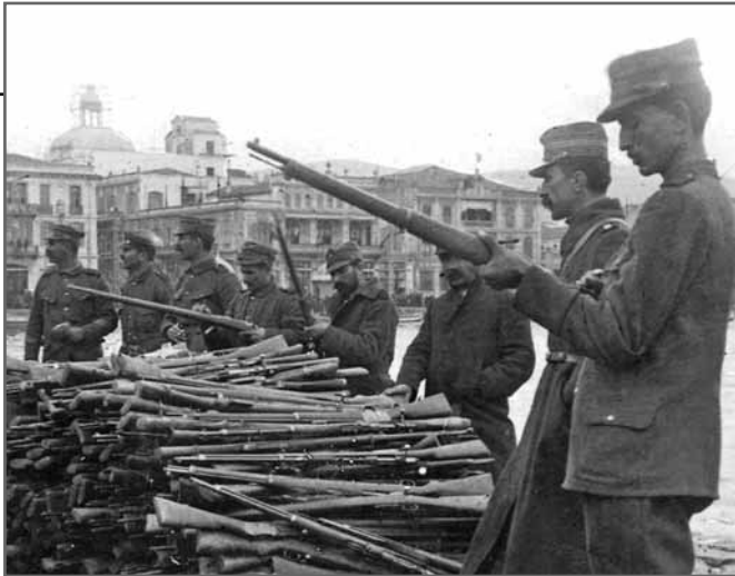
Μέρος των 75.000 παραδοθέντων τουρκικών όπλων, τύπου Μάουζερ, στη Θεσσαλονίκη.

Πρώτος σιδηρόδρομος, που κατέλαβαν οι ελληνικές δυνάμεις στη Θεσσαλονίκη.