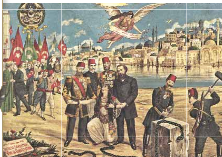
Αλληγορική απεικόνιση της επαναφοράς σε ισχύ του συντάγματος του 1876 από τους Νεότουρκοι.

- Θα είχε ενδιαφέρον, να βρούμε και σε ποιες άλλες περιοχές, που είχαν τότε κατακτηθεί από την Οθωμανική Αυτοκρατορία, ζούσαν Έλληνες.