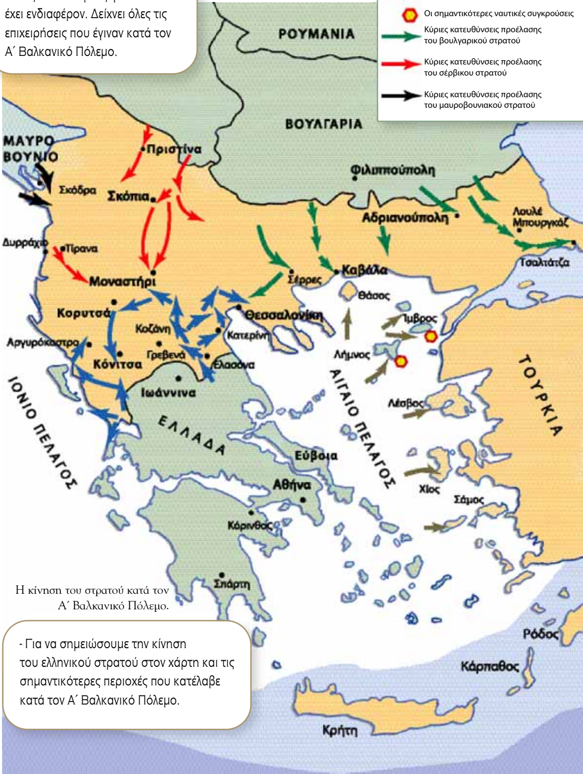
Η κίνηση του στρατού κατά τον Α΄ Βαλκανικό Πόλεμο.

- Για να σημειώσουμε την κίνηση του ελληνικού στρατού στον χάρτη και τις σημαντικότερες περιοχές που κατέλαβε κατά τον Α΄ Βαλκανικό Πόλεμο.