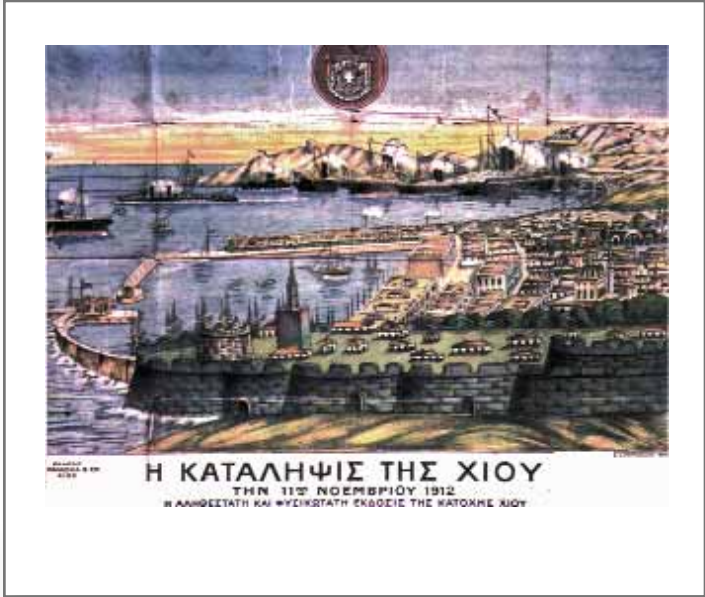
Γκραβούρα της κατάληψης της Χίου.

Επίσης, από τα νησιά απελευθέρωσαν τη Χίο, τη Λέσβο και τη Σάμο.