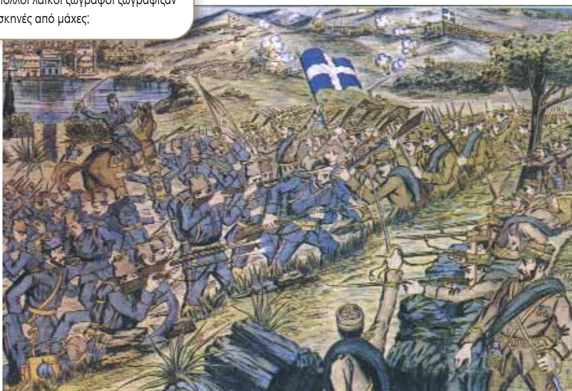
Λιθογραφία της μάχης του Δρίσκου, 28 Δεκεμβρίου 1912.

- Παρατηρώντας τη λιθογραφία, τι νομίζετε να σημαίνει το γεγονός, ότι πολλοί λαϊκοί ζωγράφοι ζωγράφιζαν σκηνές από μάχες;