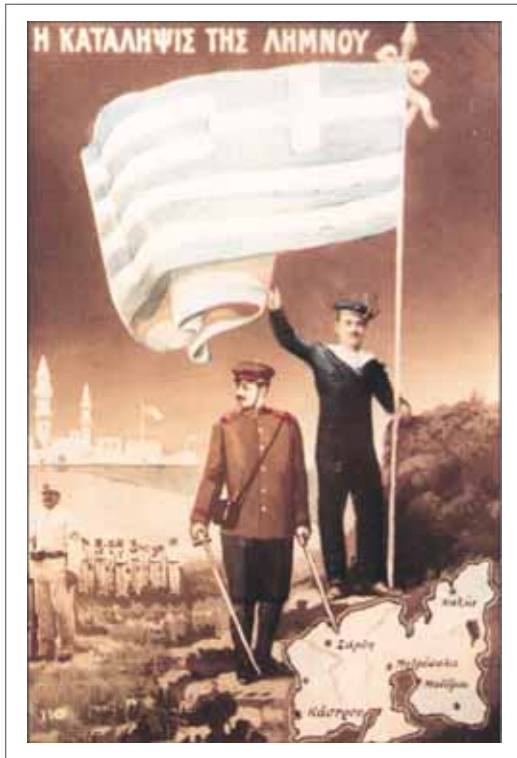
Αφίσα της κατάληψης της Λήμνου.

- Ποια συμπεράσματα βγάζετε, παιδιά, από τη διαφώνια Βενιζέλου - βασιλιά σχετικά με την κίνηση του στρατού προς τη Θεσσαλονίκη; Ποια επιχειρήματα χρησιμοποίησε ο καθένας για να υποστηρίξει την άποψή του; Ποιοι άλλοι ήθελαν την πόλη και γιατί;