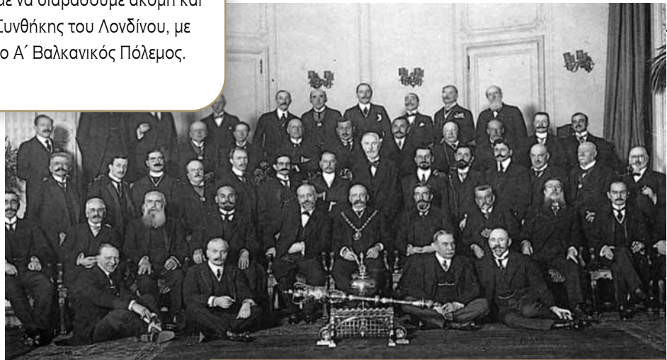
Συνδιάσκεψη του Λονδίνου.

- Αν θέλεις, μπορούμε να διαβάσουμε ακόμη και κάποια άρθρα της Συνθήκης του Λονδίνου, με την οποία τελείωσε ο Α΄ Βαλκανικός Πόλεμος.