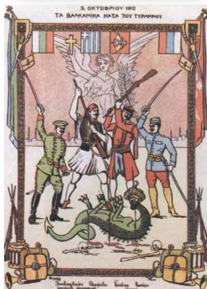
Γελοιογραφία. Τα Βαλκάνια κατά του τυράννου.

Τα κράτη τους είχαν παρόμοια σχέδια επέκτασης με την Ελλάδα. Επιπλέον, υπήρχαν και ευρωπαϊκές χώρες που ήθελαν να μείνει η κατάσταση, όπως ήταν, στα Βαλκάνια, κάτω από τον έλεγχο της Οθωμανικής Αυτοκρατορίας. Όμως, από το 1908, που στο εσωτερικό της Οθωμανικής Αυτοκρατορίας επικράτησαν οι Νεότουρκοι, η πολιτική της απέναντι στους ξένους λαούς, που ζούσαν στα εδάφη της, άλλαξε. Επιθυμούσε οι λαοί αυτοί να εξισλαμιστούν και άρχισε να τους καταπιέζει. Αυτός ήταν ένας πολύ σημαντικός λόγος, για να θέλουν, να απελευθερωθούν.