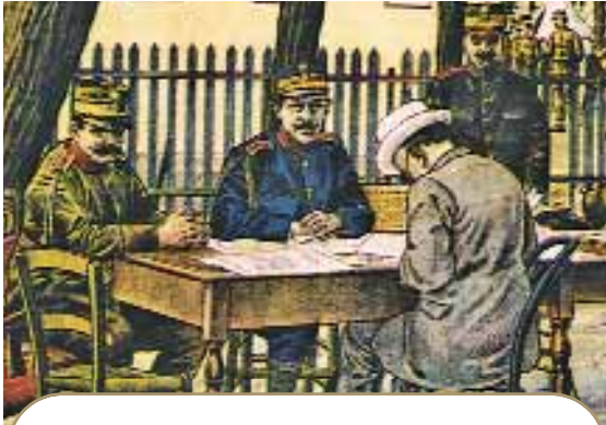
Ελληνικό Στρατηγείο. Ο βασιλιάς Γεώργιος Α΄ και ο πρωθυπουργός Βενιζέλος καθορίζουν στο Χατζή – Μπεϊλίκ τους όρους της Συνθήκης του Βουκουρεστίου, στις 14 Ιουλίου 1913.

- Να και ο χάρτης μετά τη Συνθήκη του Βουκουρεστίου. Εδώ φαίνεται τι κέρδισαν όλοι οι σύμμαχοι, καθώς και η Ελλάδα από τους Βαλκανικούς Πολέμους 1912 - 1913.