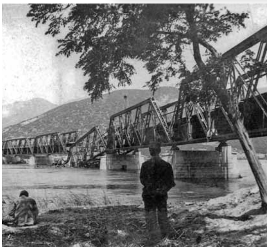
Γέφυρα του Στριμόνα, που έχει καταστραφεί από τους Βουλγάρους.

Οι βαλκανικοί σύμμαχοι, Έλληνες, Σέρβοι, Βούλγαροι, δημιούργησαν συμμαχία, για να πάρουν εδάφη από τον κοινό τους εχθρό, την Οθωμανική Αυτοκρατορία. Όμως, τα εδάφη που κάθε μια χώρα επιθυμούσε στην περιοχή της Μακεδονίας, πολλές φορές τα ήθελε και η άλλη. Η συμμαχία λοιπόν δεν κράτησε για πολύ. Τον Ιούνιο του 1913, η Ελλάδα και η Σερβία υπέγραψαν Συνθήκη, με την οποία συμφωνούσαν να μοιράσουν μεταξύ τους τα εδάφη της Μακεδονίας, που είχαν πάρει από την Τουρκία. Έβγαζαν έτσι έξω τη Βουλγαρία. Εκείνη πίστευε πως, αν και είχε πολεμήσει σκληρά στον πόλεμο με την Τουρκία, δεν είχε ωφεληθεί, όσο περίμενε. Στράφηκε, λοιπόν, εναντίον της Σερβίας και της Ελλάδας. Η Ρουμανία, που στον Α' Βαλκανικό Πόλεμο δεν είχε συμμετοχή, τώρα πήρε μέρος στη σύγκρουση. Επιτέθηκε κατά της Βουλγαρίας.