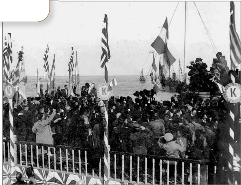
Η υποδοχή του βασιλιά Κωνσταντίνου στην εξέδρα του Φαλήρου, 4 Αυγούστου 1913.

- Δείτε αυτή τη φωτογραφία. Πώς φαίνεται ότι δέχτηκε ο λαός τα αποτελέσματα των Βαλκανικών Πολέμων;