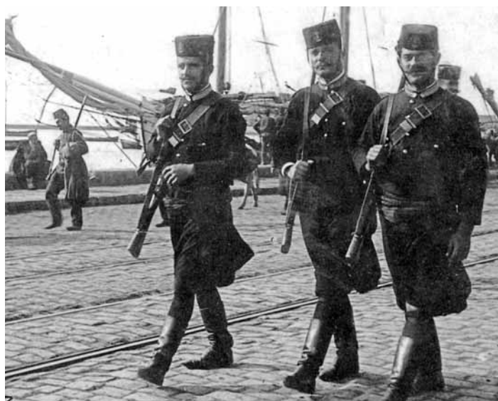
Περίπολος κρητών στρατιωτών στη Θεσσαλονίκη.