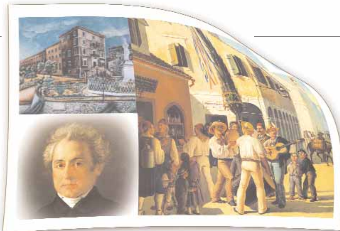
Η Ιόνιος Ακαδημία. Ο Διονύσιος Σολωμός.