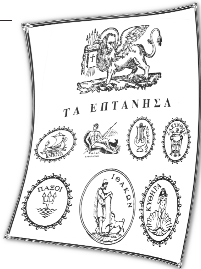
Σκίτσο της σημαίας της Επτανησιακής Πολιτείας.