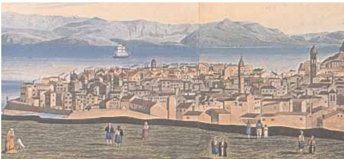
Άποψη της Κέρκυρας την εποχή της αγγλικής κατοχής.

Οι Άγγλοι βρήκαν την ευκαιρία να ξανακερδίσουν τη συμπάθεια των Ελλήνων. Έτσι αποφάσισαν να δώσουν τα Επτάνησα στον νέο βασιλιά της Ελλάδας. Οι σχέσεις των δύο λαών δεν ήταν καλές. Αυτό συνέβαινε γιατί, κατά τη διάρκεια του Κριμαϊκού Πολέμου, αγγλικά πλοία μαζί με γαλλικά είχαν κλείσει το λιμάνι του Πειραιά.