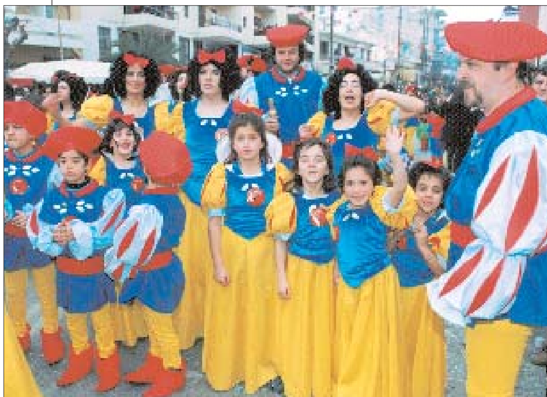
Στις Αποκριάτικες γιορτές