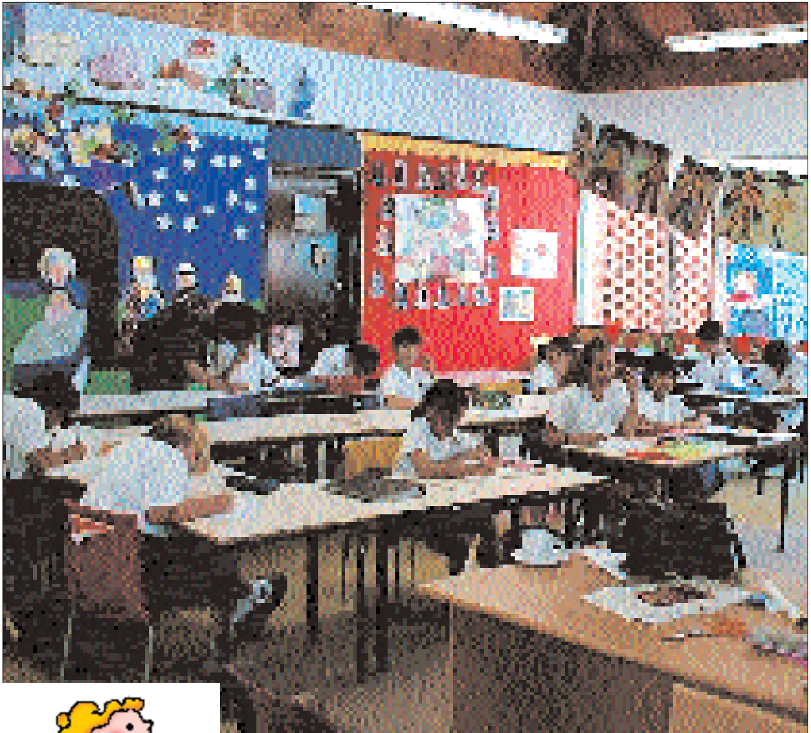
Τάξη από το ΣΑΧΕΤΙ στο Γιοχάνεσμπουργκ