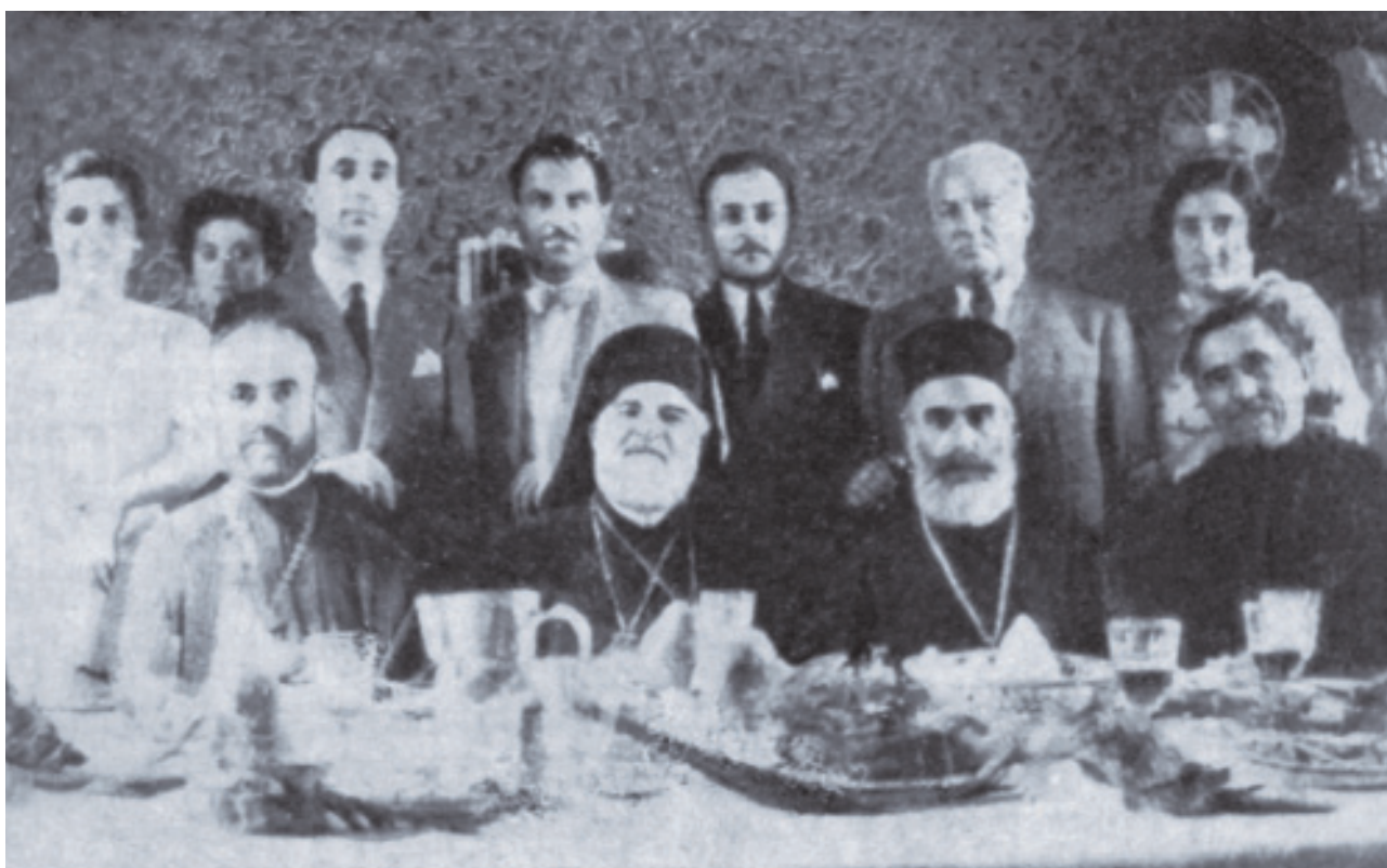
Γεύμα προς τιμήν του Σύρου Ορθοδόξου Μητροπολίτου Μπουένος Άιρες. Οι μητροπόλεις των Σύρων και Ρώσων ορθοδόξων προϋπήρχαν της ελληνικής.