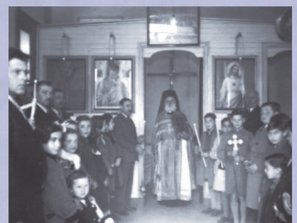
Λειτουργία στον Ι. Ναό Κωνσταντίνου και Ελένης στο Βερίσοο.

Επίσκοπος του τότε αρχιεπισκόπου Βορείου και Νοτίου Αμερικής Ιακώβου στο ελληνικό σχολείο του Μπουένος Άιρες. Η πρωτοβουλία για την ίδρυση ανεξαρτήτου Μητροπόλεως στην μεγαλούπολη του νότου ανήκει σ' αυτόν και στον Πατριάρχη Κωνσταντινουπόλεως Βαρθολομαίο. Η ίδρυση της ανεξάρτητης Μητρόπολης χαροποίησε αφάνταστα τους Έλληνες της Αργεντινής, μα δημιούργησε και οικονομικά προβλήματα στην εκκλησία.