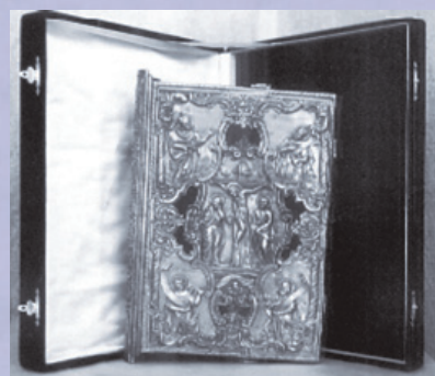
Η προμήθεια εκκλησιαστικών ειδών ήταν πάντοτε δύσκολη, μια και ο μόνος τρόπος είναι η παραγγελία στην Ελλάδα.

Η πρώτη εκκλησία που ιδρύθηκε στην Αργεντινή, μα και σε όλη την Κεντρική και Νότιο Αμερική, είναι η εκκλησία των αγίων Κωνσταντίνου και Ελένης στο Βερίσσο, μια εργατική περιοχή στην περιφέρεια του Μπουένος Άιρες, στα τέλη της δεκαετίας του 1910.