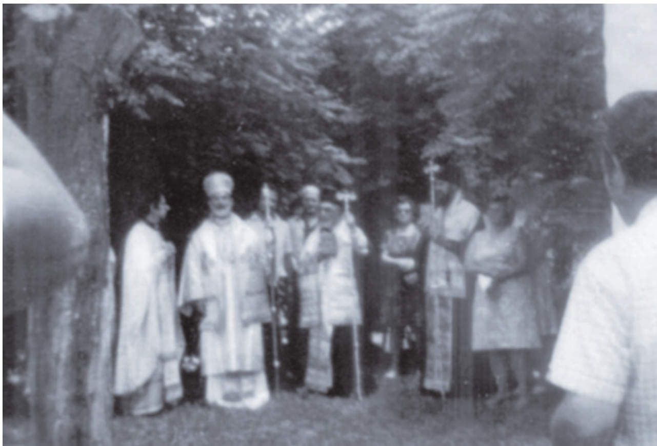
Πάσχα στην «Ολυμπία».