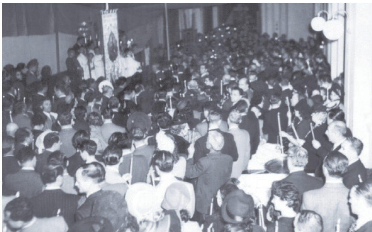
Πάσχα και τρισάγιο στον περίβολο της Μητρόπολης, που είναι μαζί και αυλή του σχολείου.