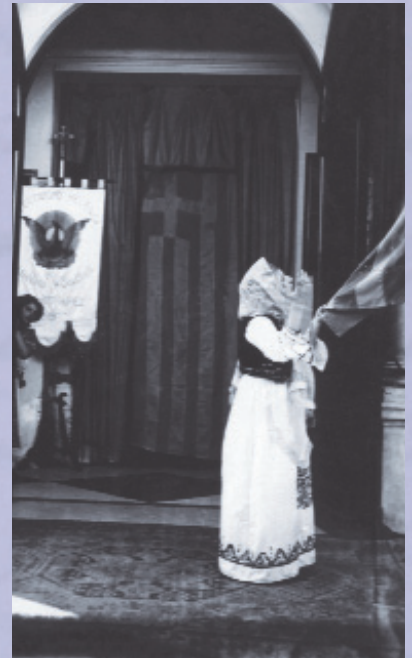
Στην είσοδο του Μητροπολιτικού Ναού του Μπουένος Άιρες.

Οι λειτουργίες και τα μυστήρια γίνονται συνήθως στα Ελληνικά, με κάποια μέρη τους να απαγγέλλονται στα Ισπανικά ή στα Πορτογαλικά στην περίπτωση της Βραζιλίας.