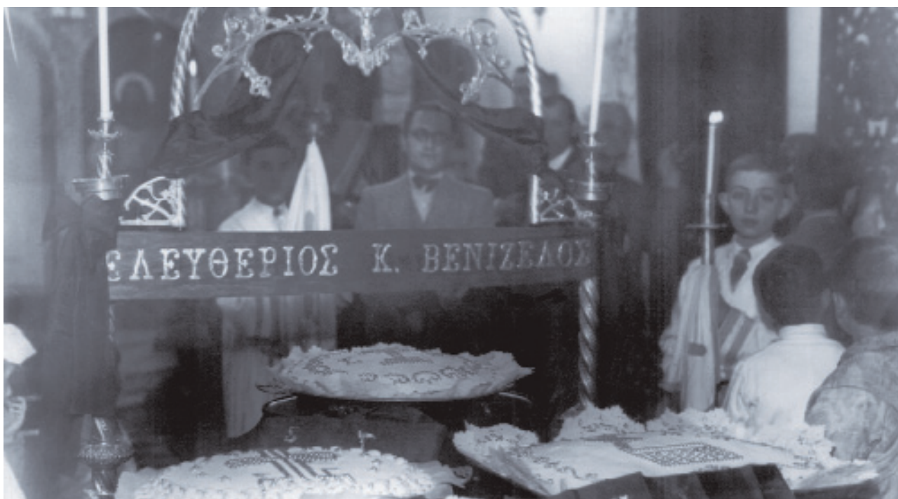
Μνημόσυνο για τον Ελευθέριο Βενιζέλο στην Μητρόπολη.