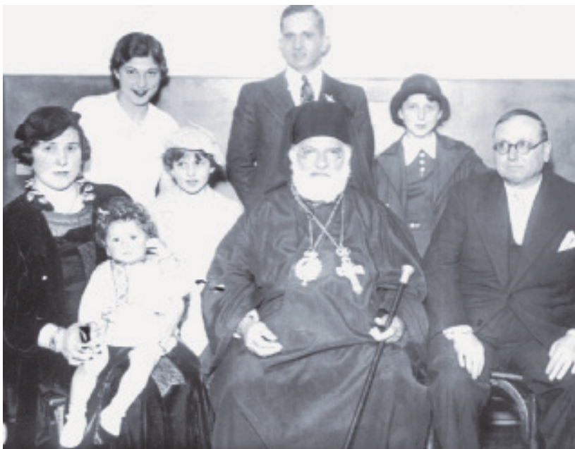
Οικογενειακή φωτογραφία γέροντος ιερέα.

Συχνά, στις γιορτές των εκκλησιών, μα και σ' άλλες περιπτώσεις, γίνεται «μονοκλησιά» -συγκέντρωση πιστών και ιερέων σε μια μόνον εκκλησία για πανηγυρική λειτουργία.