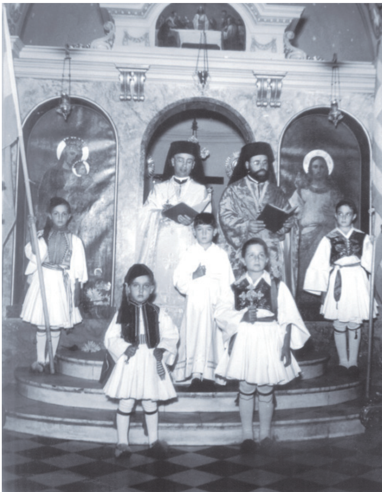
Δοξολογία στη Μητρόπολη.