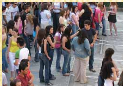
Μαθητές γυμνασίου και λυκείου στη Θεσσαλονίκη