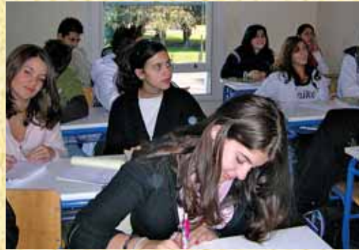
Μαθητές Ελληνικού Γυμνασίου Λονδίνου