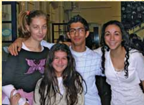
Μαθητές Ελληνικού παρειακού σχολείου