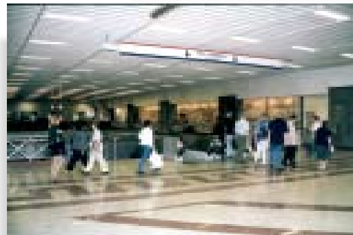
Ο σταθμός του μετρό στο Σύνταγμα