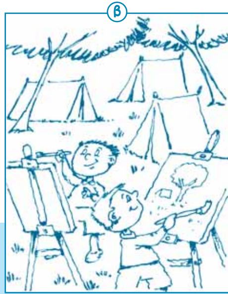
Στην εικόνα β βλέπω