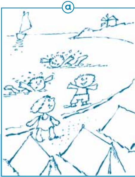
Στην εικόνα α βλέπω