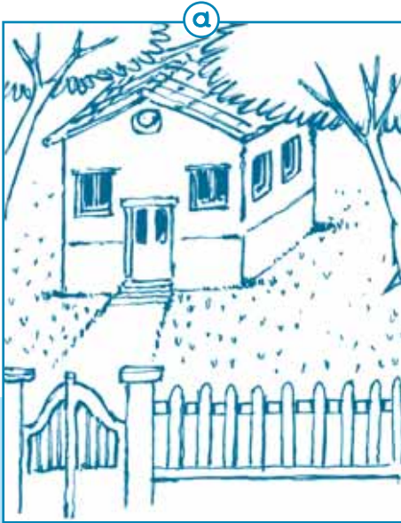
Στην εικόνα α βλέπω