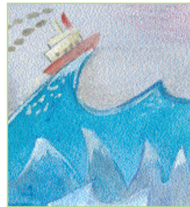
η θάλασσα οι θάλασσες