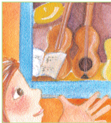
η κιθάρα οι κιθάρες