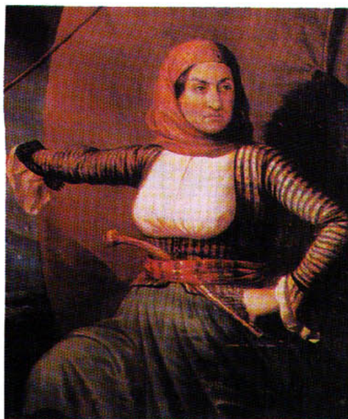
Η Λασκαρίνα Μπουμπουλίνα