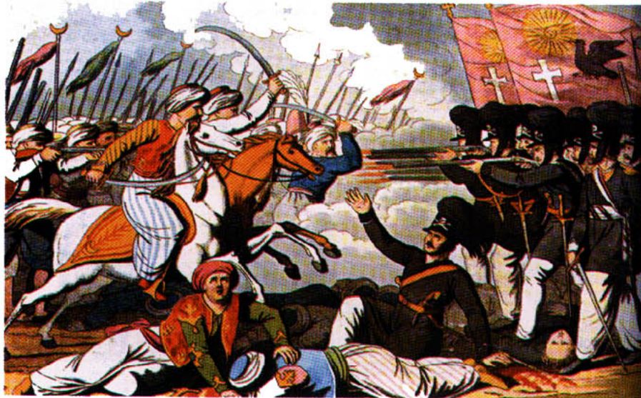
Ο Ιερός Λόχος πολεμά τους Τούρκους στο Δραγατσάνι. [Ιστορία του Ελληνικού Έθνους, Εκδοτική Αθηνών, τ. ΙΒ', σελ. 56]

Τετρακόσια χρόνια σχεδόν η Ελλάδα ήταν σκλαβωμένη στους Τούρκους. Οι Έλληνες, όμως, δεν μπορούσαν να ζήσουν σκλάβοι για πάντα. Τον Μάρτιο του 1821 ξεκίνησαν την επανάσταση. Εφτά ολόκληρα χρόνια πολεμούσαν σε όλα τα μέρη της Ελλάδας και στο τέλος ελευθέρωσαν την πατρίδα.