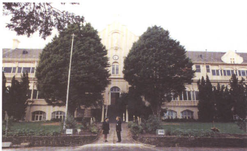
Το Κολλέγιο «Άγιος Ιωάννης» στη Μελβούρνη