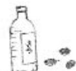
λάδι, ρύζι, ελιές