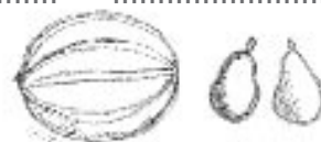
πατάτες, καρπούζια, αχλάδια