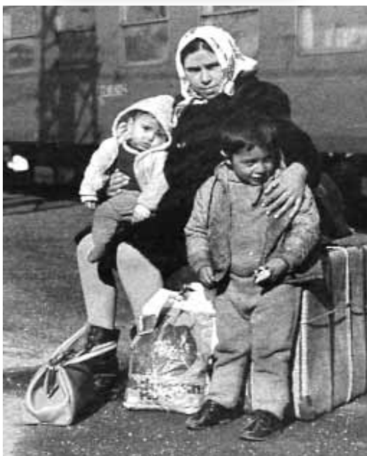
Ελληνίδα μετανάστρια με τα δύο της παιδιά.

-Τουλάχιστον η πολιτική κατάσταση έγινε σταθερή; -Όχι και τόσο γρήγορα.