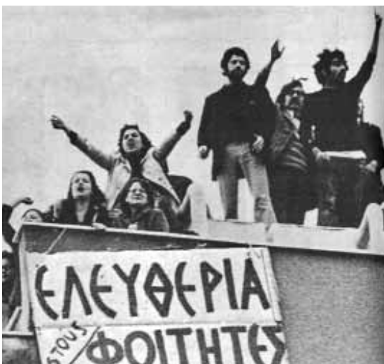
Η κατάληψη της Νομικής Σχολής από τους φοιτητές.

Ζωρζ Σαρή, Τα γενέθλια , σ. 16-18, Κέδρος, Αθήνα 1987.