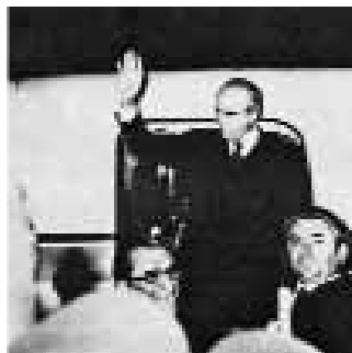
Ο Κ. Καραμανλής κατεβαίνει από το αεροπλάνο, στις 23 Ιουλίου 1974.

-Παιδιά, για δείτε τις εικόνες που σας έφερα. Μπορείτε να διαβάσετε, ποια ήταν τα συνθήματα των φοιτητών, τι ζητούσαν; Διαβάστε τον Δρόμο, ένα από τα τραγουδία των εξεγερμένων φοιτητών; Μπορείτε να βρείτε και άλλα παρόμοια τραγουδία; -Και πότε ακριβώς τέλειωσε η Δικτατορία Δάφνη; -Τι έγινε μετά;