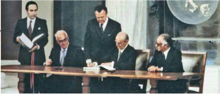
Η υπογραφή της Συμφωνίας ένταξης της Ελλάδας στην Ε.Ο.Κ.