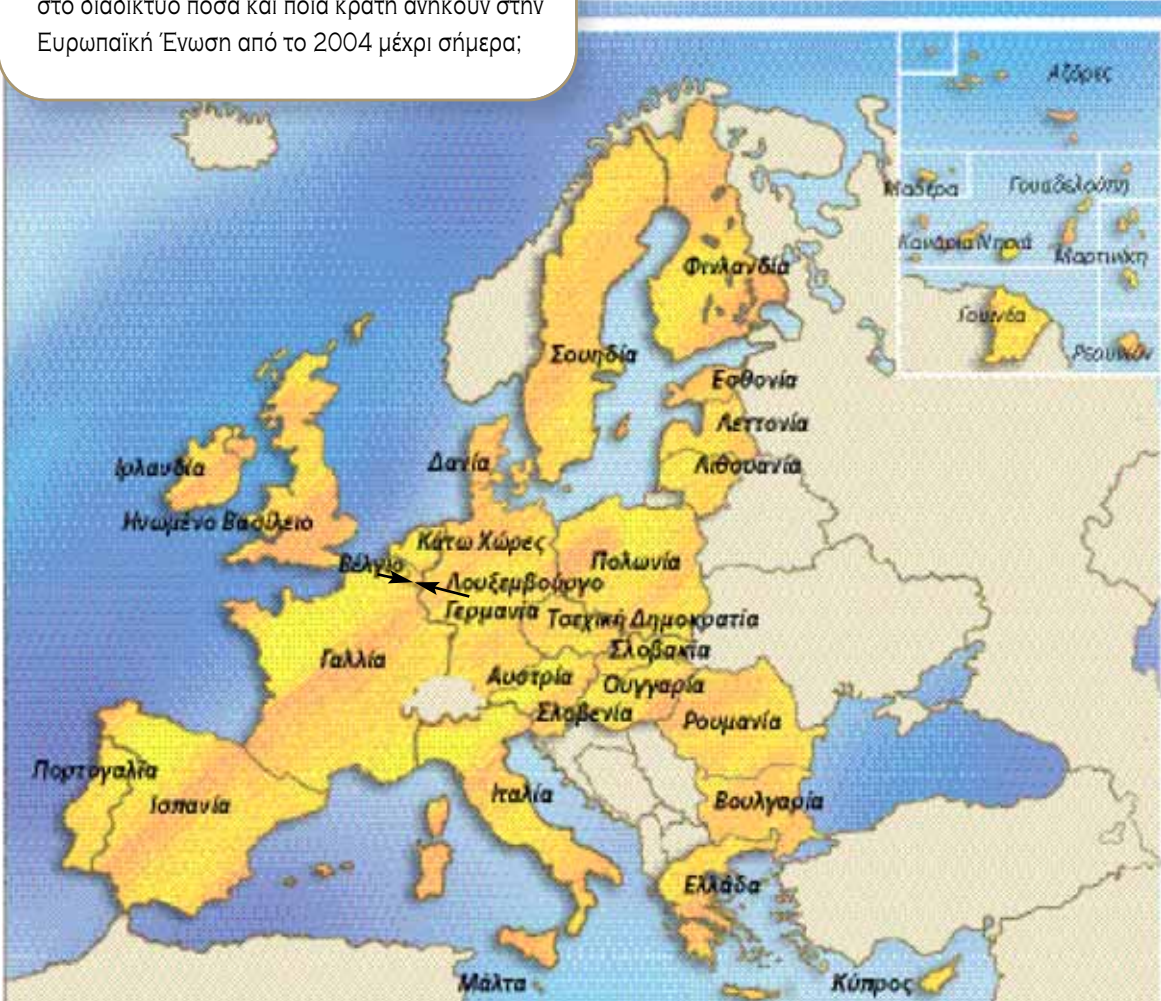
Χάρτης με τα κράτη-μέλη της Ευρωπαϊκής Ένωσης.

-Για δείτε τον χάρτη που σας έφερα και βρείτε στο διαδίκτυο πόσα και ποια κράτη ανήκουν στην Ευρωπαϊκή Ένωση από το 2004 μέχρι σήμερα;