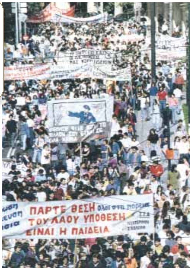
Μαθητικές διαδηλώσεις κατά των νέων αλλαγών στην παιδεία.

-Για να δούμε αυτήν τη φωτογραφία από μια διαδήλωση των μαθητών και των καθηγητών. Ποια ήταν τα συνθήματά τους; -Βρήκα και ένα απόσπασμα από το βιβλίο του Αντώνη Καρακούση, Μετέωρη Χώρα . Θέλετε να διαβάσουμε πώς σχολιάζει ο δημοσιογράφος τα γεγονότα;