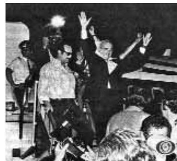
Ο Α. Παπανδρέου επιστρέφει στην Ελλάδα.