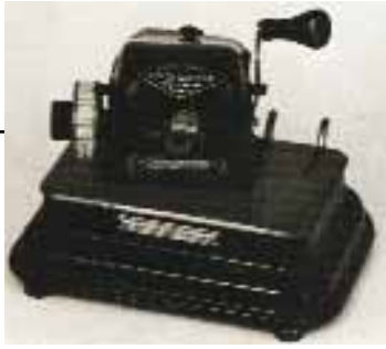
Μηχανή μετατροπής συναλλάγματος.

Ο Α΄ Παγκόσμιος Πόλεμος είχε ως αποτέλεσμα οι ευρωπαϊκές χώρες να αντιμετωπίσουν οικονομικά προβλήματα. Η Αμερική βρήκε την ευκαιρία να παρέμβει στην οικονομία της Ευρώπης, δίνοντας δάνεια στις ενδιαφερόμενες χώρες.