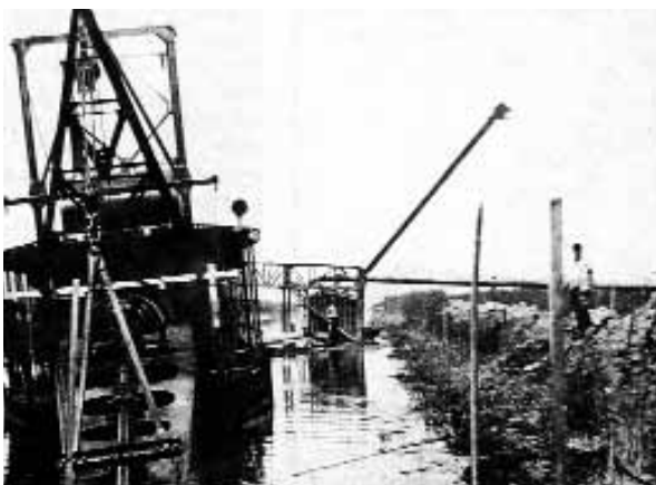
Αποξηραντικά έργα στη Μακεδονία.

-Πήρε και η Ελλάδα δάνειο; Για ποιον λόγο;