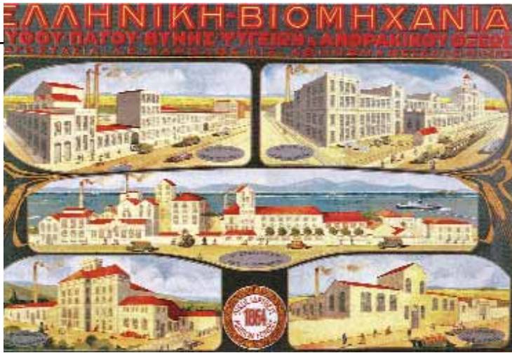
Εργοστάσιο Κάρουλου Φίξ