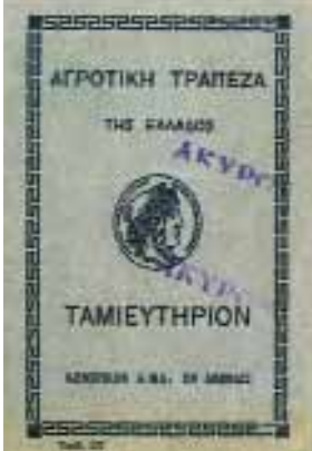
Βιβλιάριο Αγροτικής Τράπεζας.