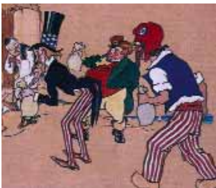
Η γέννηση της δραχμής.