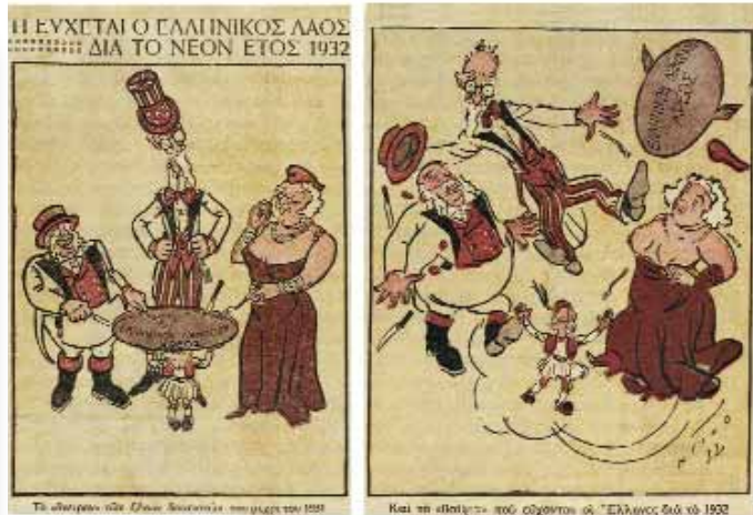
Γελοιογραφίες. Η Ελλάδα και οι δανειστές της.

-Καλά και πώς η οικονομία της Αμερικής γινόταν να επηρεάσει την οικονομία της Ευρώπης και της Ελλάδας γιαγιά; -Για σκεφτείτε τι γίνεται και σήμερα! Δεν είναι δύσκολο! Αν το χρηματιστήριο στην Αμερική ή σε μια μεγάλη ευρωπαϊκή χώρα δεν πηγαίνει καλά, αυτό επηρεάζει την παγκόσμια οικονομία. Ένα άλλο παράδειγμα είναι αυτό με το πετρέλαιο. Ακούτε τι γίνεται με τις τιμές για κάθε βαρέλι. Θέλετε να βρούμε πληροφορίες για να καταλάβουμε πόσο εύκολα επηρεάζεται η παγκόσμια οικονομία. -Και για πες μας, γιαγιά, τι ακριβώς έγινε τότε;