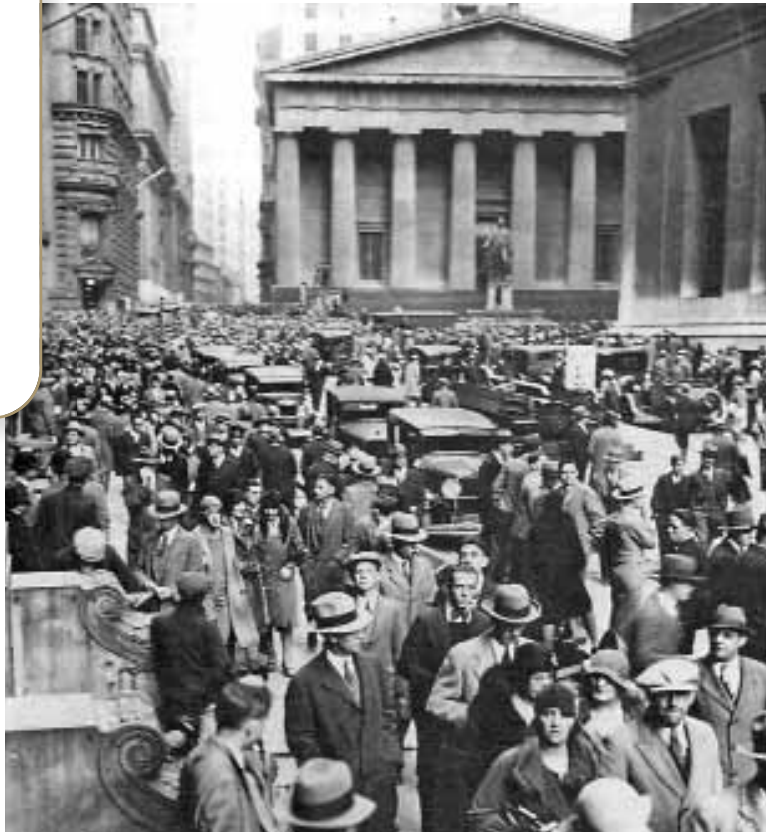
Η Μαύρη Πέμπτη, Μανχάταν, Νέα Υόρκη, 24 Οκτωβρίου 1929.

Το 1828 το αμερικάνικο χρηματιστήριο σημείωσε σημαντική άνοδο. Αυτό το γεγονός οδήγησε πολλούς επενδυτές από όλο τον κόσμο να μεταφέρουν τα κεφάλαιά τους στις Ηνωμένες Πολιτείες (Η.Π.Α.).