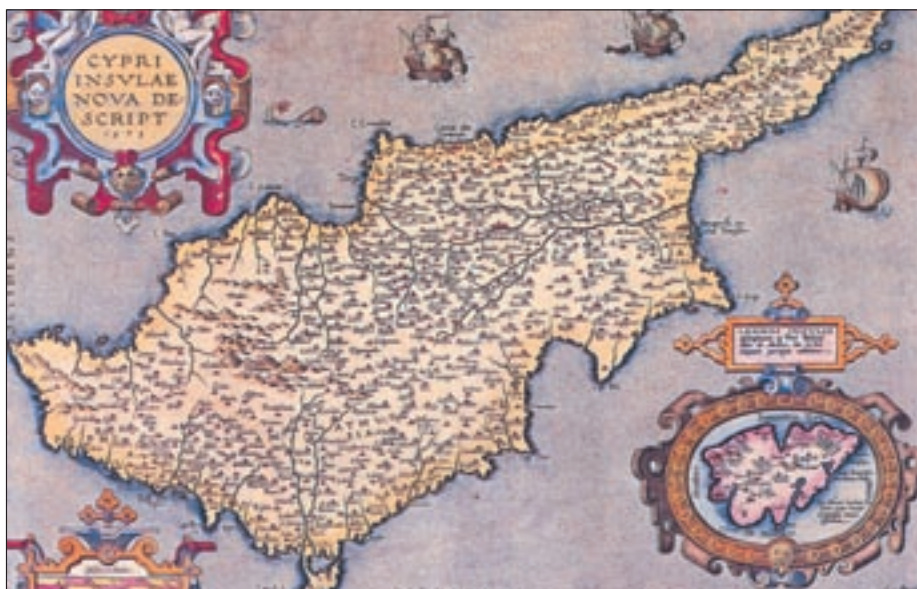
Χάρτης της Κύπρου που περιλαμβάνει και τη Λήμνο μέσα σε έμβλημα, Αμβέρσα 1608.

-Τόσο η Κύπρος όσο και η Κρήτη κατακτήθηκαν στο παρελθόν από τους Τούρκους. Υπάρχουν άραγε κοινά στοιχεία στον τρόπο ζωής (ενδυμασία, ομιλία, ήθη έθιμα) ανάμεσα στους Κύπριους και τους Κρητικούς; Ποια είναι αυτά;