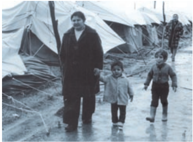
Σκηνή από καταυλισμό Ελληνοκυπρίων που εκδιώχθηκαν από τα σπίτια τους κατά την τουρκική εισβολή στο νησί.

Από το θλιβερό εκείνο καλοκαίρι του 1974 μέχρι σήμερα, η Ελλάδα και η Κύπρος αγωνίζονται ενωμένες για να αποκατασταθεί η αδικία και να επιστρέψουν οι Ελληνοκύπριοι πρόσφυγες στα εδάφη που κατέχουν οι Τούρκοι.