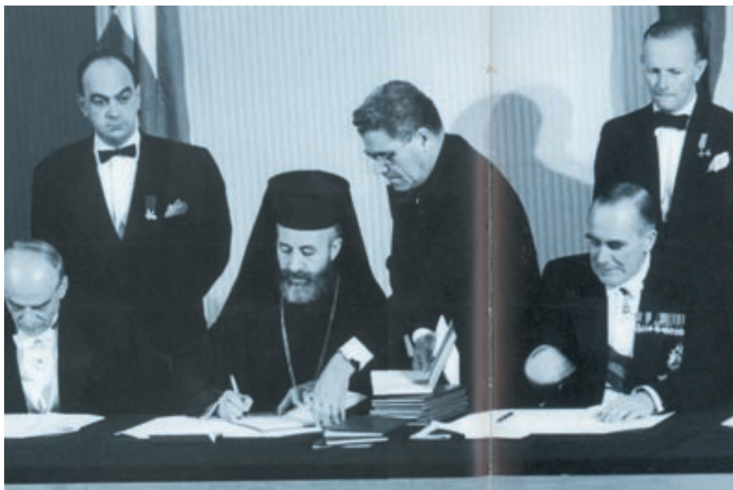
Ο αρχιεπίσκοπος Μακάριος, ο σερ Χιου Φουτ και ο Δρ. Φαζίλ Κουτσούκ υπογράφουν τη συνθήκη ανεξαρτησίας της Κύπρου, 16 Αυγούστου 1960.

οργάνωση Ε.Ο.Κ.Α., της οποίας στρατιωτικός αρχηγός ήταν ο συνταγματάρχης Γεώργιος Γρίβας, με το ψευδώνυμο Διγενής. Ο ένοπλος αγώνας κράτησε 4 χρόνια και κατάληξή του ήταν οι συμφωνίες της Ζυρίχης και του Λονδίνου, με τις οποίες η Κύπρος έγινε ανεξάρτητο κράτος. Η αγγλική κατοχή τερματίστηκε επίσημα στις 16 Αυγούστου 1960 με την παράδοση της εξουσίας από τον σερ Χιου Φουτ, τελευταίο Άγγλο κυβερνήτη, στον αρχιεπίσκοπο Μακάριο, πρώτο Κύπριο πρόεδρο. Η συμφωνία προέβλεπε τη χωριστή ψηφοφορία των δυο κοινοτήτων της Κύπρου (Ελληνοκυπρίων, Τουρκοκυπρίων), τη χωριστή στρατιωτική δύναμη Ελλήνων και Τούρκων και την ύπαρξη εγγυητριών κρατών (Ελλάδας, Τουρκίας, Ηνωμένου Βασιλείου). Αυτές οι διατάξεις της συμφωνίας χρησιμοποιήθηκαν στη συνέχεια από αυτές τις δυνάμεις που επεδίωκαν την διχοτόμηση της Κύπρου.