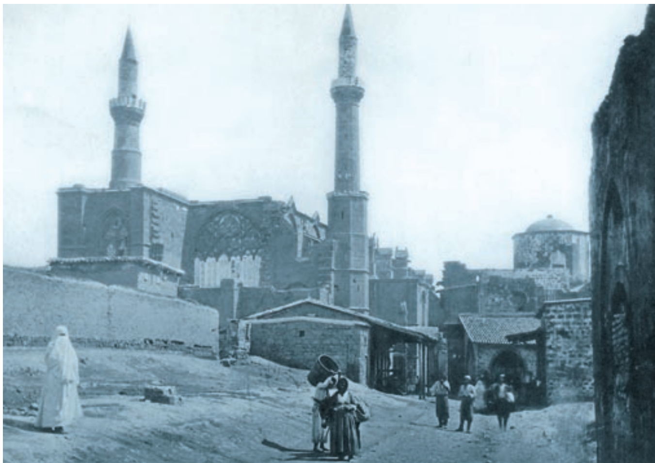
Η Λευκωσία στα 1878.