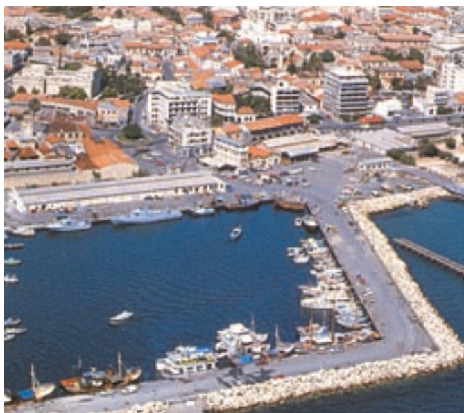
Εικόνα από λιμάνι της Κύπρου σήμερα.

Οι ενταξιακές διαπραγματεύσεις της Κύπρου με την Ε.Ε. προχώρησαν με ταχύτατους ρυθμούς και ολοκληρώθηκαν στο Ευρωπαϊκό Συμβούλιο της Κοπεγχάγης. Στις 16 Απριλίου 2003 στην Αθήνα υπογράφηκε η συνθήκη προσχώρησης και η Κύπρος από την 1η Μαΐου 2004 είναι πλήρες κράτος - μέλος της Ευρωπαϊκής Ένωσης.