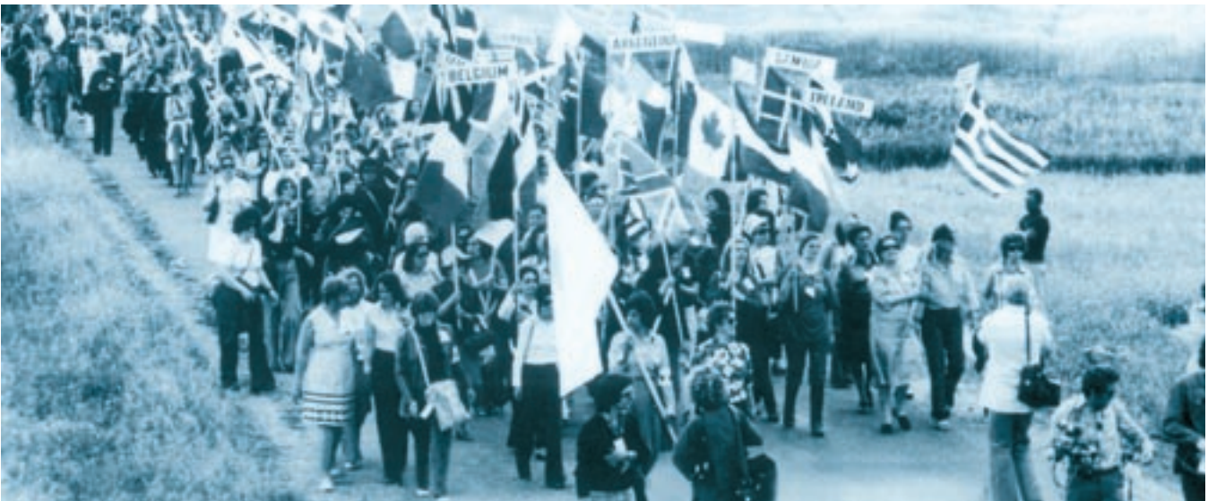
Η πρώτη πορεία γυναικών στην Κύπρο κατά της τουρκικής κατοχής. Στην πορεία αυτή έλαβαν μέρος αντιπροσωπείες γυναικών από 115 χώρες.

-Οργανώστε μια έκθεση μνήμης για την τουρκική εισβολή στην Κύπρο. Συλλέξτε φωτογραφικό υλικό, αποσπάσματα από εφημερίδες και περιοδικά.