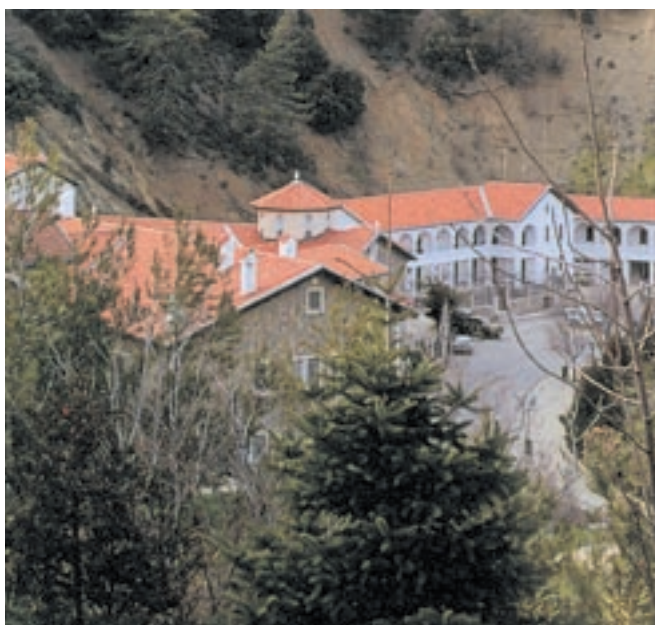
Το ιστορικό μοναστήρι Κύκκου.

Στα χρόνια της Τουρκοκρατίας η Κύπρος κρατήθηκε μακριά από τις εξελίξεις και την πρόοδο που σημειώθηκε στην Ευρώπη. Το μεγαλύτερο μέρος του πληθυσμού ασχολούνταν με τη γεωργία, την κτηνοτροφία και τη βιοτεχνία. Οι συνθήκες ζωής ήταν πολύ δύσκολες στα χρόνια εκείνα και οι Κύπριοι έμαθαν να επιβιώνουν και να αρκούνται μόνο σε όσα είχαν και παρήγαγαν οι ίδιοι. Ορισμένες από τις καθημερινές ασχολίες των Κυπρίων ήταν η εκτροφή του μεταξοσκώληκα, η καλαθοπλεκτική και η βυρσοδεψία. Μάλιστα υπήρχαν πολλοί λαϊκοί τεχνίτες (καρεκλάς, τσαγκάρης, παπλωματάς) οι οποίοι περιφέρονταν και πρόσφεραν τις υπηρεσίες τους.