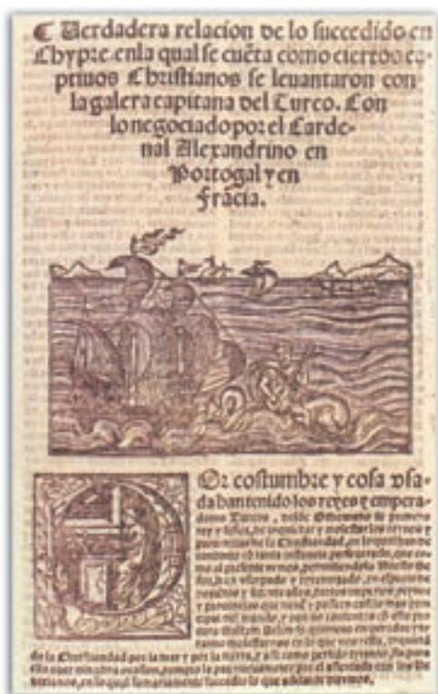
Αναφορά που εκδόθηκε στην Ισπανία ένα χρόνο μετά την κατάκτηση της Κύπρου από τους Τούρκους και περιγράφει τα διάφορα περιστατικά του «Πολέμου της Κύπρου», 1572.

Η Κύπρος κατακτήθηκε από τους Τούρκους το 1570-71, στα χρόνια του σουλτάνου Σελίμ Β'. Οι λόγοι που οδήγησαν τους Οθωμανούς να κυριεύσουν την Κύπρο ήταν πολλοί, κυρίως οικονομικοί και πολιτικοί (διαμάχη με τους Βενετούς). Κάποιοι άλλοι λένε ότι ο Σελίμ Β', στον οποίο δόθηκε το επίθετο Σαχρός (=Μέθυσος), είχε αποφασίσει να κατακτήσει την Κύπρο εξαιτίας της μεγάλης φήμης των ωραίων κρασιών της.