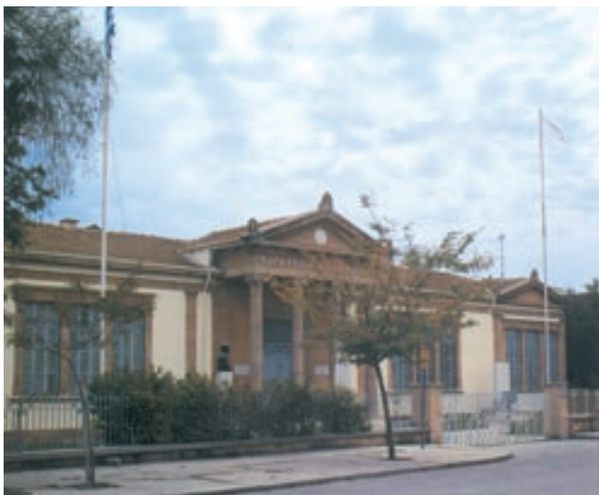
Το Παγκύπριο Γυμνάσιο.

Η οικονομία της Κύπρου σε όλη την περίοδο της αγγλοκρατίας βασιζόταν στη γεωργία. Κύρια προϊόντα παραγωγής ήταν τα δημητριακά, τα εσπεριδοειδή, τα χαρούπια, το κρασί, το μαλλί, το μετάξι και σε λιγότερες ποσότητες ο καπνός και το βαμβάκι. Κατά την περίοδο εκείνη άρχισε και η εκμετάλλευση του ορυκτού πλούτου.