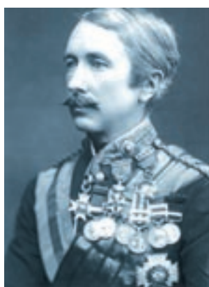
Σερ Γκάρνελ Γούλσλυ, 1833-1913.