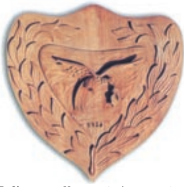
Έμβλημα της Κυπριακής Δημοκρατίας.