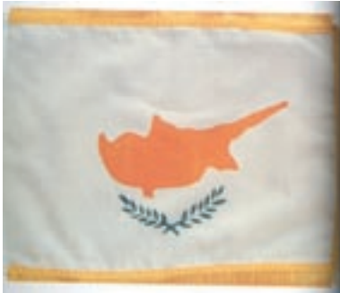
Η σημαία της Κυπριακής Δημοκρατίας.