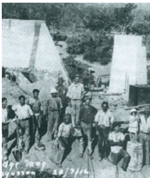
Φωτογραφία εργατών που κατασκεύαζαν γέφυρα στην Αυστραλία. Οι περισσότεροι από αυτούς ήταν μετανάστες από τη Μάλτα και το Καστελόριζο.