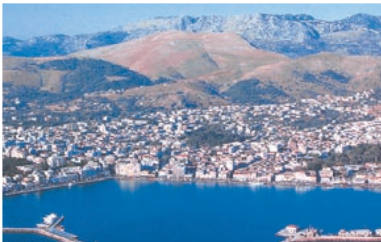
Η πόλη της Χίου από τον αέρα.

Ο Κωνσταντίνος Καραθεοδωρής (1873-1950) είναι ένας από τους μεγαλύτερους μαθηματικούς του 20ου αιώνα. Συνεργάστηκε με τον Αϊνστάιν και άλλους μεγάλους επιστήμονες. Του ανατέθηκε από το Βενιζέλο η οργάνωση του Πανεπιστημίου της Σμύρνης, όμως τα σχέδια του δεν μπόρεσαν να υλοποιηθούν εξαιτίας της Μικρασιατικής Καταστροφής του 1922.