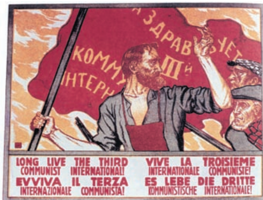
Αφίσα της Κομμουνιστικής Διεθνούς.

Το 1909 στη Θεσσαλονίκη ιδρύθηκε η «Σοσιαλιστική Εργατική Ομοσπονδία» (Φεντερασιόν) που επιχείρησε να οργανώσει τον αγώνα εργατών διαφορετικών εθνοτήτων για τα κοινωνικά δικαιώματά τους. Σε μια εποχή που κυριαρχούσε ο εθνικισμός, αυτή η οργάνωση προσπάθησε να δώσει ένα διεθνιστικό στίγμα. Ηγετική φυσιογνωμία της Φεντερασιόν ήταν ο εβραϊκής καταγωγής Αβραάμ Μπεναρόγια.