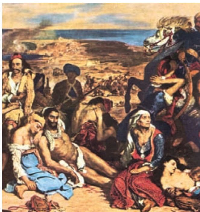
«Η σφαγή της Χίου» του Ευγένιου Ντελακρουά.

Τον Μάρτη του 1922 πατριώτες από την Σάμο αποβιβάστηκαν στην Χίο και κήρυξαν την επανάσταση στο νησί. Οι Τούρκοι αιφνιδιάστηκαν και υποχώρησαν στο κάστρο. Ο τουρκικός στόλος με επικεφαλής τον Καρά Αλή κατευθύνθηκε προς το νησί για να τιμωρήσει τους επαναστάτες. Η εξέγερση πνίγηκε στο αίμα. Τα τουρκικά στρατεύματα έσφαξαν 27.000 ανθρώπους, ενώ χιλιάδες ακόμη πουλήθηκαν στα σκλαβοπάζαρα της Ανατολής. Το νησί ερημώθηκε. Η καταστροφή της Χίου προκάλεσε την κατακραυγή εναντίον της Οθωμανικής αυτοκρατορίας και ισχυροποίησε τα φιλελληνικά αισθήματα στην Ευρώπη. Ο Βίκτορας Ουγκώ έγραψε: «Η Χίος τ' όμορφο νησί μαύρη απομένει ξέρα...». Ο Γάλλος Ευγένιος Ντελακρουά απεικόνισε τα γεγονότα σε έναν πίνακα ζωγραφικής.