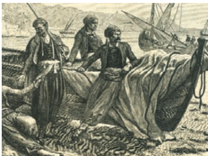
Οι κάτοικοι του Καστελόριζου γιορτάζουν την ενσωμάτωση του νησιού στην Ελλάδα.