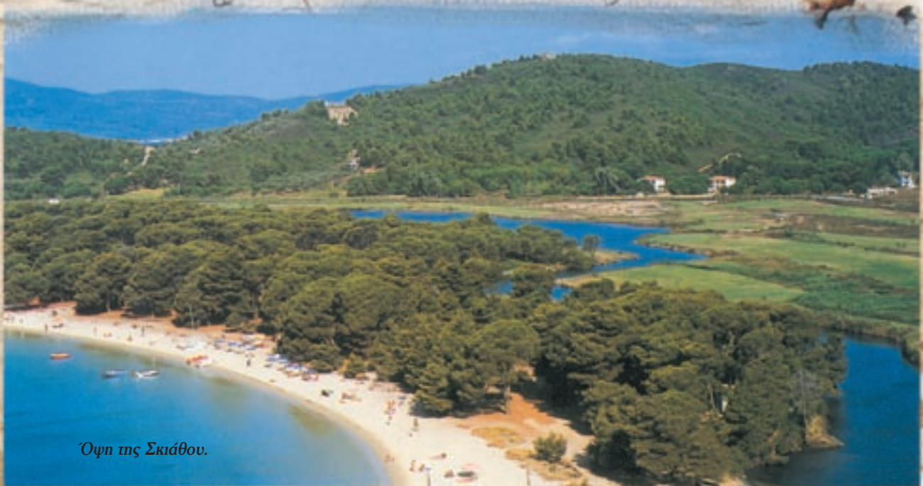
Όψη της Σκιάθου.

υπογράφηκε το Πρωτόκολλο του Λονδίνου και οι Σποράδες απελευθερώθηκαν. Η Σκιάθος είναι το νησί του Παπαδιαμάντη, του συγγραφέα της «Γυφτοπούλας», της «Φόνισσας», του «Φτωχού Άγιου» και πολλών άλλων έργων. Σήμερα, το σπίτι του λειτουργεί ως μουσείο, όπου μπορεί κανείς να θαυμάσει τα προσωπικά του αντικείμενα, να περιεργαστεί το χώρο όπου δούλεψε και να αναστοχαστεί για τη ζωή και το έργο του.