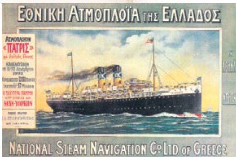
Διαφημιστικό του υπερωκεανίου «Πατρίς».

Η Κως είναι ένα πανέμορφο νησί των Δωδεκανήσων με πλούσιους φυσικούς πόρους. Διαθέτει πολλά νερά, πολύ καλές αλυκές, ιαματικές πηγές, κ.λπ. Όμως αυτοί οι πόροι σε μικρό μόνο βαθμό αξιοποιήθηκαν. Την περίοδο 1951 - 1971