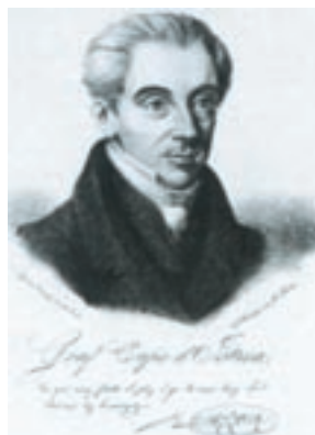
Ο Ιωάννης Καποδίστριας.

«Είδα πολλά εις την ζωήν μου, αλλά σαν το θέαμα όταν έφθασα εδώ εις την Αίγιναν, δεν είδα τι παρόμοιον ποτέ, και άλλος να μην το ιδεί... Ζήτη ο κυβερνήτης, ο σωτήρας μας, ο ελευθερωτής μας, εφώναζαν γυναίκες, αναμαλλιάρηδες άνδρες με λαβωματιές πολέμου, ορφανόγδουτα, κατεβασμένα από τις σπηλιές. Δεν ήτο το συναπάντημά μου φωνή χαράς, αλλά θρήνος. Η γη εβρέχετο από δάκρυα. Εβρέχετο η μυρτιά και η