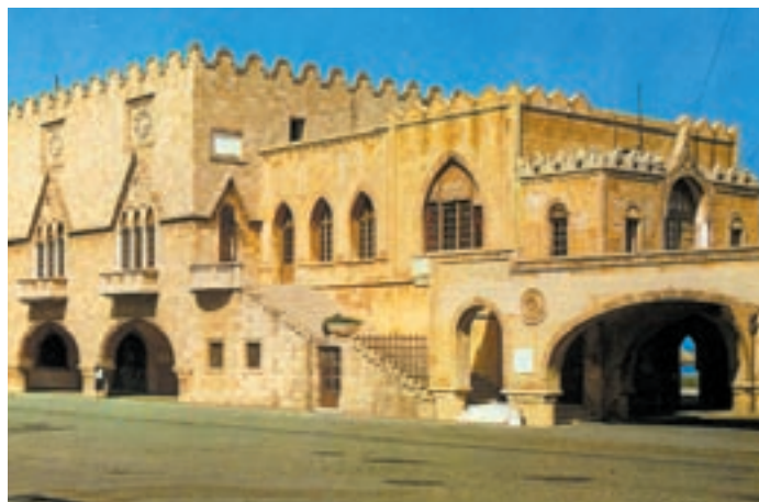
Το κτίριο διοίκησης της Ρόδου κατά τη διάρκεια της Ιταλικής κατοχής.

Το ψάρεμα και το εμπόριο των σφουγγαριών γινόταν στην Κάλυμνο, τη Χάλκη και τη Σύμη. Στη φωτογραφία Έλληνες σφουγγαράδες. Αθήνα, Γεννάδιος Βιβλιοθήκη.