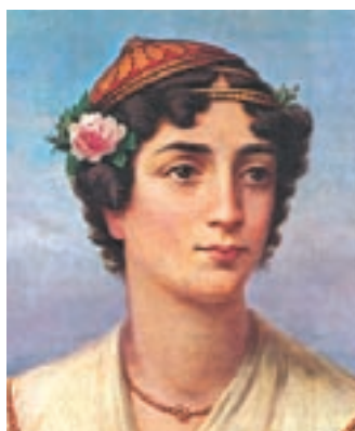
Η Μαντώ Μαυρογένους.

Η δόξα των Ψαρών, έργο του Ν. Γύζη, Αθήνα, ιδιωτική συλλογή.