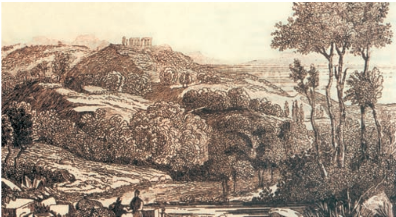
Η Αίγινα σε χαλκογραφία.

Η Αίγινα, το όμορφο αυτό νησί του Αργοσαρωνικού, βρίσκεται σε απόσταση αναπνοής από τον Πειραιά. Το σημερινό λιμάνι της Αίγινας βρίσκεται στο ίδιο μέρος που ήταν το αρχαίο εμπορικό λιμάνι του νησιού. Αυτό το μικρό νησί από τις 12 Ιανουαρίου 1828 έγινε η προσωρινή πρωτεύουσα του νεοελληνικού κράτους με επικεφαλής τον Ιωάννη Καποδίστρια.