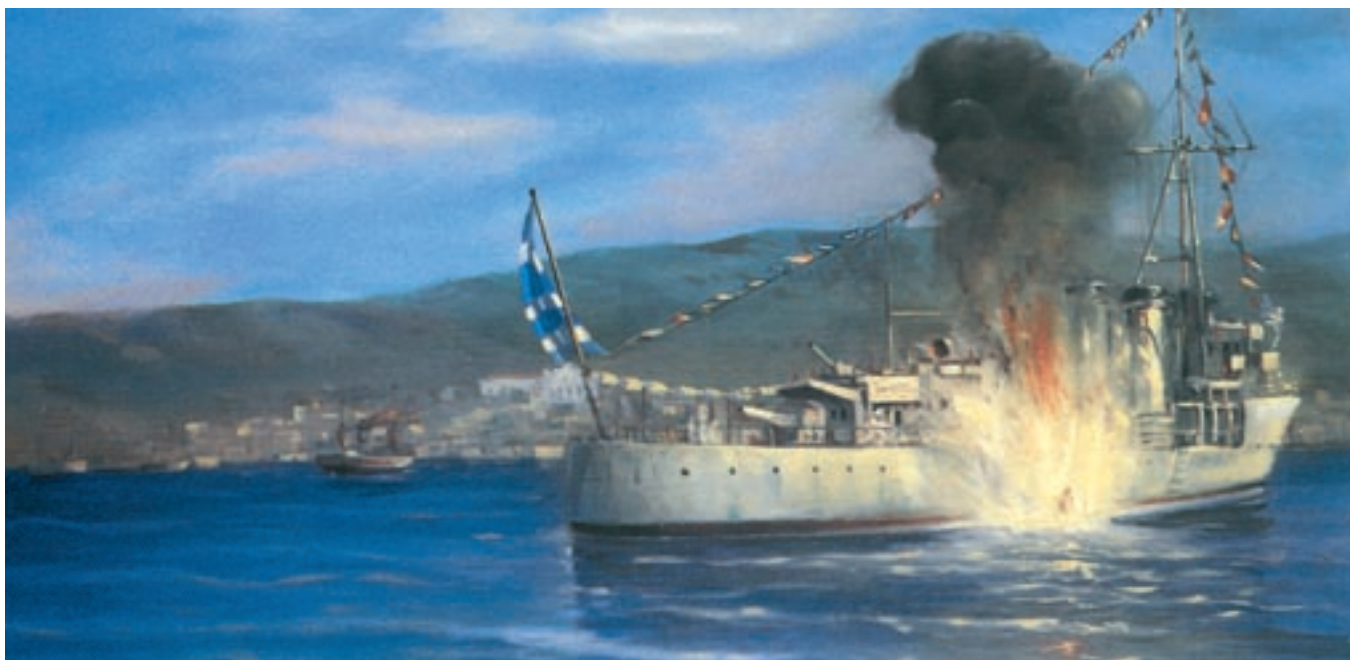
Πίνακας που εικονίζει τον τορπιλισμό της «Έλλης» στο λιμάνι της Τήνου.

Ι. Μεταξάς, από το αρχείο Κ. Μανιαδάκη, Ιστορία της Εθνικής Αντίστασης 1940-1945.