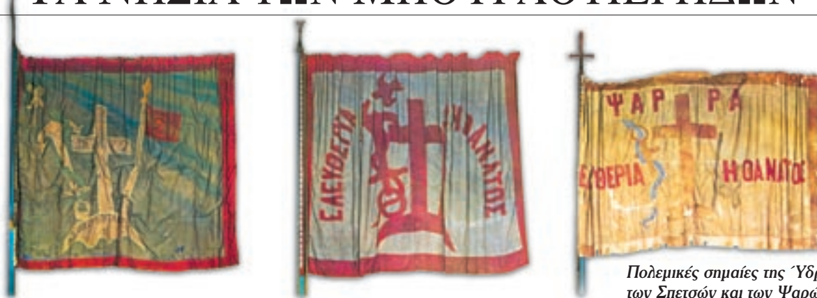
Πολεμικές σημαίες της Ύδρας, των Σπετσών και των Ψαρών.

Τα Ψαρά ήταν από τα πρώτα νησιά μαζί με τις Σπέτσες και την Ύδρα, που ξεσηκώθηκαν εναντίον των Τούρκων. Ο στόλος των Ψαρών, με τους γνωστούς μπουρλοτιέρηδες Κανάρη, Παπανικολή και Πιπίνο, έγινε ο φόβος και ο τρόμος των Τούρκων. Το 1824 οι Τούρκοι επιτέθηκαν με 140 καράβια και 1400 γενίτσαρους.