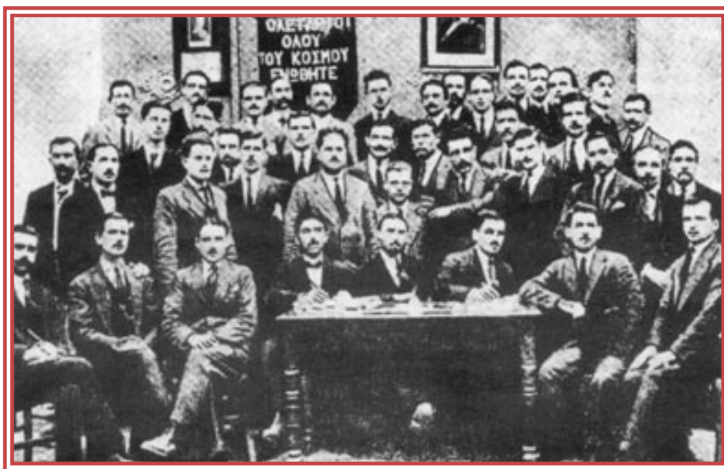
Το δεύτερο συνέδριο του ΣΕΚΕ, Απρίλιος 1920.

(Α. Μπεναρόγια, Η πρώτη σταδιοδρομία του Ελληνικού προλεταριάτου. Αθήνα, 121).