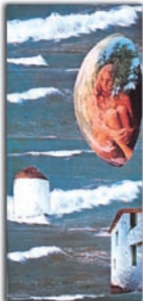
Εικονιστική σύνθεση του Οδυσσέα Ελύτη.

Η Λέσβος δεν είναι μόνο το νησί του Αλκαίου και της Σαπφούς, αλλά και του Οδυσσέα Ελύτη, του Στρατή Μυριβίλη, του Αργύρη Εφταλιώτη, του