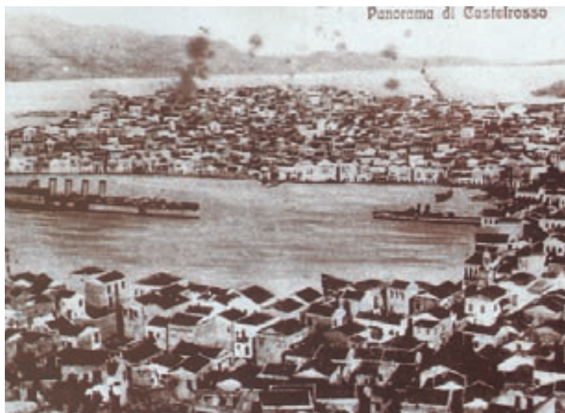
Καστελόριζο. Στην κάτω φωτογραφία φαίνονται τα νεοκλασικά αρχοντόσπιτα σε άλλες εποχές όταν το εμπόριο και η ναυτιλία ήταν σε άνθιση και το νησί ήταν γεμάτο κατοίκους. Στην πάνω φωτογραφία φαίνεται μεταγενέστερα ο γυμνός λόφος όπου άλλοτε υπήρχε μια πυκνοκατοικημένη γειτονιά.

-Πώς αντιμετωπίζονταν οι πρώτοι Έλληνες μετανάστες στις χώρες υποδοχής; Τι άλλαξε με το χρόνο στην αντιμετώπισή τους.