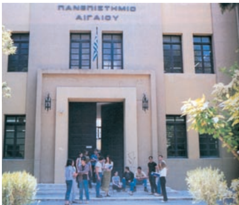
Το Πανεπιστήμιο Αιγαίου στη Ρόδο σήμερα.