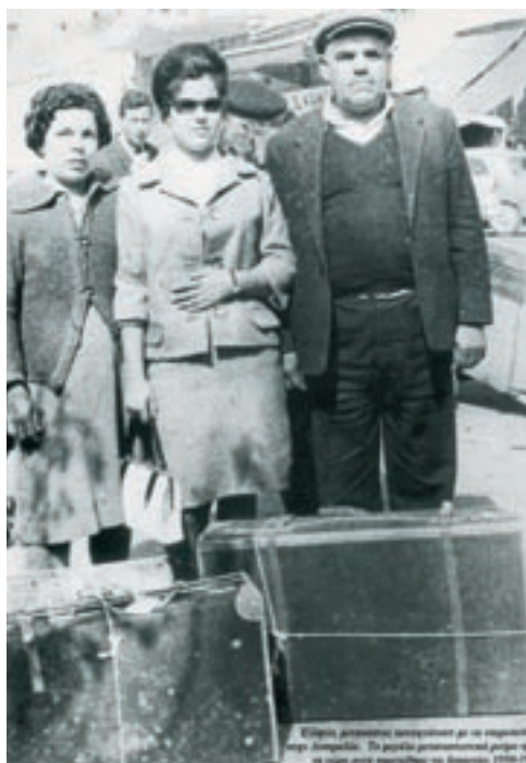
Έλληνες μετανάστες φτάνουν με υπερωκεάνιο στην Αυστραλία.

Στις μέρες μας οι οικονομικές δραστηριότητες μεταφέρονται σταδιακά από τον πρωτογενή στον τριτογενή τομέα της οικονομίας: από την καλλιέργεια της γης κυρίως στο εμπόριο και στον τουρισμό. Πολλοί κάτοικοι εργάζονται το καλοκαίρι στον τουρισμό, ενώ το χειμώνα μένουν στις πόλεις.