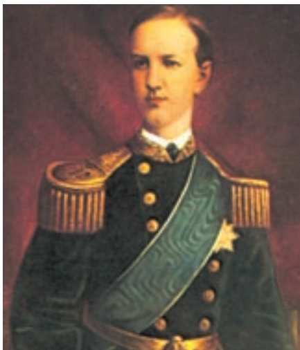
Γεωργίος Α', Αθήνα, Εθνικό Ιστορικό Μουσείο.