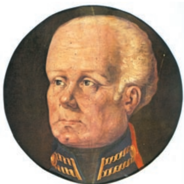
Ο στρατηγός Θωμάς Μαίτλαντ, διοικητής των βρετανικών δυνάμεων της Μεσογείου, ήταν ο πρώτος αρμοστής στα Ιόνια νησιά.

Μ' όλο που' ναι αλυσωμένο Το καθένα τεχνικά Κ' εις το μέτωπο γραμμένο Έχει «ψεύτρα ελευθεριά».