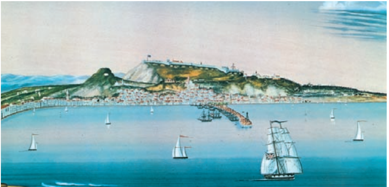
Το Βαθύ της Ιθάκης στα τέλη του 18ου αιώνα.

Το 1800 υπογράφηκε συνθήκη ανάμεσα σε Ρωσία και Τουρκία και αποφασίστηκε η ίδρυση της Επτανησιακής Πολιτείας. Η «Πολιτεία των Επτά Ηνωμένων Νήσων» ήταν το πρώτο ελεύθερο ελληνικό κράτος. Όμως η Πολιτεία έπρεπε κάθε χρόνο να πληρώνει βαρύ φόρο στην Τουρκία. Η σύντομη ιστορία της «Επτανησιακής Πολιτείας» τελείωσε με την υπογραφή της συνθήκης του Τιλσίτ μεταξύ Γαλλίας και Ρωσίας, τον Ιούλιο του 1806, και την αποβίβαση των γαλλικών στρατευμάτων στα Ιόνια νησιά.