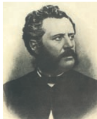
Ο Αριστοτέλης Βαλαωρίτης.

Σημαντικό γεγονός για την ανάπτυξη της μουσικής παιδείας των Επτανησίων αποτέλεσε η ίδρυση της Φιλαρμονικής Εταιρίας Κερκύρας το 1840 από τον Νικόλαο Χαλικιόπουλο Μάνταρο (1795-1872). Ο σπουδαίος αυτός συνθέτης και δάσκαλος της μουσικής, μετά τις σπουδές του στην Ιταλία, επέστρεψε στην Κέρκυρα και συνέβαλε στη διαμόρφωση της ελληνικής μουσικής. Ο Μάνταρος μελοποίησε τον «Ύμνον εις την ελευθερία» του Δ. Σολωμού, που ανακηρύχθηκε το 1865 σε Εθνικό Ύμνο της Ελλάδας.