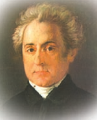
Ο Διονύσιος Σολωμός.

Ο Διονύσιος Σολωμός ήταν ο κορυφαίος ποιητής της επαναστατικής σχολής. Γεννήθηκε στη Ζάκυνθο το 1798. Σπούδασε στην Ιταλία νομικά και ήρθε σε επαφή με τα πνευματικά ρεύματα του καιρού του.