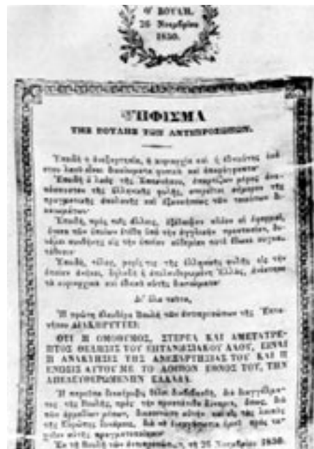
Ψήφισμα της 26ης Νοεμβρίου 1850 της Θ' Βουλής των Αντιπροσώπων του Ιονίου Κράτους.