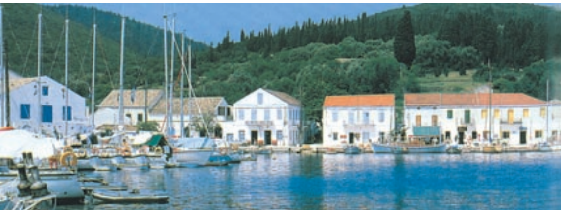
Παραδοσιακό χωριό της Κεφαλονιάς.