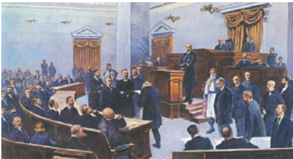
Αναπαράσταση συνεδριάσεως της Βουλής του 1887-1890.

Στις νέες αυτές συνθήκες που δημιουργήθηκαν σημαντικός ήταν ο ρόλος των Επτανήσιων βουλευτών. Οι ριζοσπάστες βουλευτές που μπήκαν στην ελληνική βουλή από το 1864 συνεργάστηκαν με τον δημοκράτη πολιτικό Επαμεινώνδα Δεληγεώργη και τους υποστηρικτές του για την ψήφιση του συντάγματος του 1864. Το Σύνταγμα περιόριζε την εξουσία του βασιλιά, καθιέρωνε την βασιλευόμενη δημοκρατία, την καθολική ψήφο (εκτός των γυναικών) και την ελευθεροτυπία. Το 1875, ο Χαρίλαος Τρικούπης ενίσχυσε ακόμα περισσότερο την εξουσία του κοινοβουλίου: ο βασιλιάς ήταν υποχρεωμένος να διορίζει πρωθυπουργό τον αρχηγό του κόμματος που είχε την πλειοψηφία στην βουλή.