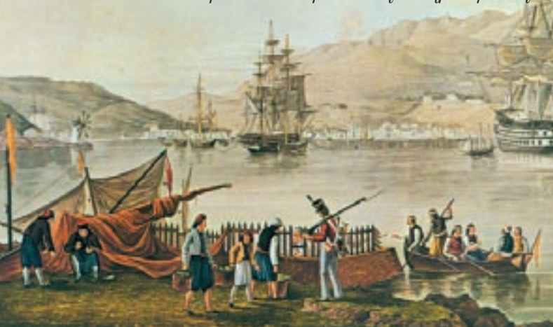
Σκηνή από εμπορικές αγοραπωλησίες στην Ιθάκη στις αρχές του 19ου αιώνα.

Για να πομπεύει τόνομα και την κληρονομιά της».