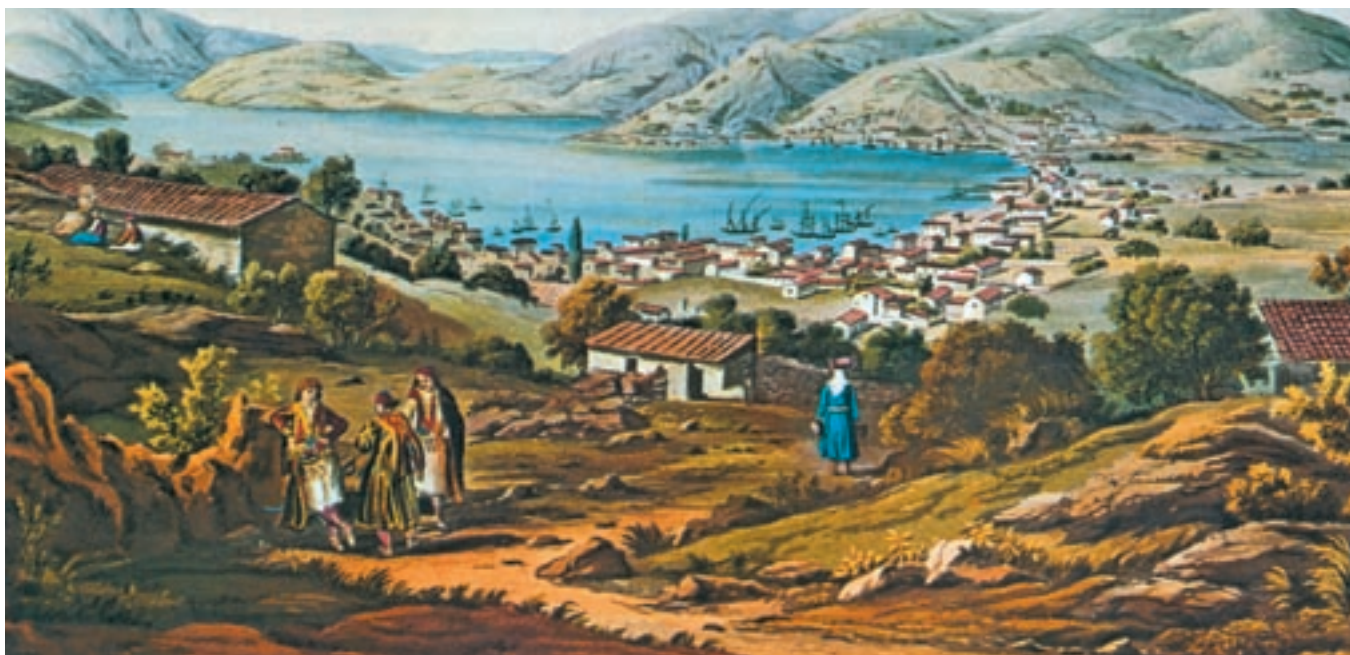
Εικόνα της Ζακύνθου στις αρχές του 19ου αιώνα.

Μετά την ήττα του Ναπολέοντα, οι Άγγλοι καταλαμβάνουν τα Ιόνια νησιά. Τον Ιούνιο του 1814 υψώνεται στα φρούρια της Κέρκυρας η Αγγλική σημαία, ενώ με τη συνθήκη των Παρισίων, το Νοέμβριο του 1815, τα νησιά πέρασαν στην «Προστασία» της Αγγλίας.