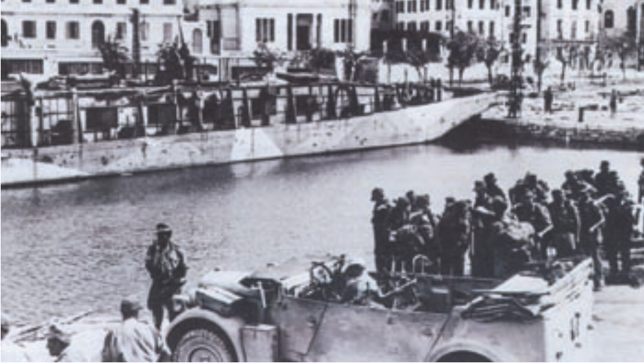
Γερμανικά στρατεύματα στην Κέρκυρα.

Το Σεπτέμβριο του 1943 οι Ιταλοί αντιφασίστες της Ιταλικής Μεραρχίας AQUI αρνήθηκαν να παραδώσουν τα όπλα στους Γερμανούς και ενώθηκαν με τις ελληνικές αντιστασιακές οργανώσεις. Οι Γερμανοί αντέδρασαν και εκτέλεσαν περίπου 9.000 στρατιώτες της Μεραρχίας AQUI. Σημαντικά γεγονότα της ιστορίας, όπως το παραπάνω, έχουν μεταφερθεί κατά καιρούς στη