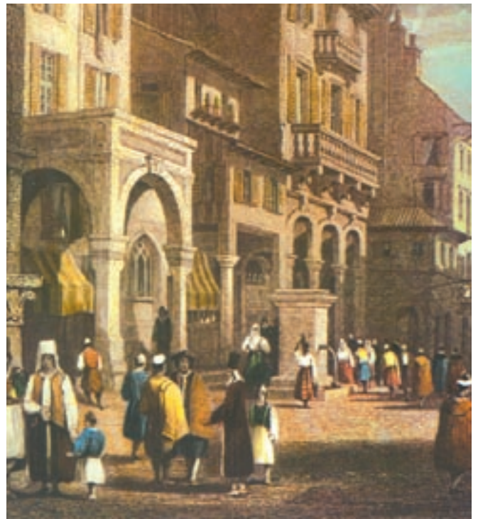
Η Κέρκυρα το 19ο αιώνα, συλλογή Μ. Αρώνη. Αθήνα, φωτ. αρχείο Εστίας Ν. Σμύρνης.