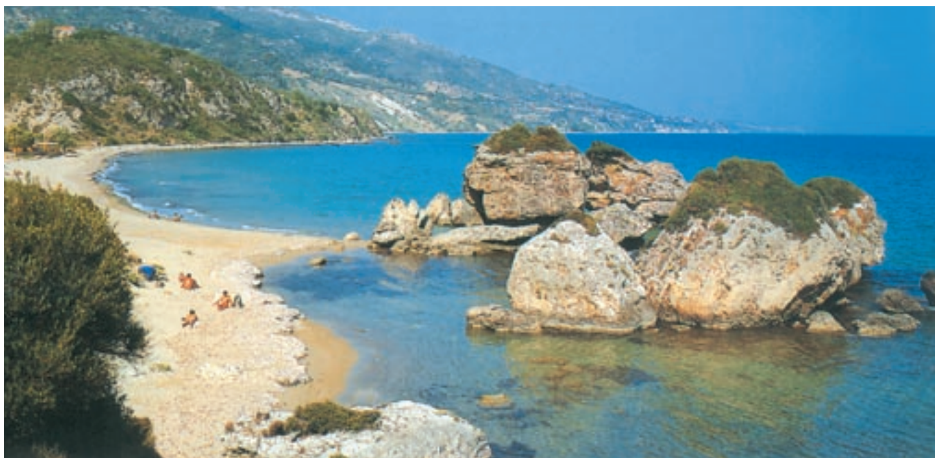
Παραλία της Ζακύνθου.

Άλλα σπουδαία ποιήματά του είναι το «Εις τον θάνατον του Λορδ Μπάιρον» (1824), «Η Καταστροφή των Ψαρών», «Ο Λάμπρος» (1823) και οι «Ελεύθεροι Πολιορκημένοι» (1826). Το 1828 ο Δ. Σολωμός πήγε στην Κέρκυρα όπου παρέμεινε μέχρι το θάνατό του, το 1857. Ο τάφος του βρίσκεται στη γενέτειρά του, το νησί που αγάπησε.