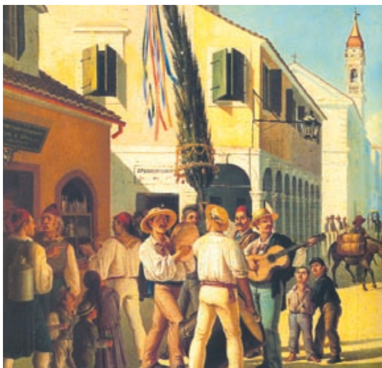
Πρωτομαγιά στην Κέρκυρα, Εθνική Πανακοθήκη, 1878-1880.

Σημαντικό ρόλο για την ανάπτυξη της παιδείας και του πολιτισμού όχι μόνο στα Επτάνησα, αλλά σ' ολόκληρη την Ελλάδα, διαδραμάτισε η Επτανησιακή σχολή. Ο Διονύσιος Σολωμός, ο Ανδρέας Κάλβος (1792-1869), ο Ιάκωβος Πολυλάς (1825-1896), ο Γεράσιμος Μαρκοράς (1826-1911) και ο Αριστοτέλης Βαλαωρίτης (1824-1879) είναι οι σημαντικότεροι εκπρόσωποί της. Οι ποιητές της Επτανησιακής Σχολής έγραφαν στη δημοτική γλώσσα απορρίπτοντας την αρχαϊζουσα γλώσσα που επικρατούσε εκείνη την εποχή στην Αθήνα. Πηγή της έμπνευσής τους ήταν οι εθνικοί και κοινωνικοί αγώνες, αλλά και τα προβλήματα της καθημερινής ζωής του ελληνικού λαού.