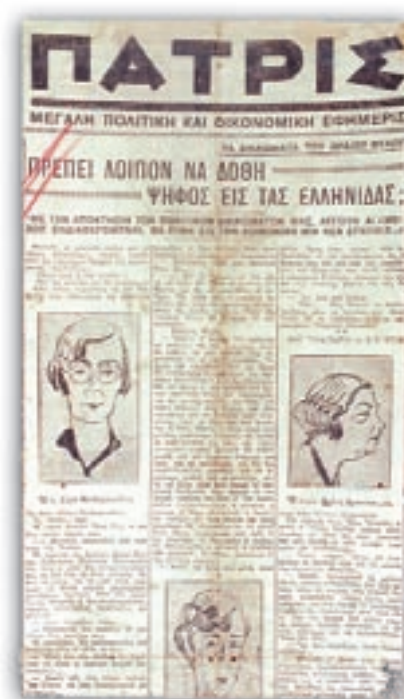
Η εφημερίδα «Πατρίς», 1η Φεβρουαρίου 1929.