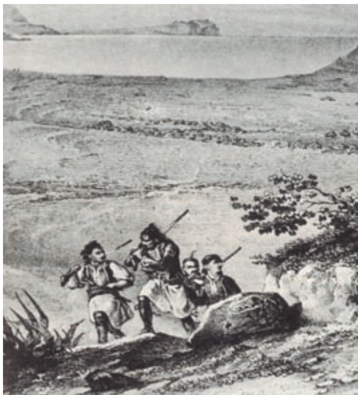
Έλληνες Κλέφτες και Αρματολοί, Αθήνα, Γεννάδειος βιβλιοθήκη.

Δυστυχώς, οι περισσότερες πόλεις της Θεσσαλίας δεν είχαν τα ίδια προνόμια. Αντίθετα, είχαν Τούρκους διοικητές που κυβερνούσαν άδικα και σκληρά.