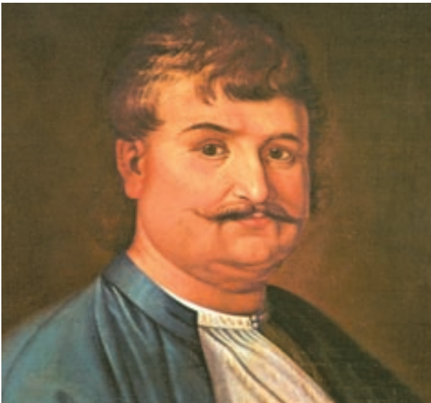
Ο Ρήγας Φεραίος.

Ο ευρωπαϊκός διαφωτισμός, που προωθούσε την ελευθερία της σκέψης και την κοινωνική δικαιοσύνη, τον επηρέασε βαθιά. Επίσης, τον επηρέασε και η Γαλλική Επανάσταση.