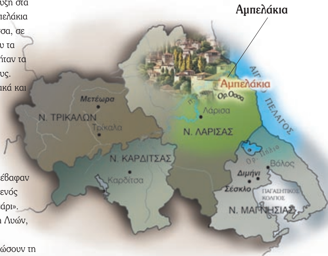
Τα Αμπελάκια, σε χαλκογραφία την εποχή της ακμής τους.

Όλοι μαζί έφτιαξαν ένα συνεταιρισμό. Κανείς δεν ήταν πλέον μόνος του. Τον συνεταιρισμό τον ονόμασαν «Κοινή συντροφιά». Και έτσι, μια συντροφιά όλοι μαζί, δούλευαν και στο τέλος της χρονιάς μοιράζονταν τα κέρδη. Με αυτόν τον τρόπο συνέχισαν για 34 χρόνια, μέχρι το 1813.