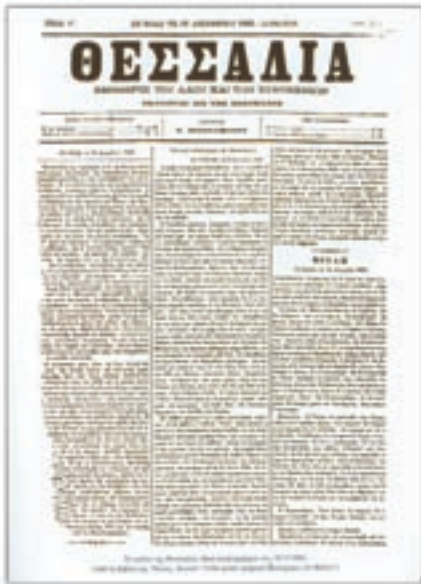
Η εφημερίδα «Θεσσαλία».

Σημαντικός για την κοινωνική και πολιτική ζωή στη Θεσσαλία είναι ο ρόλος του Τύπου. Η εφημερίδα «Θεσσαλία», που εκδόθηκε για πρώτη φορά στο Βόλο το 1881 και εκδίδεται μέχρι και σήμερα, η εφημερίδα «Θεσσαλικά Νέα» που πρωτοεκδόθηκε το 1946, η εβδομαδιαία «Θεσσαλική Ηχώ» της Καρδίτσας που άρχισε να κυκλοφορεί το 1953, και η εφημερίδα «Λάρισα», είναι μερικές από τις σημαντικότερες και παλαιότερες θεσσαλικές εφημερίδες. Αν οι εφημερίδες φροντίζουν για την ενημέρωση των πολιτών της Θεσσαλίας, για τη λογοτεχνική και λαογραφική τους παιδεία μερμινούν περιοδικά όπως η «Θεσσαλική Εστία» και τα «Θεσσαλικά Χρονικά».