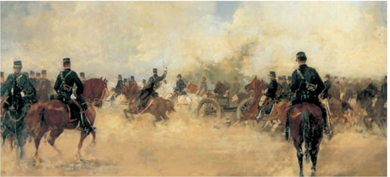
Η μάχη των Φαρσάλων (1897-1903).

Το 1897, οι Τούρκοι κατέλαβαν ένα μέρος της Θεσσαλίας. Όμως λίγα χρόνια αργότερα, στη διάρκεια των βαλκανικών πολέμων, η Θεσσαλία ελευθερώθηκε οριστικά.