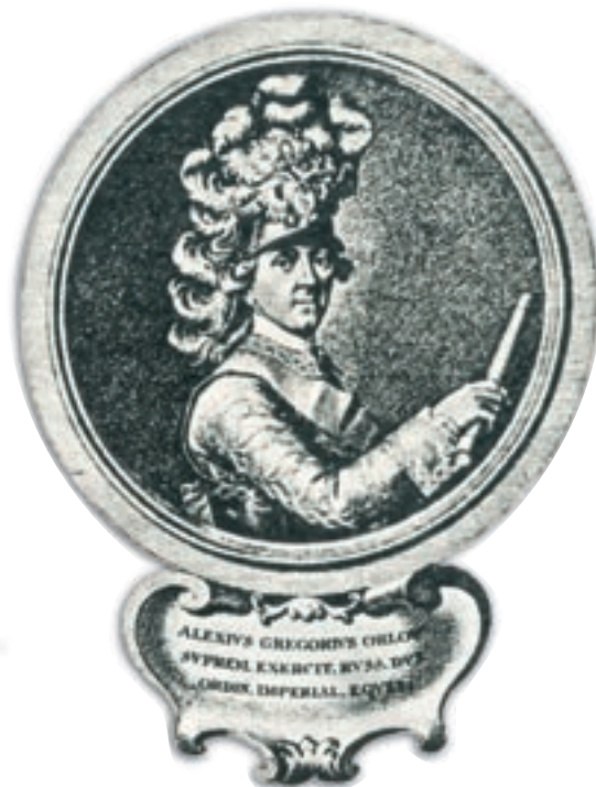
Ο Αλέξιος Ορλώφ.

Όμως η βοήθεια σε στρατό που έστειλαν οι Ρώσοι ήταν τόσο μικρή, που γρήγορα οι Τούρκοι συνέτριψαν τους επαναστάτες. Αν και το ρωσικό ναυτικό νίκησε σε μια ναυμαχία κοντά στη Σμύρνη, οι Ρώσοι υπέγραψαν συμφωνία με τους Τούρκους, αφήνοντας τους Έλληνες στα χέρια τους.