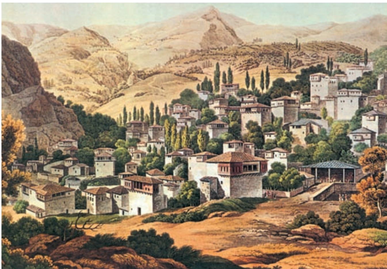
Από τις αρχές του 18ου αιώνα αναπτύχθηκαν το χωριό του Πηλίου. Η Πορταριά ήταν φημισμένη για την κατασκευή υφασμάτων. Αθήνα, Γεννάδειος βιβλιοθήκη.

Στα 34 εκείνα χρόνια, όμως, οι κάτοικοι των Αμπελακίων πρόλαβαν να παρουσιάσουν για πρώτη φορά στην Ελλάδα τη βιομηχανική μηχανή, να στήσουν τη σκηνή του πρώτου νεοελληνικού θεάτρου και να ιδρύσουν μια σπουδαία σχολή, το «Ελληνομουσείο».