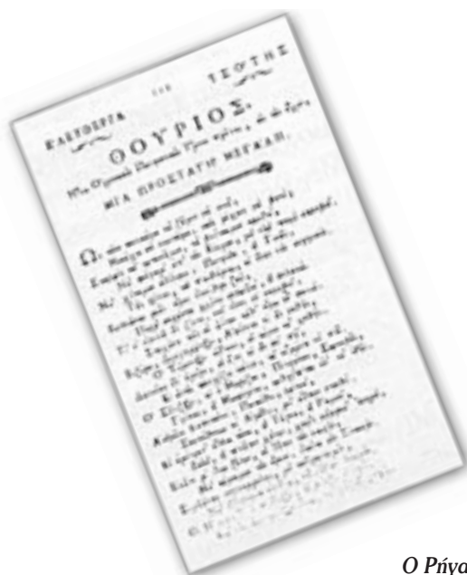
Ο Ρήγας τραγουδάει τον Θούριο.

Σ' Ανατολή και Δύση και Νότο και Βοριά Για την Πατρίδα όλοι να 'χομε μια καρδιά Στην πίστη του ο καθένας ελεύθερος να ζει Στη δόξα του πολέμου να τρέξομε μαζί...»