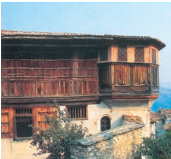
Αρχοντικό του Πηλίου. Η αρχιτεκτονική των σπιτιών είναι κοινό γνώρισμα των χωριών της περιοχής.