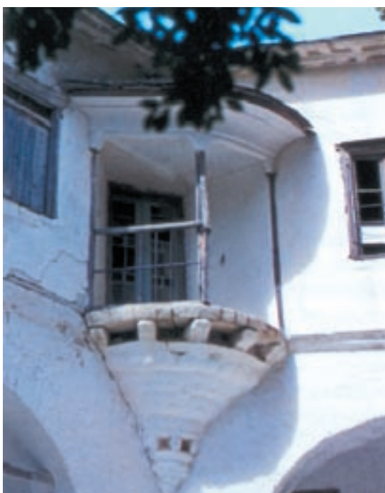
Το μπαλκόνι του Μοναστηριού της Παναγίας στη Μακρυνίτσα, που κτίστηκε το 18ο αιώνα.

Ρόκα του 18ου αιώνα για το γνέσιμο μαλλιού προβάτων.