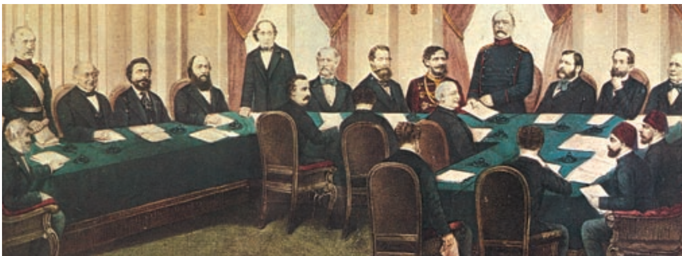
Το συνέδριο του Βερολίνου, 1878.

Το 1877, στη διάρκεια του ρωσοτουρκικού πολέμου, ξεκίνησε μια νέα εξέγερση από τους κατοίκους της Θεσσαλίας, της Μακεδονίας, της Ηπείρου και της Κρήτης. Η επανάσταση στη Θεσσαλία ξεκίνησε από τη Μονή Σουρβιάς στον Βόλο. Τον Ιανουάριο του 1878 σχηματίστηκε προσωρινή ελληνική διοίκηση στο Πήλιο. Η επανάσταση επεκτάθηκε στη Ζαγορά, στα Άγραφα και την Καρδίτσα. Οι Τούρκοι αντεπιτίθονταν συνεχώς. Οι Μεγάλες Δυνάμεις της εποχής υποχρέωσαν την ελληνική κυβέρνηση να ανακαλέσει τις στρατιωτικές μονάδες που είχε στείλει για να βοηθήσουν τους Θεσσαλούς και τους Ηπειρώτες.