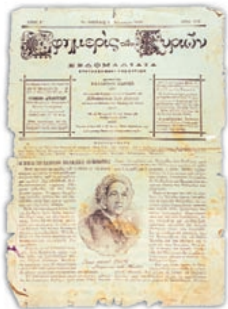
«Εφημερίς των Κυριών».

Την ίδια περίπου περίοδο εμφανίστηκαν και οι πρώτες γυναικείες οργανώσεις που υπεράσπιζαν τα δικαιώματα των γυναικών. Το 1872 ιδρύθηκε από την Καλλιόπη Κεχαγιά ο «Σύλλογος Κυριών υπέρ της γυναικείας παιδείσεως». Η ίδια οργανώνει εργαστήριο, όπου τα νέα και άπορα κορίτσια μαθαίνουν να γράφουν και να διαβάζουν, να ράβουν, να κεντούν, κ.λπ. Η Καλλιρόη Παρέν-Σιγανού, το 1887, αρχίζει την έκδοση του περιοδικού «Εφημερίς των Κυριών» και δημιουργεί την «Ένωση Ελληνίδων». Το βασικό αίτημα ήταν η κατοχύρωση των δικαιωμάτων των γυναικών και η