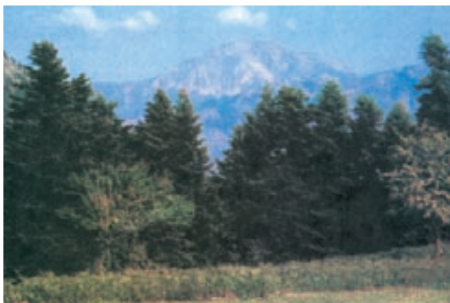
Τοπίο από τα Άγραφα.

Στα χρόνια της Τουρκοκρατίας δεν ήταν εύκολη η ζωή για τους Έλληνες της Θεσσαλίας. Η καταπίεση από τους κατακτητές υποχρέωσε πολλούς Έλληνες να εξισλαμιστούν, δηλαδή να ασπαστούν το Ισλάμ, τη θρησκεία των Τούρκων. Άλλοι πάλι, για να διατηρήσουν την πίστη τους, κατέφυγαν στα βουνά.