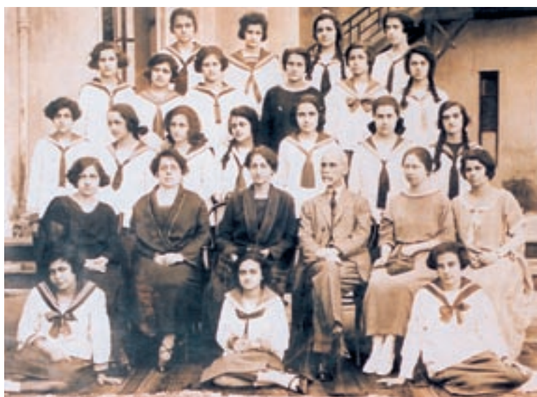
Μαθήτριες σε Παρθεναγωγείο 1920.

Το 1952, με τον νόμο 2159, πραγματοποιήθηκε η κατοχύρωση των πολιτικών δικαιωμάτων των γυναικών. Στο Σύνταγμα του 1975 για πρώτη φορά σε συνταγματικό κείμενο καθιερώθηκε η ισότητα των δύο φύλων. Σύμφωνα με το νέο Οικογενειακό Δίκαιο (ψηφίστηκε το 1983) ο άντρας δεν είναι πλέον ο αρχηγός της οικογένειας και για όλα τα θέματα θα πρέπει να συναποφασίζουν άντρες και γυναίκες. Όμως ο δρόμος για την πραγματική ισότητα δικαιωμάτων ανδρών και γυναικών είναι ακόμη μακρύς.