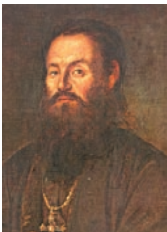
Ο Άνθιμος Γαζής.