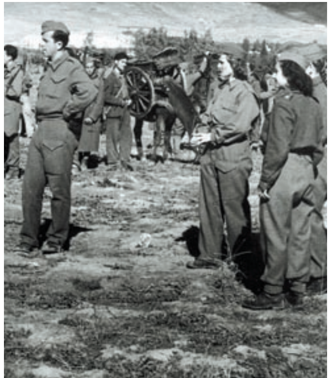
Αγωνιστές της Θεσσαλίας.

Τα πιο δύσκολα χρόνια τα πέρασε η Θεσσαλία αμέσως μετά την απελευθέρωση του '44. Βίωσε και αυτή, όπως και άλλες ελληνικές περιοχές, τον Εμφύλιο Πόλεμο. Τον πόλεμο, δηλαδή, μεταξύ των Ελλήνων που διήρκησε από τον Δεκέμβρη του 1944 έως και το 1949.