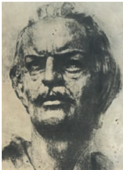
Ο Εμμανουήλ Παπάς οργάνωσε την επανάσταση στη Χαλκιδική και εμπύχωσε τους Μακεδόνες επαναστάτες.

Η Ελληνική Επανάσταση του 1821 υπήρξε σημαντικός σταθμός στην ιστορία της Μακεδονίας.