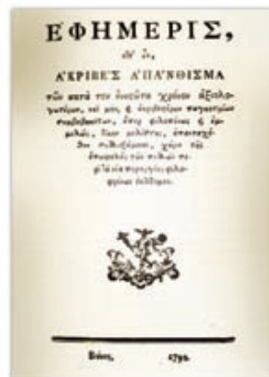
Η «Εφημερίς» που κυκλοφόρησε στη Βιέννη το 1790.

Στη βυζαντινή περίοδο, αλλά και κατά την Τουρκοκρατία, τα παιδιά, για να μάθουν τα γράμματα έκοβαν κλαδιά αγριοδάφνης ή ροδοδάφνης και τύλιγαν γύρω από αυτά την περγαμνή ή το χαρτί, πάνω στα οποία έγραφαν. Στριφογυρίζοντας το κλαδί, ξετύλιγαν την περγαμνή και διάβазαν την αλφαβήτα. Από κει πήρε το όνομά του το πρώτο αυτό βιβλίο των μαθητών, η «Φυλλάδα».