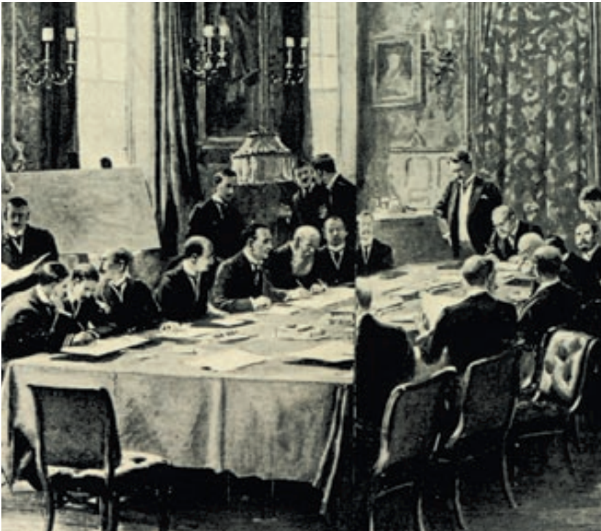
Στη συνδιάσκεψη του Λονδίνου, ο Έλληνας πληρεξούσιος Στέφανος Σκουλούδης προσυπόγραψε τη συνθήκη ειρήνης (Αθήνα, Γεννάδειος Βιβλιοθήκη).