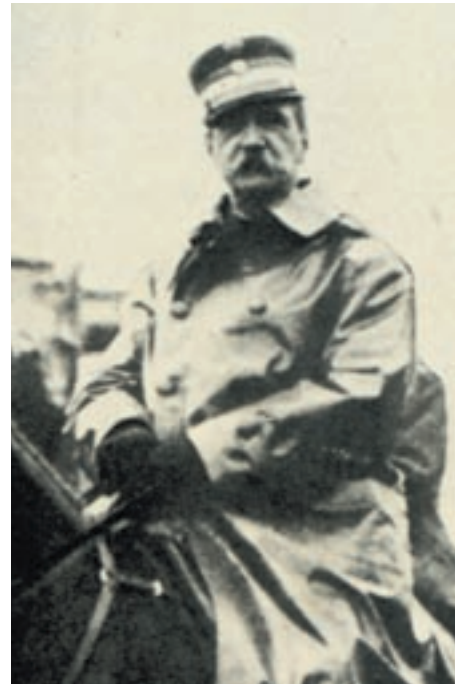
Ο βασιλιάς Γεώργιος Α΄ στην απελευθερωμένη Θεσσαλονίκη στις 29 Οκτωβρίου 1912 (Αθήνα, Γεννάδειος Βιβλιοθήκη).

-Διαβάστε τις πηγές και προσπαθήστε να εκφράσετε τα συναισθήματα που σας προκάλεσαν με κινήσεις του σώματός σας, χωρίς λόγια.