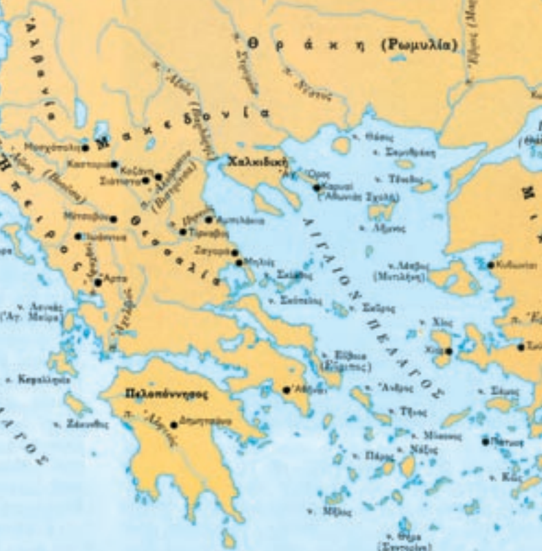
Χάρτης με τις έδρες ελληνικών ανώτερων σχολών από το 1669 ως το 1821.

Την περίοδο της τουρκοκρατίας, πολλοί μετανάστες από τη Μακεδονία βοήθησαν να αναπτυχθούν τα γράμματα όχι μόνο στην ιδιαίτερη πατρίδα τους, αλλά και σε άλλες ελληνικές πόλεις.