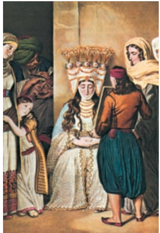
Στολισμός νύφης στην περίοδο της Τουρκοκρατίας.

-Χωριστείτε σε ομάδες λογοτεχνίας, ζωγραφικής και αρχιτεκτονικής. Η κάθε ομάδα αναζητά από περιοδικά, εφημερίδες, εγκυκλοπαίδειες, το αντίστοιχο υλικό της (φωτογραφίες, διάφορες πληροφορίες, κλπ.) για τη Μακεδονία και ανακοινώνει τα αποτελέσματα της έρευνάς της στην τάξη.