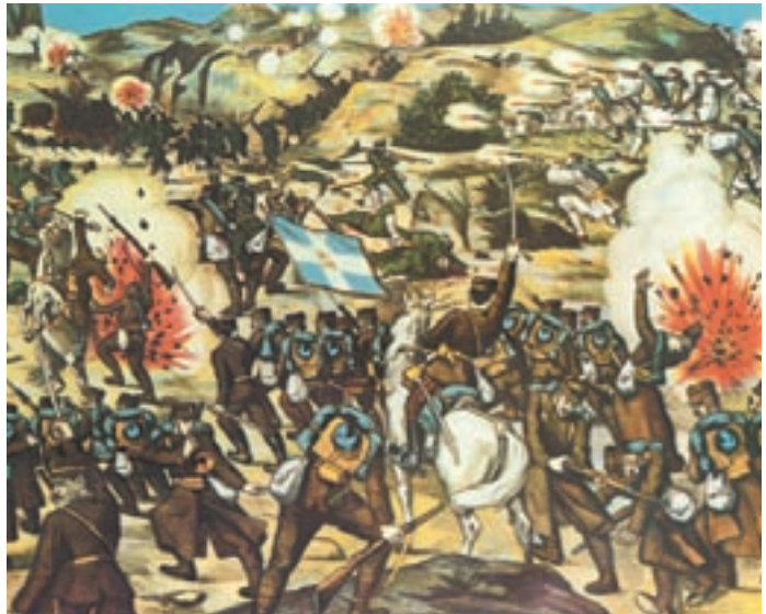
Σκηνή της μάχης του Λαχανά σε λαϊκή εικόνα της εποχής (Αθήνα, Εθνικό Ιστορικό Μουσείο).

Πετρόπουλος Πετροπουλάκης, 12 Ιουλίου 1913