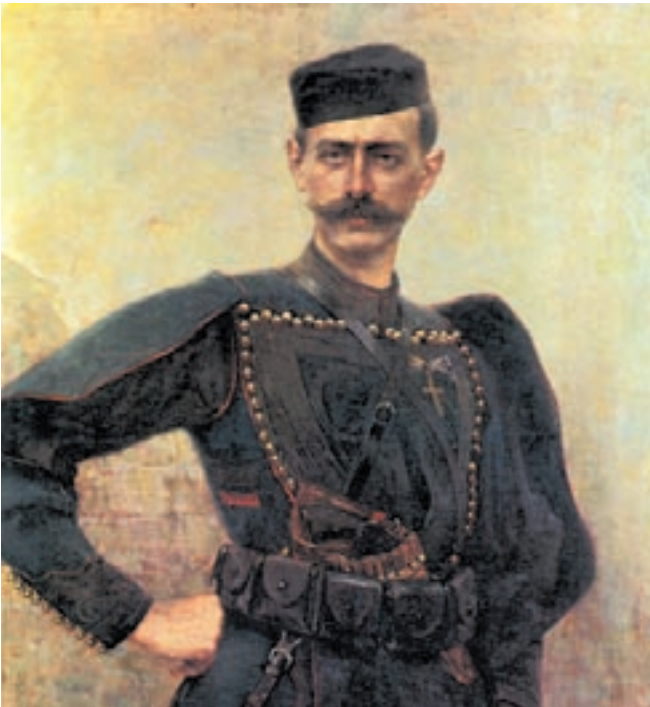
Ο Παύλος Μελάς.

Τον Αύγουστο του 1904 ο Παύλος Μελάς, ως αξιωματικός του ελληνικού στρατού, ανέλαβε την αρχηγία του Μακεδονικού Αγώνα. Με τη δράση και τον θάνατό του (13 Οκτωβρίου 1905) πέτυχε να γίνει ο αγώνας της Μακεδονίας υπόθεση όλων των Ελλήνων.