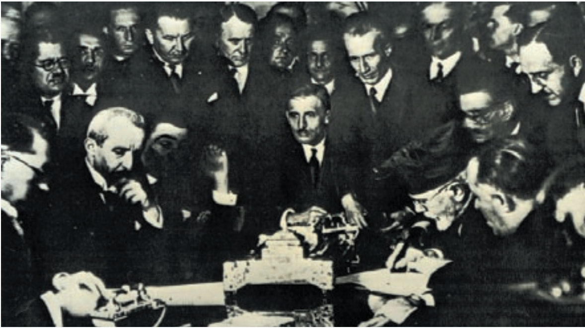
Ιστορική φωτογραφία του Ελευθέριου Βενιζέλου κατά την υπογραφή του ελληνoturκικού συμφώνου (30 Οκτωβρίου 1930).

«Ο παπα-Φώτης έκαμε το σταυρό του: -Παιδιά, φώναξε, ξημέρωσε ο Θεός, δουλειά πολλή σήμερα, σηκωθείτε να κραξουμε όλοι μαζί το Θεό να μας ακούσει!... Σηκώθηκαν τα γερμένα κεφάλια, οι γυναίκες άνοιξαν τον κόρφο τους κι έδωσαν βυζί στα μωρά, κι άλλες έσκυψαν, έριξαν προσανάμματα στις φωτιές κι έστησαν απάνω τα τσουκάλια. -Παιδιά μου, φώναξε ο παπα-Φώτης, εδώ στο κακοτράχαλο τούτο βουνό, με τη δύναμη του Θεού, θα ριζώσουμε. Τρεις μήνες οδοιπορούμε, έλιωσαν τα παιδιά κι οι γυναίκες, κι οι άντρες ντρέπονται πια να ζητιανεύουν...».