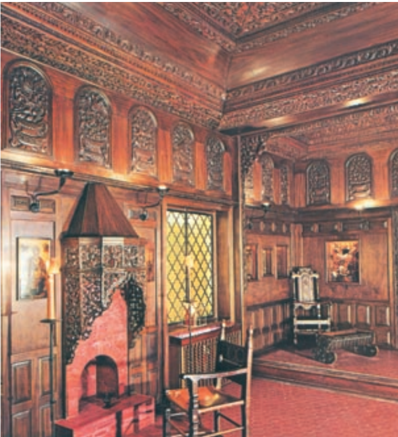
Ξυλόγλυπτη επένδυση «οντά» από αρχοντικό της Κοζάνης, έργο ξυλογλυπτών της Μακεδονίας.