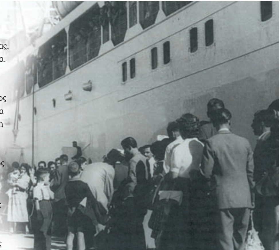
Έλληνες μετανάστες αναχωρούν από το λιμάνι.