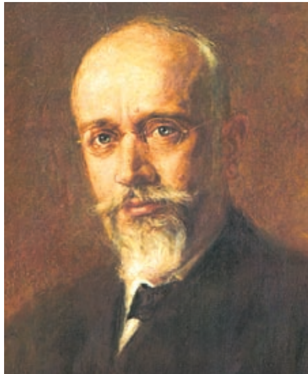
Ο Ελευθέριος Βενιζέλος.

Απόσπασμα από το βιβλίο του Νίκου Καζαντζάκη, "Ο Χριστός Ξανασταυρώνεται", που περιγράφει τον αγώνα που έκαναν οι πρόσφυγες για να ξαναβρούν πατρίδα.