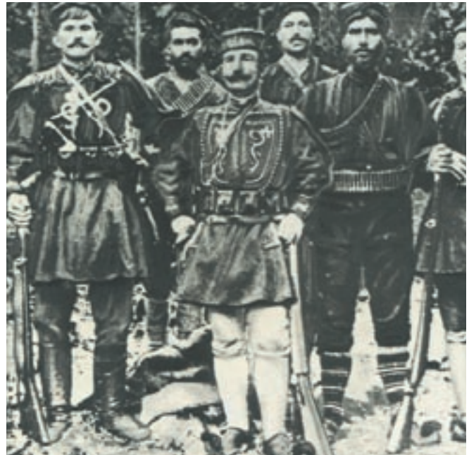
Το ένοπλο σώμα του Τσόντου ή Βάρδα (αρχηγός του αγώνα στη Δυτική Μακεδονία από το Νοέμβριο του 1904) κατά τη διάρκεια του Μακεδονικού Αγώνα.

Τον Αύγουστο του 1904 ο Παύλος Μελάς, ως αξιωματικός του ελληνικού στρατού, ανέλαβε την αρχηγία του Μακεδονικού Αγώνα. Με τη δράση και τον θάνατό του (13 Οκτωβρίου 1905) πέτυχε να γίνει ο αγώνας της Μακεδονίας υπόθεση όλων των Ελλήνων.