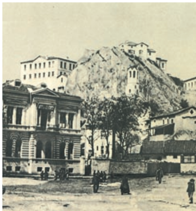
Στην περιοχή της Ανατολικής Ρωμυλίας τα ελληνικά σχολεία λεπούργησαν ως τους μεγάλους διωγμούς του 1906. Μέχρι τότε υπήρχαν 55 σχολεία, διάφορων βαθμίδων, στα οποία φοιτούσαν 7.500 περίπου μαθητές. Στη φωτογραφία το «Ζαρείφιον» εκπαιδευτήριο στη Φιλιππούπολη. Αθήνα, Συλλογή Κ. Μαμόνη.

Τον 19ο αιώνα η κατάσταση στη Θράκη έγινε αρκετά δύσκολη. Αιτία ήταν η βαριά φορολογία και ο βίαιος εξισλαμισμός. Οι Έλληνες της Θράκης συμμετείχαν με τον δικό τους τρόπο στην προετοιμασία και την πραγματοποίηση της επανάστασης του 1821. Στα τέλη του 19ου αιώνα, η Θράκη έγινε πεδίο συγκρούσεων των τριών μεγάλων εθνοτήτων της περιοχής, των Ελλήνων, των Βουλγάρων και των Τούρκων, αλλά και των μεγάλων δυνάμεων (Αγγλία, Ρωσία, κ.ά.) που επιδίωκαν να χρησιμοποιήσουν αυτή τη διαμάχη για τα δικά τους συμφέροντα. Στο συνέδριο του Βερολίνου το 1878 αποφασίστηκε η Θράκη να παραμείνει στην Οθωμανική Αυτοκρατορία, εκτός από το βόρειο τμήμα της που έγινε αυτόνομη περιοχή και ονομάστηκε «Ανατολική Ρωμυλία». Αυτή η περιοχή το 1885 προσαρτήθηκε στη Βουλγαρία. Στα χρόνια που ακολούθησαν την επανάσταση, οι Έλληνες της Θράκης ανέπτυξαν πλούσια μορφωτική και πολιτισμική δραστηριότητα. Δημιούργησαν