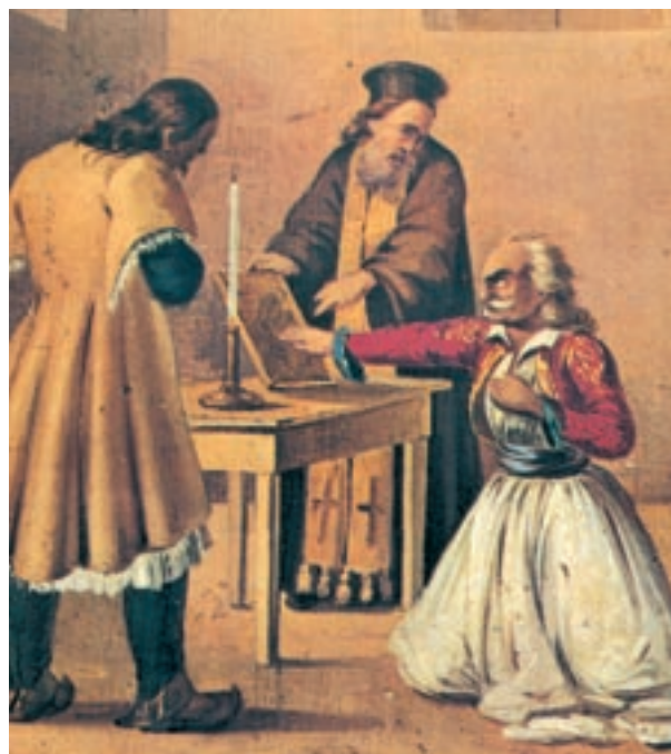
«Ο όρκος των Φιλικών».