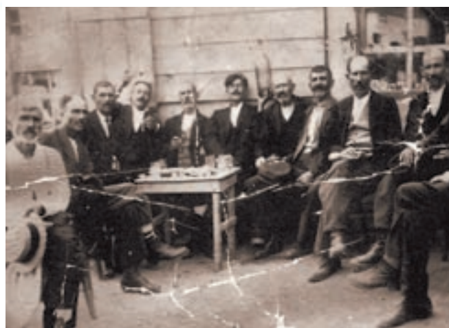
Πρόσφυγες από τη Μάδυτο της Θράκης. Έφτασαν στη Θεσσαλονίκη το 1922-23.

Η μικρασιατική καταστροφή (1922) οδήγησε στην ακύρωση των αποφάσεων της Συνθήκης των Σεβρών με την οποία η Ελλάδα είχε γίνει «χώρα των δύο ηπείρων και των πέντε θαλασσών». Σύμφωνα με τη συνθήκη της Λωζάννης, η Ανατολική Θράκη και τα νησιά Ίμβρος και Τένεδος παραχωρήθηκαν στην Τουρκία. Με ειδική σύμβαση αποφασίστηκε η ανταλλαγή των πληθυσμών Ελλάδας και Τουρκίας. Περίπου 1.300.000 Έλληνες της Μ. Ασίας μετακινήθηκαν ως πρόσφυγες στην Ελλάδα και 600.000 Τούρκοι εγκατέλειψαν τα σπίτια τους και κατέφυγαν στην Τουρκία. Από την ανταλλαγή των πληθυσμών εξαιρέθηκε ο ελληνικός πληθυσμός της Κωνσταντινούπολης, της Ίμβρου και της Τενέδου και οι μουσουλμανικοί πληθυσμοί της Δ. Θράκης.