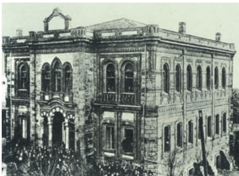
Το «Ελληνικό Γυμνάσιο» της Ανδριανούπολης. Η ανέγερσή του έγινε το 1880. Αθήνα, φωτ. αρχείο Εστίας, Νέας Σμύρνης.

φιλολογικούς συλλόγους, αθλητικά και μουσικά σωματεία, φιλανθρωπικά ιδρύματα (νοσοκομεία, ορφανοτροφεία κτλ.), αναγνωστήρια και βιβλιοθήκες. Στην Ξάνθη υπήρχε γυμναστικός σύλλογος, εργατικό σωματείο, φιλόπρωκος αδελφότητα, εμπορική λέσχη και σύνδεσμος της ελληνικής νεολαίας. Στην Κομοτηνή μάλιστα υπήρχε φιλανθρωπική λέσχη γυναικών και στην Αλεξανδρούπολη ο σύλλογος «Ορφεύς».