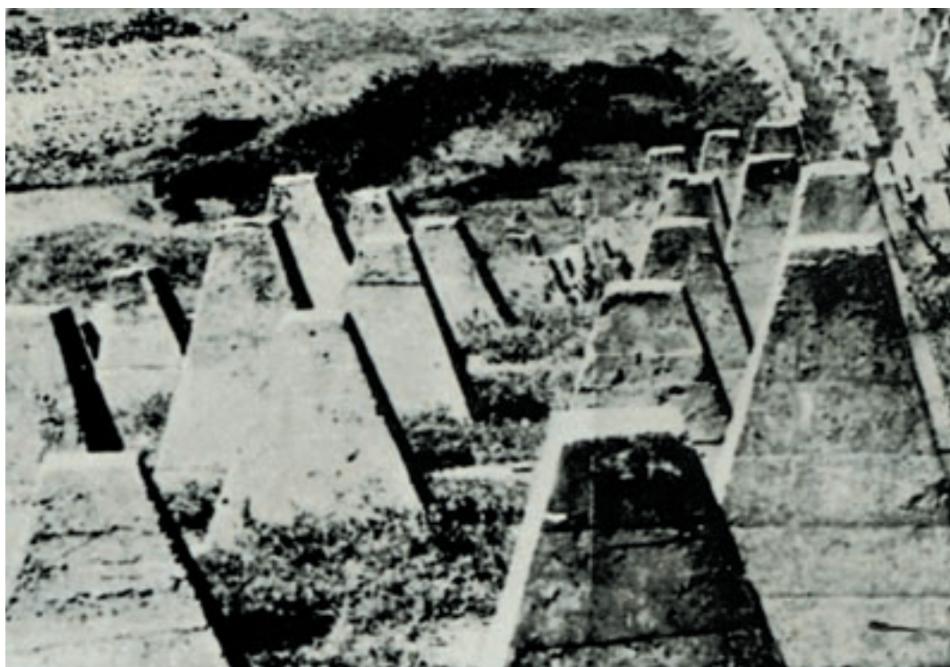
Αντιαρματική οχύρωση της «γραμμής Μεταξά» («Δόντια του Δράκοντα»). Αθήνα, Πολεμικό Μουσείο.