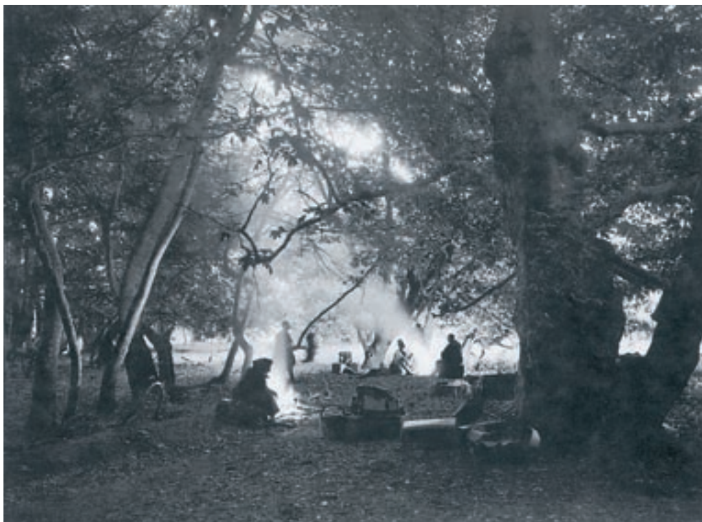
Καταυλισμός Κουτσόβλαχων στην Ξάνθη. Φωτογραφία του Magnard Owen Williams, National Geographic, Δεκέμβριος 1930.

Οι Πομάκοι είναι ένας ορεινός πληθυσμός που ζει στην περιοχή της Ροδόπης και διατηρεί άσβεστα τα πανάρχαια ήθη και έθιμά του. Πολλοί υποστηρίζουν πως οι Πομάκοι, που λέγονται και Αγριάν, είναι απόγονοι του αρχαίου Θρακικού φύλου των Αγριάνων. Η γλώσσα τους είναι σλαβική και περιέχει πολλές αρχαιοελληνικές λέξεις.