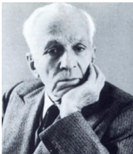
Ο ποιητής Κώστας Βάρναλης.

Στη Βόρεια Θράκη (Ανατολική Ρωμυλία) έζησε τα πρώτα χρόνια της ζωής του ο ποιητής Κ. Βάρναλης (1883-1974). Να μερικές από τις αναμνήσεις του: