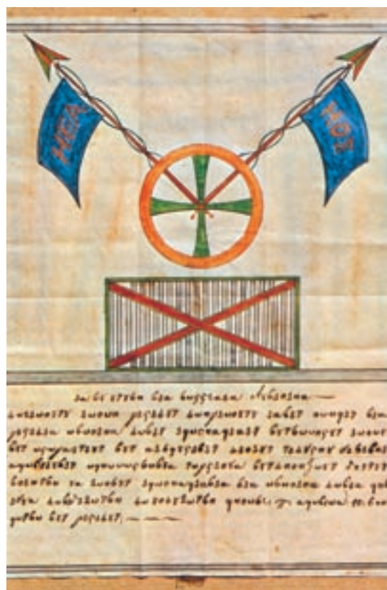
Σύμβολο της Φιλικής Εταιρίας με τα αρχικά των λέξεων «Η ελευθερία ή θάνατος».

Το 1821, ο Αλέξανδρος Υψηλάντης, πρόεδρος της Φιλικής Εταιρίας, ξεκίνησε την επανάσταση στη Μολδοβλαχία, με σκοπό να διασπάσει τις δυνάμεις των Τούρκων και να ξεσηκωθούν και άλλοι βαλκανικοί λαοί. Με μια μικρή δύναμη μπήκε στο Ιάσιο, πρωτεύουσα της Μολδαβίας, και διακήρυξε την ανεξαρτησία των Ελλήνων. Στην πορεία προς το Βουκουρέστι συγκρότησε μαζί με Έλληνες σπουδαστές ευρωπαϊκών πανεπιστημίων τον «Ιερό Λόχο». Το κίνημα, παρά τις πρώτες επιτυχίες του, καταπνίγηκε από τον τουρκικό στρατό (μάχη στο Δραγατσάνι, 2 Ιουνίου 1821).