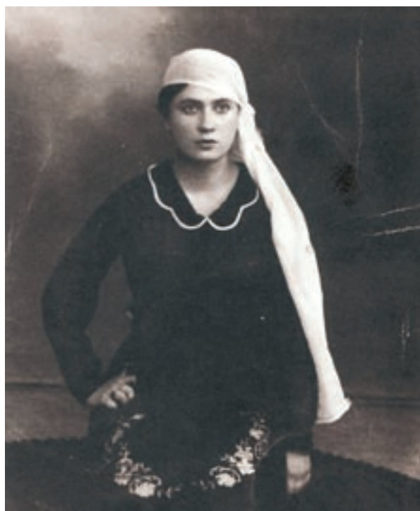
Κοπέλα με θρακιώτικη ενδυμασία, 1922.