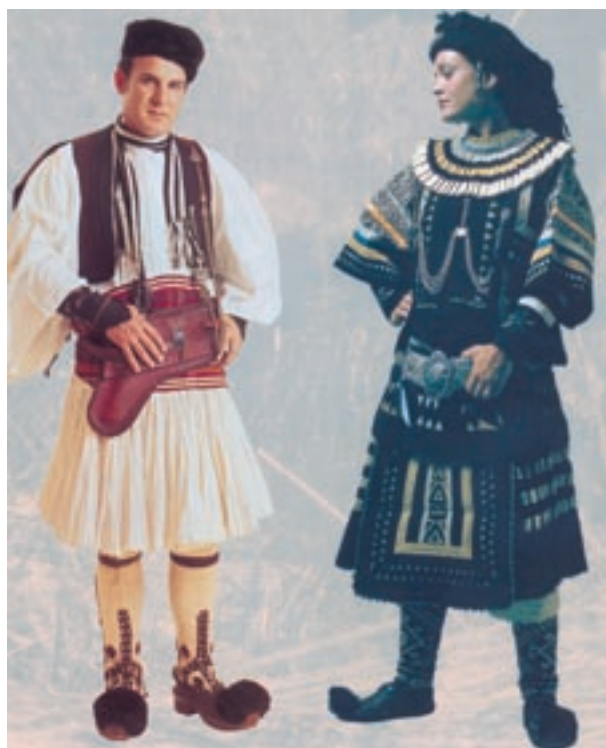
Ανδρική και γυναικεία φορεσιά των Σαρακατσάνων της Θράκης.

Η γιορτή της «της μαμής» (μπάμπως) γιορτάζεται στη Θράκη στις 8 Ιανουαρίου. Σ' αυτή τη γιορτή παίρνουν μέρος μόνο παντρεμένες γυναίκες, ενώ οι άντρες μένουν κλεισμένοι στα σπίτια τους. Το τιμώμενο πρόσωπο είναι η μαμή του χωριού (αυτή που βοήθησε τις άλλες γυναίκες κατά τον τοκετό). Οι γυναίκες του χωριού μεταμφιέζονται, την επισκέπτονται, και της φέρνουν δώρα. Αυτό το έθιμο που συνοδεύεται με τραγούδια μοιάζει με ορισμένες γυναικείες γιορτές της αρχαιότητας, όπως τα «Θεσμοφόρια» και τα «Αλώα». Στα «Αλώα» που γιορτάζονταν στις 26 Ποσειδαίωνος (αρχές Ιανουαρίου) στην Ελευσίνα, έπαιρναν μέρος μόνο γυναίκες.