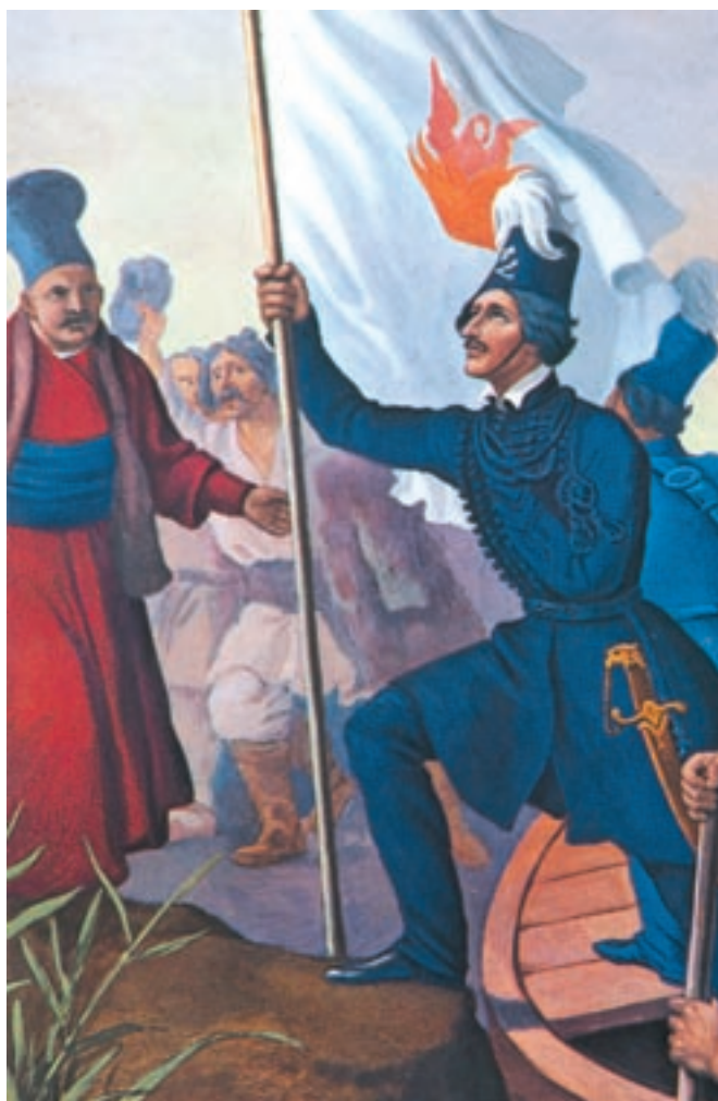
Ο Αλέξανδρος Υψηλάντης.

Το 1821, ο Αλέξανδρος Υψηλάντης, πρόεδρος της Φιλικής Εταιρίας, ξεκίνησε την επανάσταση στη Μολδοβλαχία, με σκοπό να διασπάσει τις δυνάμεις των Τούρκων και να ξεσηκωθούν και άλλοι βαλκανικοί λαοί. Με μια μικρή δύναμη μπήκε στο Ιάσιο, πρωτεύουσα της Μολδαβίας, και διακήρυξε την ανεξαρτησία των Ελλήνων. Στην πορεία προς το Βουκουρέστι συγκρότησε μαζί με Έλληνες σπουδαστές ευρωπαϊκών πανεπιστημίων τον «Ιερό Λόχο». Το κίνημα, παρά τις πρώτες επιτυχίες του, καταπνίγηκε από τον τουρκικό στρατό (μάχη στο Δραγατσάνι, 2 Ιουνίου 1821).