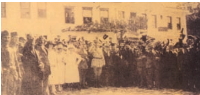
Η επίσημη είσοδος της ΙΧ μεραρχίας στην Ανδριανούπολη.