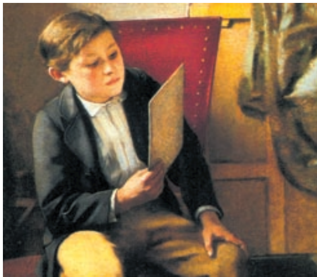
Ιωάννη Ζαχαρία, «Ο μαθητής», 1868, Αθήνα, Εθνική Πινακοθήκη.

- Αναζητήστε στην πόλη σας ή σε άλλες πόλεις της πατρίδας που ζείτε κάποιο σύλλογο Ελλήνων της Θράκης. Με τη βοήθειά τους επιδιώξτε επαφή με σχολεία της Θράκης, ανταλλάξτε εμπειρίες με τους μαθητές και τους εκπαιδευτικούς και συνεργαστείτε μαζί τους σε κάποια κοινή εκπαιδευτική δραστηριότητα.