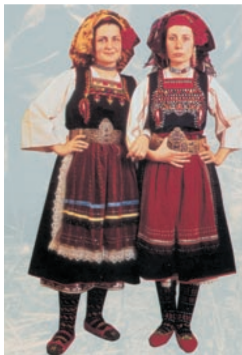
Γυναικείες φορεσιές από την περιοχή Μεταξάδες του Έβρου.

- Ποια μουσικά όργανα είναι συνηθισμένα στην περιοχή της Ελλάδας από όπου κατάγονται οι γονείς σου; Ξέρεις κάποιο παραδοσιακό μουσικό όργανο της χώρας όπου ζεις;