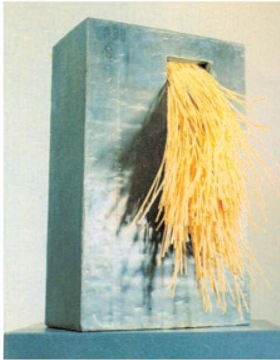
Έργο του γλύπτη Γιώργου Χρόνη «Μολύβι και πυρίτης» (1988)