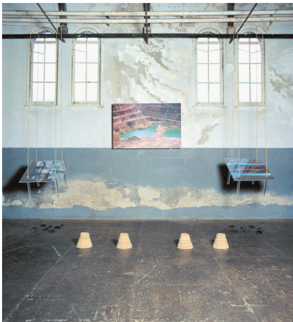
Έργο της Ελένης Τζάτζαλου. «Αντιόπη Κάκαβος», φωτογραφία σε καμβά, πλέξιγκλας και ατσάλι, τεχνητή ρητίνη