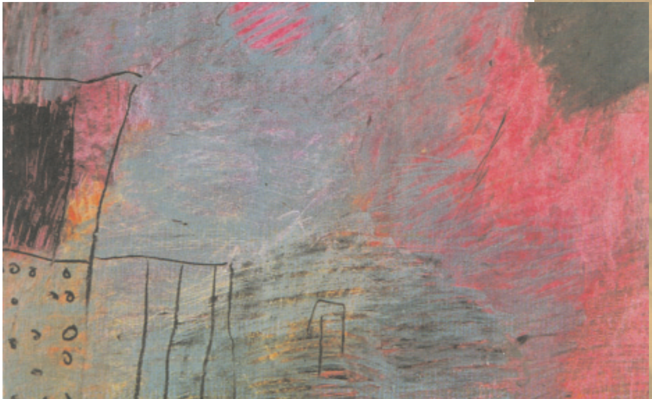
Έργο της Τούλας Λιάση «Τοπίο στη βροχή», παστέλ (1989)