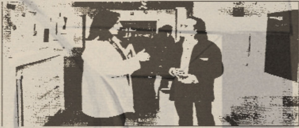
Αποψη από την έκθεση του καλλιτέχνη

Ο Κώστας Λευκόχειρ είναι ένας αξιόλογος καλλιτέχνης που ζει και εργάζεται στην πόλη της Λιέγης, στην οποία εγκαταστάθηκε το 1970 με σκοπό να φοιτήσει στην αρχιτεκτονική. Γρήγορα όμως η έμφυτη έλξη προς την ζωγραφική και ιδιαίτερα προς την πλαστική τον οδήγησε στο τμήμα σχεδίου και ζωγραφικής της Ακαδημίας Καλών Τεχνών.