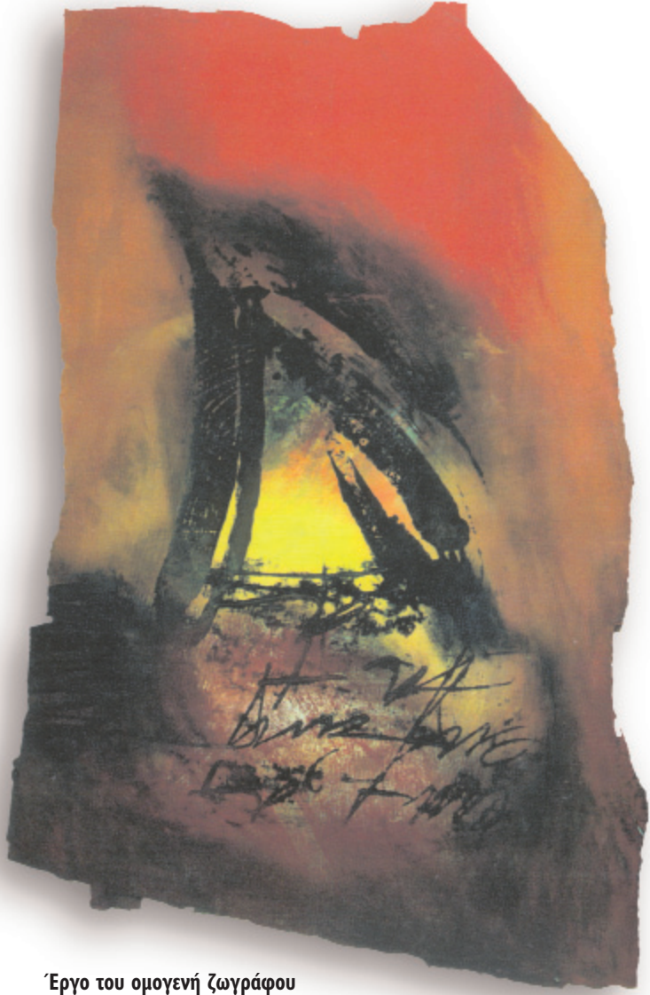
Έργο του ομογενή ζωγράφου Κ. Λευκόχειρ

Άρθρο της παροικιακής εφημερίδας «Πρωτοπόρος» για το γνωστό ζωγράφο Κώστα Λευκόχειρ