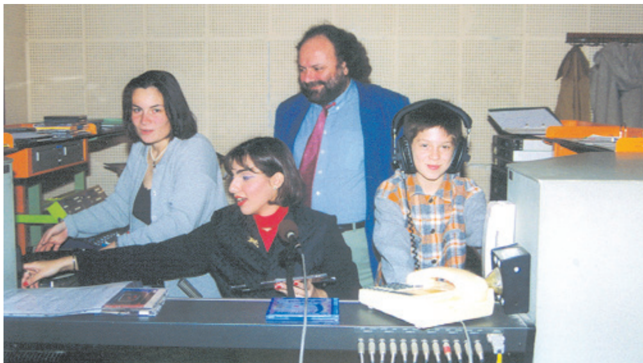
Στα στούντιο του ραδιοφωνικού σταθμού απ' όπου εκπέμπεται το ελληνικό πρόγραμμα