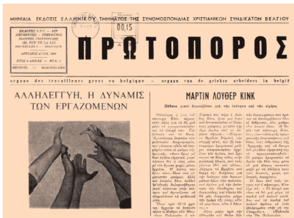
Τεύχος της τετρασέλιδης εφημερίδας «Πρωτοπόρος» (1968), που εκδίδεται από το ελληνικό τμήμα της συνομοσπονδίας των χριστιανικών συνδικάτων Βελγίου

Η ελληνική ομογένεια των Κάτω Χωρών έχει μια αξιόλογη εκδοτική δραστηριότητα, με την κυκλοφορία μηνιαίων εφημερίδων και άλλων εντύπων ελληνικού ενδιαφέροντος. Στο Βέλγιο εκδίδονται οι ομογενειακές εφημερίδες «Ευρωπαρατηρητής», «Ευρωηπειρωτική» και «Πρωτοπόρος», και στην Ολλανδία, μέχρι πριν λίγο καιρό, η «Ελληνική Γνώμη». Επίσης διάφορες Κοινότητες και σύλλογοι κυκλοφορούν τις δικές τους περιοδικές εκδόσεις, όπως π.χ. η Κοινότητα Λιέγης το περιοδικό «Νίκανδρος», η Κοινότητα Ουτρέχτης το περιοδικό «Μετανάστης».