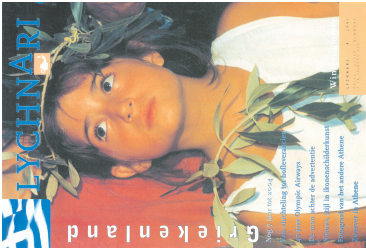
Το περιοδικό «Λυχνάρι», στην ολλανδική γλώσσα, που απευθύνεται σε Ολλανδούς φιλέλληνες και ολλανδόφωνους Έλληνες