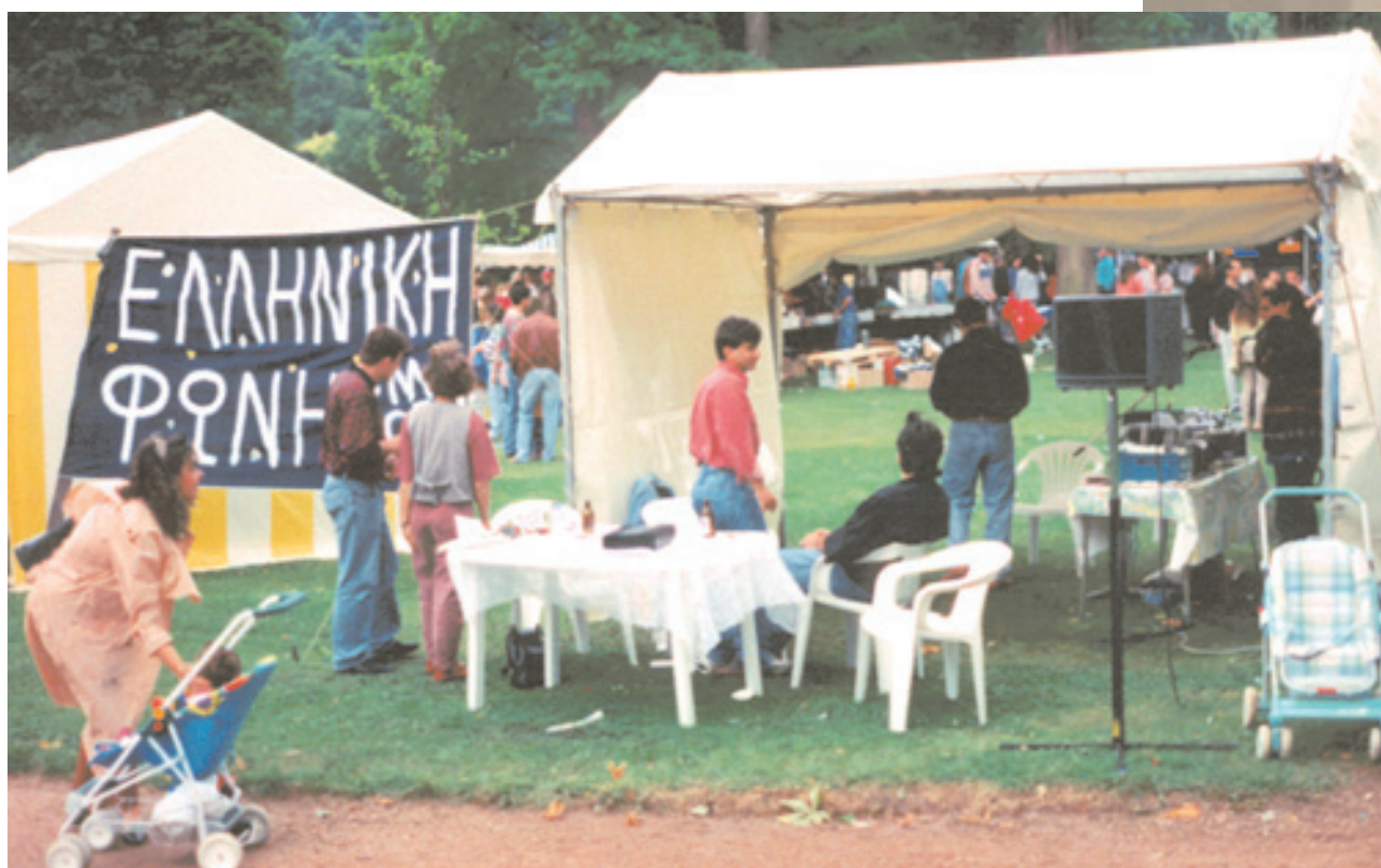
Το περίπτερο της «Ελληνικής Φωνής» Βρυξελλών σε ομογενειακή εκδήλωση