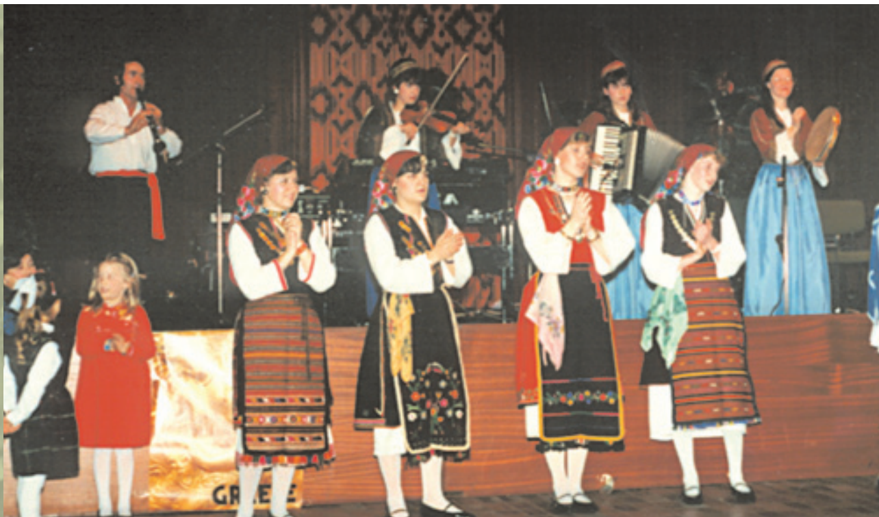
Χορευτική βραδιά του συλλόγου Εβριτών Ουτρέχτης «Έβρος»