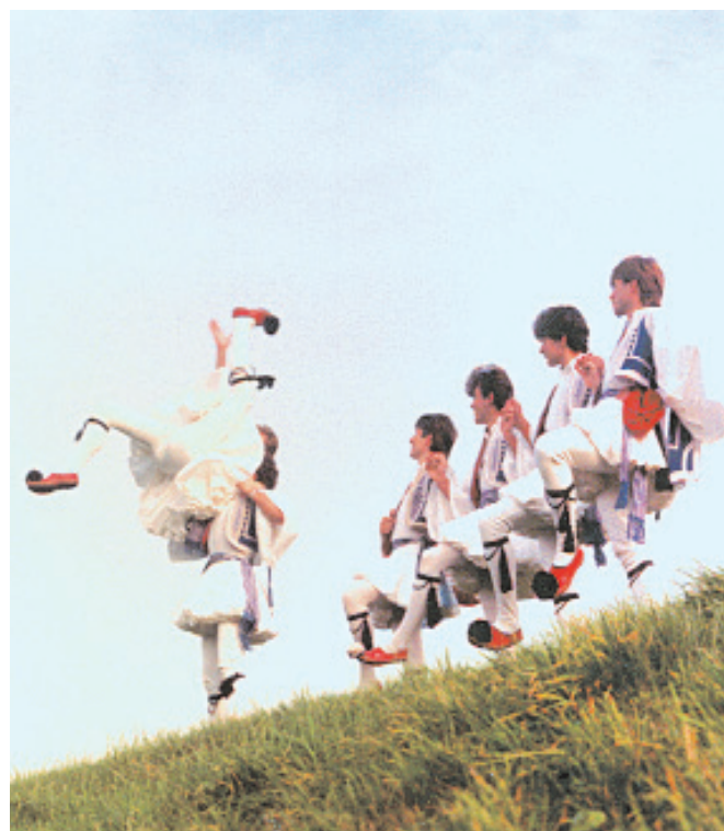
Ο Σύλλογος Νέων Χόρινχεμ με παραδοσιακές στολές στα πράσινα λιβάδια της Ολλανδίας