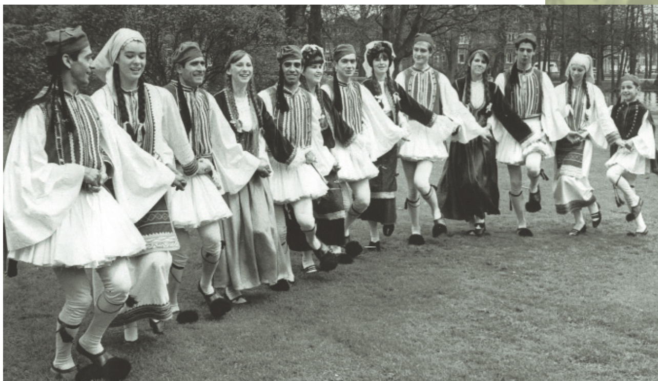
Το χορευτικό συγκρότημα «Πήγασος» της Ουτρέχτης ιδρύθηκε στα 1963 με σκοπό να διατηρήσει την πολιτιστική παράδοση ανάμεσα στους Έλληνες μετανάστες

Ο «Πήγασος» άρχισε να γίνεται γνωστός στην Ολλανδία όταν πρωτοπαίχτηκε η ταινία «Ζορμπάς». Στην πρεμιέρα κάλεσαν το χορευτικό συγκρότημα να παρουσιάσει το συρτάκι. Το 1966 ο πρέσβης της Ελλάδας στην Ολλανδία ανακοίνωσε επίσημα ότι χάρη στον «Πήγασο» είχε αυξηθεί ο αριθμός των Ολλανδών τουριστών στην Ελλάδα κατά 30%.