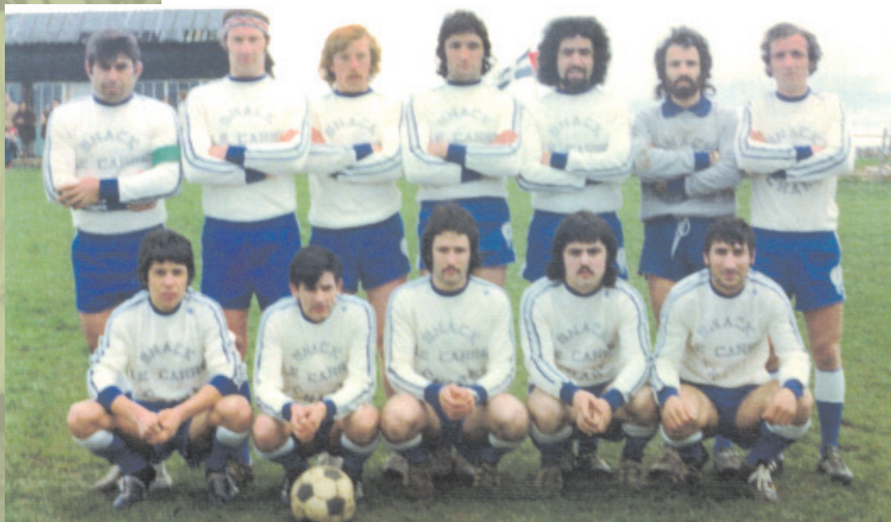
Ο ίδιος σύλλογος κατά την ποδοσφαιρική περίοδο 1974-1975