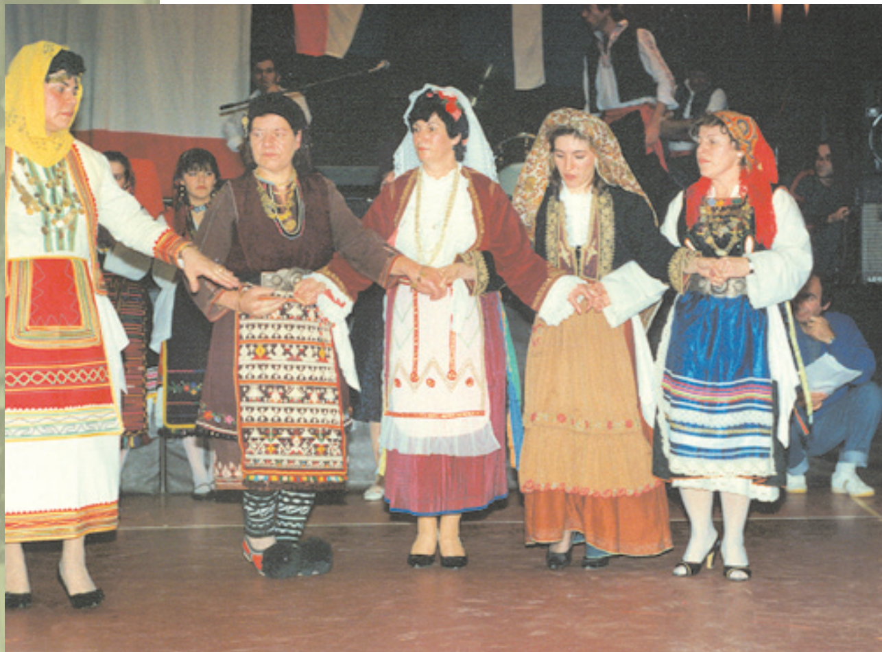
Ο Σύλλογος Γυναικών Ουτρέχτης σε χορευτική εκδήλωση

Ο σύλλογος ιδρύθηκε αρχικά στο Βέλγιο το 1986 από μια ομάδα ανθρώπων που ήταν γοητευμένοι με την Ελλάδα και μάθαιναν την ελληνική γλώσσα. Αργότερα δημιουργήθηκε κι ένας κλάδος της «Ευτυχίας» στην Ολλανδία. Η πλειοψηφία των μελών είναι Βέλγοι ή Ολλανδοί, όμως ένα ποσοστό 10% έχει ελληνική καταγωγή.