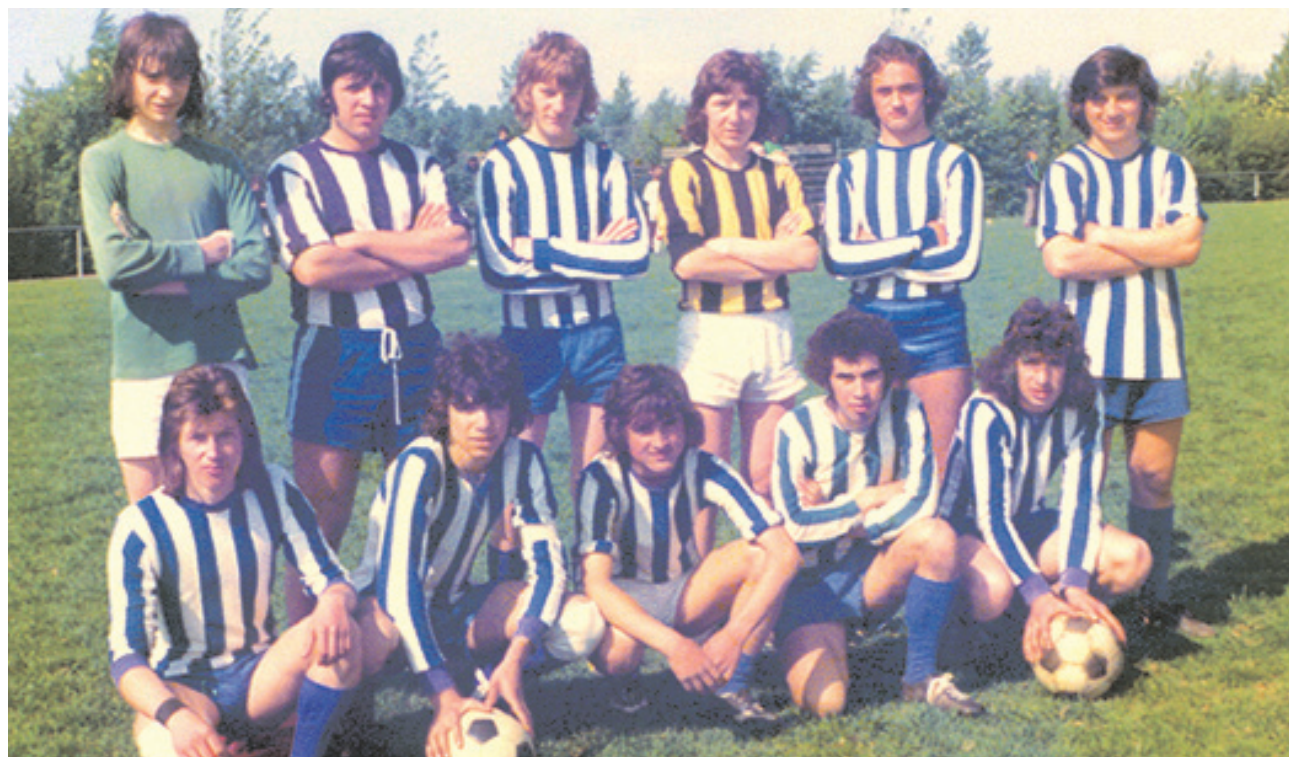
Μια από τις πρώτες ομάδες του συλλόγου «Απόλλων» Ουτρέχτης (1973)