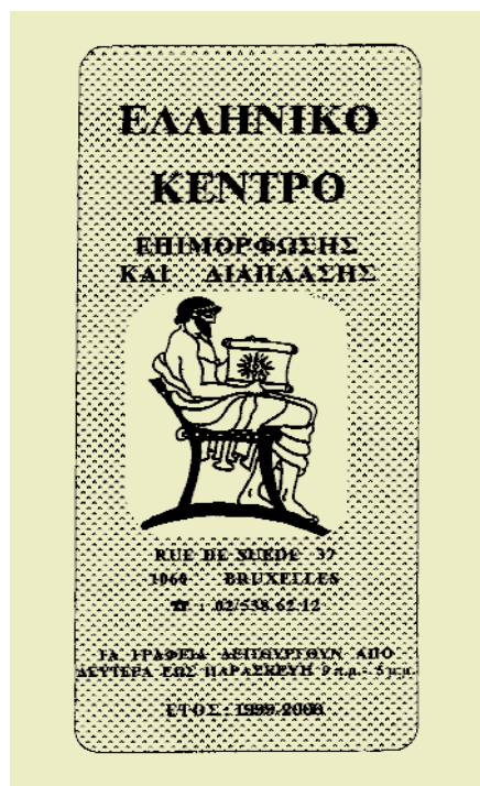
Ενημερωτικό φυλλάδιο του Κέντρου Επιμόρφωσης και Διάπλασης Βρυξελλών