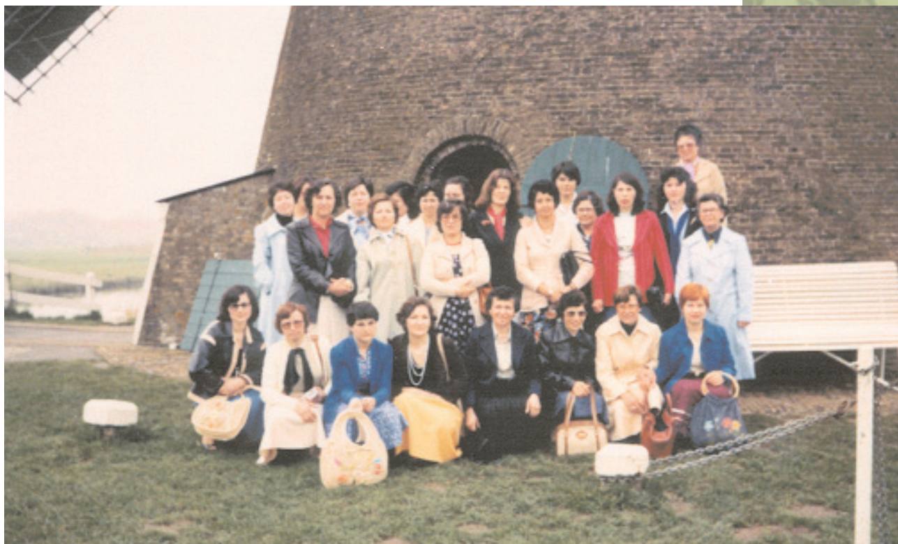
Ο Σύλλογος Γυναικών Τίλμπουρχ σε εκδρομή στους παραδοσιακούς μύλους της Ολλανδίας