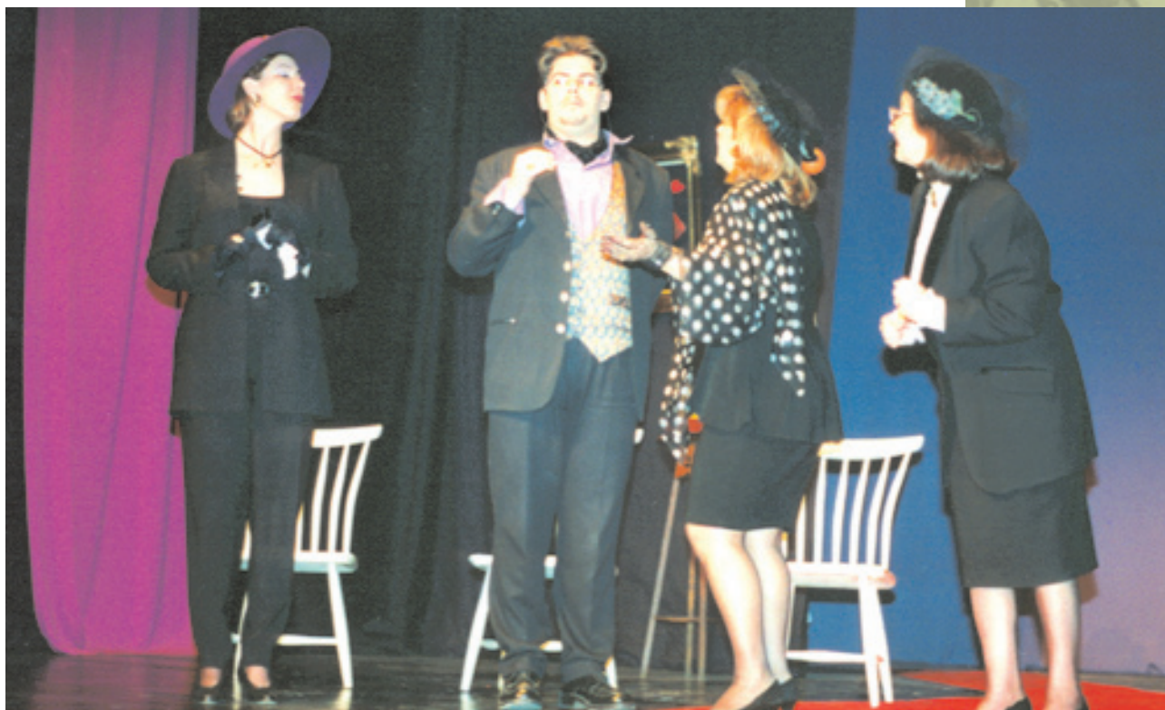
Από παράσταση του Θεατρικού Συλλόγου Βρυξελλών