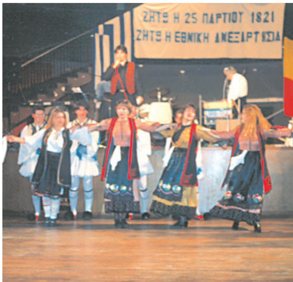
Μέλη του Συλλόγου Ηπειρωτών Βελγίου σε χορευτική εκδήλωση

Προς την κατεύθυνση της οργανωμένης συγκρότησης του ελληνισμού στις Κάτω Χώρες, λειτουργούν πέρα από τις Κοινότητες, διάφορες παροικιακές οργανώσεις. Την πρώτη θέση ανάμεσα σ' αυτές, κατέχουν οι εθνοτοπικοί σύλλογοι. Σκοπός τους είναι η διατήρηση επαφών με τον τόπο προέλευσης και η διατήρηση και καλλιέργεια των ηθών και εθίμων και γενικά της κουλτούρας της ιδιαίτερης πατρίδας τους.