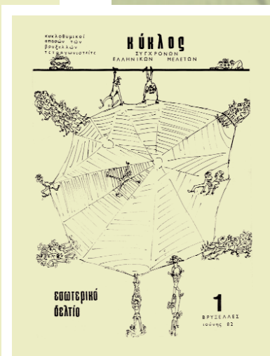
Ενημερωτικό δελτίο του συνδέσμου «Κύκλος»

ἈΡΤΙΟ 2ο. Σκοπὸς τοῦ Κόκλου εἶναι ἡ μελέτη καὶ ἀνάπτυξη τῶν