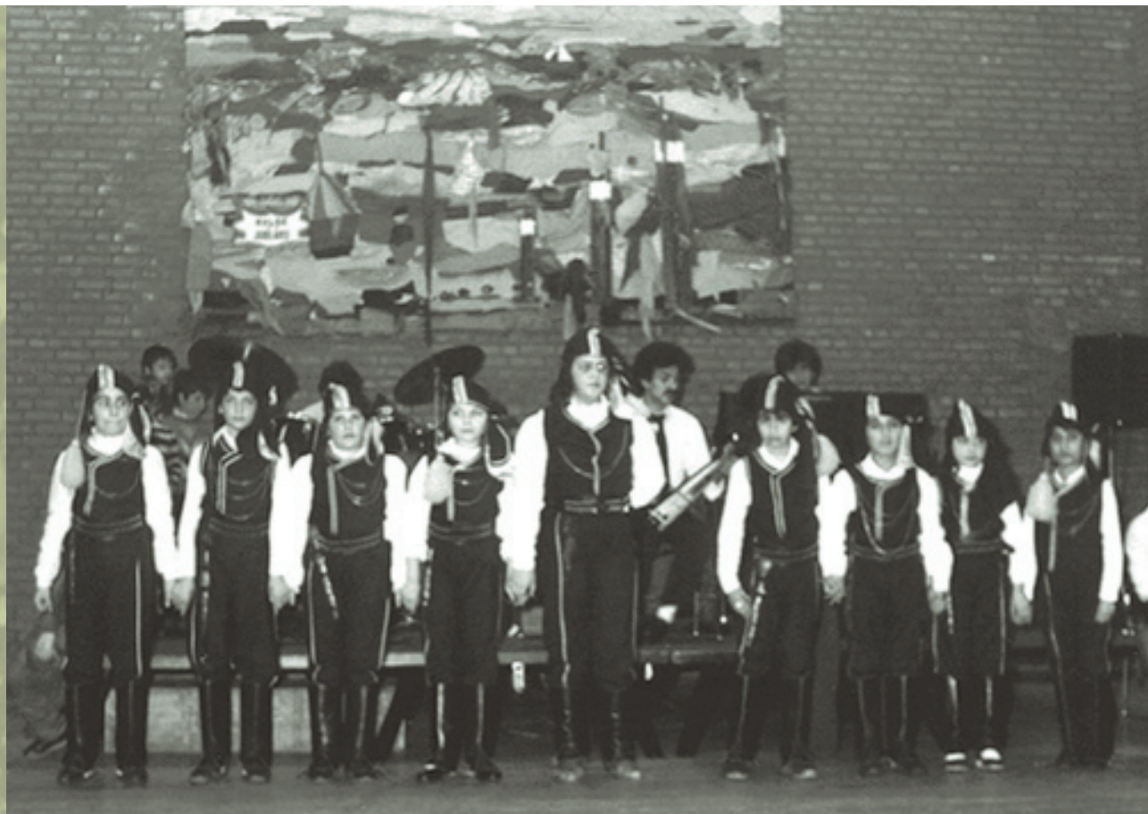
Η νέα γενιά του Συλλόγου Ποντίων Ουτρέχτης «Παναγία Σουμελά», σε χορευτική επίδειξη