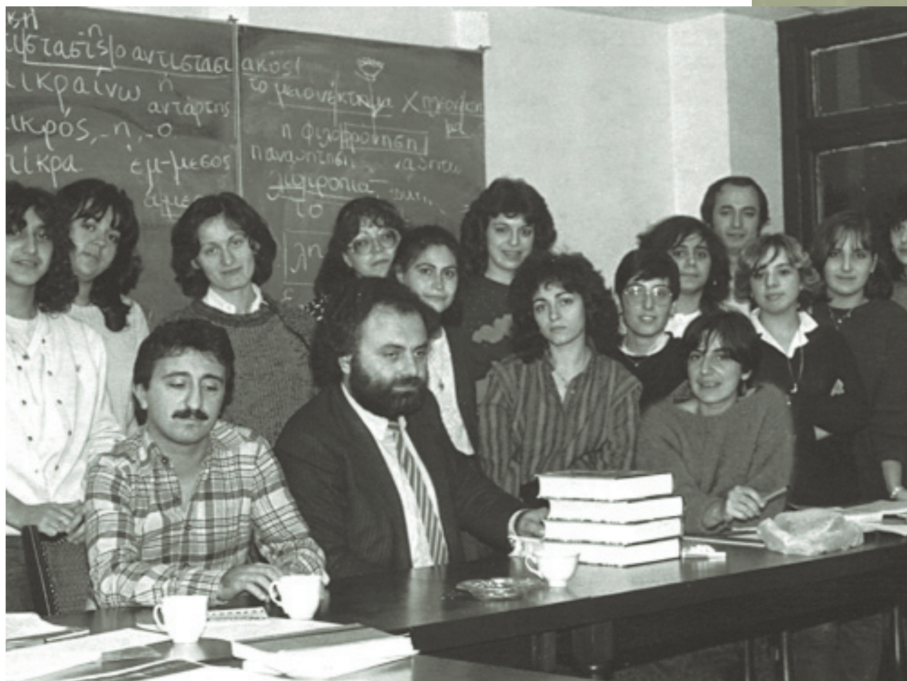
Μαθήματα ελληνικής γλώσσας που προσφέρει το Κέντρο Επιμόρφωσης και Διάπλασης Βρυξελλών