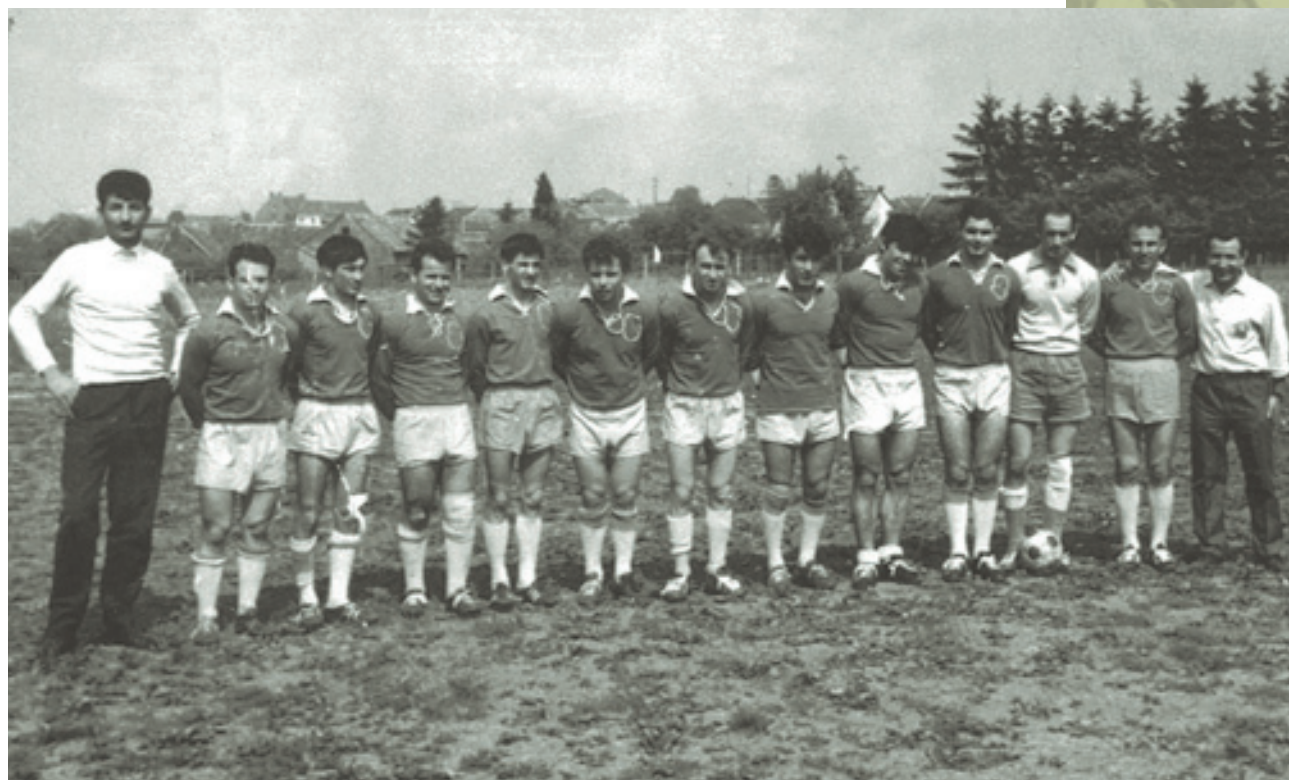
Ο ποδοσφαιρικός σύλλογος F.C. Hellas Βερβιέ, στα τέλη της δεκαετίας του 1950