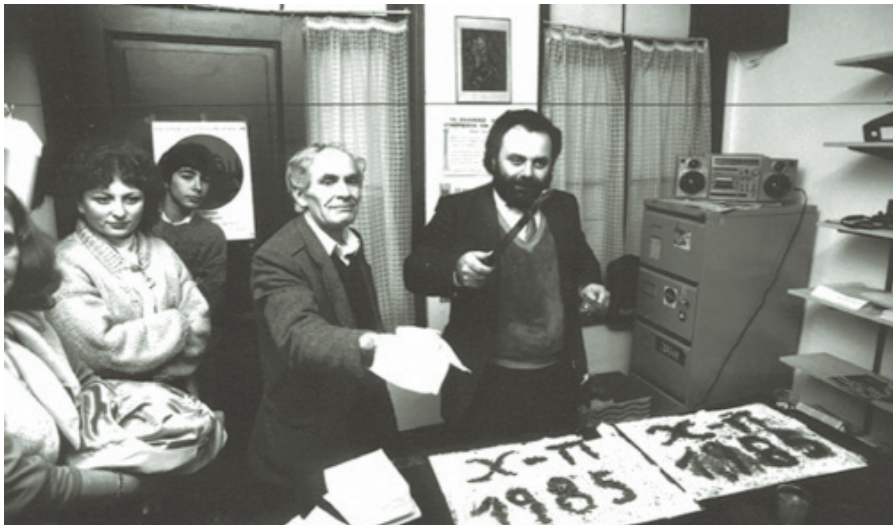
Από το κόψιμο της πρωτοχρονιάτικης πίτας του Κέντρου Επιμόρφωσης και Διάπλασης Βρυξελλών