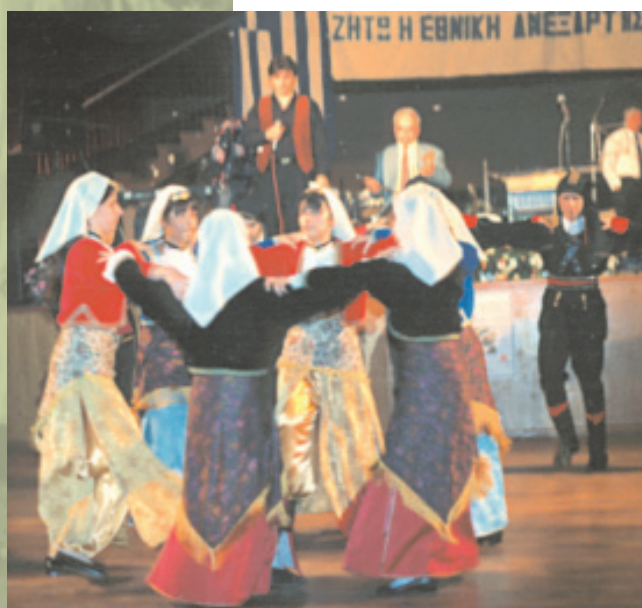
Από χορευτικές εκδηλώσεις του Συλλόγου Ποντίων Βρυξελλών