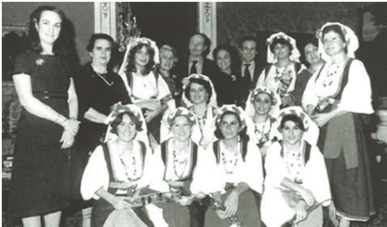
Παράρτημα του Λυκείου Ελληνίδων στην Αμβέρσα