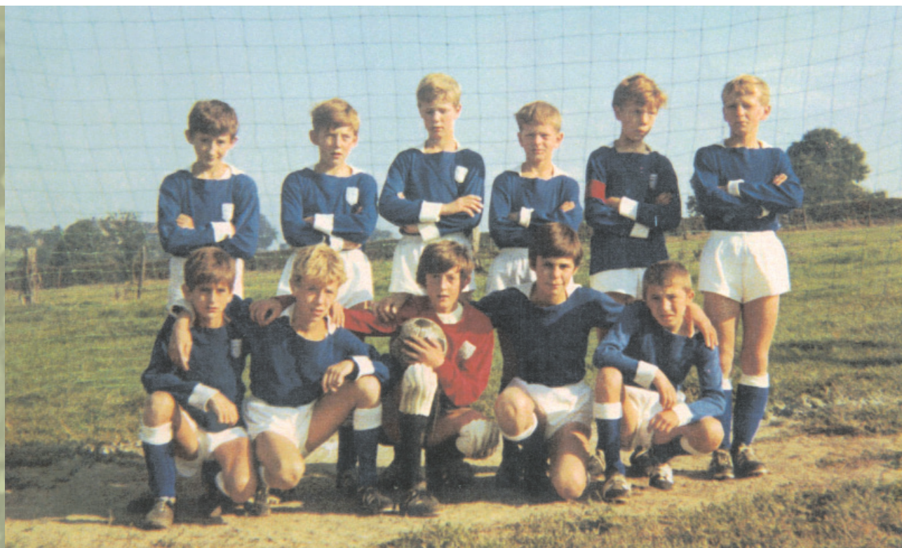
Οι μικροί του ποδοσφαιρικού συλλόγου F.C. Hellas Βερβιέ, κατά την περίοδο 1970-1971