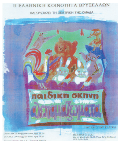
Μέσα στις δραστηριότητες της Ελληνικής Κοινότητας Βρυξελλών ανήκει και η δημιουργία θεατρικής ομάδας

Κάθε χρόνο γίνεται μια γενική συνέλευση των μελών, όπου το Διοικητικό Συμβούλιο κάνει απολογισμό των πράξεων για τη χρονιά που πέρασε και υποβάλλει για έγκριση το πρόγραμμα και τις δραστηριότητες για τη νέα χρονιά.