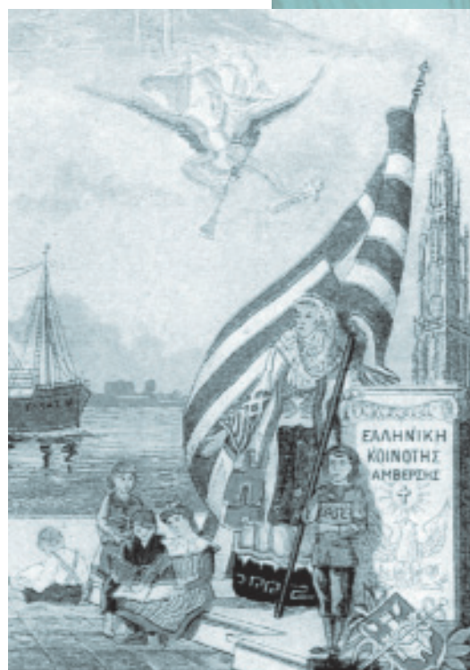
Η Ελληνική Κοινότητα της Αμβέρσας που ιδρύθηκε το 1900, είναι η παλαιότερη στις Κάτω Χώρες. Η κάρτα τυπώθηκε το 1919

Στα πλαίσια των δραστηριοτήτων της Κοινότητας αναφέρεται η φιλανθρωπική της δράση στους άπορους Έλληνες ναυτικούς και η λειτουργία πρωτοβάθμιας «Ελληνικής Σχολής», που ιδρύθηκε το φθινόπωρο του 1911 και λειτούργησε για τρία χρόνια. Μετά τον Β' παγκόσμιο πόλεμο οι δραστηριότητες της Κοινότητας αυξήθηκαν και ταυτόχρονα έγινε ένα φανερό άνοιγμα προς τη βελγική κοινωνία.