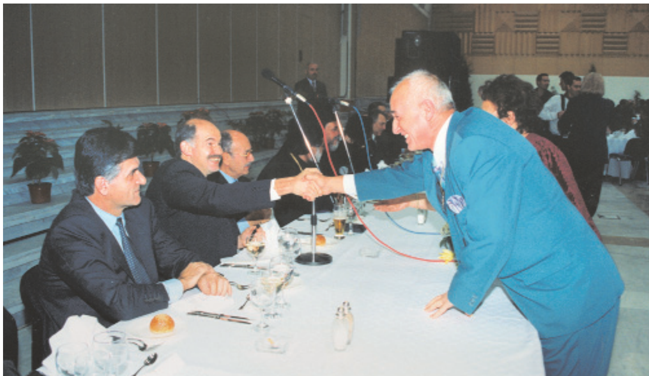
Ο πρόεδρος της Ομοσπονδίας ως αντιπροσωπευτικός φορέας του Ελληνισμού της Ολλανδίας στο Συνέδριο Αποδήμου Ελληνισμού (ΣΑΕ)