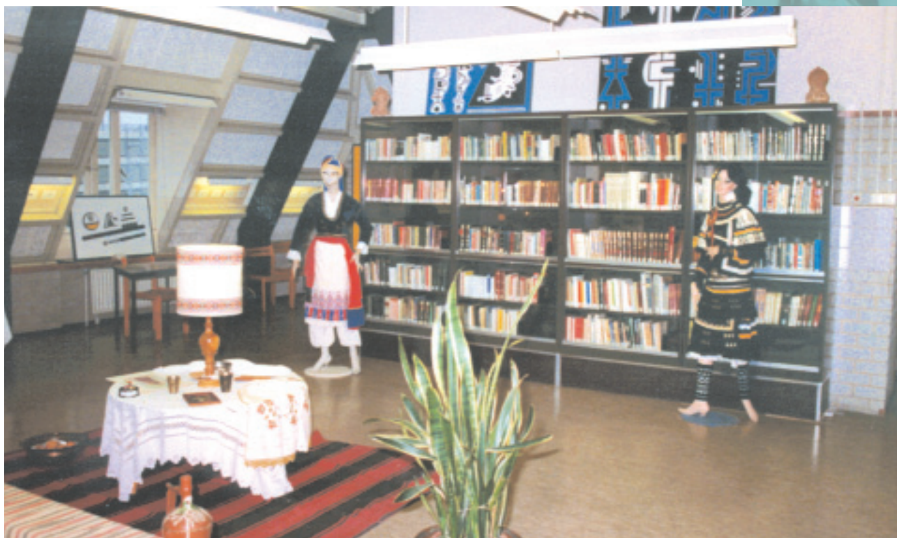
Η αίθουσα βιβλιοθήκης της Ελληνικής Κοινότητας Ουτρέχτης και περικώρων