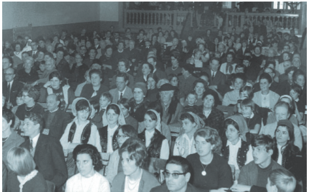
Στην κοινότητα τα μέλη βρίσκουν συναισθηματική υποστήριξη ως εθνοπολιτισμική μειονότητα

Η Ελληνική Κοινότητα της Ουτρέχτης «Αναγέννηση» είναι αυτή που αριθμεί τα περισσότερα μέλη στην Ολλανδία. Το Διοικητικό Συμβούλιο αποτελείται από 9 μέλη τα οποία εκλέγονται κάθε δύο χρόνια σε γενικές εκλογές, στις οποίες συμμετέχουν όλα τα μέλη της Κοινότητας.