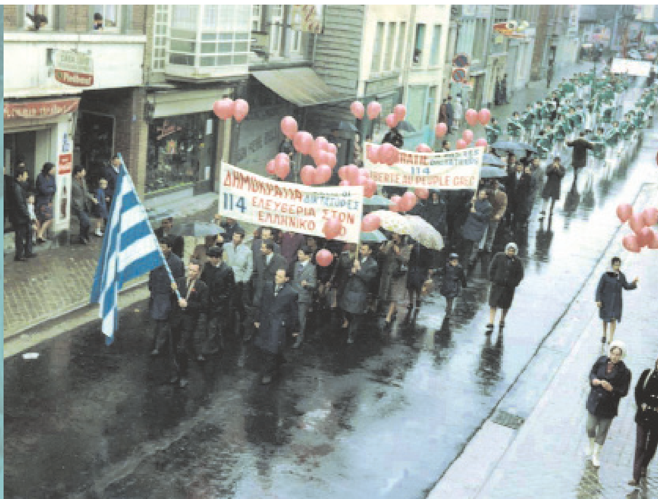
Οι Έλληνες του Βελγίου διαμαρτύρονται κατά της δικτατορίας στην Ελλάδα