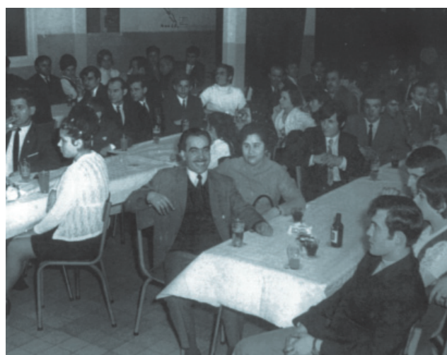
Μέλη και φίλοι της Κοινότητας Βερβιέ σε ελληνικό γλέντι