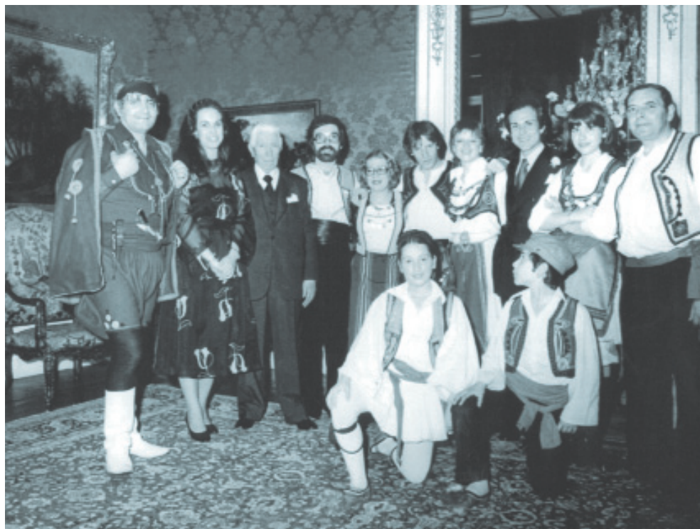
Η κοινότητα της Αμβέρσας γιορτάζει την εθνική επέτειο της 25ης Μαρτίου (1977)

Με τον ερχομό των πρώτων Ελλήνων ανθρακωρύχων η Κοινότητα φρόντισε για την κάλυψη των πνευματικών αναγκών τους, διαθέτοντας τον ιερέα της για την τέλεση ιερουργιών στις περιοχές όπου εγκαταστάθηκαν.