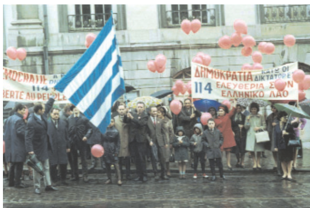
Κατά τη διάρκεια της δικτατορίας η Κοινότητα Αμβέρσας ανέλαβε αντιδικτατορική δράση