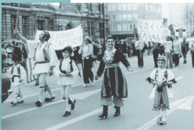
Αντιδικτατορική διαδήλωση στην Αμβέρσα με πρωτοβουλία της Ελληνικής Κοινότητας

Το 1970 υπερψήφισε πρόταση του προξένου για ίδρυση «Στέγης Ελλήνων Ναυτικών» με σκοπό την κάλυψη διαφόρων αναγκών των ναυτικών της πόλης και για τη σύσφιγξη των σχέσεων με τους Βέλγους.