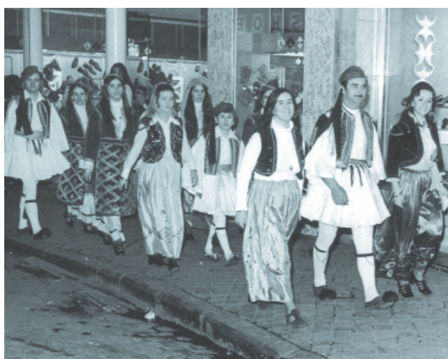
Ένα από τα έργα της Κοινότητας είναι ο εορτασμός των εθνικών επετείων