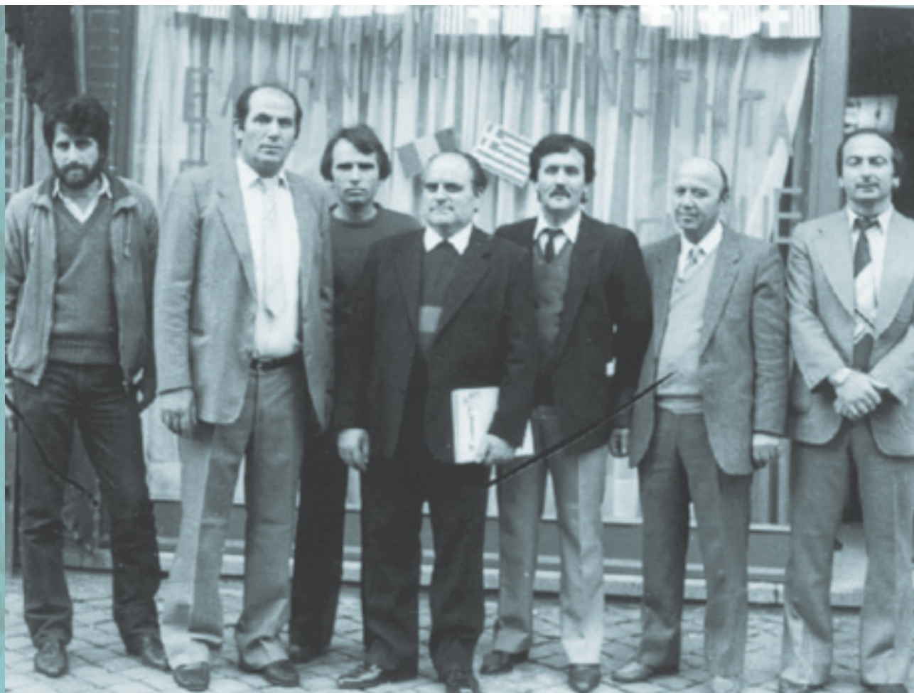
Ένα από τα διοικητικά συμβούλια της Κοινότητας Βερβιέ