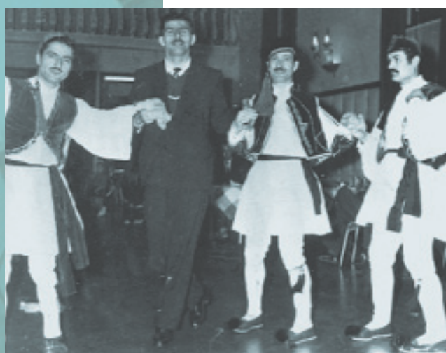
Οι Ελληνικές Κοινότητες του εξωτερικού προσπάθησαν, από τα πρώτα χρόνια της μετανάστευσης, μέσα από διάφορες δραστηριότητες να τονώσουν την πολιτισμική ταυτότητα των μελών τους