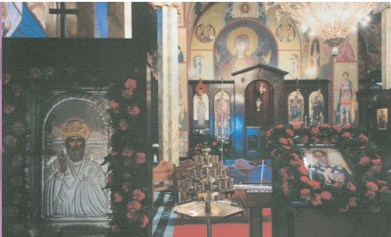
Εσωτερικά ο ναός του Αγίου Νικολάου Ρότερταμ είναι σήμερα ιστορημένος με πλήρες εικονογραφικό πρόγραμμα