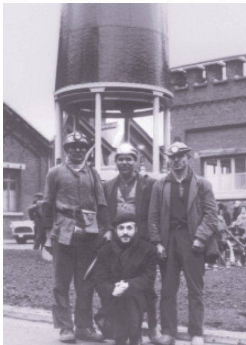
Ο ιερέας της πόλης Μονς μαζί με ανθρακωρύχους. Η εκκλησία ανάλαβε από νωρίς κοινωνική δράση στα δύσκολα χρόνια του ξενιτεμού (1960)

Το βελγικό κράτος αναγνώρισε με Νόμο το 1985 την ελληνορθόδοξη Εκκλησία. Μητροπολίτης Βελγίου είναι ο Σεβασμιότατος κ. Παντελεήμων. Αρχιερατικά προϊστάμενος για όλη την Ολλανδία είναι ο Θεοφιλέστατος Επίσκοπος Ευμενείας κ. Μάξιμος, βοηθός επίσκοπος της Ιεράς Μητροπόλεως.