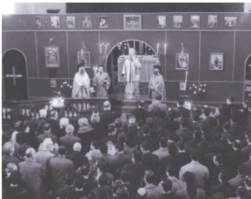
Η πρώτη θεία λειτουργία στην ελληνορθόδοξη εκκλησία της Αγίας Βαρβάρας Λιέγης (1965)