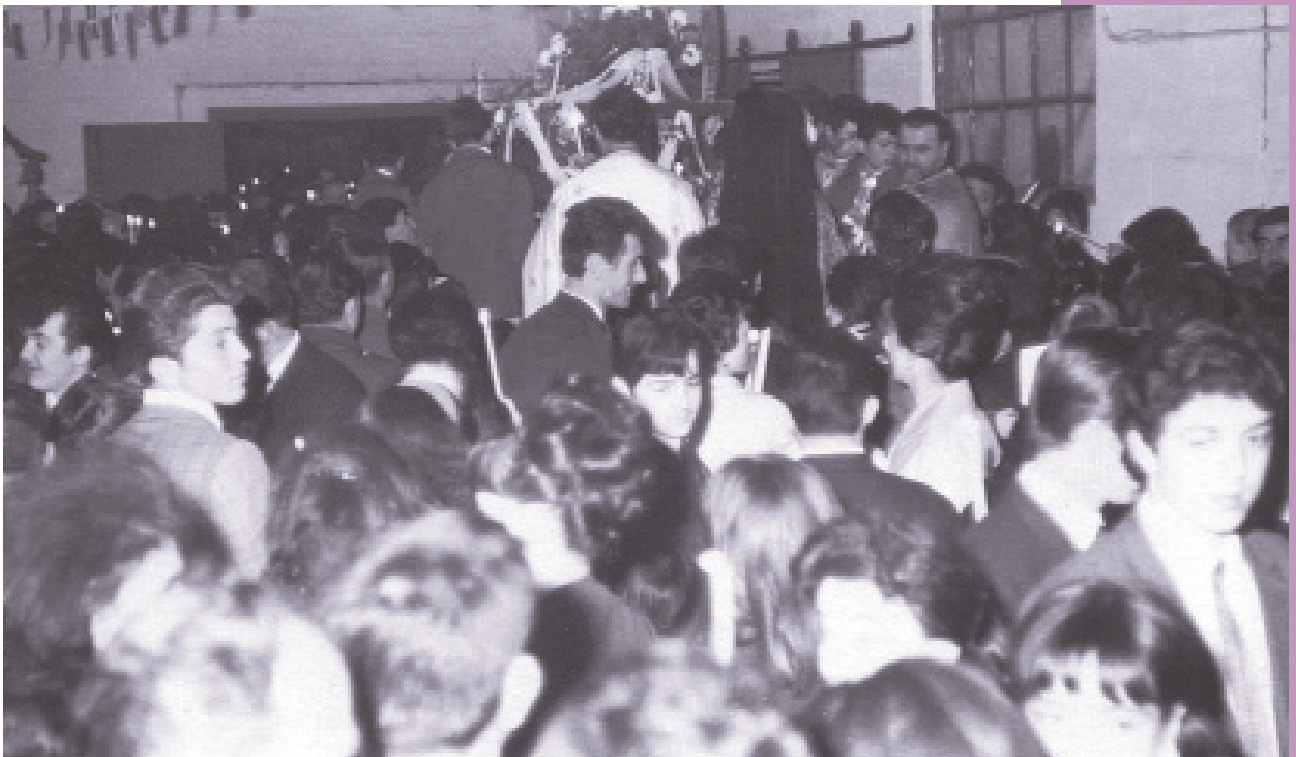
Η αναστάσιμη ακολουθία στην εκκλησία της Αγίας Βαρβάρας Σαρλερουά (1961)