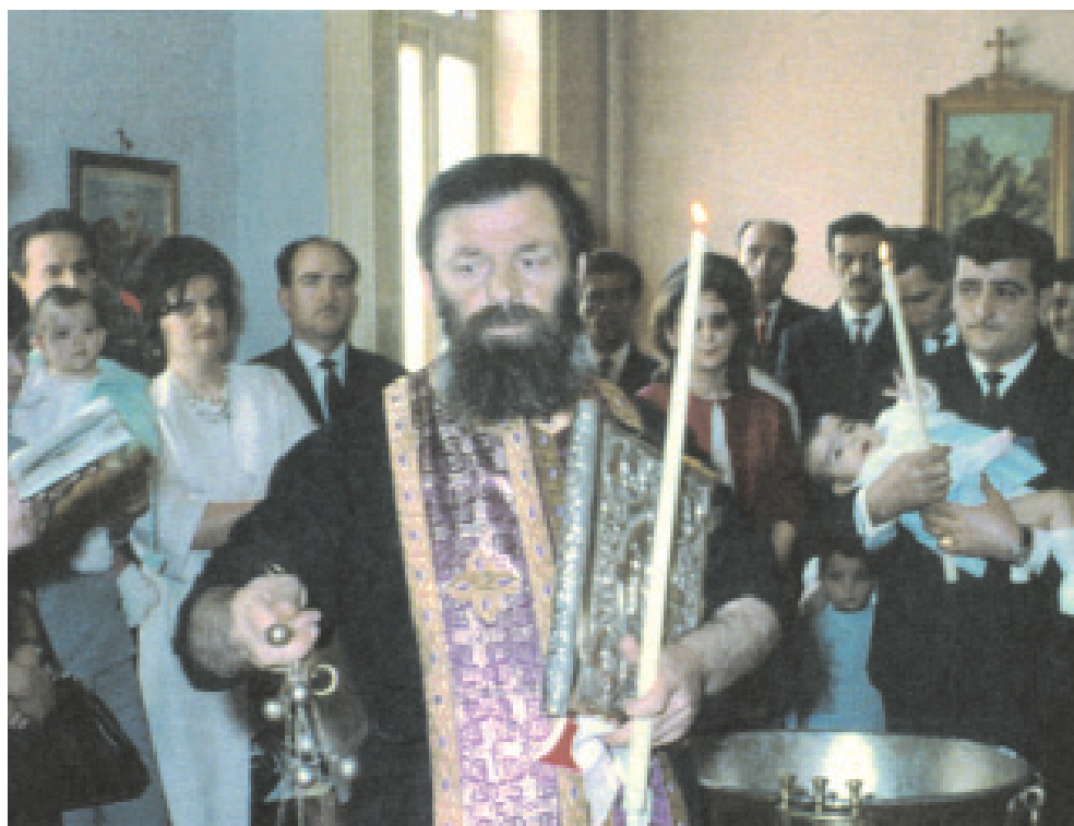
Ορθόδοξη βάφτιση στο Βερβιέ