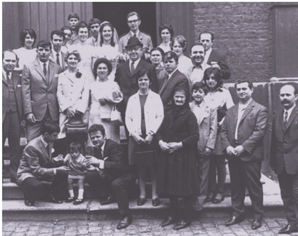
Ελληνοβελγικός γάμος (1971)