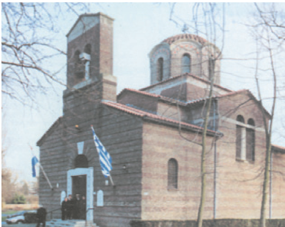
Ο ναός του Αγίου Νικολάου στο Ρότερνταμ είναι ένα κομψό πλινθόκτιστο δείγμα νεοβυζαντινού ρυθμού