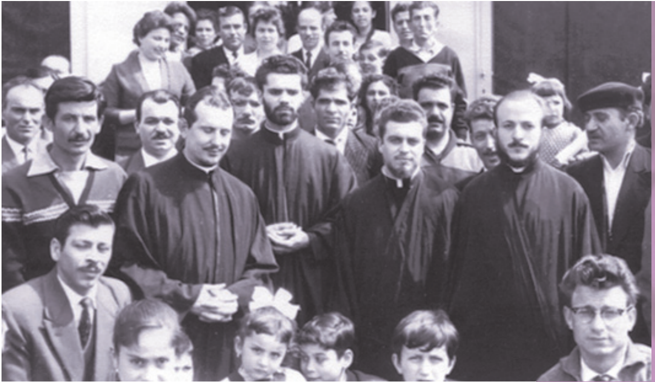
Οι πρώτες ελληνορθόδοξες εκκλησίες στο Βέλγιο λειτουργούσαν σε παραπήγματα. Εδώ κληρικοί και λαϊκοί μπροστά σε παράπηγμα στο Ressaix μετά το τέλος της θείας λειτουργίας (1958)