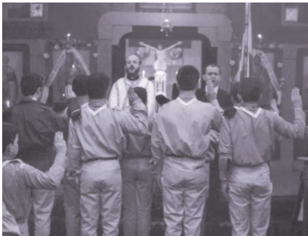
Η εκκλησία δημιούργησε το 1965 μια «Ελληνική Προσκοπική Κίνηση»