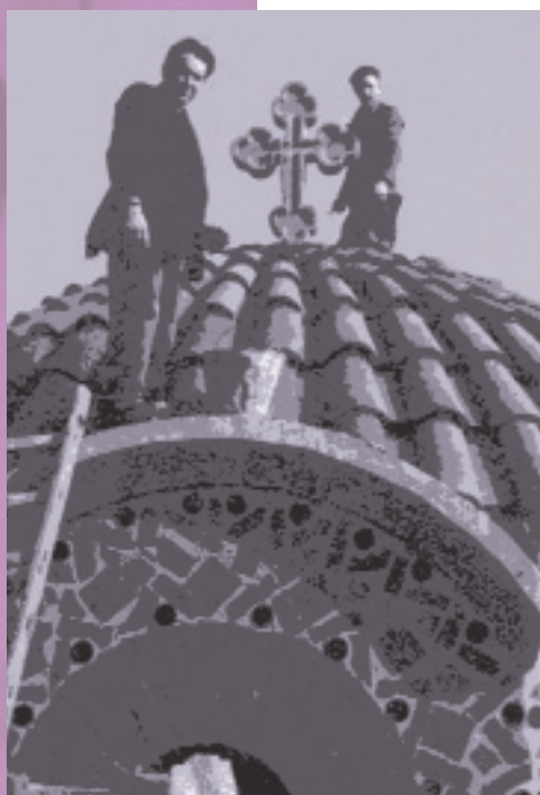
Με τη στερέωση του λίθινου σταυρού στον τρούλο, ολοκληρώθηκε η οικοδόμηση του ναού του Αγίου Νικολάου Ρότερνταμ το 1957

Προπολεμικά έμεναν στην Ολλανδία ελάχιστοι Έλληνες και για τις θρησκευτικές τους ιεροτελεστίες χρησιμοποιούσαν σπίτια ιδιωτών ή χώρους εργασίας και καλούσαν ιερέα από την Αμβέρσα του Βελγίου. Το 1947 αποφασίστηκε από το Διοικητικό Συμβούλιο της πρώτης οργανωμένης Ελληνικής Κοινότητας στο Ρότερνταμ, της «Ένωσης Ελλήνων Ολλανδίας», να ζητηθεί η βοήθεια του δήμου για ανέγερση εκκλησίας.