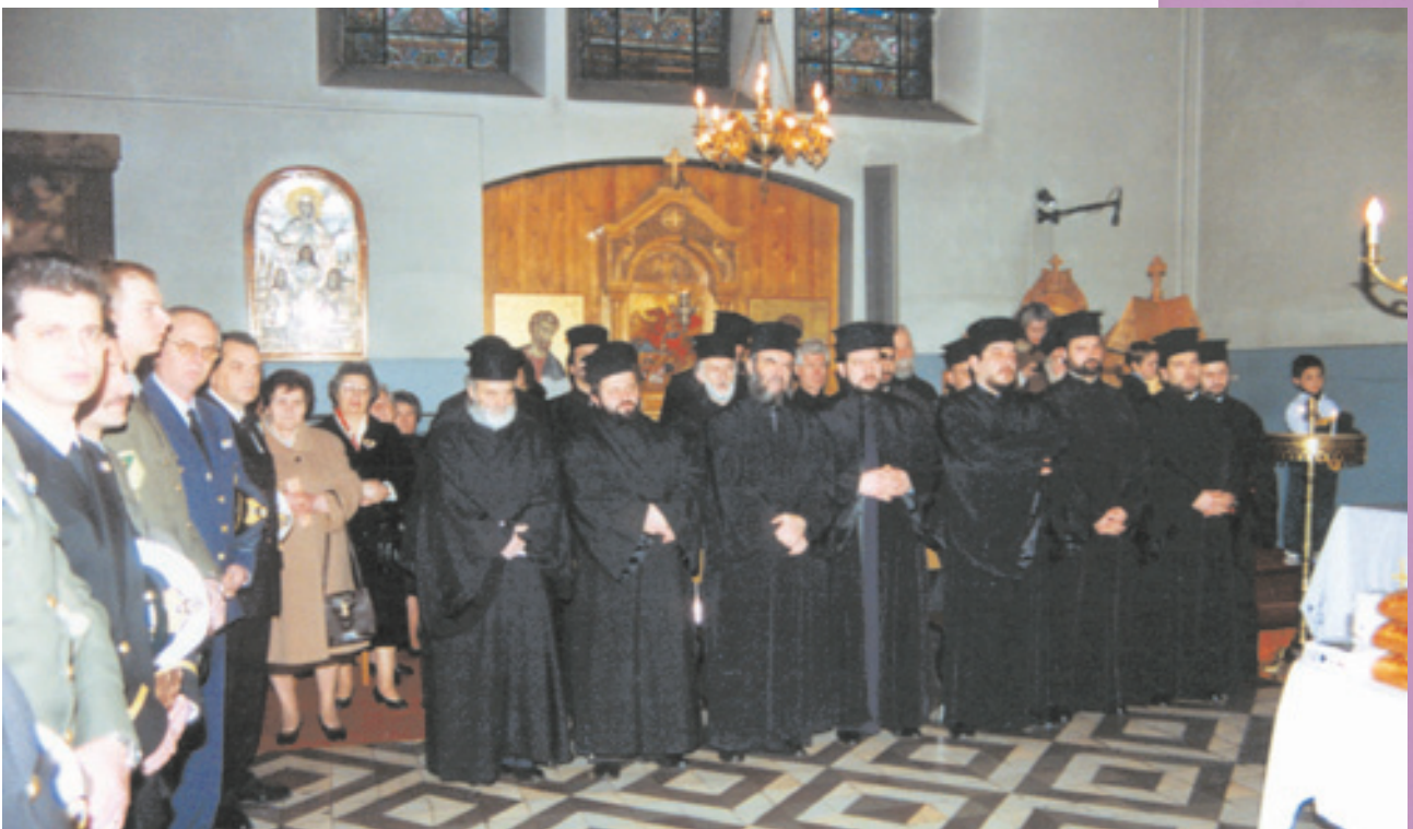
Ιερείς και υπάλληλοι της Ευρωπαϊκής Ένωσης στο μητροπολιτικό ναό Βρυξελλών