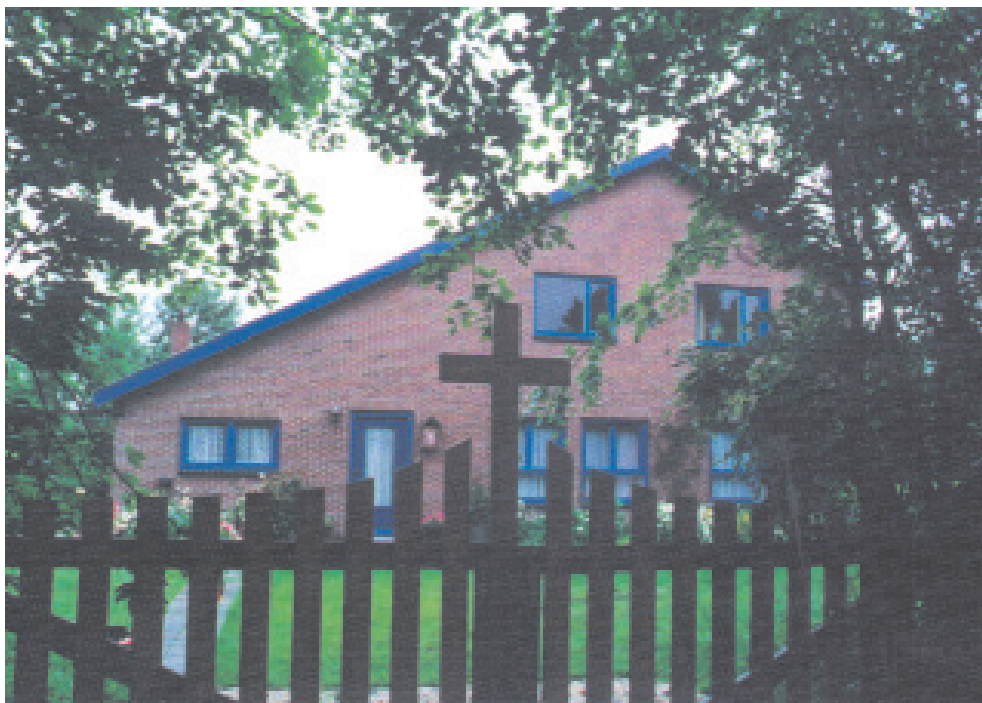
Το ελληνορθόδοξο μοναστήρι του Γενεθλίου της Θεοτόκου στην πόλη Άστεν

Ανάμεσα στα μεγάλα αγροκτήματα και τις καλλιεργήσιμες εκτάσεις της επαρχίας Μπράμπαντ κοντά στην πόλη Άστεν, βρίσκεται το ελληνορθόδοξο μοναστήρι του «Γενεθλίου της Θεοτόκου».