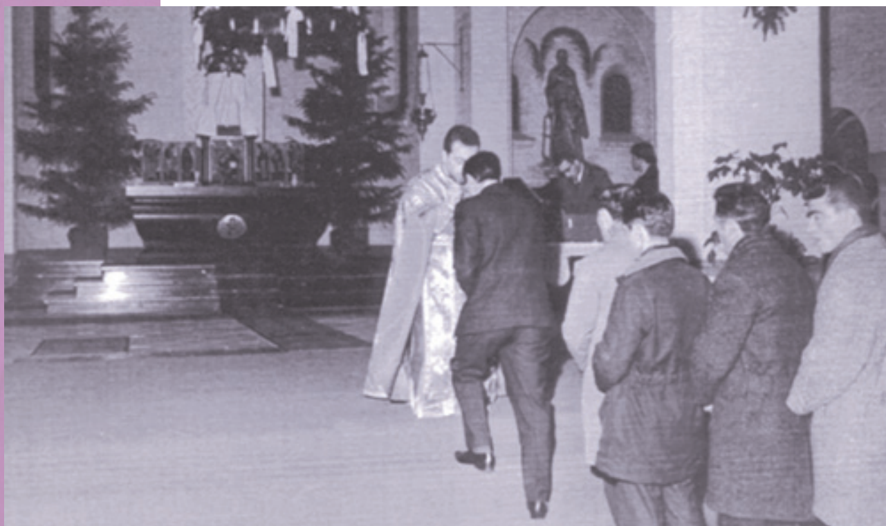
Θεία λειτουργία σε καθολική εκκλησία στο χωριό Μπεστ για τους Έλληνες εργάτες (1963)