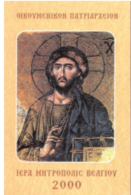
Εγκόλπιο που εκδίδεται από την Ιερά Μητρόπολη Βελγίου και Εξαρχία Κάτω Χωρών και Λουξεμβούργου