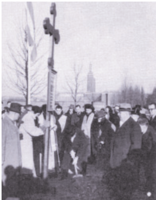
Στις 4 Φεβρουαρίου 1954 μπήκε ο θεμέλιος λίθος της εκκλησίας του Αγίου Νικολάου Ρότερνταμ, από τον πρωθυπουργό της Ελλάδας Αλέξανδρο Παπάγο

τοίχοι της εκκλησίας παρέμειναν για πολλά χρόνια γυμνοί. Η αποπεράτωση του αγιογραφικού έργου έγινε το 1995.