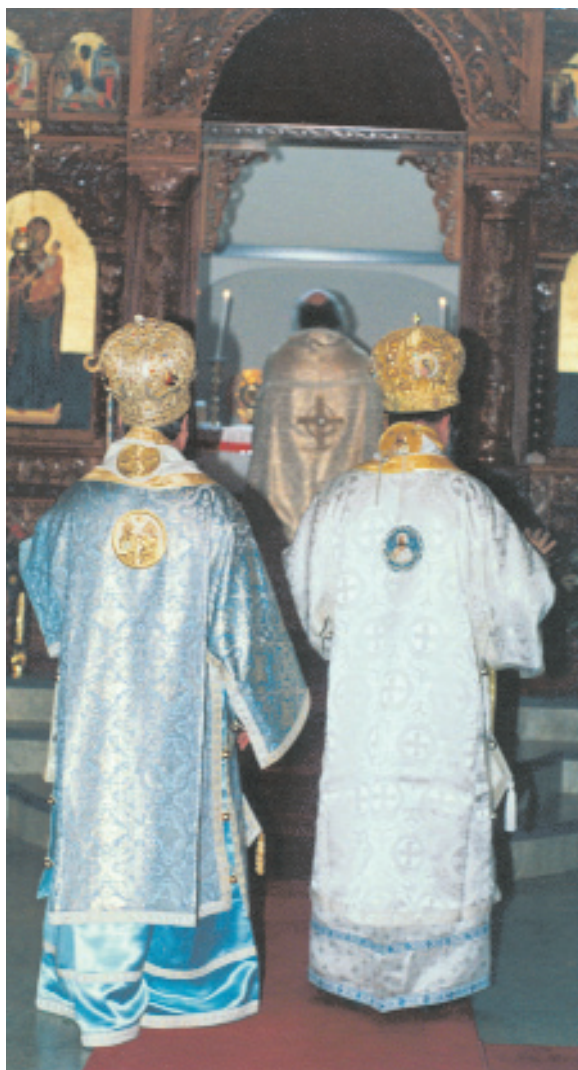
Από τα εγκαίνια του ναού του Ευαγγελισμού της Θεοτόκου

Με την ίδρυση της Ελληνικής Κοινότητας Ουτρέχτης το 1976 ξεκίνησε και η πρωτοβουλία σχηματισμού εκκλησιαστικής επιτροπής με σκοπό την ίδρυση ορθόδοξης ενορίας.