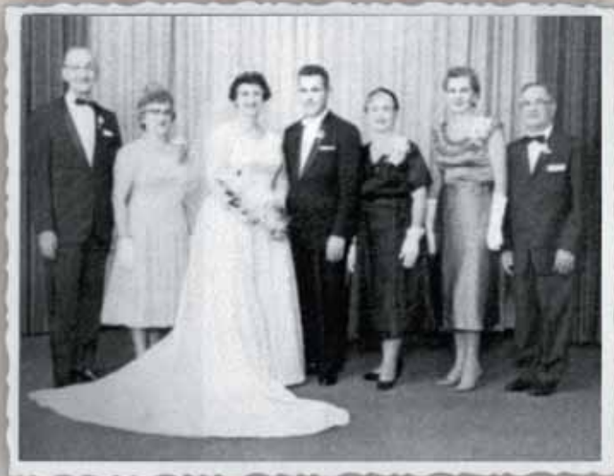
Άλλη μια αναμνηστική φωτογραφία με τους νεόνυμφους και τις οικογένειές τους αμέσως μετά το μυστήριο του γάμου τους.