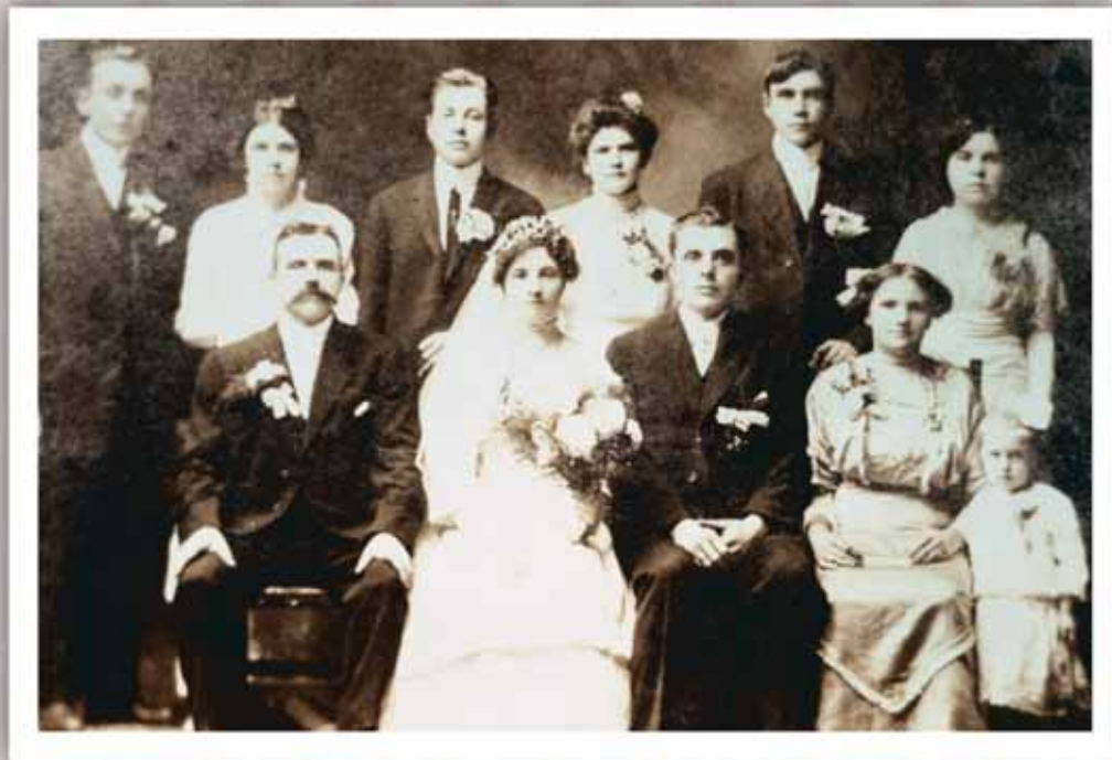
Γάμος στο Κονέκτικατ στις αρχές του 1900.