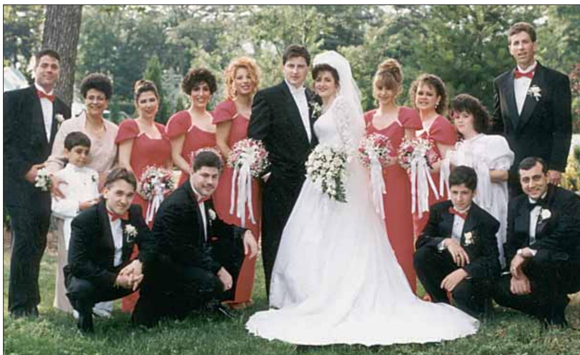
Ορθόδοξος ελληνικός γάμος και η αναμνηστική φωτογραφία έξω από την εκκλησία.