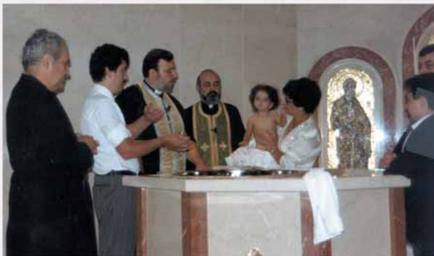
Το μυστήριο της βάφτισης.

Μια ακόμη μεγάλη οικογενειακή στιγμή είναι η ημέρα της βάφτισης του παιδιού. Είναι ημέρα χαράς, αφού το παιδί βαπτίζεται χριστιανός ορθόδοξος και παίρνει το όνομα του παππού ή της γιαγιάς, όπως συνηθίζεται στις ελληνικές οικογένειες. Μετά το μυστήριο της βάφτισης ακολουθεί το γλέντι.