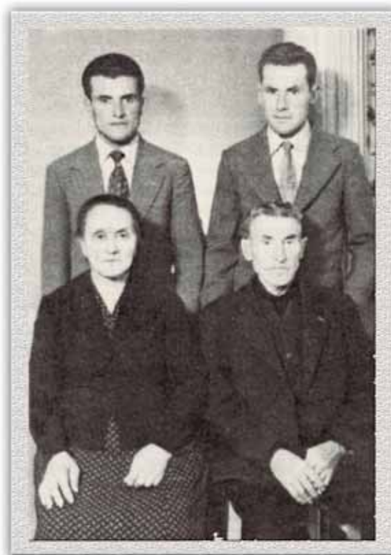
Δύο ακόμη περήφανοι Έλληνες γονείς, μετανάστες με τους δύο γιους τους στα μέσα του 20ού αιώνα. Βάση η οικογένεια.

Τη χαρά τους, μέσα στην εκκλησία και στο κέντρο διασκέδασης στο «Bridal party», η νύφη και ο γαμπρός, μοιράζονται με τους καλύτερους φίλους τους. Απαραίτητοι επίσης είναι το «ring boy», που κρατά τα δαχτυλίδια για να τα δώσει στον ιερέα να τα ευλογήσει, και το «flower girl» για τα πέταλα λουλουδιών που ρίχνουν στη νύφη.