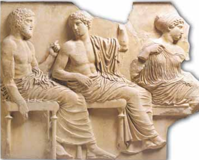
Ανάγλυφη παράσταση από τη ζωοφόρο του Παρθενώνα.