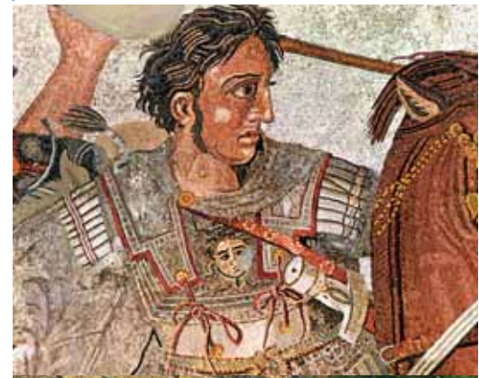
Ο Μέγας Αλέξανδρος.