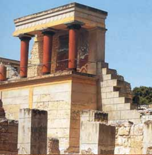
Το μινωϊκό ανάκτορο της Κνωσού.