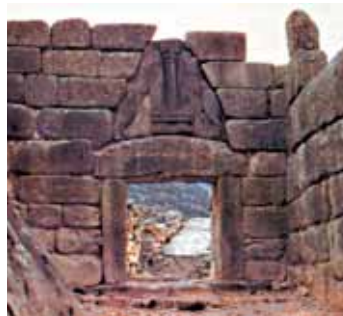
Η Πύλη των Λεόντων.