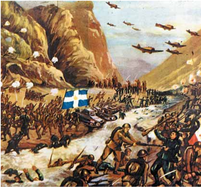
Οι Έλληνες πολεμούν γενναία τους Γερμανούς κατακτητές.

Σήμερα, πηγαίνοντας στην Ελλάδα, ζεις σε μια χώρα που συνεχώς προοδεύει. Είναι μέλος της Ευρωπαϊκής Ένωσης (European Union) έχει καλή οικονομία, οι άνθρωποι προοδεύουν και ο λαός της είναι δημιουργικός και ευτυχισμένος.