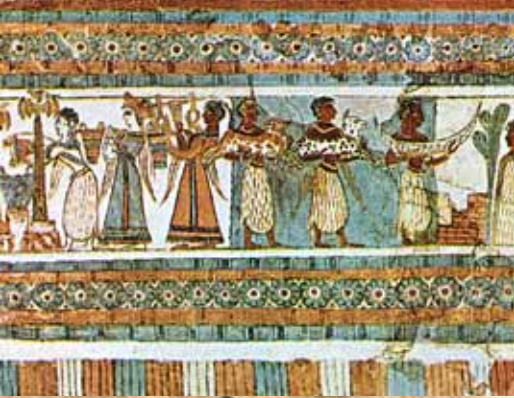
Η Σαρκοφάγος της Αγίας Τριάδος.