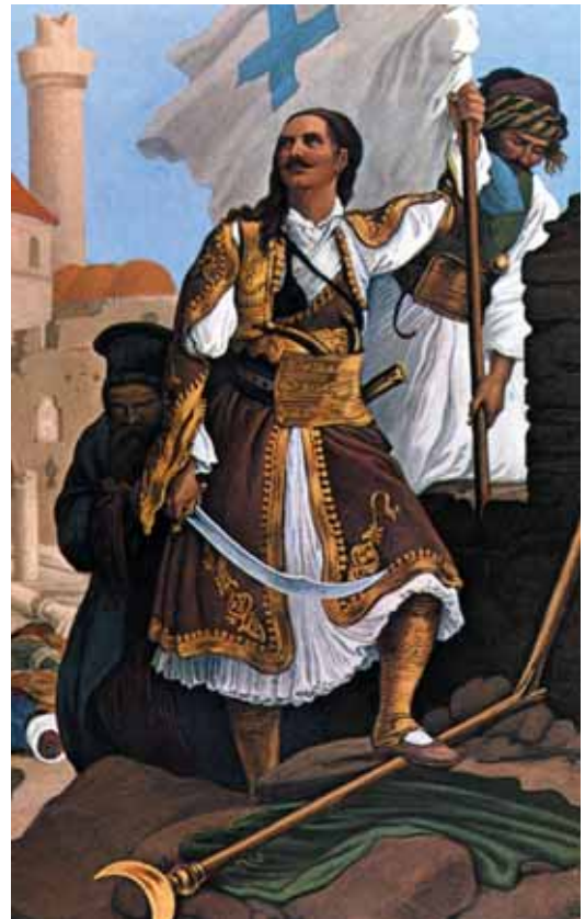
Ο ξεσηκωμός του γένους ενάντια στους Τούρκους.