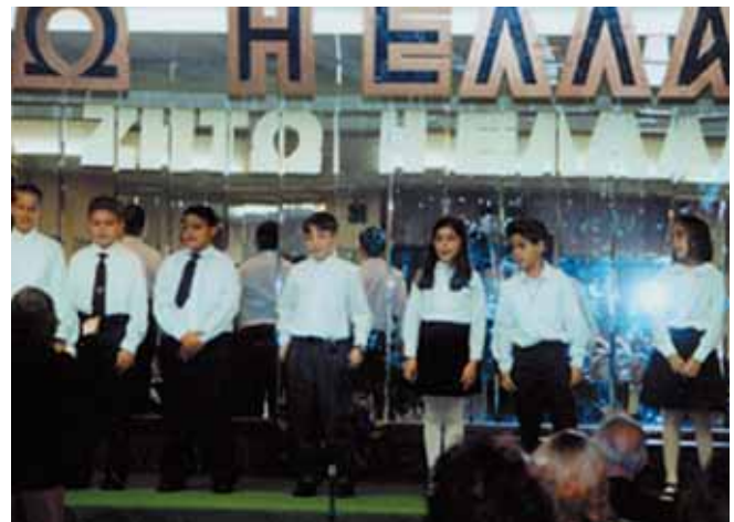
Τα ελληνόπουλα της Αμερικής γιορτάζουν την 25η Μαρτίου.

Λυπήθηκες για τα 400 χρόνια σκλαβιάς κάτω από τον τουρκικό ζυγό (1453-1821).