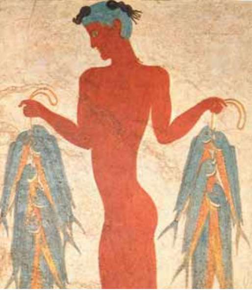
Ο Ψαράς, τοιχογραφία από τη Σαντορίνη.