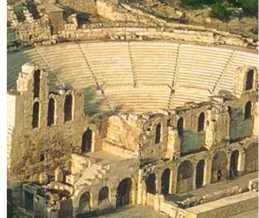
Θέατρο Ηρώδη του Αττικού.