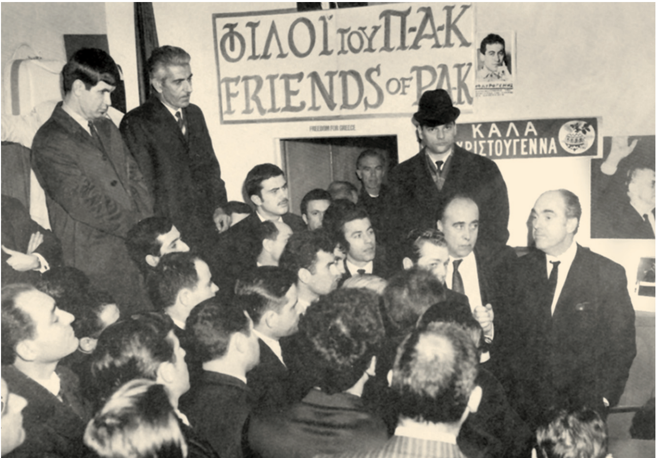
Ο πρόεδρος του ΠΑΚ αναλύει στον Καναδά την κατάσταση στην Ελλάδα (18 Δεκεμβρίου 1968)