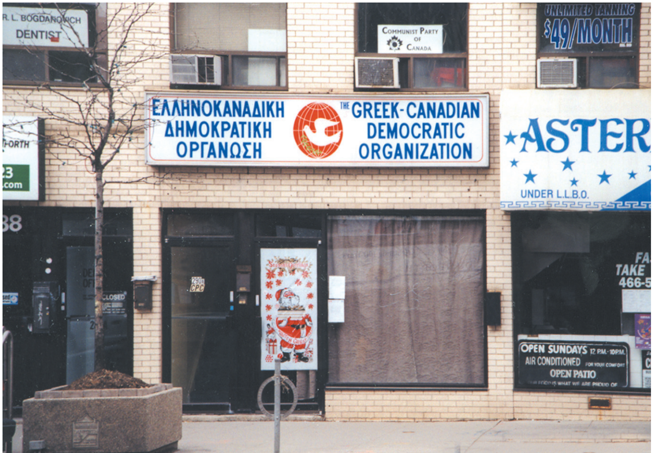
«Ελληνοκαναδική Δημοκρατική Οργάνωση». Η οργάνωση αυτή πρόκειται στο Κομμουνιστικό Κόμμα Ελλάδας και βρίσκεται στο Τορόντο.