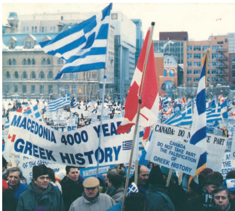
Συλλαλητήριο στην Οτάβα για το Μακεδονικό, 29 Φεβρουαρίου 1992.