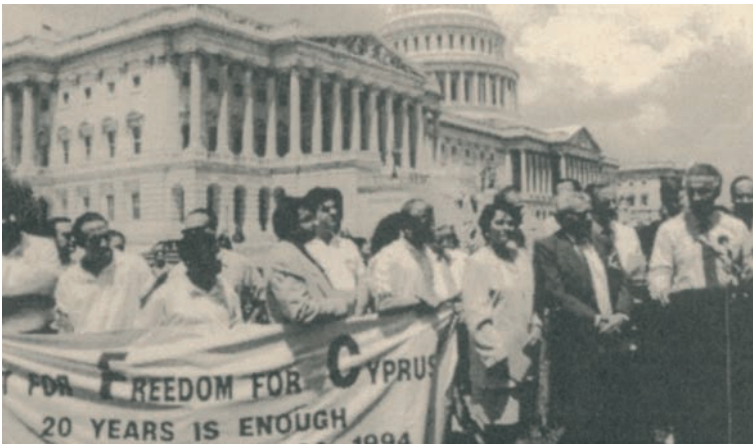
Εκδήλωση στην Ουάσιγκτον για τα 20 χρόνια εισβολής και τουρκικής κατοχής στην Κύπρο (1994)

Στη διάρκεια της δικτατορίας στην Ελλάδα (1967-1974) οργανώθηκαν διάφορες αντιδικτατορικές επιτροπές σε όλες τις παροικίες της διασποράς που αγωνίστηκαν για την αποκατάσταση της δημοκρατίας στην Ελλάδα. Έλληνες πολιτικοί εξόριστοι που ζούσαν σε διάφορες χώρες του εξωτερικού επισκέφτονταν συχνά τις παροικίες της διασποράς και συμμετείχαν στις κινητοποιήσεις εναντίον της δικτατορίας. Χαρακτηριστικές είναι οι περιπτώσεις της Μελίνας Μερκούρη και του Μίκη Θεοδωράκη που ζούσαν στο Παρίσι καθώς και του Ανδρέα Παπανδρέου που ζούσε στο Τορόντο.