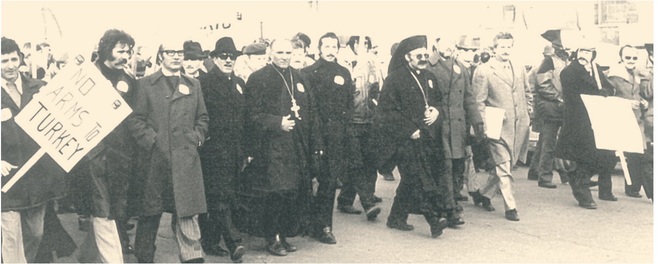
Μόντρεαλ 1975: συλλαλητήριο κατά της τουρκικής εισβολής στην Κύπρο.

Ο ελληνισμός της διασποράς έδειξε ξεχωριστό ενδιαφέρον για τον αγώνα της Κύπρου. Σε όλες τις μεγάλες πόλεις του κόσμου που ζουν Έλληνες σχηματίστηκαν επιτροπές αλληλεγγύης για το σκοπό αυτό. Έγιναν επίσης διαδηλώσεις, οργανώθηκαν συναντήσεις με πολιτικούς και γενικά εκφράστηκε συμπαράσταση στην Κύπρο. Μεγάλες κινητοποιήσεις έγιναν στη Νέα Υόρκη, την Ουάσιγκτον, το Τορόντο, το Μόντρεαλ, τη Μελβούρνη και το Σίδνεϋ. Εκδηλώσεις έγιναν επίσης και στις ευρωπαϊκές πρωτεύουσες και ιδιαίτερα στο Λονδίνο όπου ζουν χιλιάδες Κύπριοι.