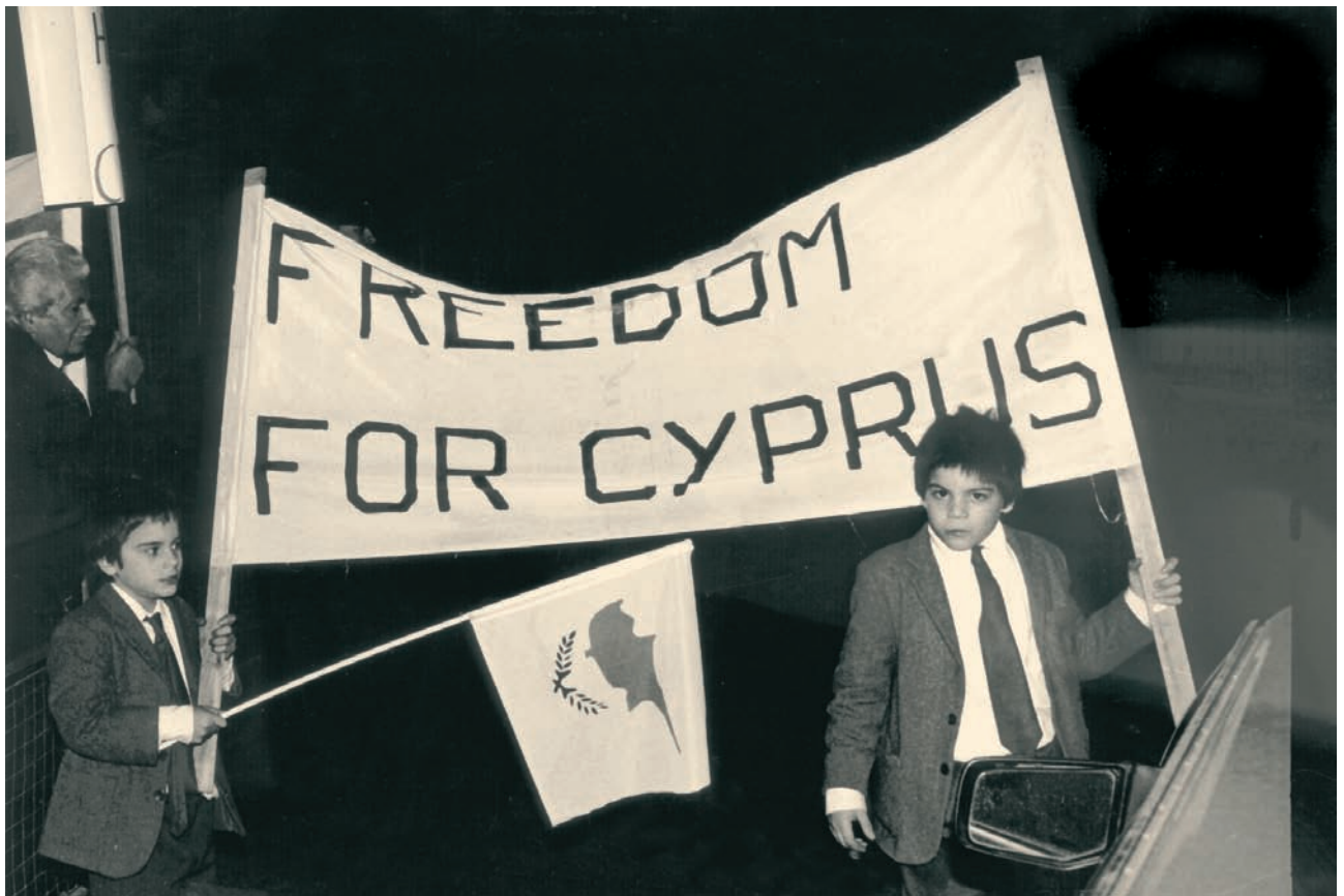
Συγκέντρωση διαμαρτυρίας στο Λονδίνο το 1975 για την τουρκική εισβολή και κατοχή στην Κύπρο.