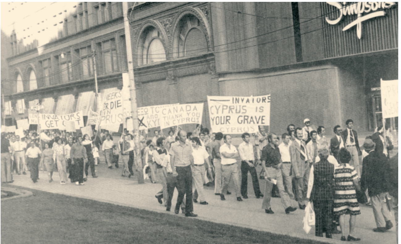
Τορόντο 1974: Διαδήλωση εναντίον της εισβολής των Τούρκων στην Κύπρο.