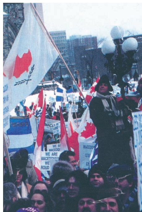
Από συλλαλητήριο για τη Μακεδονία, Τορόντο 18 Δεκεμβρίου 1968.