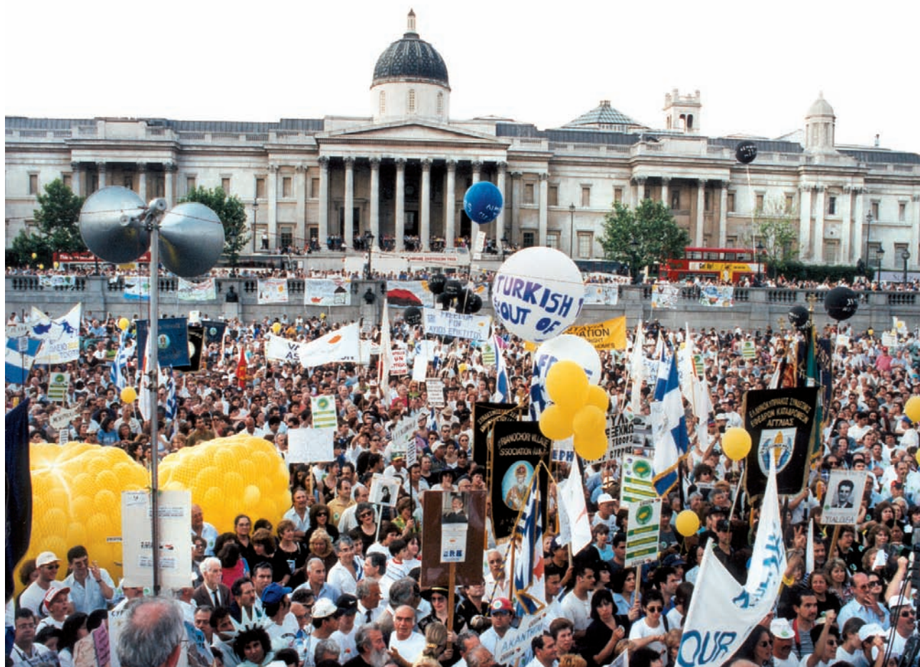
Εκδήλωση διαμαρτυρίας Κυπρίων στο Λονδίνο.