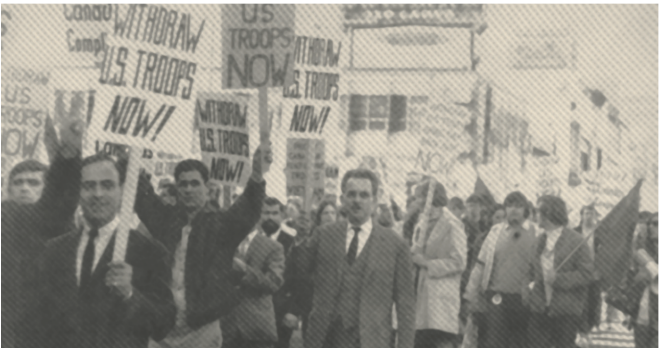
Τορόντο 1968: Διαδήλωση κατά της Χούντας.