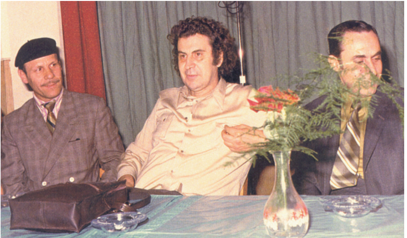
Επίσκεψη του Μίκη Θεοδωράκη το 1973 στην παροικία του Μόντρεαλ. Ο Θεοδωράκης ήταν από τους ιδρυτές του «Πατριωτικού Μετώπου».