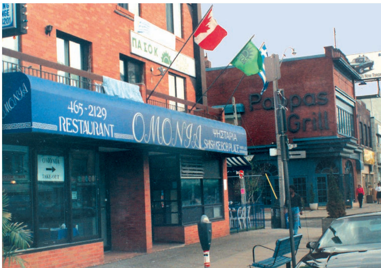
Η τοπική οργάνωση του ΠΑΣΟΚ στο Τorónton στον «ελληνικό» δρόμο Ντανφόρθ.

Η πολιτική ζωή και οργάνωση των Ελλήνων της διασποράς, μπήκε σε νέα φάση μετά την έναρξη λειτουργίας του Συμβουλίου Απόδημου Ελληνισμού (ΣΑΕ) το 1995.