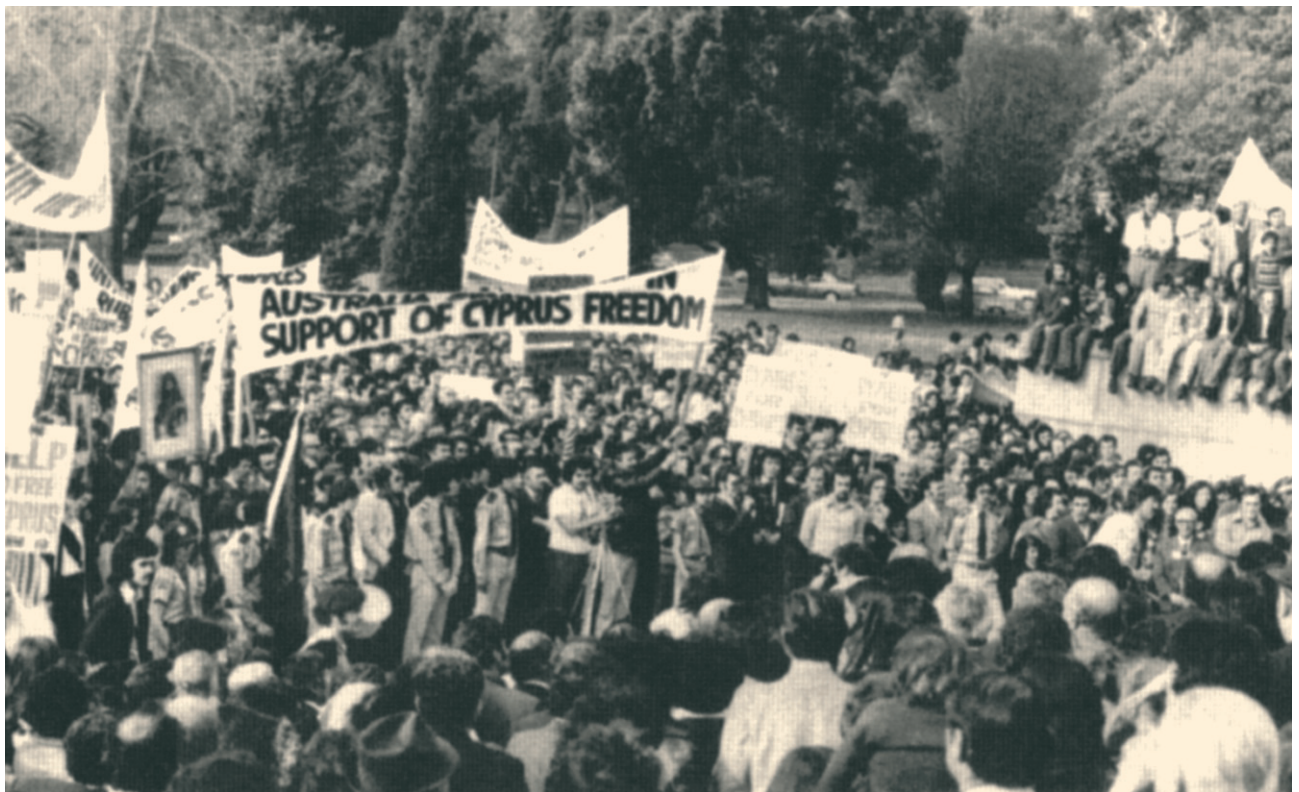
Διαμαρτυρία στη Μελβούρνη το 1975 για την τουρκική εισβολή και κατοχή στην Κύπρο.