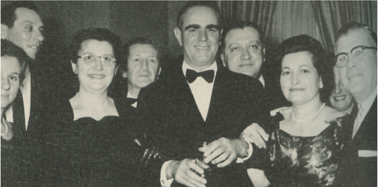
Ο Κωνσταντίνος Καραμανλής πραγματοποίησε επίσημη επίσκεψη στον Καναδά ως πρωθυπουργός το 1958. Στη φωτογραφία ανάμεσα σε Έλληνες του Μόντρεαλ.

Να σημειώσουμε επίσης, μιλώντας για πολιτική ζωή, τις επισκέψεις Ελλήνων πολιτικών στις παροικίες της διασποράς. Τις περισσότερες φορές πρόκειται για επίσημες επισκέψεις στις χώρες που ζουν οι Έλληνες της διασποράς. Όμως οι Έλληνες πολιτικοί περιλαμβάνουν πάντα στο πρόγραμμά τους και επισκέψεις στις ελληνικές παροικίες και συναντήσεις με τους συμπατριώτες τους. Όλοι οι Έλληνες πρωθυπουργοί από τη μεταπολίτευση και μετά επισκέφτηκαν τις Ηνωμένες Πολιτείες και οι περισσότεροι την Αυστραλία και τον Καναδά. Το ίδιο έκαναν την περίοδο αυτή και οι πρόεδροι της Ελληνικής Δημοκρατίας.