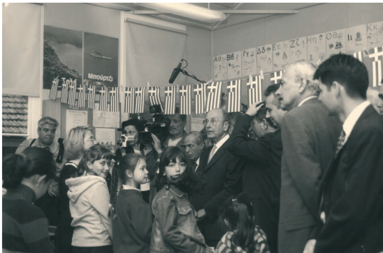
Από την επίσκεψη του Προέδρου της Ελληνικής Δημοκρατίας κ. Κωνσταντίνου Στεφανόπουλου σε απογευματινό σχολείο της Ελληνικής Κοινότητας Σύδνεϋ, Ιούνιος 2002.