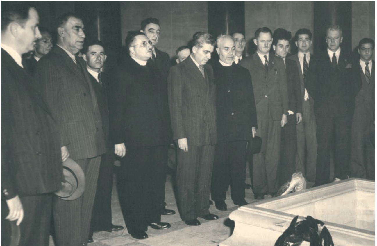
Οι Έλληνες της Αυστραλίας τιμούν με δοξολογίες και καταθέσεις στεφάνων στα Μνημεία Ηρώων της Αυστραλίας όλους εκείνους που αγωνίστηκαν για τη σωτηρία της Ελλάδας και εκείνους που θυσιάστηκαν.