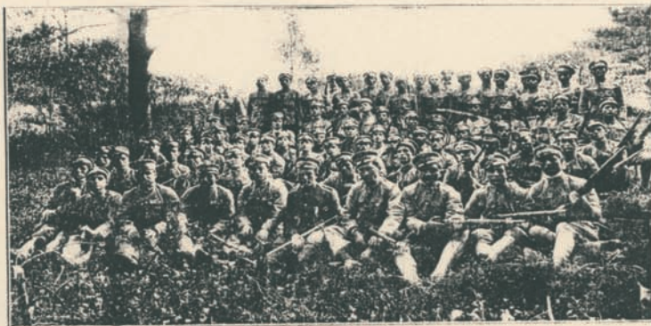
ΟΙ ΕΠΑΝΑΓΓΕΛΙΣΤΕΣ ΗΕΡΟΣ ΛΟΧΟΣ ΤΟΥ ΛΟΥΤΕΛΑ ΤΗΣ ΜΑΣΣΑΧΟΥΣΕΤΤΗΣ

Δ ΥΟ ΕΤΗ και τρεις μήνες παρήλθον αφ' ότου ο Έλληνας εθελοντής έδρασε τὰ παλαιότερον δοξασιμένα όπλα του προς διεκδίκησιν τής εθνικής του κληρονομίας και συνήγαγεν υπό τήν σημαίαν του τὰ φιλοπατριδα τέκνα του εκ των περσιτών τής γής εις Διπλακλήλους πολέμους κατά των προαιωνίων έχθρών του. Έκτοτε τὰ γεγονότα ενίσχυσαν τήν αυθεντικότητα του αξιώματος ότι μόνον διά χαλυβδίνης πυγμής θα άσκηθῆ τὸ Έθνος να επιτάλη τὰ δικαιά του, φέρον εις πέρας τὸ ε ρ γ ο ν τὸ όποιον, κατά τους λόγους του στρατηλάτου Βασιλέως Κωνσταντίνου, δὲν έτελειώσεν. Ο μέγας Ευρωπαϊκός πόλεμος είναι εν άνωμα τὸ όποιον δὲν θα διαλύσῃ τήν προσοχήν και τήν αγέλησιν των εθνών εναντιον τὰ όποια έχουσιν απόφασι να ε ρ γ ο υ σ ι. Καί ο μέγας διδάσκαλος του μαθήματος τούτου είναι τὸ ηρωϊκόν Ηίλιον, τὸ όποιον, με τήν ψυχήν εις τὰ χείλη, κραδαίνει ακόμη σ π ά θ η ν προμετρῶν εις χείρα νευρώδη και εξακολουθει να καταφέρη αυτήν κατά του έχθρου, άφου έμακαίωσε τὸ όλον στρατηγικόν του σχέδιον ενάρχη του πολέμου δι' αντιστάσεως άξίας μεγάλης στρατιωτικής Δυνάμεως. Η γείτων μας Σερβία, με τὰς προσφάτους έτι περιφανείς νίκας τής κατά των Λύ-