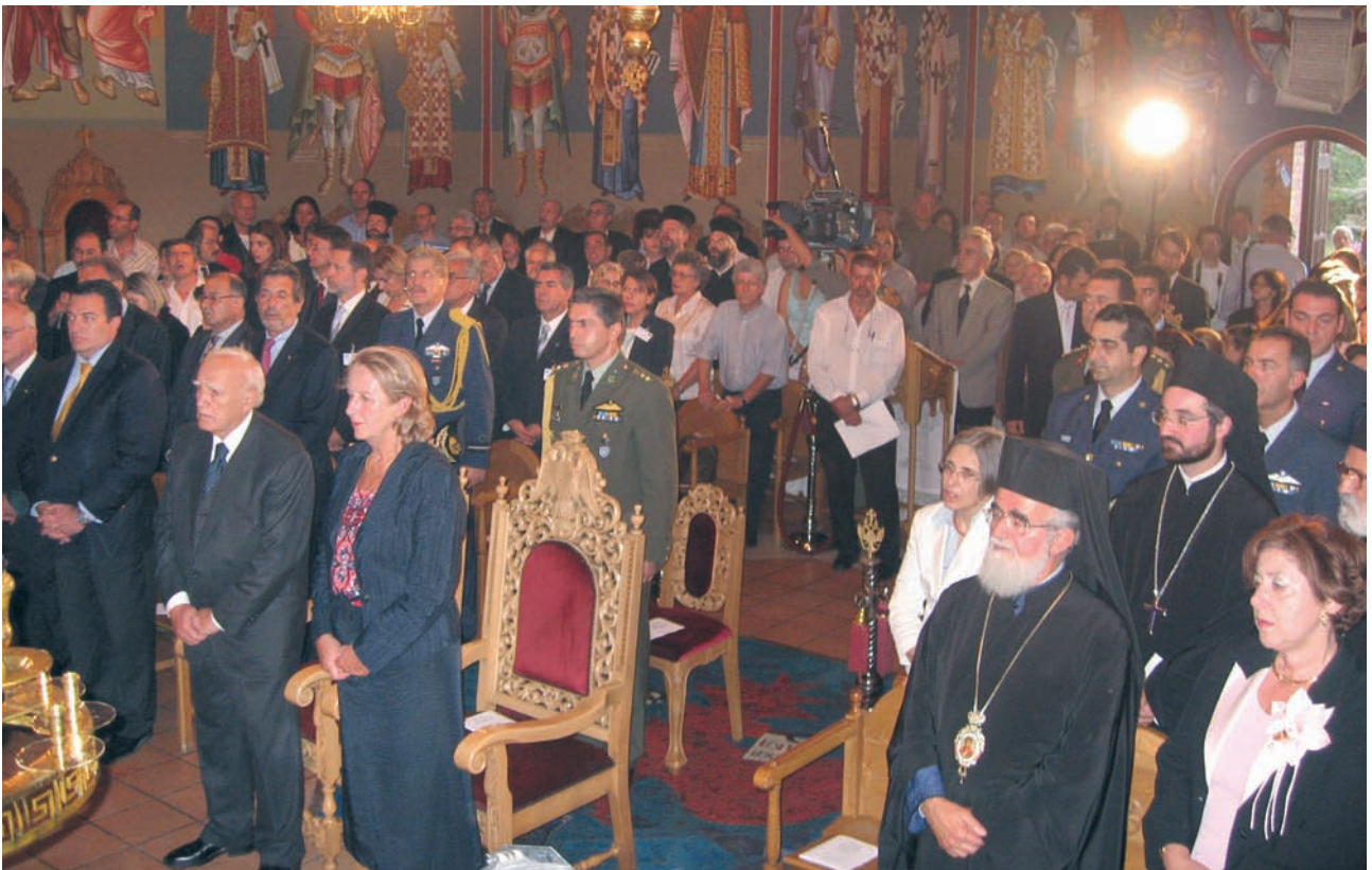
Υποδοχή του Προέδρου της Δημοκρατίας κ. Κάρλου Παπούλια και της συζύγου του Μαίη στην Ι. Μ. Γερμανίας στη Βόννη, το 2006.