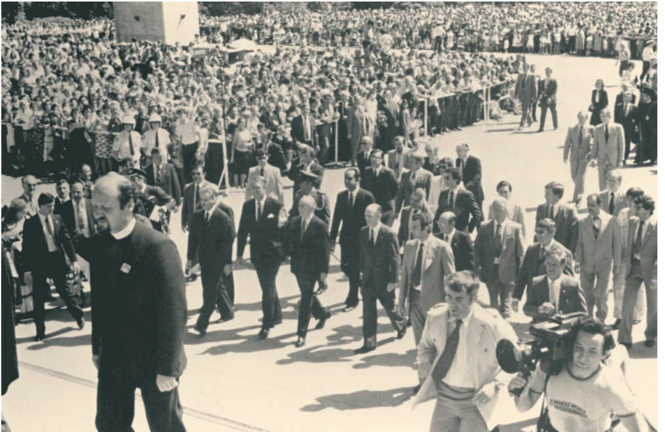
Ο Πρόεδρος της Ελληνικής Δημοκρατίας, Κ. Καραμανλής προσέρχεται στο Μνημείο του Αγνώστου Στρατιώτη, συνοδευόμενος από τον Πρωθυπουργό της Αυστραλίας, Malcolm Fraser, τον Πρωθυπουργό της Βικτώριας, L. Thompson, τον υπουργό Εξωτερικών της Ελλάδας και τον Έλληνα Πρέσβη, Μεμβούρνη 1982.