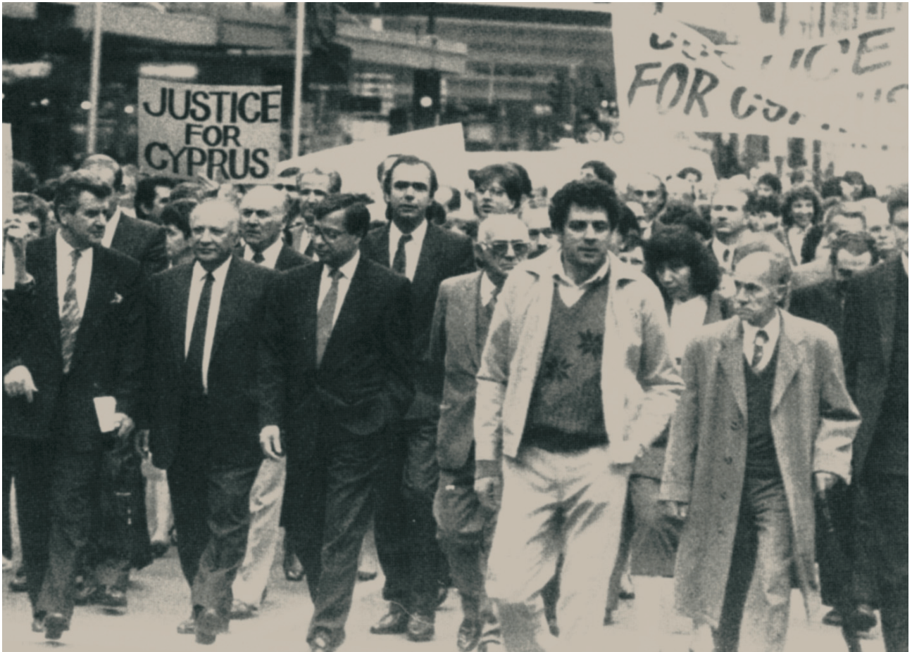
Ο Πρόεδρος της Κυπριακής Δημοκρατίας, Γλαύκος Κληρίδης με τον Υπάτο Αρμοστή της Κύπρου κ. Πυρίση και άλλους Κύπριους και Έλληνες ηγέτες το 1982 στην Αυστραλία.