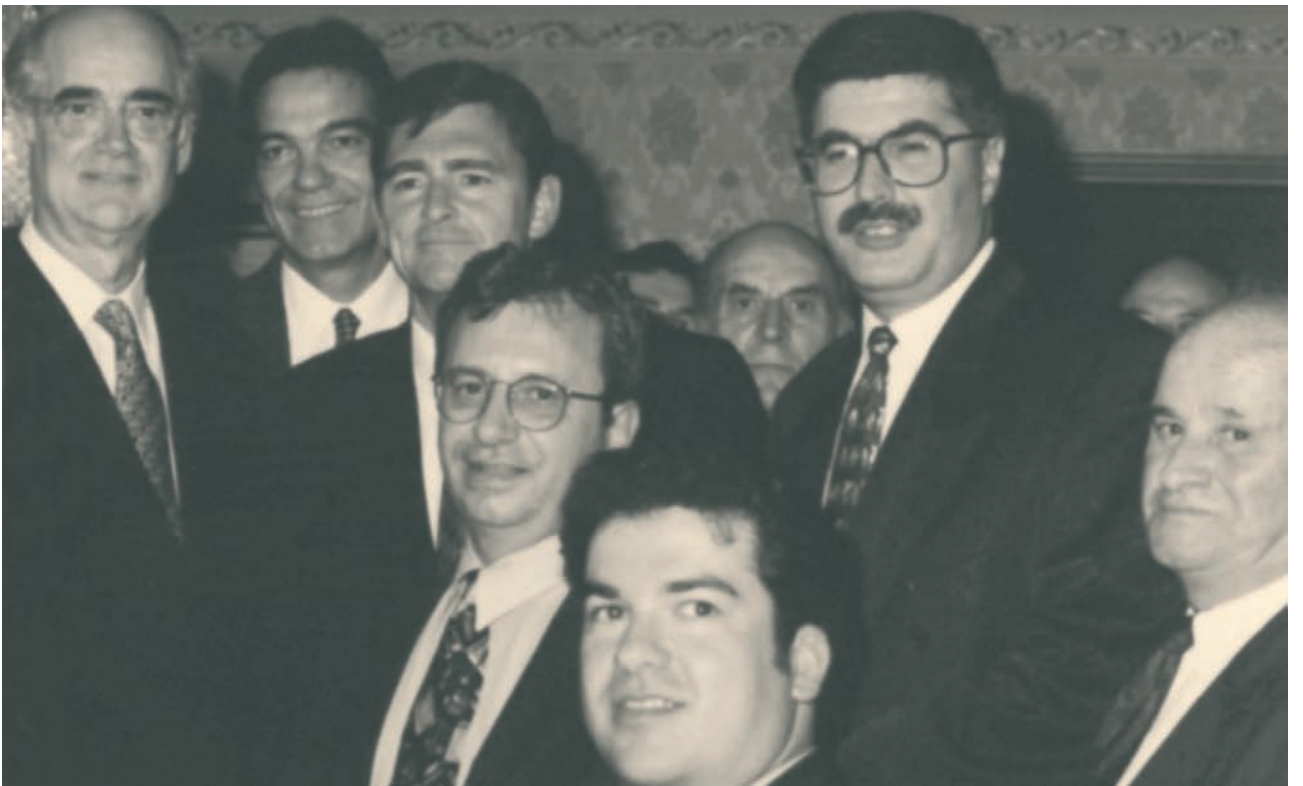
Από την επίσκεψη του Προέδρου της Βουλής των Ελλήνων, Απόστολου Κακλαμάνη, και του βουλευτή Νικόλαου Σηφουνάκη στη Βουλή της Βικτώριας (Αυστραλία) με ελληνοαυστραλούς βουλευτές το 1998.