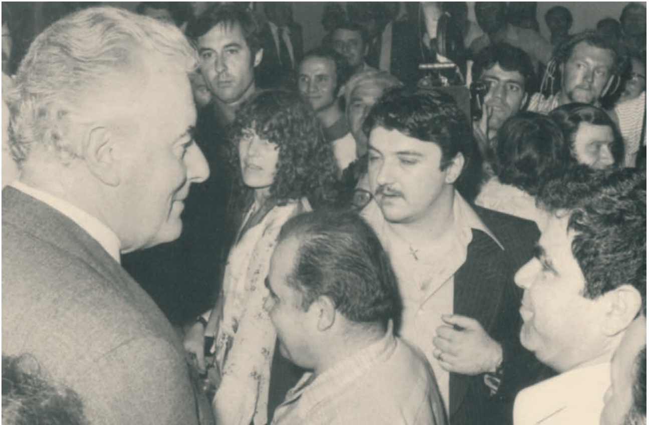
Έλληνες της Μελβούρνης υποδέχονται τον Πρωθυπουργό της Αυστραλίας, Gough Whitlam, δεκαετία 1970.