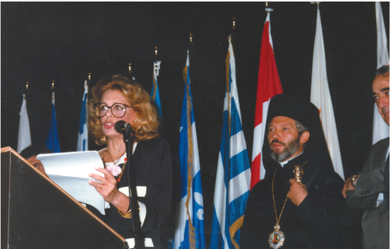
Η Μελίνα Μερκούρη, τότε υπουργός Πολιτισμού, στα εγκαίνια του Ελληνικού Κοινοτικού Κέντρου του Μόντρεαλ (1987).