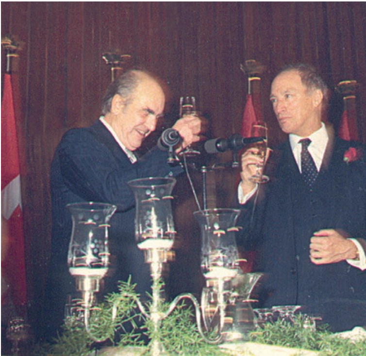
Ο Ανδρέας Παπανδρέου ως πρωθυπουργός στον Καναδά. Επίσημο δείπνο με τον πρωθυπουργό του Καναδά Πιερ Τρουντώ (1983).