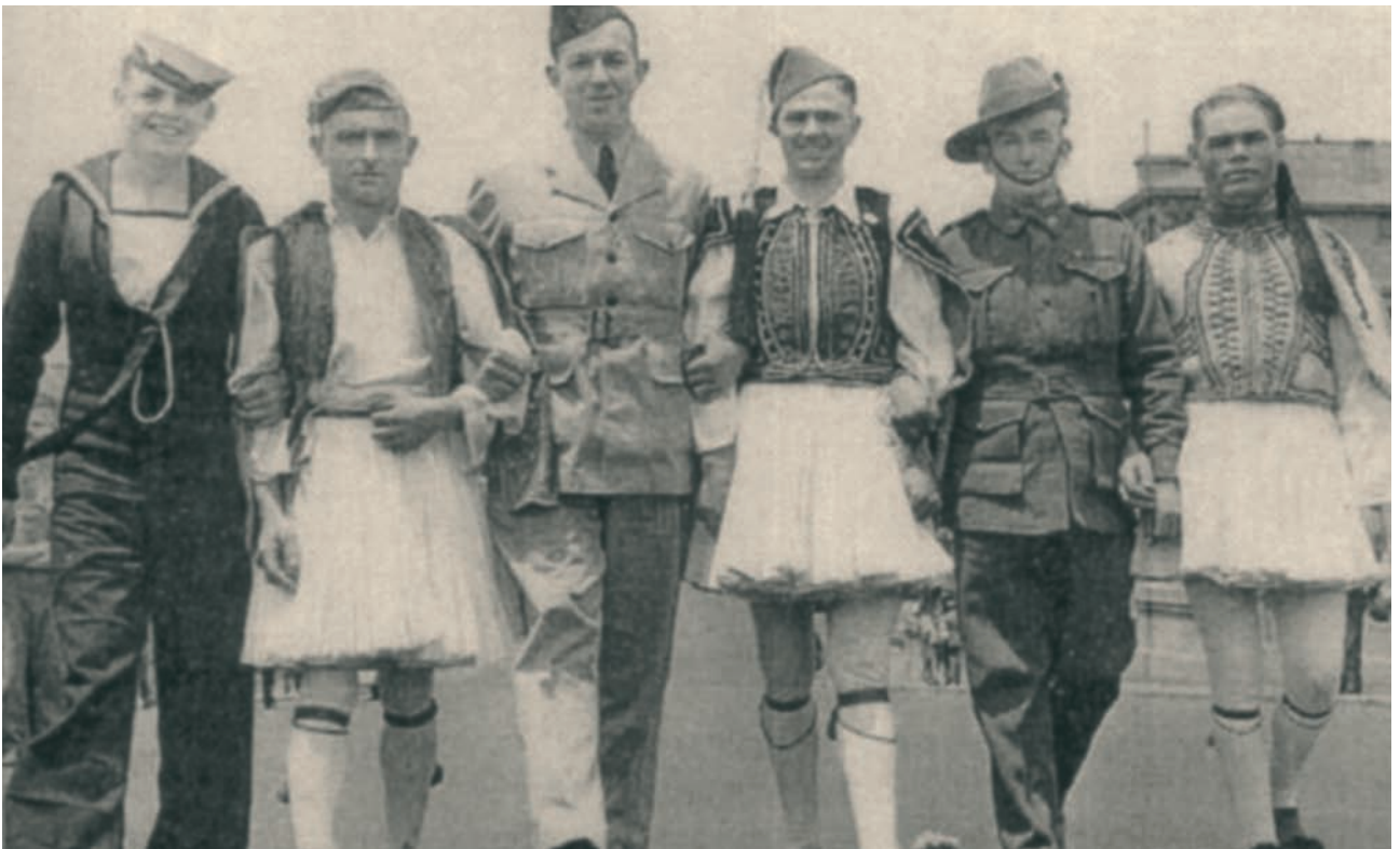
Έλληνες εύζωνες και Αυστραλοί στρατιώτες στην Αδελαΐδα σε κοινή παρέλαση, λίγο μετά την απελευθέρωση της Ελλάδας και τη νίκη των συμμαχικών δυνάμεων (1945).