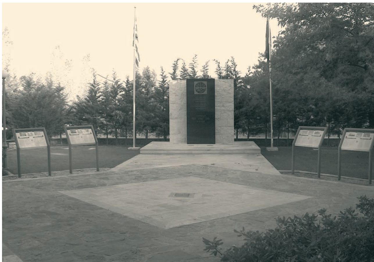
Μνημείο για τους Αυστραλούς και τους Έλληνες πεσόντες κατά το Δεύτερο Παγκόσμιο Πόλεμο στην Κρήτη, (Ρέθυμνο Κρήτης).