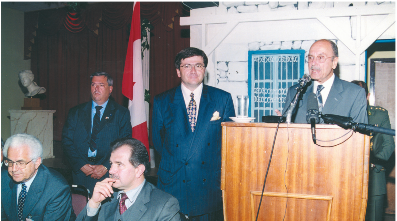
Ο πρόεδρος της Δημοκρατίας Κωνσταντίνος Στεφανόπουλος στο Τορόντο, Μάιος 2000.