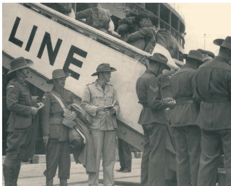
Έλληνες της Αυστραλίας ανεβαίνουν στο πλοίο Strathnever, με άλλους Αυστραλούς συμπατριώτες τους, τον Ιανουάριο του 1941, για να πολεμήσουν στην Ελλάδα. Δεύτερος από αριστερά ο φιλέλληνας ταγματάρχης του Αυστραλιανού Στρατού Alexander Sheppard.