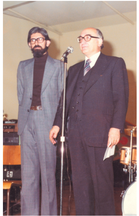
Ο βουλευτής Επικρατείας του ΠΑΣΟΚ και γνωστός συγγραφέας Σπύρος Πλασκοβίτης στο Μόντρεαλ (1979).