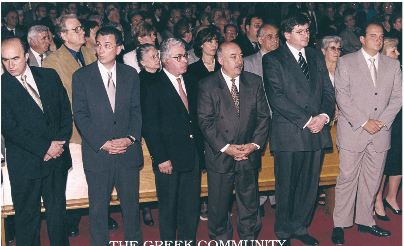
Ο τότε πρόεδρος της Νέας Δημοκρατίας και μετέπειτα πρωθυπουργός Κώστας Καραμανλής στο Τορόντο, Οκτώβριος 2002.