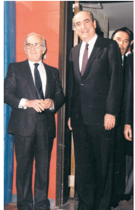
Ο τότε πρόεδρος της Νέας Δημοκρατίας και αρχηγός της αξιωματικής αντιπολίτευσης Κωνσταντίνος Μητσοτάκης στο Μόντρεαλ (1986).