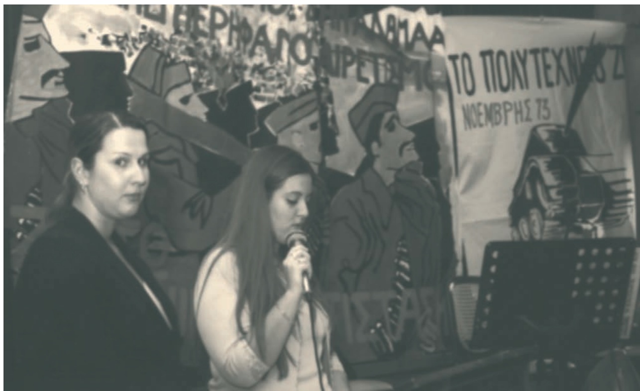
Νεαρές κοπέλες συμμετέχουν σε εκδηλώσεις μνήμης του Πολυτεχνείου που γιορτάζεται κάθε χρόνο στην Αυστραλία με τη συμμετοχή μαθητών και φοιτητών από διάφορα εκπαιδευτικά ιδρύματα της χώρας.