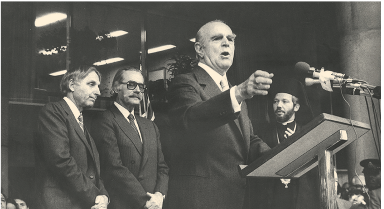
Ο Κωνσταντίνος Καραμανλής, ως πρόεδρος της Δημοκρατίας στο Τορόντο το 1982.