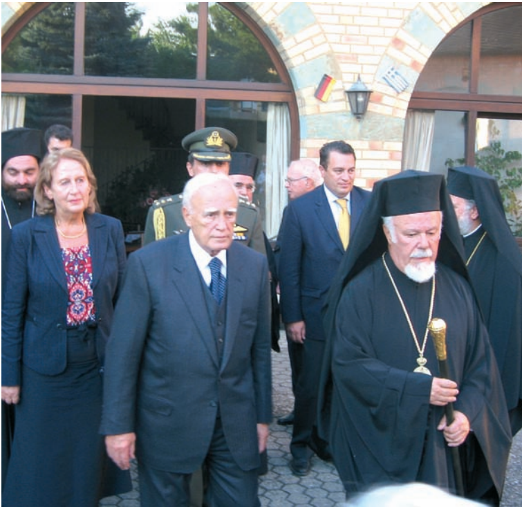
Ο Μητροπολίτης κ. Αυγουστίνος με τον πρόεδρο της Ελληνικής Δημοκρατίας κ. Κάρλο Παπούλια (2006).