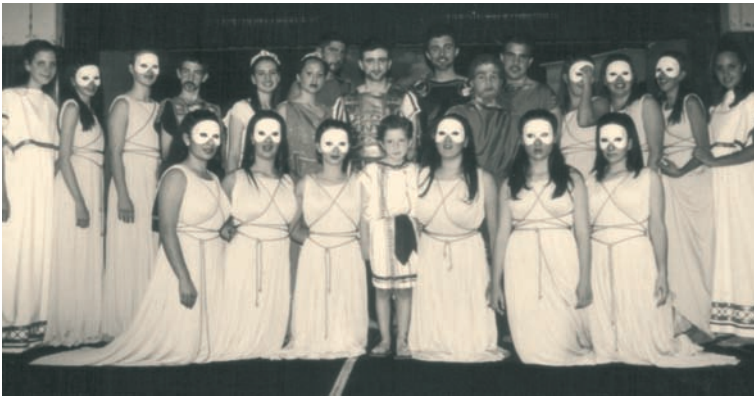
Παράσταση Ιφιγένειας Εν Αυλίδι, από το Θεατρικό Εργαστήρι του ελληνικού Κολλεγίου Άγιος Σπυρίδων του Σύδνεϋ.