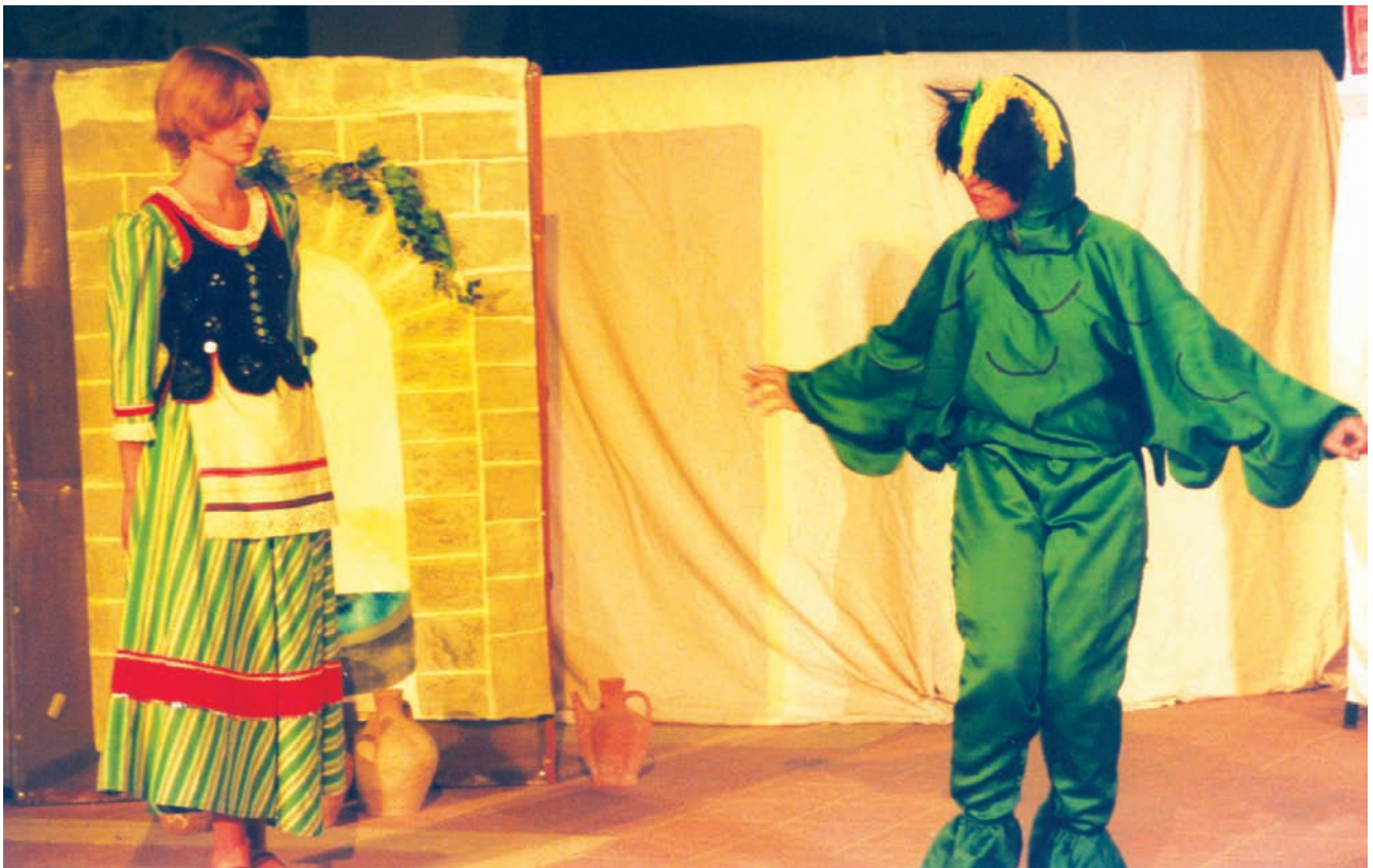
4ο Φεστιβάλ Μαθητικού Θεάτρου (2001), Γεωργία, Παιδικό Θέατρο «Ρωμισούνη», «Η κόρη του μυλωνά».