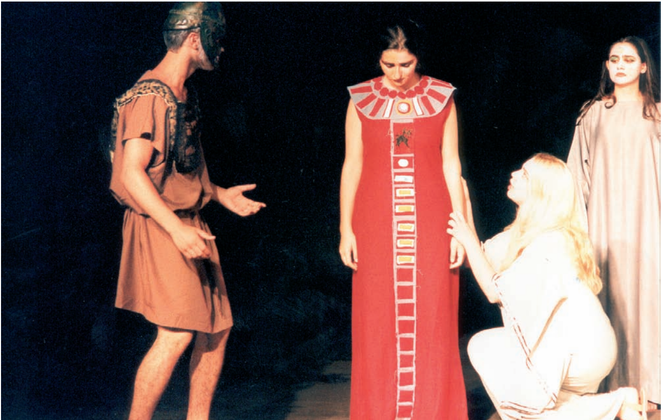
2ο Φεστιβάλ Μαθητικού Θεάτρου (1999), Γερμανία, Ελληνικό Λύκειο Ludenscheid, «Αντιγόνη-Σοφοκλή».