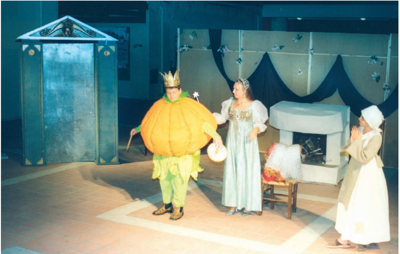
5ο Φεστιβάλ Μαθητικού Θεάτρου (2003), Ουκρανία, Ελληνική Κοινότητα Οδησσού, Θεατρική Ομάδα «Ελπίδα», «Η Σταχτοπούτα».