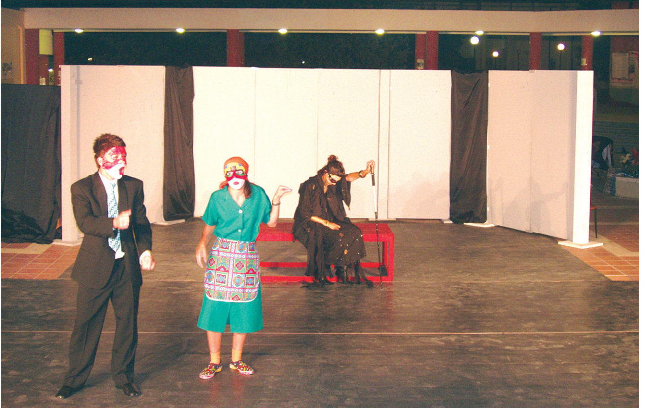
7ο Φεστιβάλ Μαθητικού Θεάτρου (2006), Ν. Αφρική, Σχολή SAHETI, «Ο Πλούτος».