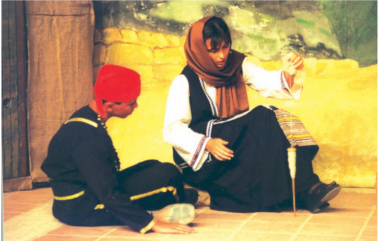
3ο Φεστιβάλ Μαθητικού Θεάτρου (2000), Ρωσία, Ελληνικό Σχολείο Σταυρούπολης, «Ο Κολοκοτρώνης, εικόνες από τη ζωή του».