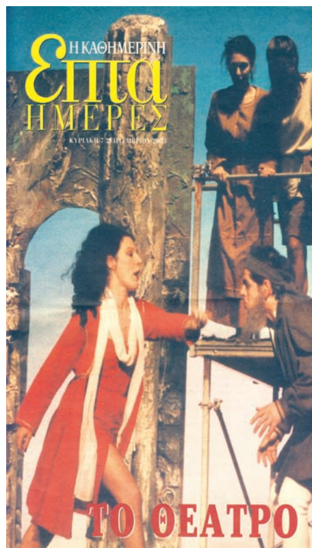
Ένα αφιέρωμα στο θέατρο της διασποράς.