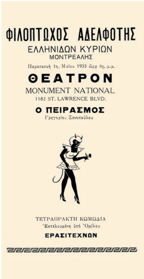
Ἡ Φιλόπτωχος Αδελφότης Ἑλληνίδων Κυριῶν Μόντρεαλ ανεβάζει τὸν «Πειρασμό» τοῦ Γρηγορίου Ξενοπούλου.