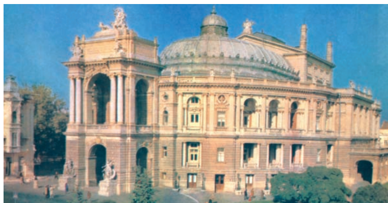
Η όπερα της Οδησού με γλυπτά νεοκλασικού ύφους.

Το θέατρο έχει γνωρίσει ιδιαίτερη ανάπτυξη στην ελληνική διασπορά. Στις ιστορικές παροικίες της διασποράς γνώρισε ξεχωριστή ανάπτυξη στη διάρκεια του 19ου και του 20ου αιώνα. Έτσι παρακολουθούμε για την περίοδο αυτή την ανάπτυξη του ελληνικού θεάτρου στην Κωνσταντινούπολη, την Οδησό, τον ελληνισμό του Πόντου, την Αλεξάνδρεια και σε άλλες παροικίες. Στον 20ο αιώνα το ελληνικό θέατρο αναπτύσσεται και στις μεταναστευτικές παροικίες των ΗΠΑ, της Αυστραλίας και του Καναδά.