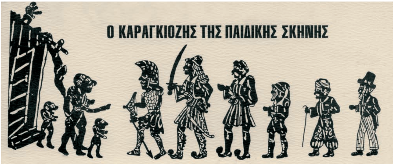
Φιγούρες του Καραγκιόζη της Παιδικής Σκηνής του Λαϊκού Θεάτρου της Παρκ Άβενιου-Μόντρεαλ 1970.