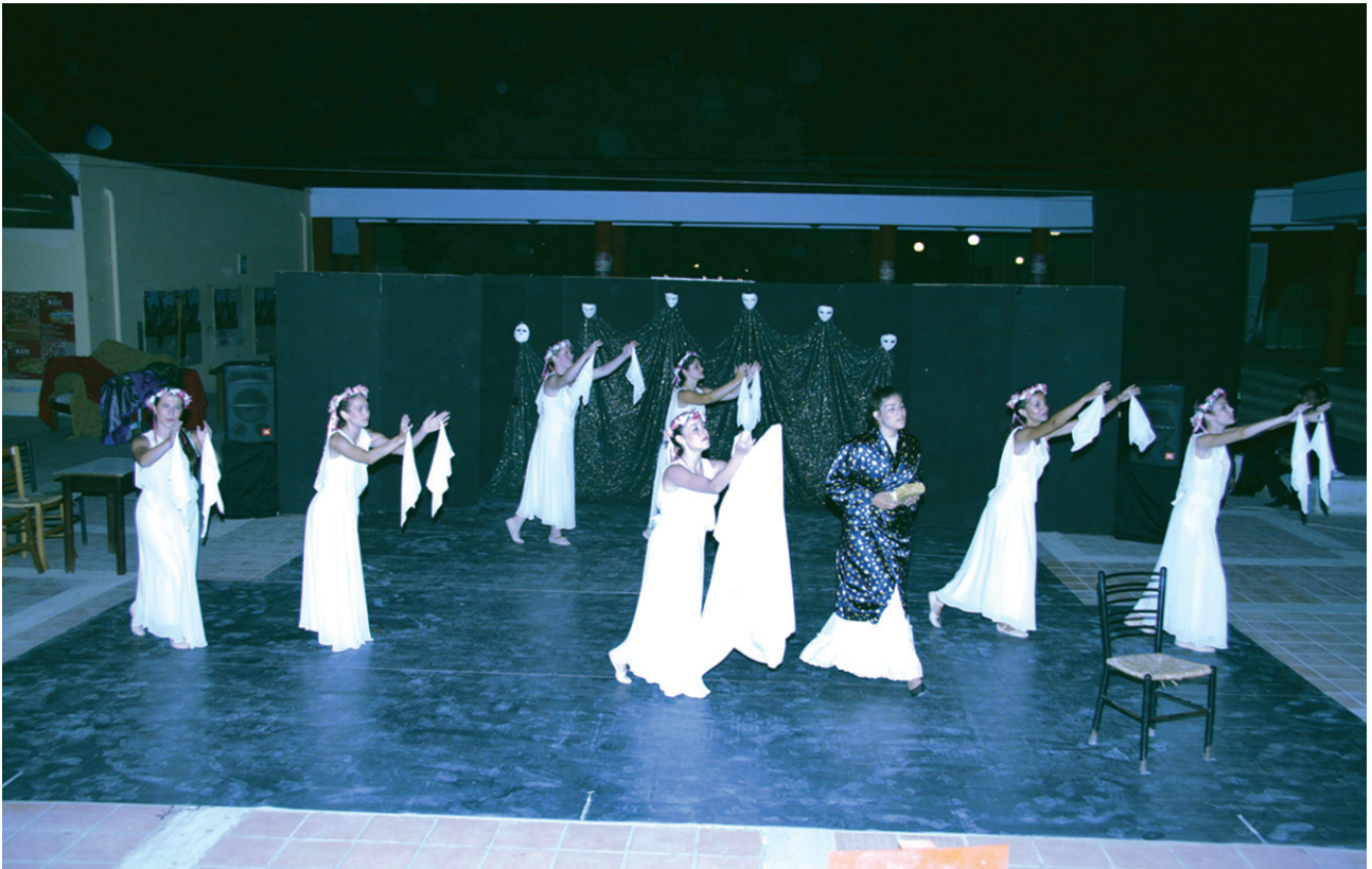
8ο Φεστιβάλ Μαθητικού Θεάτρου (2007), Καναδάς, Νεφέλη, «Επιστροφή στην Ιθάκη».