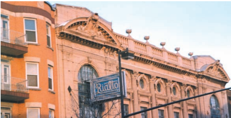
Το ελληνικής ιδιοκτησίας θέατρο Rialto στο Μόντρεαλ όπως διατηρείται σήμερα.