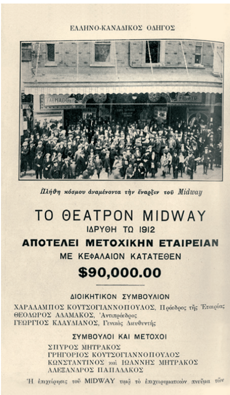
Διαφήμιση τοῦ θεάτρου Midway στὸν Ἑλληνο-καναδικὸ Ὁδηγὸ (1921-1922).