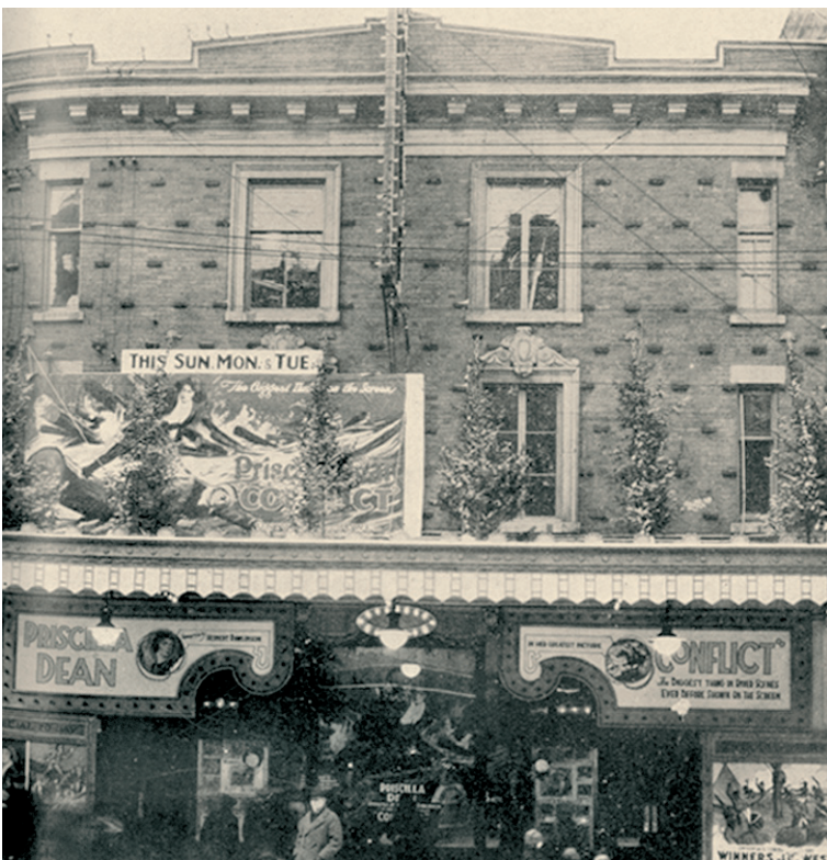
Το θέατρο Midway στο Μόντρεαλ, ελληνικής ιδιοκτησίας, που δεν υπάρχει σήμερα. Από φωτογραφία της εποχής.