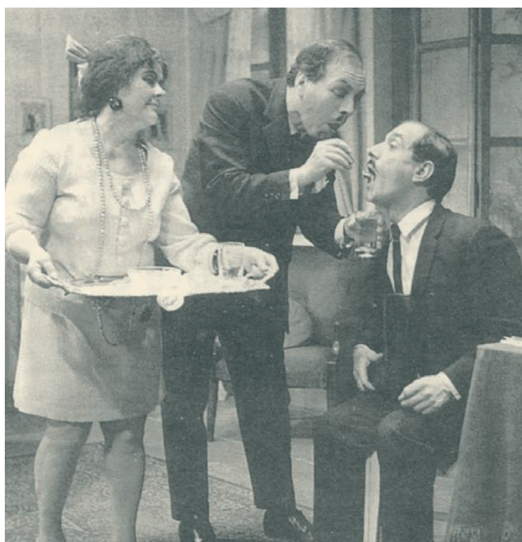
Παράσταση του θιάσου Αδαμάντιου Λεμού από το έργο «Δεσποινίς ετών 39» των Σακελλάριου-Γιαννακόπουλου στην Νέα Υόρκη το 1966.