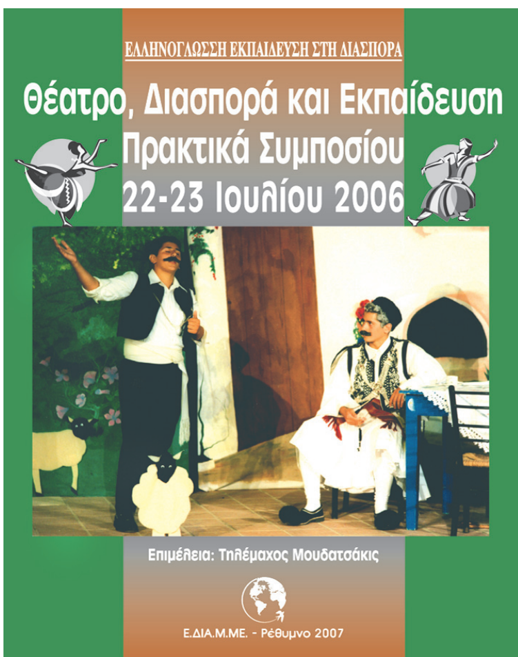
Πανεπιστήμιο Κρήτης 2006.

Οι φωτογραφίες που ακολουθούν αποτελούν τεκμήρια, για αυτές τις δραστηριότητες του προγράμματος και του Ε.ΔΙΑ.Μ.ΜΕ.