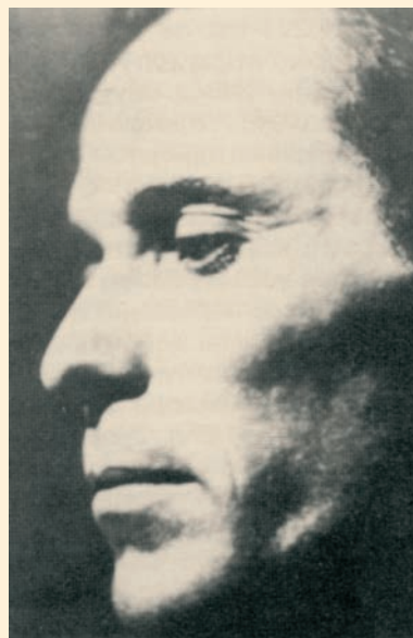
Γεράσιμος Στέρης, ο κοσμοπολίτης Έλληνας ζωγράφος.

Ο Γεράσιμος Στέρης (Σταματελάτος) γεννήθηκε στο χωριό Διγαλέτο της Κεφαλονιάς το 1898 μέσα σε μια πολύ φτωχή οικογένεια. Έζησε τα παιδικά του χρόνια στην Αλεξάνδρεια και εκεί έμαθε τα πρώτα γράμματα. Το 1915 φοιτά στο Σχολείο Καλών Τεχνών στην Αθήνα στο Τμήμα Ζωγραφικής. Ταξιδεύει σε όλη την Ελλάδα, την Ιταλία, την Ολλανδία, την Αγγλία και τη Γαλλία. Στο Παρίσι συνεχίζει τις σπουδές του στη ζωγραφική. Εκεί γνωρίζει τους μεγάλους ζωγράφους της εποχής όπως τον Πικάσσο και τον Μπρακ. Το 1926 επιστρέφει στην Αθήνα για να πάρει το πτυχίο του. Ένα χρόνο μετά το 1927 ξαναφεύγει στο Παρίσι με υποτροφία όπου και έζησε ως το 1931. Σπούδασε στη Σορβόνη στη Σχολή Καλών Τεχνών. Το 1931 γύρισε στην Ελλάδα και οργάνωσε την πρώτη έκθεση έργων του. Η έκθεση αυτή προκάλεσε μια διαμάχη για τον πρωτοποριακό της χαρακτήρα. Απέναντι στους συντηρητικούς που στάθηκαν επικριτικά στο έργο του του συμπαραστάθηκαν τότε οι πιο προοδευτικοί Έλληνες διανοούμενοι.