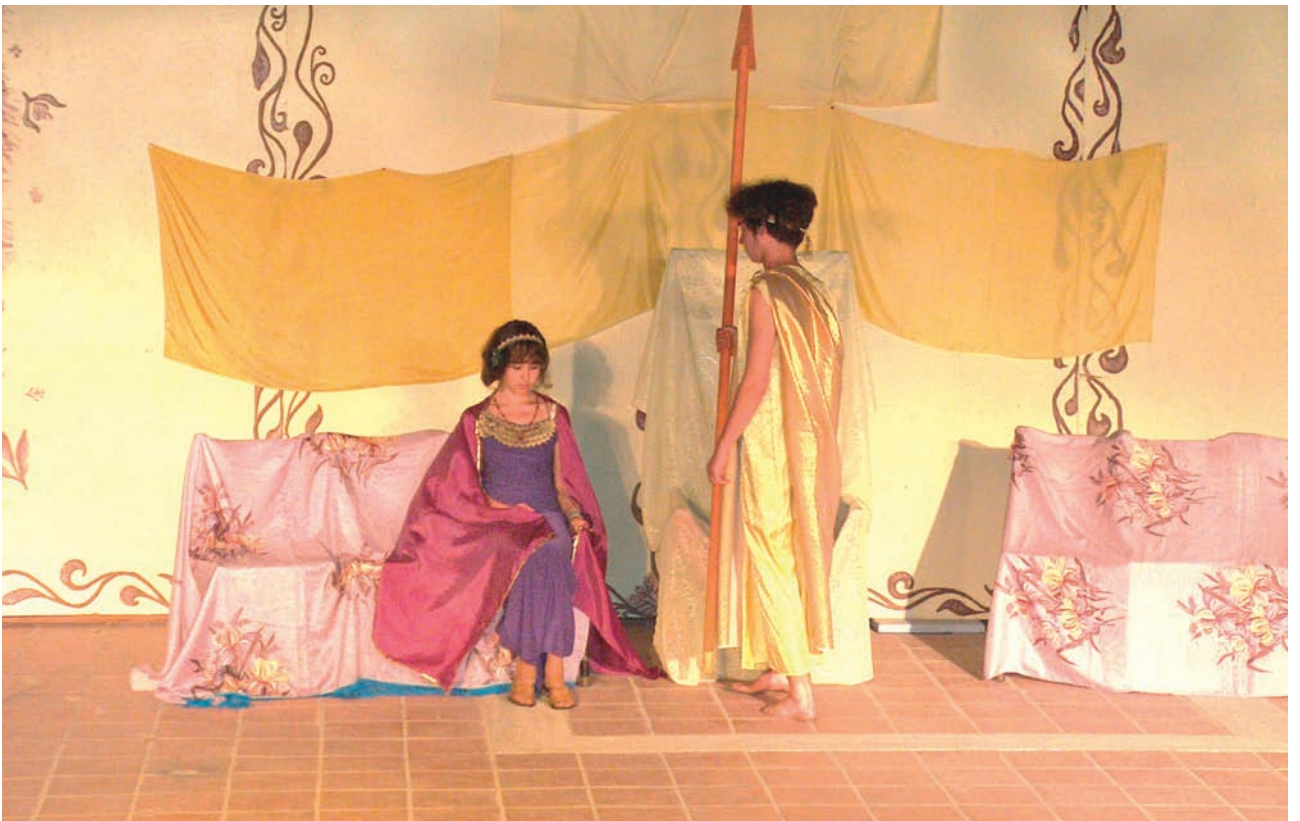
6ο Φεστιβάλ Μαθητικού Θεάτρου (2004), Ουκρανία, Σχολείο Belgorod Κριμαίας, «Οι Θεοί του Ολύμπου».