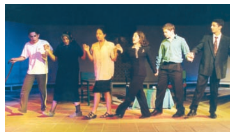
1ο Φεστιβάλ Μαθητικού Θεάτρου (1998), Αυστραλία, Ελληνικό Κολλέγιο «Ο Νέστορας», «Το παραμύθι της γιαγιάς».