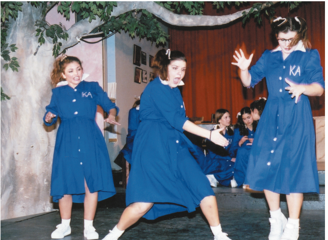
Σκηνή από το έργο «Το ξύλο βγήκε από τον Παράδεισο» που ανέβασε το πρωτοποριακό θέατρο Νεφέλη» το Γενάρη του 2000 στο Τορόντο.