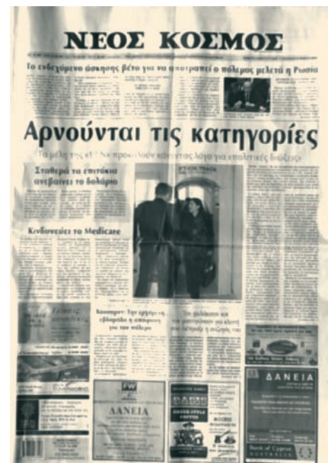
Η μεγαλύτερη σε κυκλοφορία εφημερίδα της Αυστραλίας, Νέος Κόσμος, εκδόθηκε το 1957 και συνεχίζει τη λειτουργία της αδιάκοπα στη Μελβούρνη, κάθε Δευτέρα και Πέμπτη, με τον ίδιο εκδότη, το Χιώτη Δημήτριο Γκόγκο.