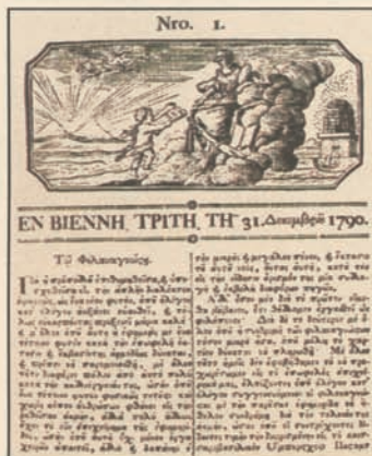
Το πρώτο φύλλο της «Εφημερίδας» που εξέδωσαν τα δύο αδέρφια «εν Βιέννη» το 1790

χούσε τις προσδοκίες του Γένους για ανεξαρτησία και ελευθερία. Αν και εκδιδόταν στη βασιλική Αυστρία, ήταν η