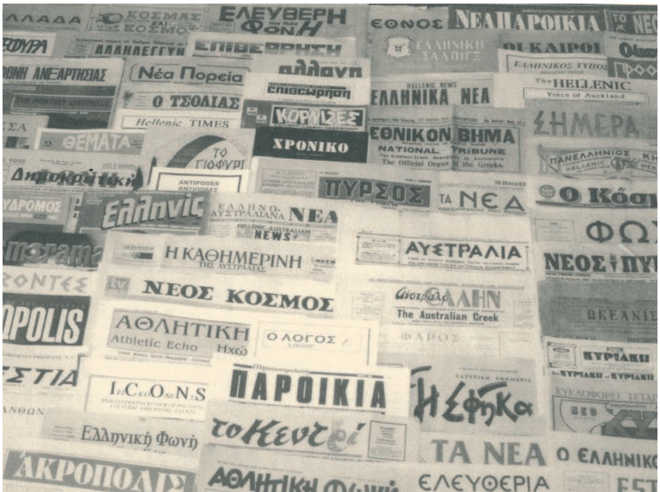
Πανόραμα των ελληνικών εφημερίδων που κυκλοφόρησαν κατά καιρούς στην Αυστραλία.