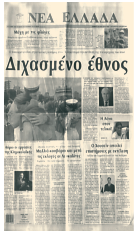
Η εφημερίδα Νέα Ελλάδα κυκλοφορεί τα τελευταία 25 χρόνια κάθε Σάββατο.