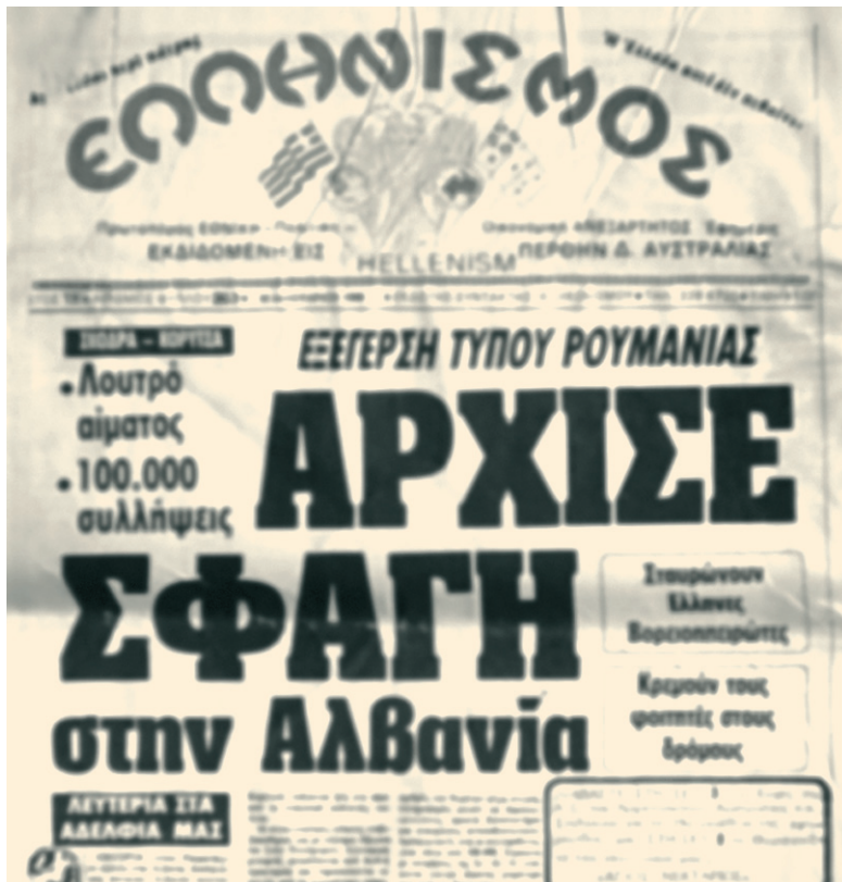
Η εφημερίδα Ελληνισμός που εκδόθηκε στην Πέρθη.