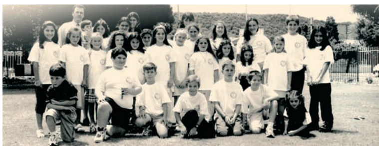
Γιορτή του σχολείου της Ελληνικής Κοινότητας Μπλουμφοντέιν της Νότιας Αφρικής.