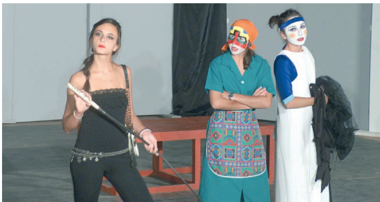
Σκηνή από τη θεατρική παράσταση «Ο πλούτος» που ανέβασε η Θεατρική Ομάδα Νοτίου Αφρικής, ΣΑΧΕΤΙ, στο πλαίσιο του 7ου Ομογενειακού Φεστιβάλ Μαθητικού Θεάτρου, το οποίο πραγματοποιήθηκε το 2006 στο Πανεπιστήμιο Κρήτης.