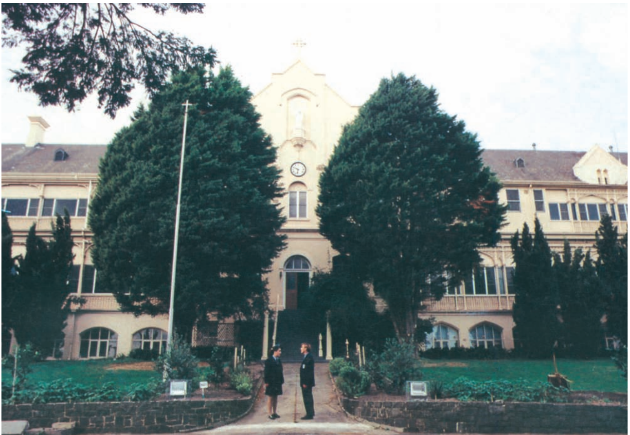
Κολλέγιο «Άγιου Ιωάννη» Μελβούρνη, Αυστραλίας.