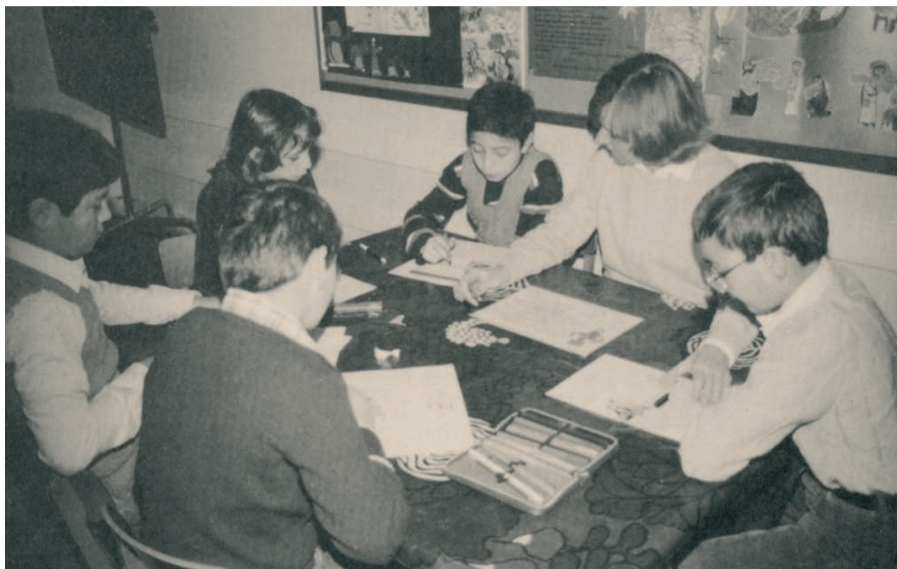
Ελληνική τάξη στο Ludwigshafen της Γερμανίας, δεκαετία 1970.

Σήμερα στη Γερμανία έχουμε τα αμιγή ημερήσια Ελληνικά Σχολεία που λειτουργούν με ευθύνη του Υπουργείου Εθνικής Παιδείας και Θρησκευμάτων της Ελλάδας, τα Τμήματα Ελληνικής Γλώσσας ενταγμένα στα γερμανικά σχολεία, τις Τάξεις Δίγλωσσης Εκπαίδευσης ενταγμένες στα γερμανικά σχολεία και τα μη ενταγμένα Τμήματα Ελληνικής Γλώσσας. Τα ενταγμένα στα γερμανικά σχολεία τμήματα ελληνόγλωσσης εκπαίδευσης βρίσκονται υπό την ευθύνη της γερμανικής πλευράς, αν και οι εκπαιδευτικοί που διδάσκουν σ' αυτά δεν είναι πάντα υπάλληλοι του γερμανικού κράτους, αλλά μπορεί να είναι και αποσπασμένοι από το ελληνικό Υπουργείο Παιδείας. Τα μη ενταγμένα τμήματα της ελληνόγλωσσης εκπαίδευσης είναι κυρίως απογευματινά σχολεία στα οποία διδάσκουν εκπαιδευτικοί αποσπασμένοι από το Υπουργείο Παιδείας της Ελλάδας.