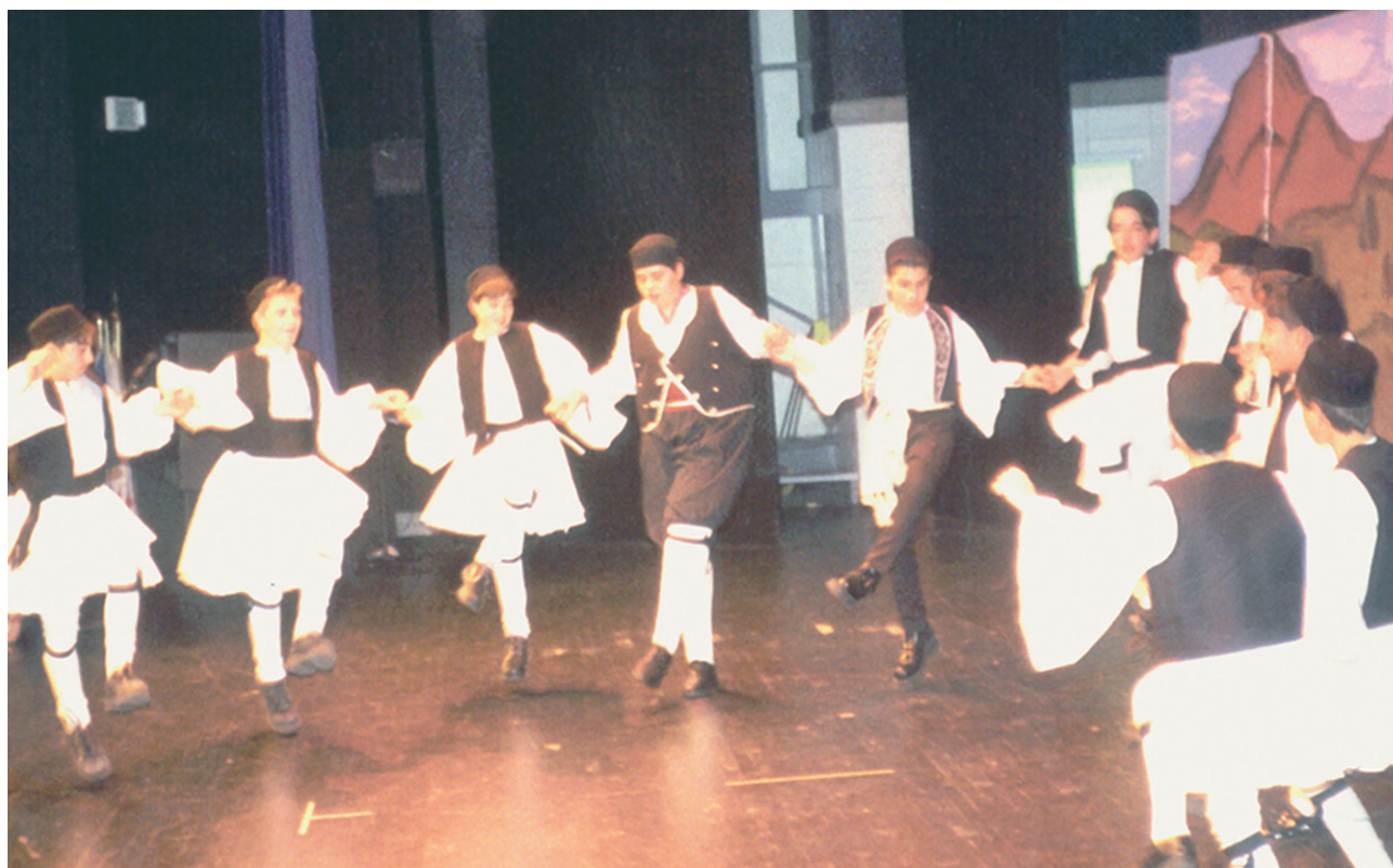
Οι μαθητές του «Δημοσθένη» στο Λαβάλ του Κεμπέκ χορεύουν ελληνικούς χορούς, δεκαετία του '80.