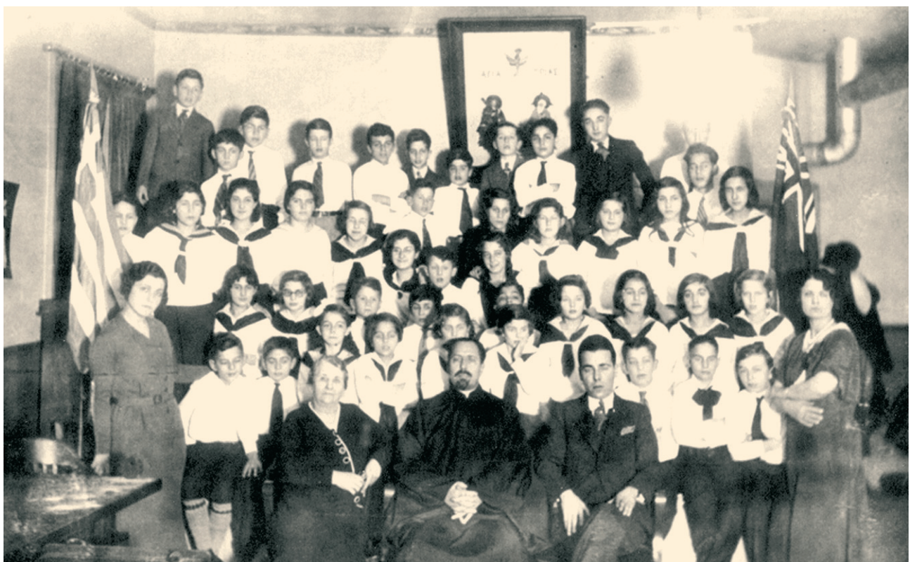
Μαθητές και μαθήτριες του ελληνικού σχολείου «Άγιος Γεώργιος» της Ελληνικής Κοινότητας Τορόντο με τους δασκάλους τους, 1933.