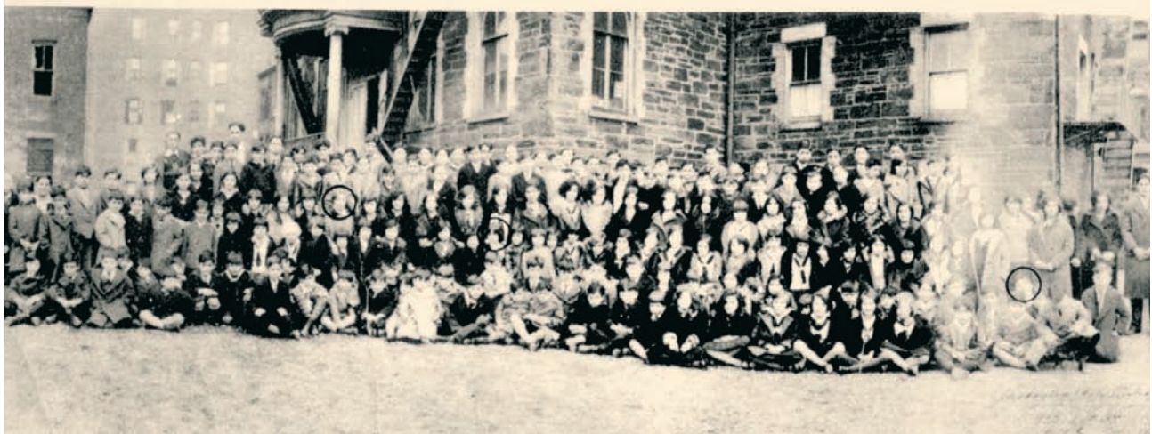
Το Ελληνοαμερικανικό Ινστιτούτο του Μπρονξ, το παλαιότερο ελληνικό σχολείο της Νέας Υόρκης.