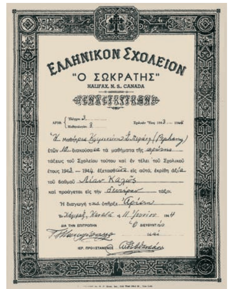
Ενδεικτικό του ελληνικού σχολείου «Σωκράτης» από το Χάλιφαξ της καναδικής επαρχίας Nova Scotia-1943.