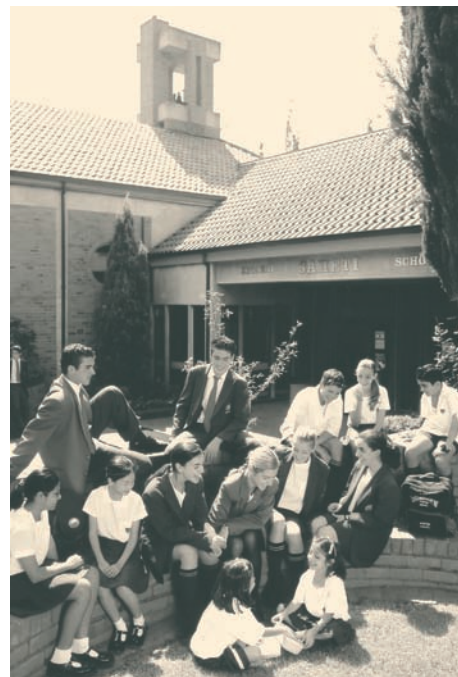
Μαθητές στην είσοδο του σχολείου ΣΑΧΕΤΙ (South African Hellenic Educational and Technical Institute). Το 2003 το ΣΑΧΕΤΙ έγινε τριάντα χρόνων.

Ελληνικά Ημερήσια Σχολεία λειτουργούν επίσης στην Αιθιοπία και στο Σουδάν.