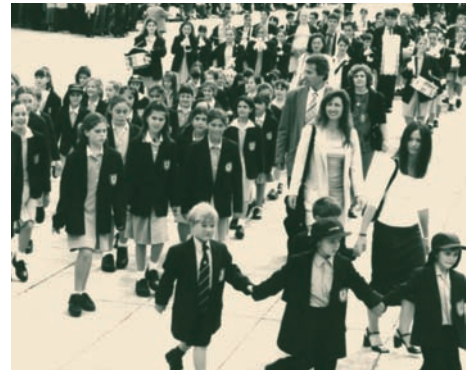
Παρέλαση ελληνικού σχολείου στο Σύνδεϋ της Αυστραλίας.

Στην Αυστραλία η ελληνόγλωσση εκπαίδευση αναπτύχθηκε σημαντικά την μεταπολεμική περίοδο και κυρίως μετά το 1960. Εκτός από τα απογευματινά και Σαββατιανά σχολεία ιδρύονται τη δεκαετία του 1970 και μετά Ημερήσια Σχολεία. Το πρώτο ημερήσιο σχολείο στην Αυστραλία με το όνομα «Άγιος Ιωάννης» ιδρύθηκε από τον Αρχιμανδρίτη Ιερόθεο Κουρτέση στη Μελβούρνη το 1978. Στη συνέχεια ιδρύθηκαν και άλλα ημερήσια σχολεία, τα οποία έχουν να επιδείξουν αξιόλογη δράση, όπως για παράδειγμα το σχολείο του Αγίου Σπυρίδωνα στο Σύνδεϋ, το Alphington Grammar School στη Μελβούρνη και το σχολείο του Αγίου Γεωργίου στην Αδελαΐδα. Το 2003 λειτουργούσαν συνολικά οκτώ ημερήσια ελληνικά σχολεία στην Αυστραλία και δεκάδες άλλα απογευματινά και Σαββατιανά. Την ευθύνη των σχολείων αυτών έχουν οι Ελληνικές Κοινότητες της Αυστραλίας, η Εκκλησία και σε μερικές περιπτώσεις ακόμη και ιδιώτες. Τα Ελληνικά διδάσκονται επίσης και σε αρκετά κρατικά σχολεία της Αυστραλίας.