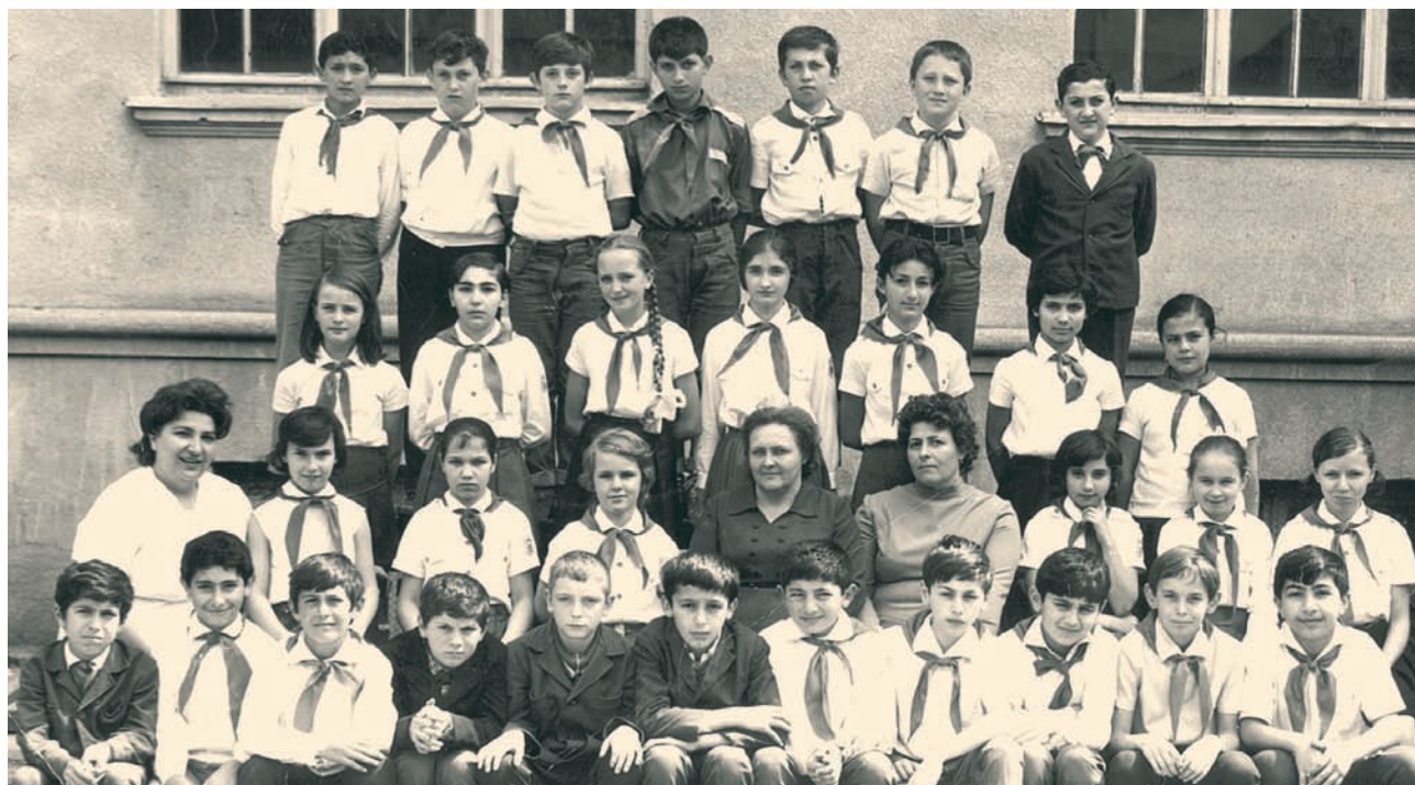
Μια χαρακτηριστική τάξη σε ελληνικό σχολείο της Γεωργίας.

Στις χώρες της πρώην Σοβιετικής Ένωσης λειτουργούσαν ελληνικά σχολεία καθόλη τη διάρκεια του εικοστού αιώνα. Σήμερα τα ελληνικά σχολεία στις χώρες αυτές εξακολουθούν να λειτουργούν με ευθύνη των ελληνικών Κοινοτήτων και Συλλόγων. Επίσης, σε αρκετά κρατικά σχολεία της Γεωργίας, της Ουκρανίας και της Ρωσίας διδάσκεται η Ελληνική σε όλους τους μαθητές του εκάστοτε κρατικού σχολείου.