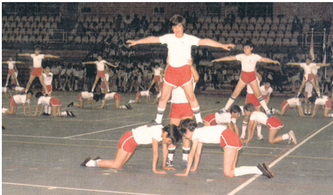
Γυμναστικές επιδείξεις του σχολείου «Δημοσθένης», 1986.