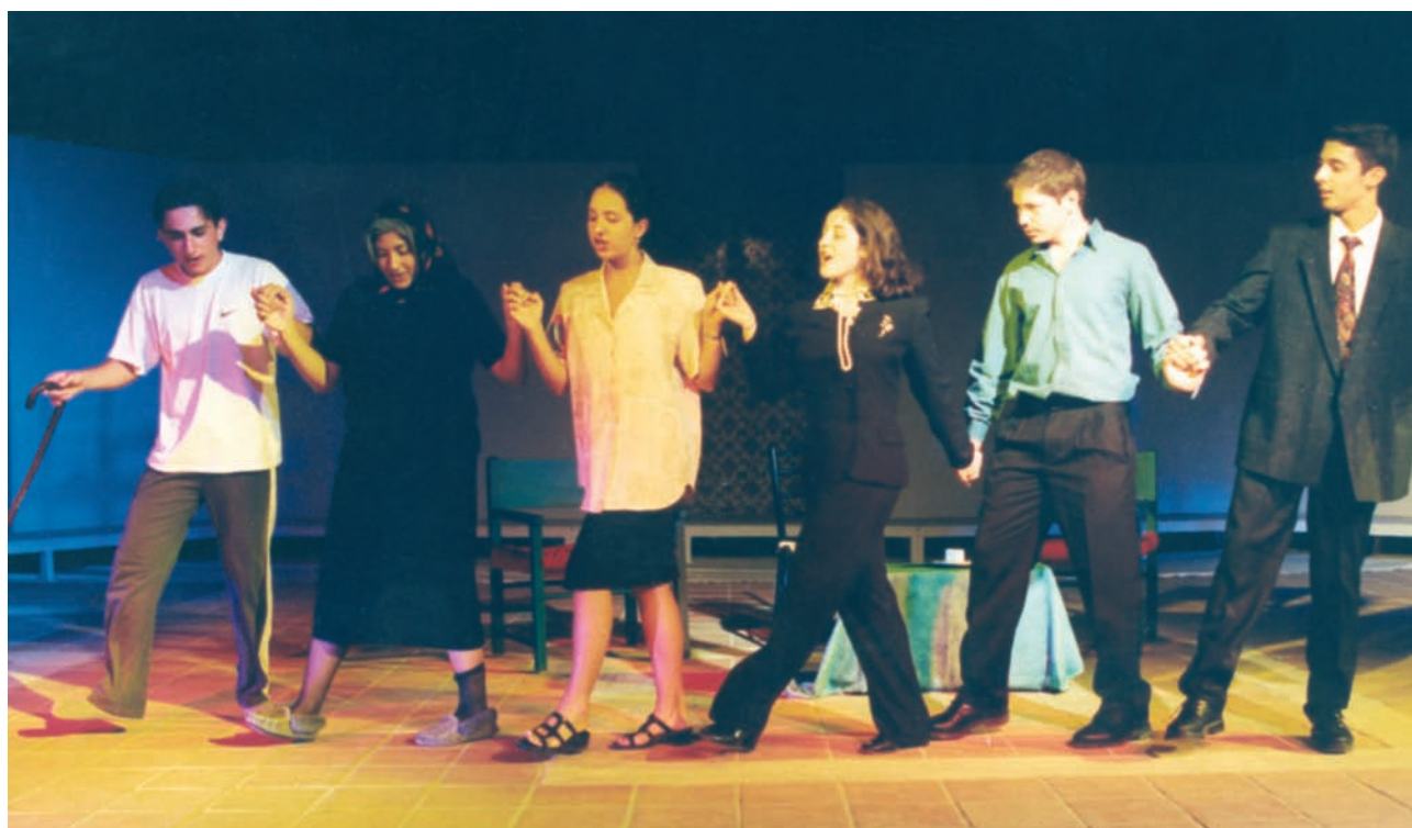
Μια σκηνή από τη θεατρική παράσταση «Το παραμύθι της γιαγιάς» που ανέβασε η ομάδα του Ελληνικού Κολλεγίου «Ο Νέστορας» της Μελβούρνης, στο πρώτο Ομογενειακό Φεστιβάλ ελληνικού θεάτρου στην Πανεπιστημιούπολη Ρεθύμνου Κρήτης, 26-30 Ιουνίου 1998.