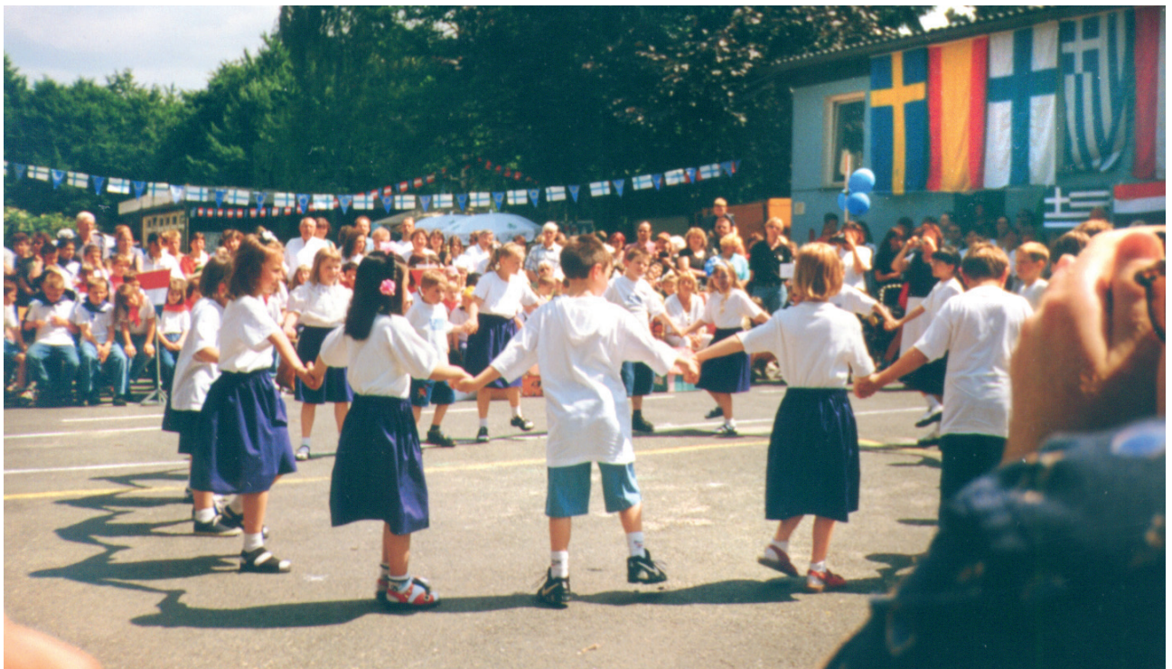
Εικόνες από τα ελληνικά σχολεία της Γερμανίας, δεκαετία 1970 και 1980.