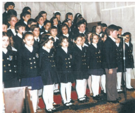
Παιδιά της χορωδίας του σχολείου «Σωκράτης» στο Μόντρεαλ, δεκαετία του '80.

Στον Καναδά ιδρύονται μεταπολεμικά πολλά ελληνικά σχολεία για τα παιδιά των μεταναστών. Στο Μόντρεαλ συνέχισε να λειτουργεί το ημερήσιο σχολείο «Σωκράτης» ενώ το 1982 ιδρύθηκε στην περιοχή του Μόντρεαλ, στην πόλη του Λαβάλ και δεύτερο ημερήσιο σχολείο, ο «Δημοσθένης». Απογευματινά και Σαββατιανά σχολεία ιδρύθηκαν στο Μόντρεαλ από την Ομοσπονδία Γονέων και Κηδεμόνων, από τις Ελληνικές Κοινότητες Μόντρεαλ και Λαβάλ καθώς και από διάφορες μικρότερες κοινότητες. Ελληνικά σχολεία ιδρύθηκαν επίσης στο Τορόντο από την εκεί Ελληνική Κοινότητα, από την Εκκλησία, καθώς και από ιδιώτες. Η Ελληνική Κοινότητα του Τορόντο είναι ο μεγαλύτερος εκπαιδευτικός φορέας στο Οντάριο. Στο Οντάριο τα Ελληνικά διδάσκονται επίσης στο πλαίσιο του προγράμματος γλωσσικής κληρονομιάς (Heritage Language Program) από το 1977. Το πρόγραμμα αυτό μετονομάστηκε το 1992 σε International Language Program. Ελληνικά σχολεία λειτουργούν επίσης και σε άλλες περιοχές του Καναδά όπως στην Οττάβα, το Χάλιφαξ και στο Δυτικό Καναδά. Στο Δυτικό Καναδά λειτουργούν σχολεία στο Βανκούβερ, στο Γουίνιπεγκ, στο Κάλγκαρι, και στο Έντμοντον. Το 1996 άρχισε να λειτουργεί στο Τορόντο το ημερήσιο ελληνορθόδοξο σχολείο της Ιεράς Μητρόπολης Τορόντο η «Μεταμόρφωση».