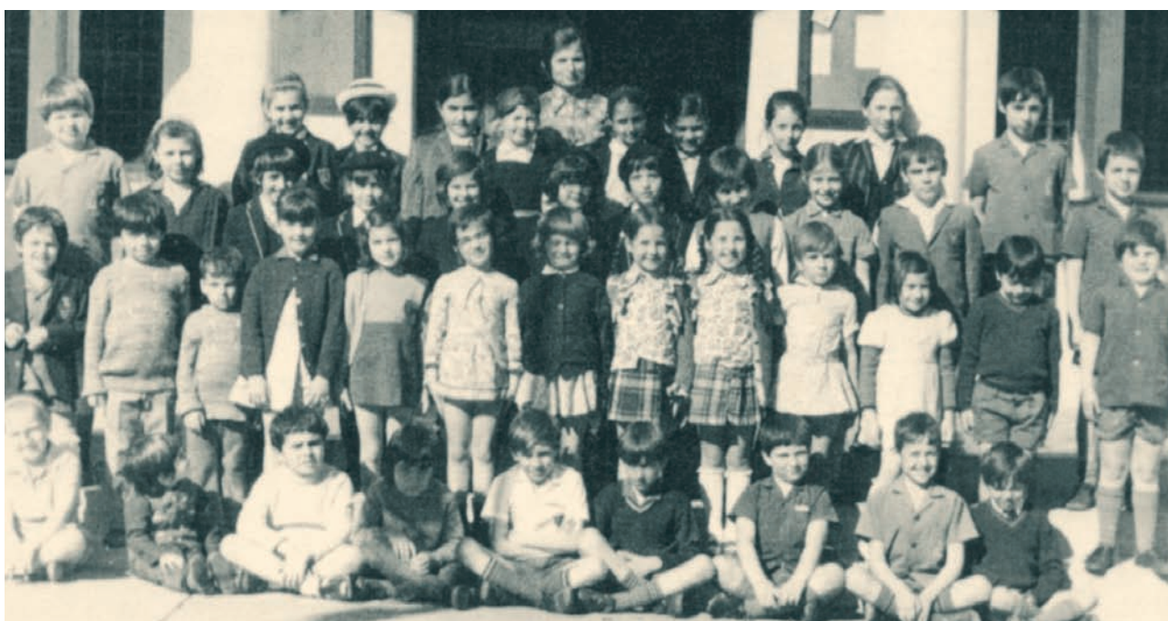
Το Ελληνικό σχολείο της Κοινότητας του Γιοχάνεσμπουργκ το 1980.