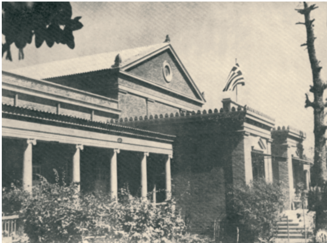
Εκπαιδευτήρια ελληνικής κοινότητας Χαρούμ. Τράμπειος Σχολή.