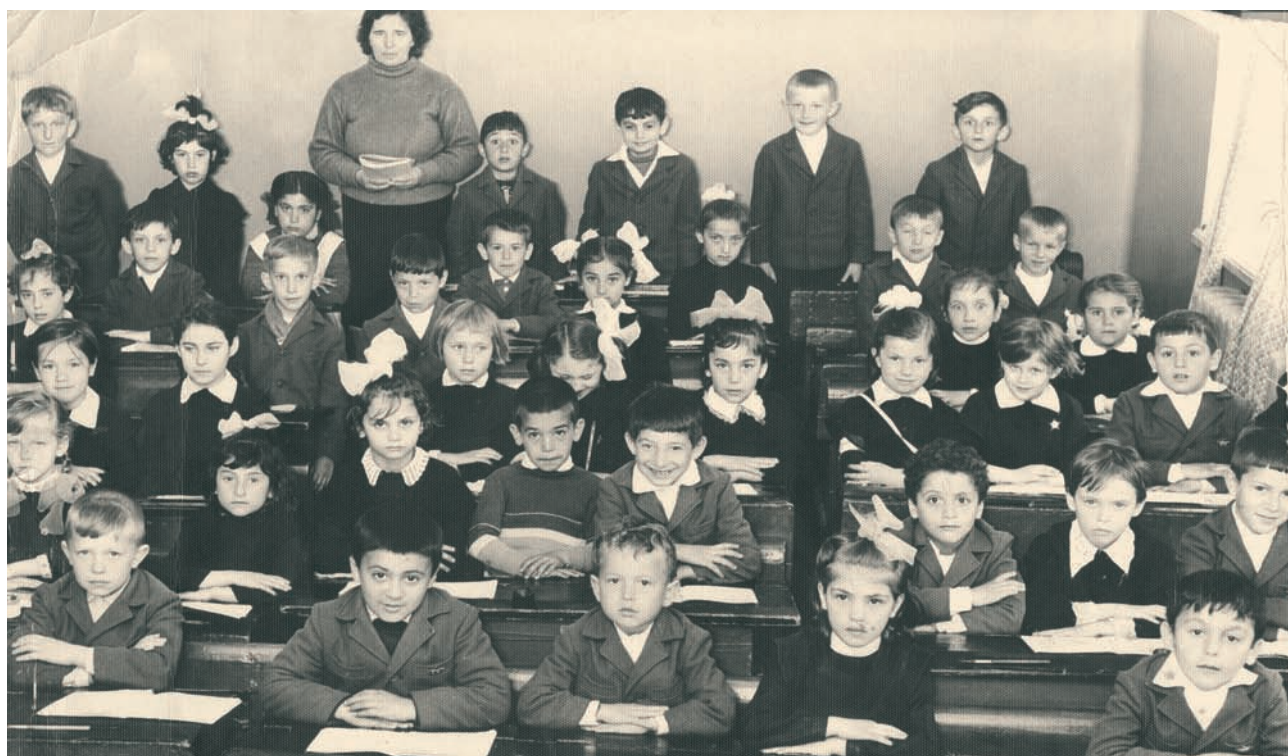
Τα παιδιά στη Γεωργία μαθαίνουν γράμματα. Τα μέσα λιγοστά, οι δάσκαλοι ακούραστοι στο καθήκον.