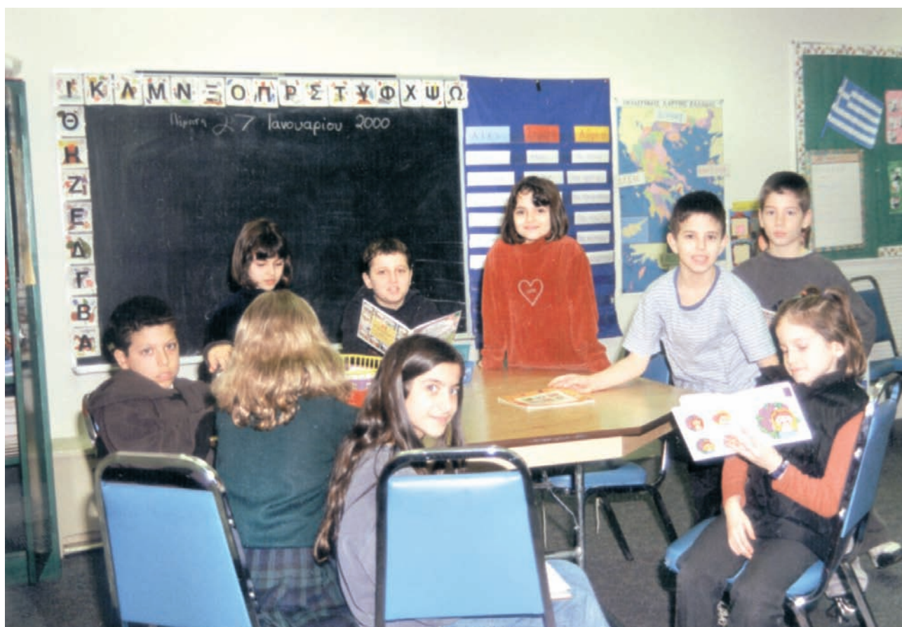
Μια τάξη του σχολείου της Ελληνικής Κοινότητας Βανκούβερ στον Δυτικό Καναδά, 1999-2000.