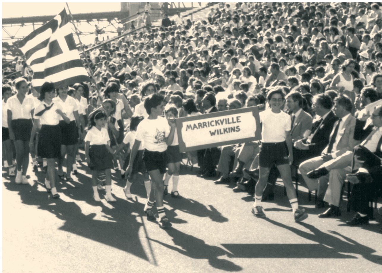
Παρελάσεις των ελληνικών σχολείων στο Σύδνεϋ με την ευκαιρία της 25ης Μαρτίου 1990.