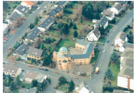
Η Ιερά Μητρόπολη Γερμανίας στη Βόννη.

Η Ιερά Μητρόπολις Γερμανίας, με έδρα τη Βόννη, ιδρύθηκε στις 17 Φεβρουαρίου 1963, αναγνωρίστηκε ως Νομικό Πρόσωπο Δημοσίου Δικαίου σύμφωνα με το νόμο 222/29.10.1974 του ομόσπονδου κρατιδίου της Βόρειας Ρηνανίας Φεσφλίας. Στη Γερμανία συναντούμε περισσότερες από πενήντα ενορίες με μεγαλοπρεπείς ναούς που σηματοδοτούν τη δυναμική παρουσία των Ελλήνων και της εκκλησίας τους στο κέντρο της Ευρώπης.