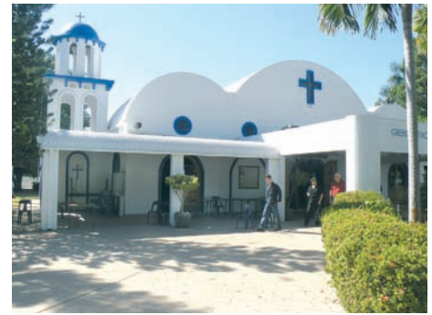
Ναός του Αγίου Νικολάου στο Darwin Αυστραλίας.