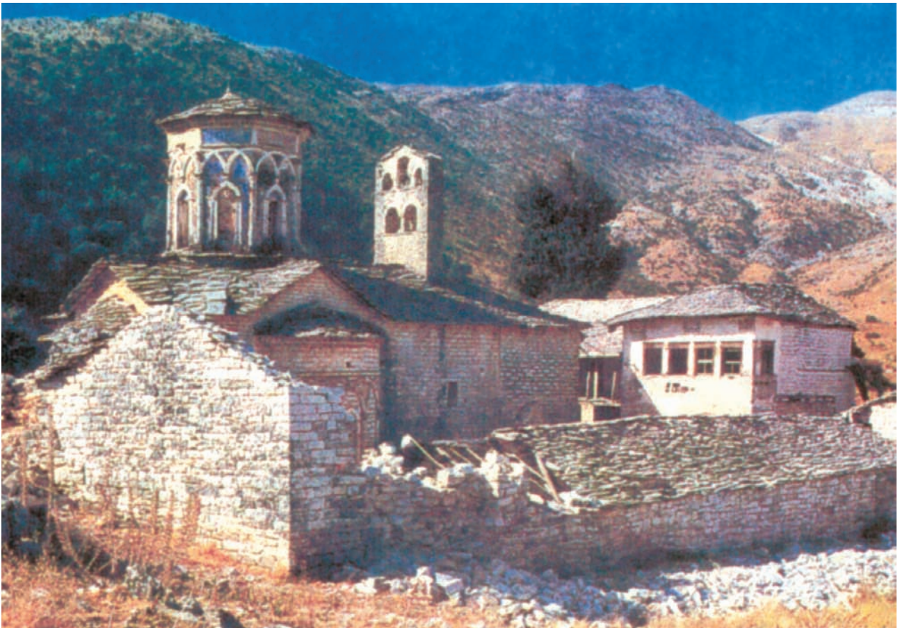
Μονή Κοιμήσεως Θεοτόκου Ρεβενίων, το κομψότερο δείγμα αρχιτεκτονικής των Μεταβυζαντινών χρόνων του αιώνα μ.Χ. Γοραντζή Δερόπολης στην Αλβανία.