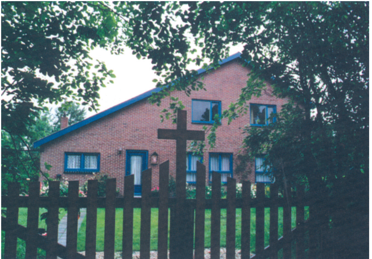
Το ελληνορθόδοξο μοναστήρι του Γενεθλίου της Θεοτόκου στην πόλη Άσθεν της Ολλανδίας.