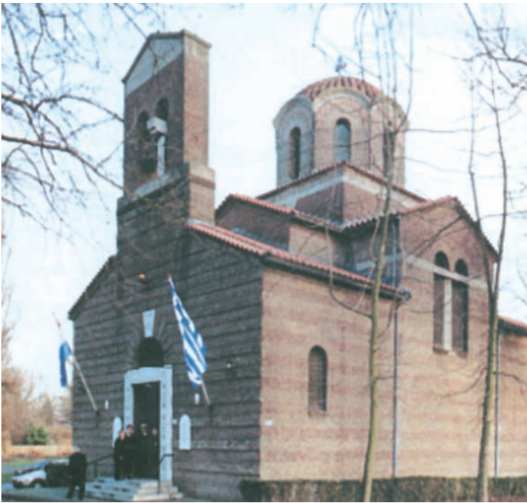
Ο ναός του Αγίου Νικολάου στο Ρότερνταμ είναι ένα κομψό πλινθόκτιστο δείγμα νεοβυζαντινού ρυθμού.