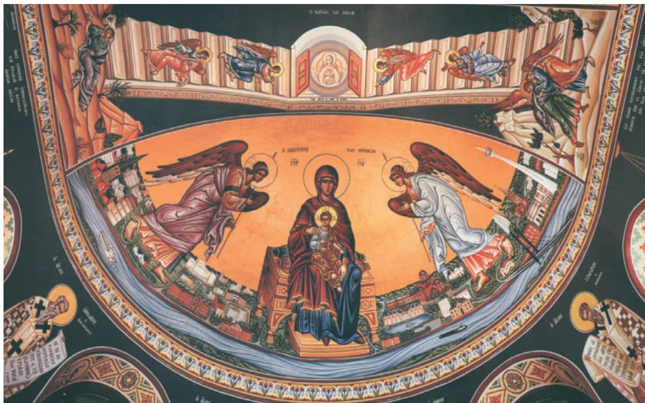
Η Παναγία του Ντύσσελτορφ.

Πηγή: Π. Ιωάννης Ευτ. Ψαράκης: Εικόνων Μυσταγωγία, έκδοση Ενορίας Αγίου Αποστόλου Ανδρέου - Ντύσσελτορφ, Ντύσσελτορφ 2006, σελ. 178.