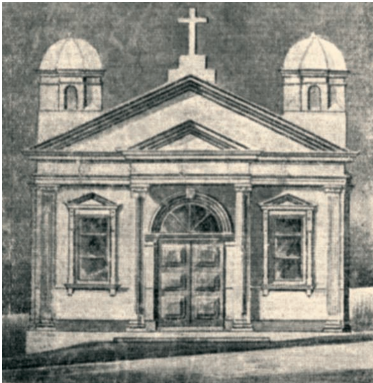
Η πρόσοψη της εκκλησίας του Αγίου Γεωργίου στο Κέιπ Τάουν.