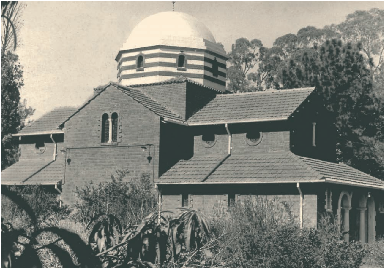
Ο ναός του Ευαγγελισμού της Θεοτόκου στην Πρετόρια.