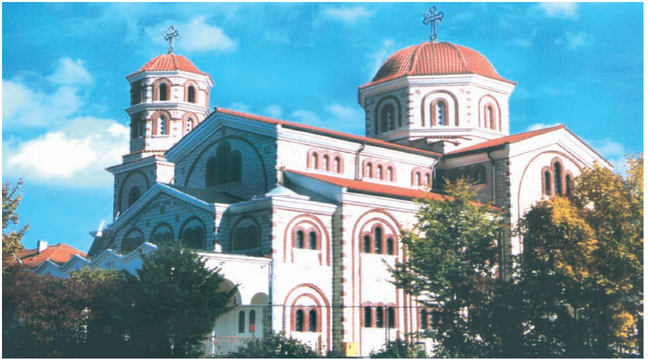
Ο ναός του Ευαγγελισμού της Θεοτόκου στο Esslingen Γερμανίας.