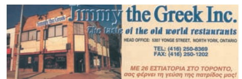
Αλυσίδα εστιατορίων στο Τορόντο.