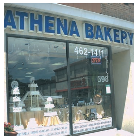
Ελληνικό αρτοποιείο και ζαχαροπλαστείο στο Τορόντο.