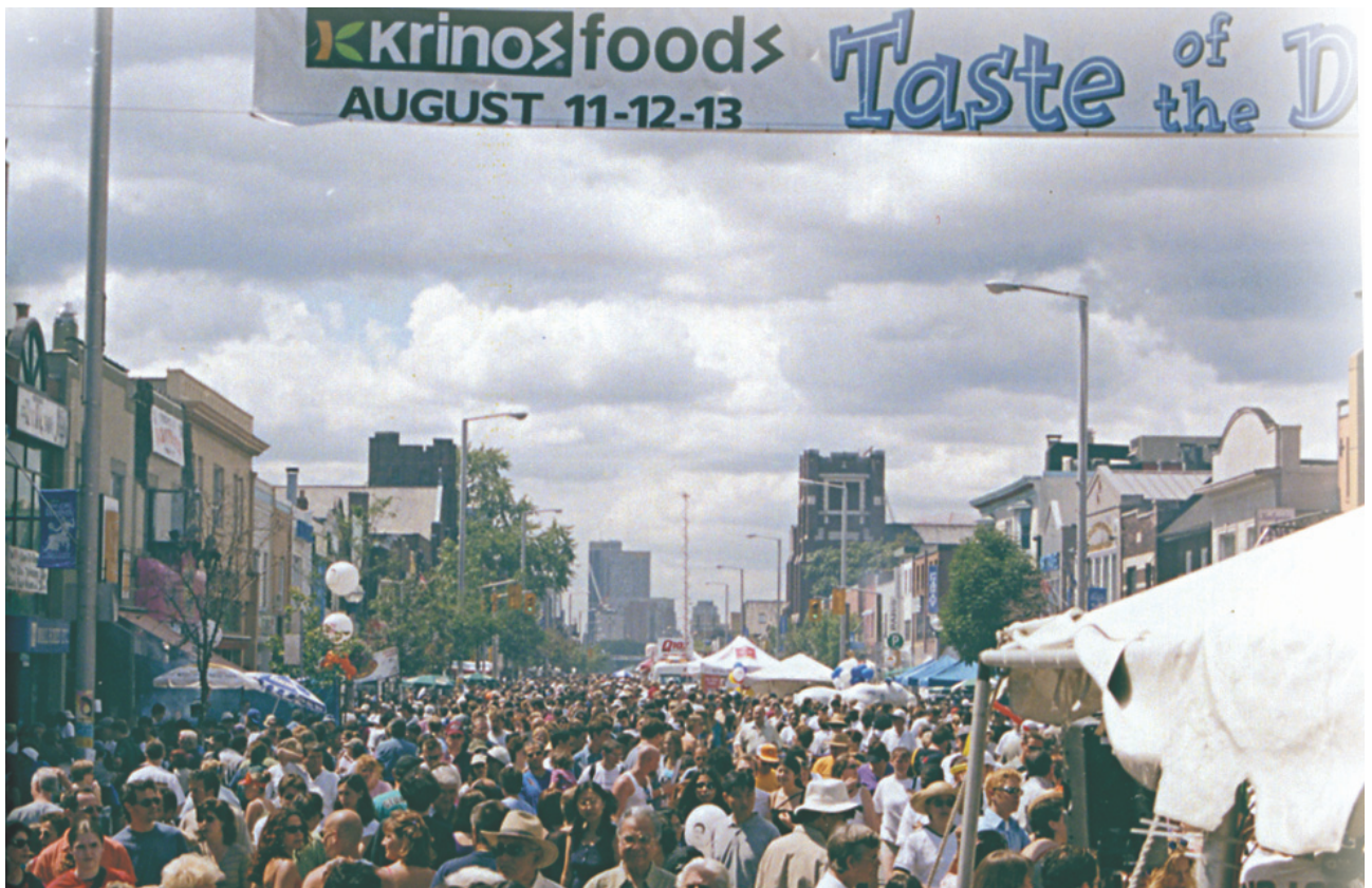
Krinos Foods μια ελληνική εταιρεία τροφίμων στον Καναδά και τις ΗΠΑ. Ιδρύθηκε το 1965 στις ΗΠΑ.