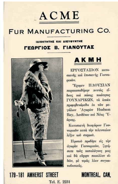
Ελληνική βιοτεχνία γούνας. (Από τον Ελληνοκαναδικό Οδηγό, 1922).

Πολλοί άλλοι Έλληνες μεταπολεμικοί μετανάστες θα στραφούν προς το λιανικό εμπόριο. Θα ανοίξουν καταστήματα τροφίμων, ρούχων, ψιλικατζίδικα και άλλα. Αυτοί που δούλευαν ως οδηγοί ταξί θα δημιουργήσουν με την πάροδο του χρόνου εταιρείες ταξί. Άλλοι που είχαν κάποια μόρφωση θα ανοίξουν ταξιδιωτικά και λογιστικά γραφεία, ή θα ασχοληθούν με κτηματομεσιτικές επιχειρήσεις. Ένας άλλος τομέας που γνώρισε μεγάλη ακμή μεταπολεμικά, προτού υποχωρήσει στις μέρες μας, ήταν αυτός της βιομηχανίας γουναρικών. Τέτοιες βιομηχανίες υπήρχαν στη Νέα Υόρκη, στο Μόντρεαλ, στο Τορόντο, στη Φρανκφούρτη αλλά και αλλού.