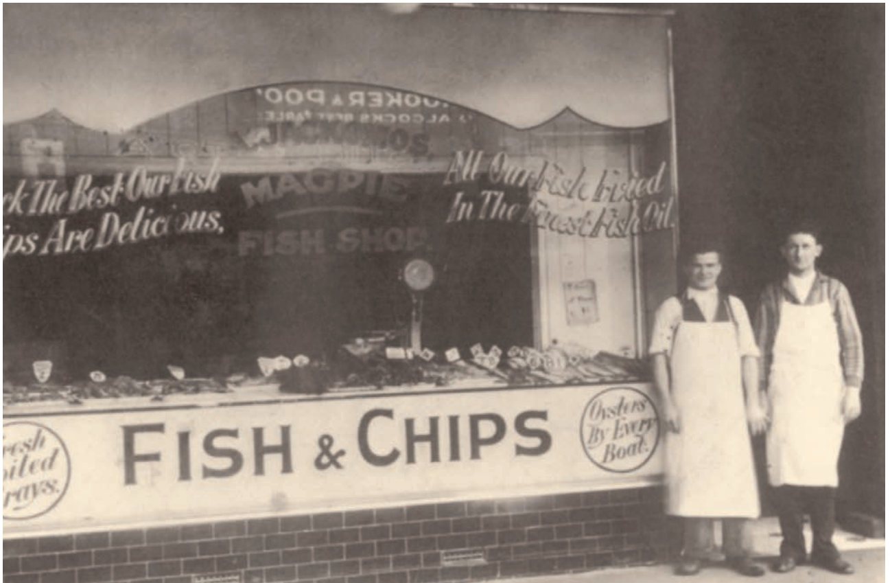
Φωτογραφία καταστήματος με τους Έλληνες ιδιοκτήτες του, Αυστραλία 1934.

Στην Αυστραλία οι Έλληνες έγιναν σταδιακά ιδιοκτήτες ξενοδοχείων, υπεραγορών και εστιατορίων. Ιδιαίτερα ήταν ιδιοκτήτες των περίφημων μαγαζιών - εστιατορίων fish and chips. Λέγεται μάλιστα ότι τα μαγαζιά fish and chips, τα Café και τον κινηματογράφο τα έφεραν Έλληνες μετανάστες-έμποροι από τις ΗΠΑ στην Αυστραλία.