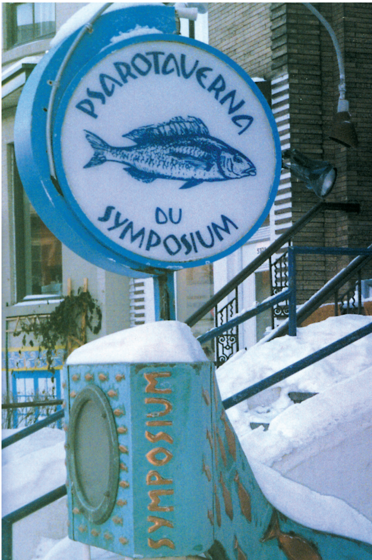
Ακόμη μια ελληνική ψαροταβέρνα στο Μόντρεαλ στην Avenue du Parc.

Από τις επαγγελματικές ασχολίες των Ελλήνων στο Μόντρεαλ Καναδά