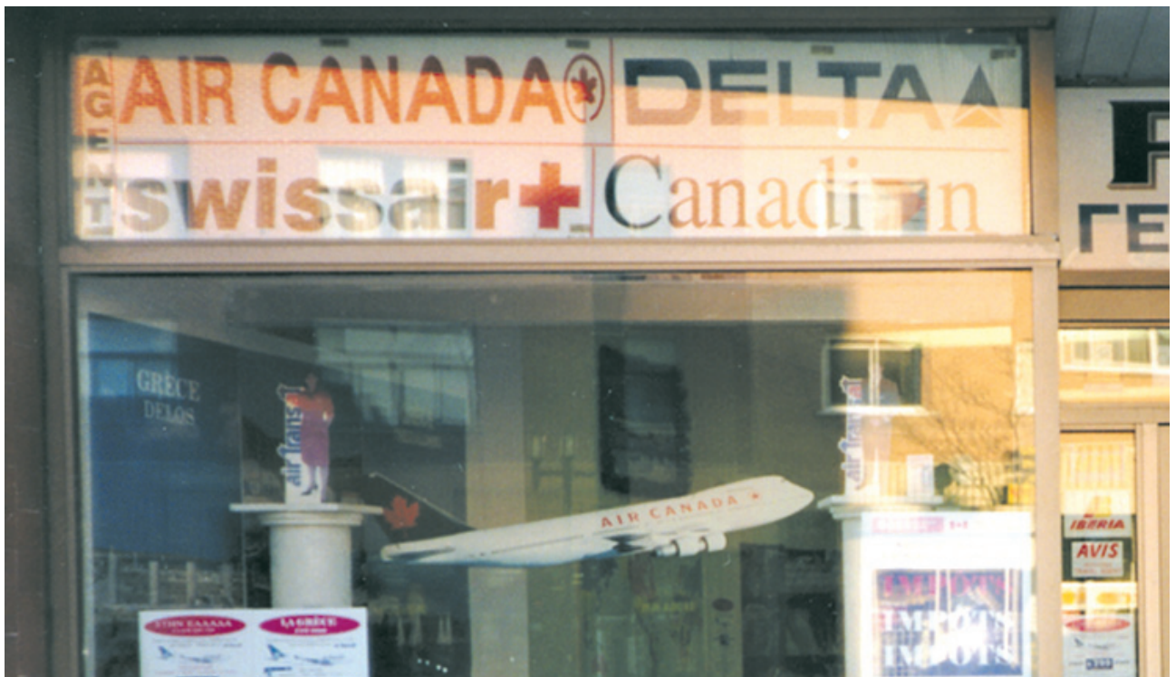
Ελληνικό ταξιδιωτικό γραφείο στο Μόντρεαλ.