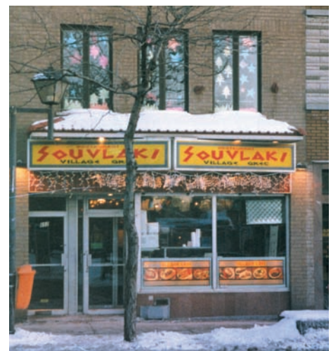
Le Village Grec.