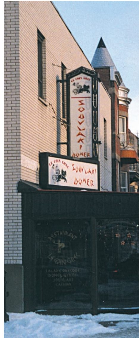
Le Coin Grec.