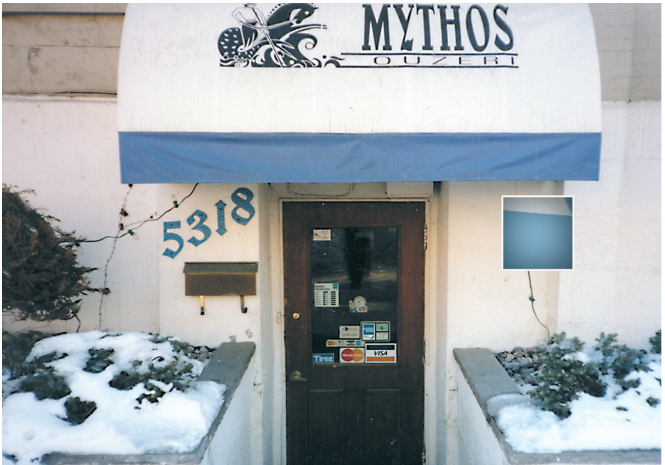
Ελληνικό ουζερί στο Μόντρεαλ, Avenue du Parc.

Ένας άλλος τομέας με τον οποίο καταπιάστηκαν οι Έλληνες είναι αυτός της βιομηχανίας τροφίμων. Σε κάθε ελληνική παροικία υπάρχουν ζαχαροπλαστεία, αρτοποιεία, καφεκοπτεία, βιοτεχνίες παραγωγής γλυκών και αναψυκτικών.