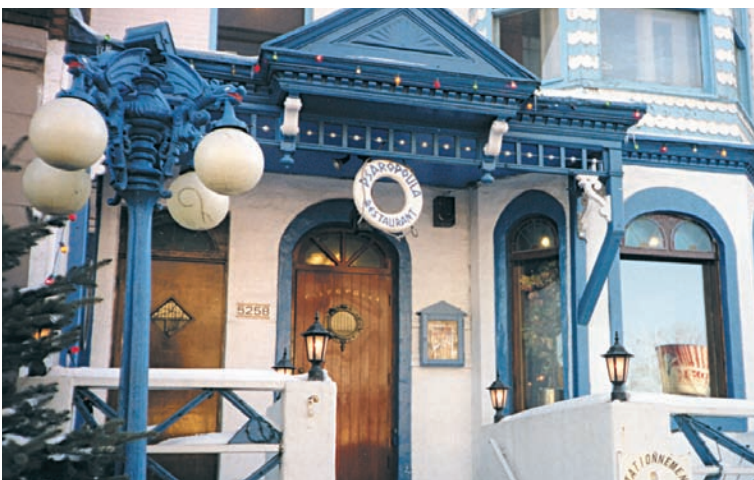
Ελληνική ψαροτραβέρνα στο Μόντρεαλ, Avenue du Parc στα γαλλικά, Park Avenue στα αγγλικά. Τα γνωστά «Παρκαβενείκα» για τους Έλληνες του Μόντρεαλ, αλλά και για τους άλλους Μοντρεαλίτες.

Ένας άλλος τομέας με τον οποίο καταπιάστηκαν οι Έλληνες είναι αυτός της βιομηχανίας τροφίμων. Σε κάθε ελληνική παροικία υπάρχουν ζαχαροπλαστεία, αρτοποιεία, καφεκοπτεία, βιοτεχνίες παραγωγής γλυκών και αναψυκτικών.