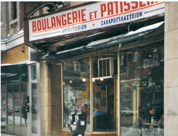
Ελληνικό αρτοποιείο και ζαχαροπλαστείο στο Μόντρεαλ.

Πολλοί άλλοι Έλληνες μεταπολεμικοί μετανάστες θα στραφούν προς το λιανικό εμπόριο. Θα ανοίξουν καταστήματα τροφίμων, ρούχων, ψιλικατζίδικα και άλλα. Αυτοί που δούλευαν ως οδηγοί ταξί θα δημιουργήσουν με την πάροδο του χρόνου εταιρείες ταξί. Άλλοι που είχαν κάποια μόρφωση θα ανοίξουν ταξιδιωτικά και λογιστικά γραφεία, ή θα ασχοληθούν με κτηματομεσιτικές επιχειρήσεις. Ένας άλλος τομέας που γνώρισε μεγάλη ακμή μεταπολεμικά, προτού υποχωρήσει στις μέρες μας, ήταν αυτός της βιομηχανίας γουναρικών. Τέτοιες βιομηχανίες υπήρχαν στη Νέα Υόρκη, στο Μόντρεαλ, στο Τορόντο, στη Φρανκφούρτη αλλά και αλλού.