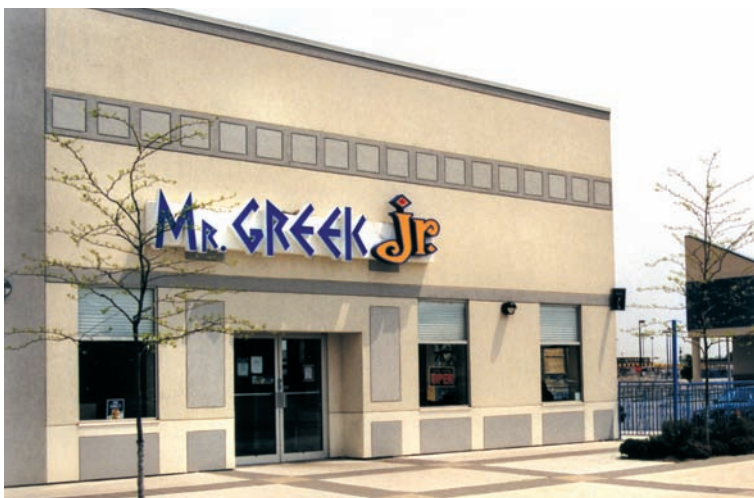
Ένα άλλο εστιατόριο με την ονομασία «Greek» στο Τορόντο.