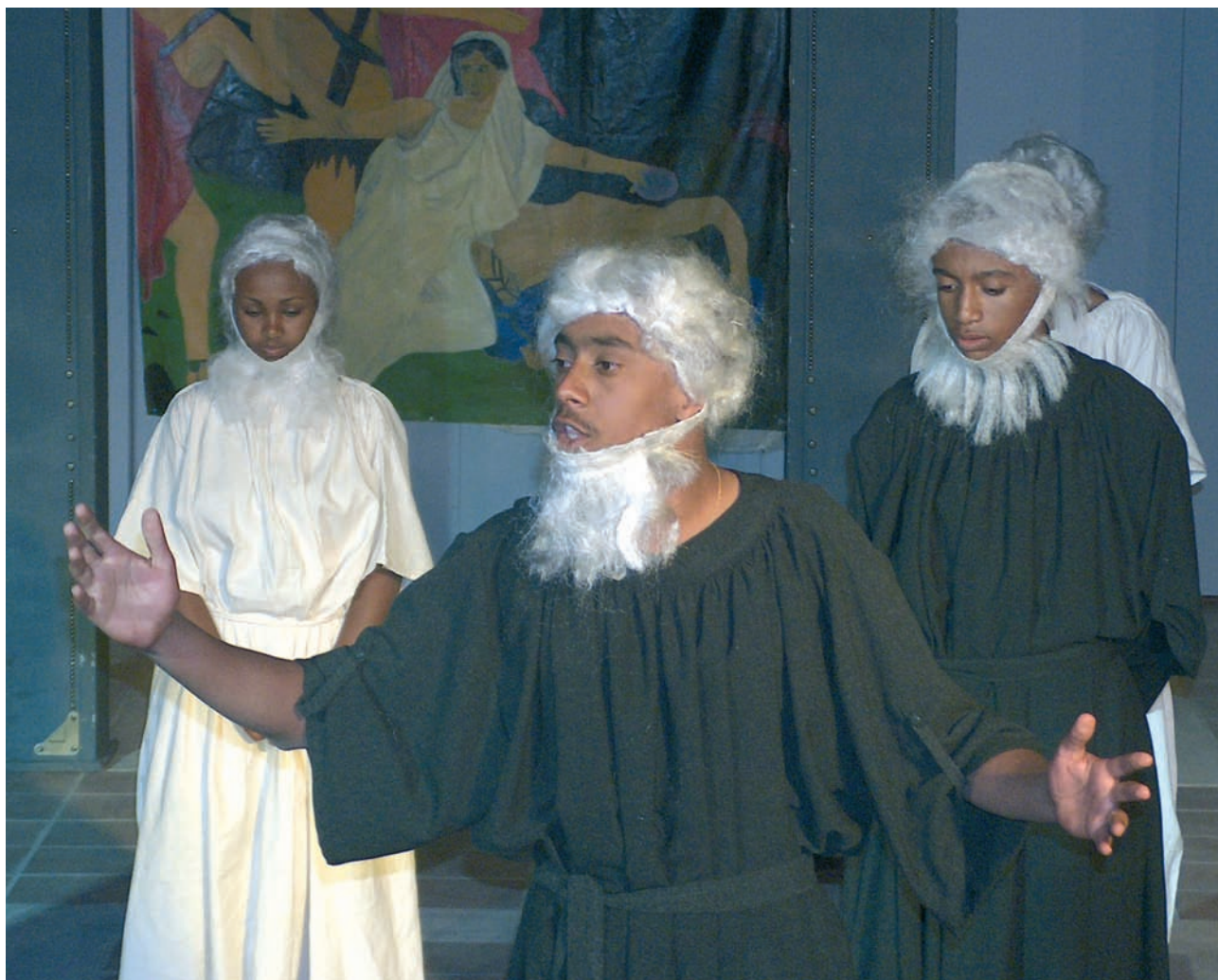
6ο Φεστιβάλ Μαθητικού Θεάτρου στο Πανεπιστήμιο Κρήτης. Θεατρική Ομάδα Μιχείου Γυμνασίου Αντις Αμπέμπα. «Αντιγόνη του Σοφοκλή».

Στην υπόλοιπη Αφρική συναντούμε μικρές ελληνικές παροικίες. Και σ'αυτές σημαντική απασχόληση των Ελλήνων είναι το εμπόριο και διάφορες φυτείες.