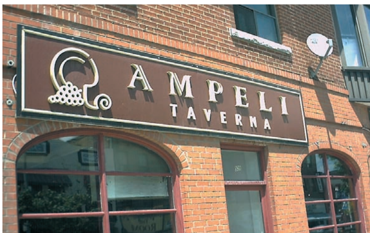
Ελληνικά εστιατόρια με το όνομα Greek (Τορόντο).