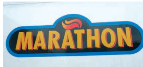
Εταιρία ελληνικών συμφερόντων, στην Αυστραλία, με αντικείμενο την παρασκευή, συσκευασία και εμπορία τροφίμων.