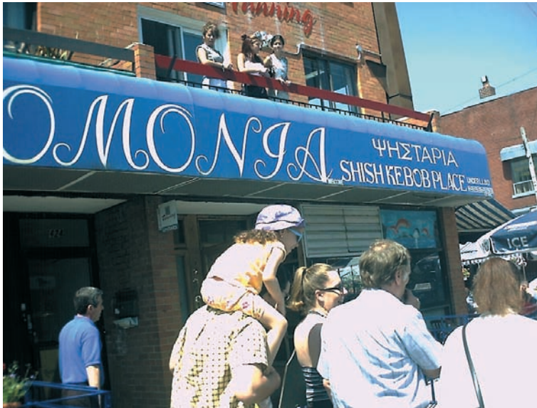
Ελληνική ψησταριά στο Τορόντο.