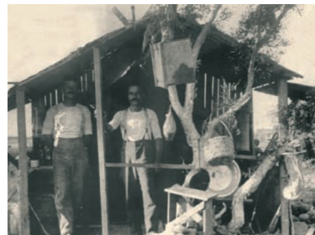
Οι πρώτοι Έλληνες αναγκάστηκαν να ζήσουν σε πρόχειρες παράγκες και σκηνές που έφτιαχναν με σανίδες, λαμαρίνες και τσουβάλια. Η φωτογραφία είναι από την Αυστραλία και δίνει μια εικόνα των συνθηκών ζωής των πρώτων Ελλήνων μεταναστών.

Γι' αυτό το λόγο από πολύ νωρίς οι Έλληνες μετανάστες προσπαθούσαν να εξοικονομήσουν χρήματα και να αγοράσουν το δικό τους σπίτι. Η αγορά σπιτιού ήταν μια από τις προτεραιότητές τους κυρίως στις μεταναστευτικές κοινότητες των ΗΠΑ, του Καναδά και της Αυστραλίας. Στις χώρες αυτές επίσης πολλοί Έλληνες όταν ξεπέρασαν τις πρώτες οικονομικές δυσκολίες έγιναν σιγά-σιγά ιδιοκτήτες σπιτιών που ενοικιάζουν. Κάτι παρόμοιο συνέβη και με τους Κυπρίους της Αγγλίας. Υπάρχουν επίσης Έλληνες στον τομέα αυτό που εργάζονται ως κτηματομεσίτες.