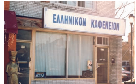
Ελληνικό καφενείο στο Τορόντο (2006).

Άλλοι χώροι κοινωνικής επαφής είναι σήμερα κάποιοι σύλλογοι που δημιουργήθηκαν από ανθρώπους που έχουν το ίδιο επάγγελμα. Έχουμε έτσι συλλόγους Ελλήνων γιατρών, Ελλήνων δικηγόρων, Ελλήνων οδοντογιατρών, Ελλήνων κτηματομεσιτών, κ.λπ. Στις περισσότερες φορές δεν πρόκειται ακριβώς για επαγγελματικούς οργανισμούς, αλλά περισσότερο για χώρους κοινωνικής συναστροφής.