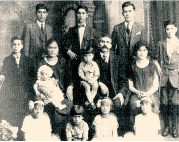
Οικογένεια μεταναστών στις αρχές του 20ου αιώνα στην Αμερική.