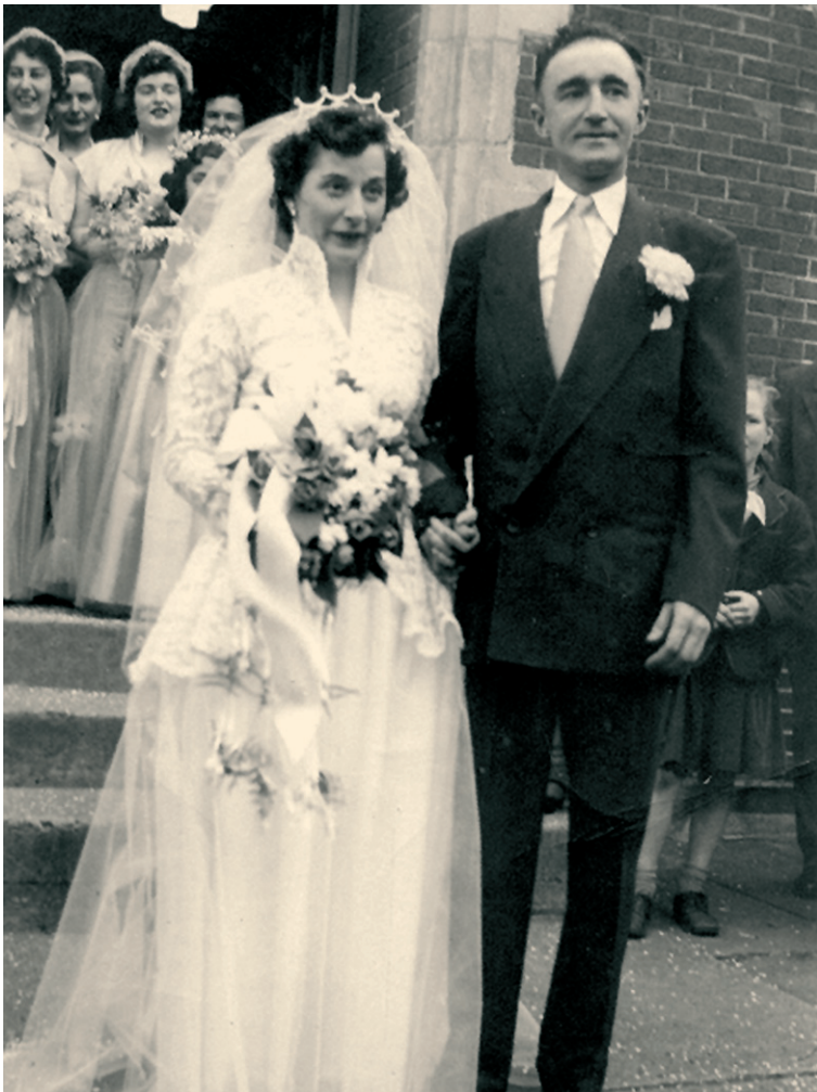
Ελληνικός γάμος. Χάλιφαξ, Καναδάς, 1932.