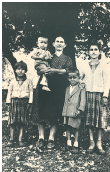
Η οικογένεια του μετανάστη πίσω στο χωριό στην Ελλάδα.

Οι πρώτοι Έλληνες μετανάστες ήταν κυρίως νέοι άντρες χωρίς οικογένεια. Πήγαιναν στη ξένη χώρα για μια καλύτερη ζωή και για να βοηθήσουν την οικογένειά τους στην Ελλάδα. Η μοναξιά και η έλλειψη οικογένειας έκανε τη ζωή τους στη ξενιτιά ακόμη πιο δύσκολη. Μερικοί από τους νέους μετανάστες παντρεύτηκαν ντόπιες γυναίκες και οι απόγονοί τους αφομοιώθηκαν στις τοπικές κοινωνίες. Οι πιο πολλοί όμως, όταν ένωσαν την ανάγκη να φτιάξουν οικογένεια, είτε πήγαν πίσω στην πατρίδα και παντρεύτηκαν Ελληνίδα από τον τόπο καταγωγής τους, είτε ζήτησαν με προξενιό νύφη από την Ελλάδα. Χιλιάδες νύφες μπάρκαραν έτσι για την Αμερική, τον Καναδά και την Αυστραλία για να συναντήσουν το γαμπρό με τον οποίο στις περισσότερες περιπτώσεις είχαν ανταλλάξει μόνο φωτογραφίες. Αργότερα βέβαια με την ανάπτυξη των ελληνικών παροικιών ήταν πιο εύκολο να δημιουργήσουν οικογένεια. Με τη δεύτερη και τρίτη γενιά, ωστόσο, αυξάνονται με γρήγορο ρυθμό οι μεικτοί γάμοι. Τα πρώτα χρόνια της μετανάστευσης, ιδιαίτερα στη Γερμανία, τα μέλη της οικογένειας συχνά ζούσαν χωρισμένα. Ήταν συνηθισμένο φαινόμενο τα παιδιά ή κάποια από τα παιδιά να ζουν με τον παππού και τη γιαγιά στην Ελλάδα και οι γονείς τους να δουλεύουν στη Γερμανία.