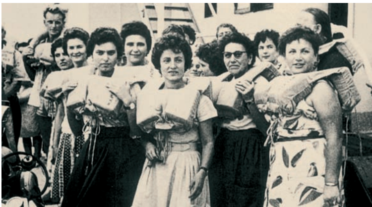
Φωτογραφία με "νύφες" κατά τη διάρκεια του ταξιδιού τους προς την Αυστραλία.

Το σενάριο της ταινίας έγραψε η συγγραφέας Ιωάννα Καρυστιάνη και είναι εμπνευσμένο από ένα δημοσίευμα της αμερικανικής εφημερίδας New York Times του Ιουλίου 1922, στο οποίο αναφέρεται η άφιξη του υπερωκεανείου King Alexander με 560 Ελληνίδες και αρκετές Ρωσίδες, Βουλγάρες και Ρουμάνες νύφες. Η Καρυστιάνη είδε το δημοσίευμα αυτό στο μουσείο μεταναστών του νησιού Έλλης. Στο νησί αυτό κατέληγαν οι μετανάστες που έφταναν στη Νέα Υόρκη. Η ταινία γυρίστηκε το 1998.