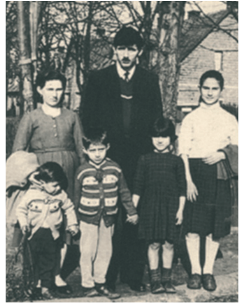
Λίγο μετά την άφιξη της οικογένειας του ανθρακωρύχου στο Βέλγιο (1959).