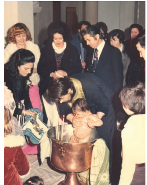
Βάφτιση στο Ortladen Γερμανίας τη δεκαετία του 1970.