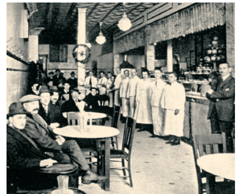
Olympia Café στο Μόντρεαλ, (1921).