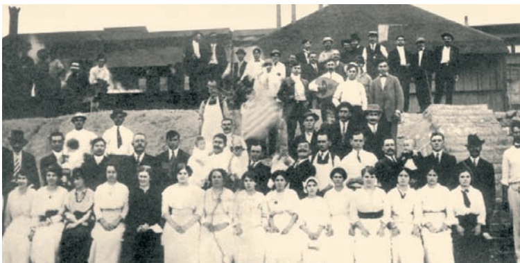
Νύφες... νύφες... νύφες...