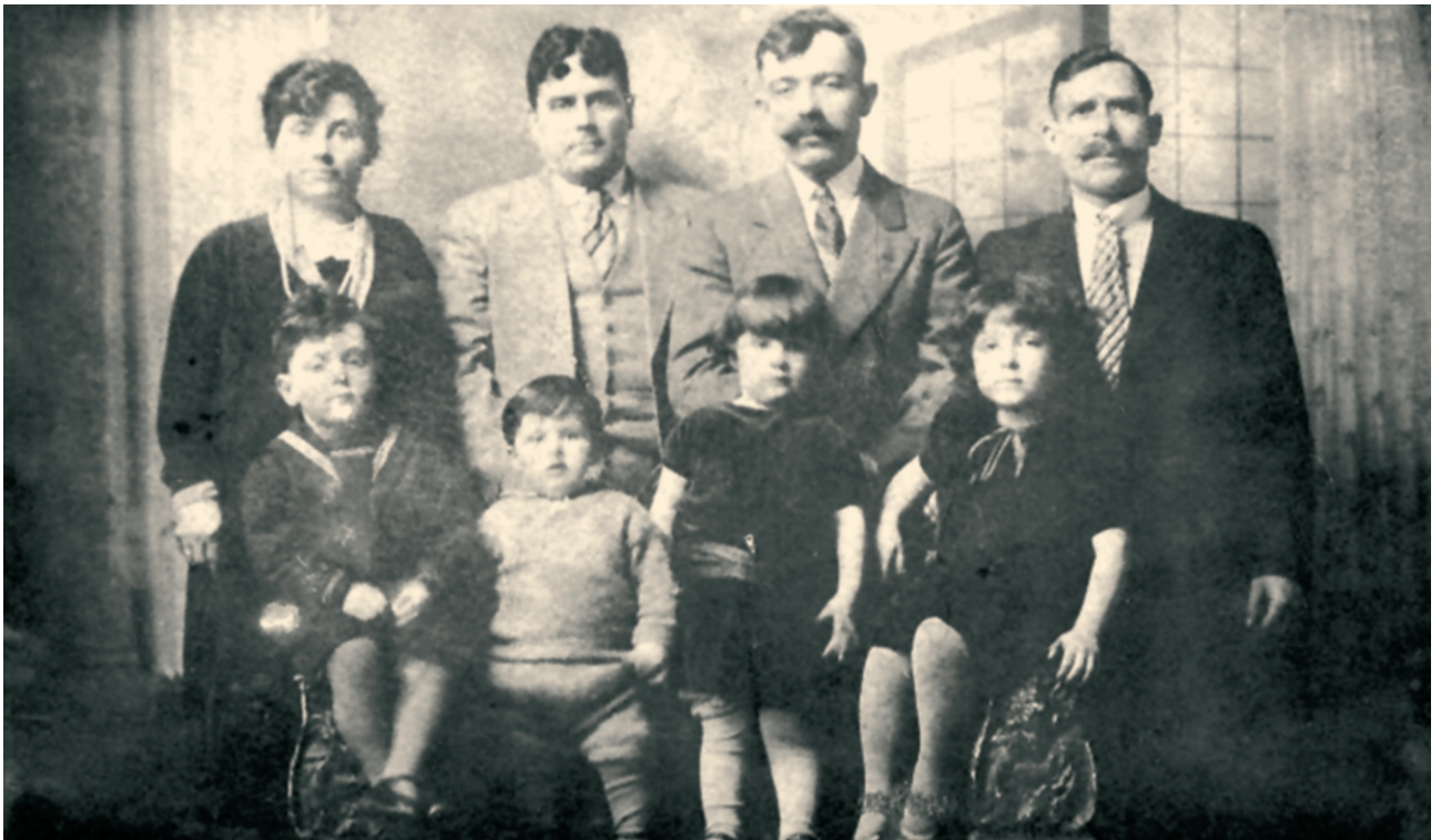
Μία από τις πρώτες οικογένειες Ελλήνων μεταναστών στον Καναδά. Χάλιφαξ, 1908.

Η ελληνική οικογένεια στις μεταναστευτικές παροικίες, ειδικά αυτή της πρώτης γενιάς, διατηρούσε τις παραδοσιακές αρχές και αξίες και θα μπορούσε να χαρακτηριστεί ως πατριαρχική. Με τη δεύτερη γενιά όμως των μεταναστών η ελληνική οικογένεια προσαρμόζεται στις αξίες των χωρών όπου βρίσκεται έστω κι αν διατηρεί στοιχεία από την ελληνική παράδοση.