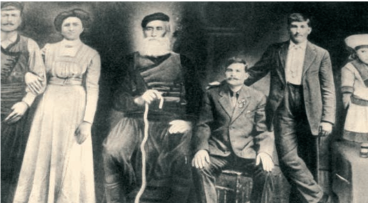
Λίγο πριν ξεκινήσουν τα παιδιά και τα εγγόνια για το άγνωστο, για το μεγάλο υπερατλαντικό ταξίδι, σε μια αναμνηστική φωτογραφία. (Αρχές εικοστού αιώνα).