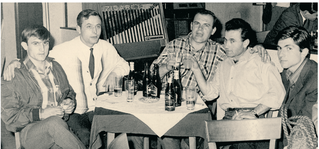
Έλληνες μετανάστες στο καφενείο. (Γερμανία, δεκαετία του '70).