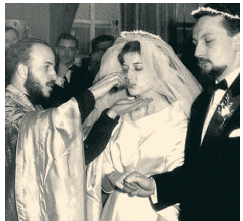
Μικτός ελληνοβελγικός γάμος.

Με ένα διαβατήριο σαν αυτό μετανάστευσαν οι περισσότερες οικογένειες στην Αυστραλία. Το κάθε άτομο, η κάθε οικογένεια έχει να διηγηθεί τη δική της ιστορία για τη ζωή στην Αυστραλία.