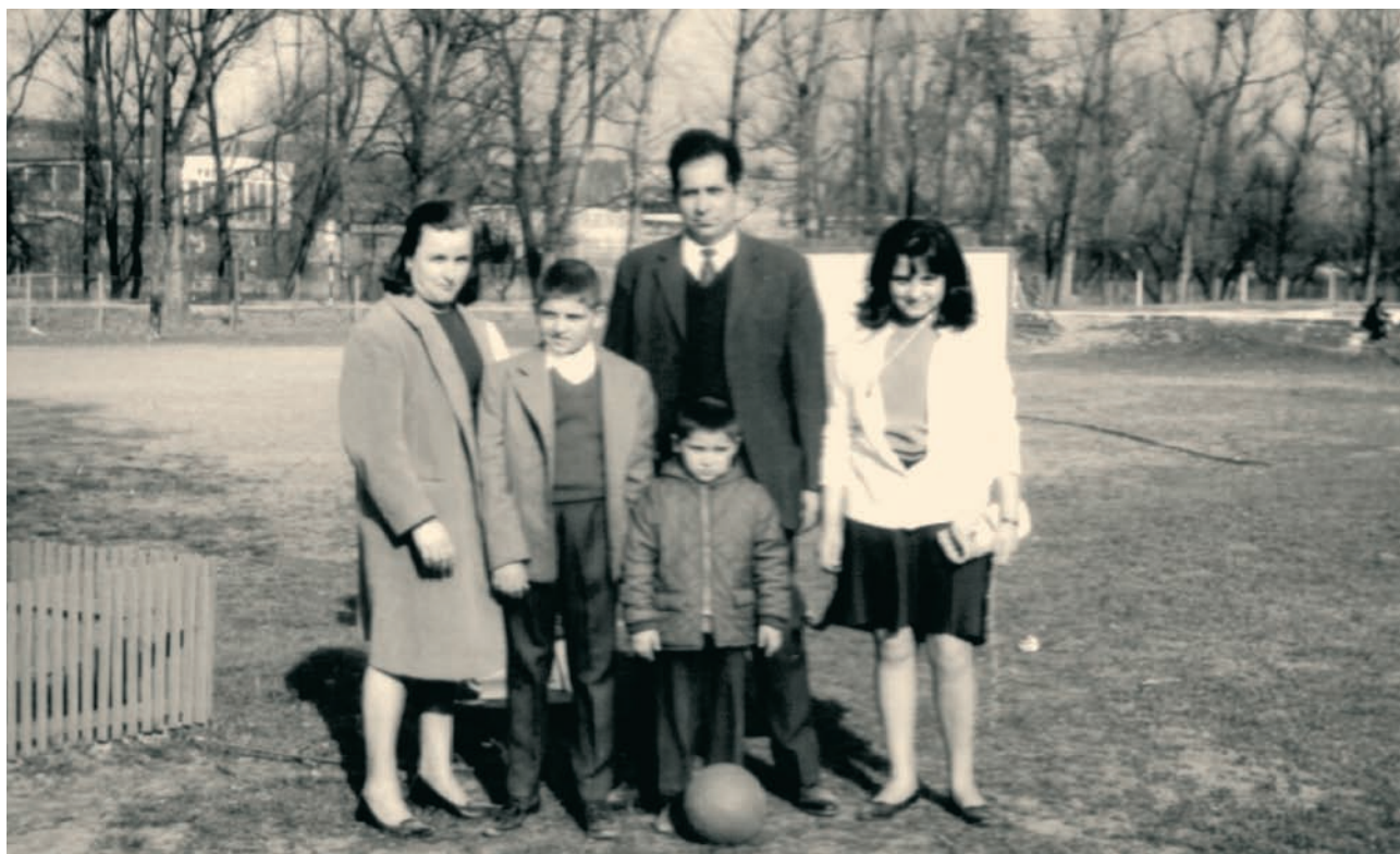
Γερμανία: Τα υπόλοιπα μέλη της οικογένειας έρχονται από την Ελλάδα...