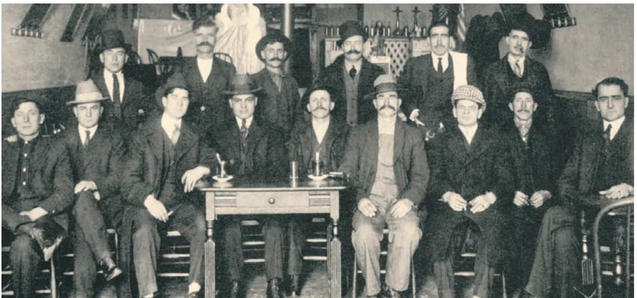
Έλληνες μετανάστες σε καφενείο στο Όγκντεν της Γιούτας. (ΗΠΑ, 1900).