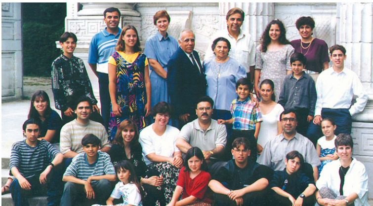
Τα παιδιά μεγάλωσαν. Στη φωτογραφία τρεις γενιές Ελλήνων στο Τορόντο (1998).