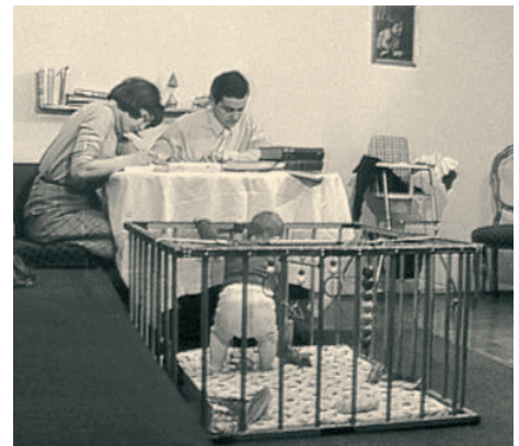
Νεαρό ζευγάρι με το μικρό παιδί στο πάρκο του (Γερμανία, δεκαετία του '70).