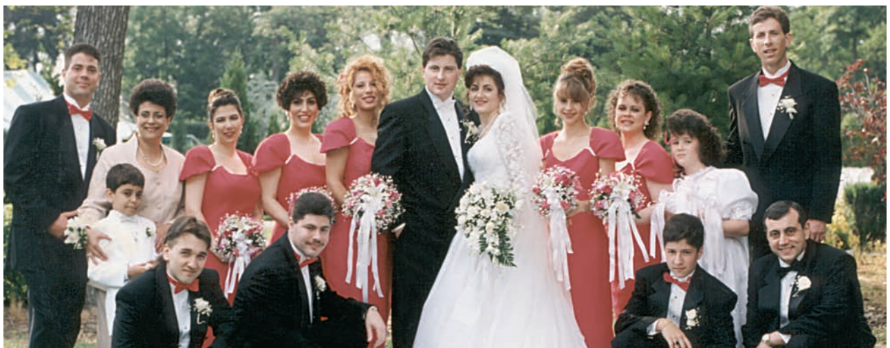
Σύγχρονος ορθόδοξος, ελληνικός γάμος και η αναμνηστική φωτογραφία έξω από την εκκλησία στις ΗΠΑ.