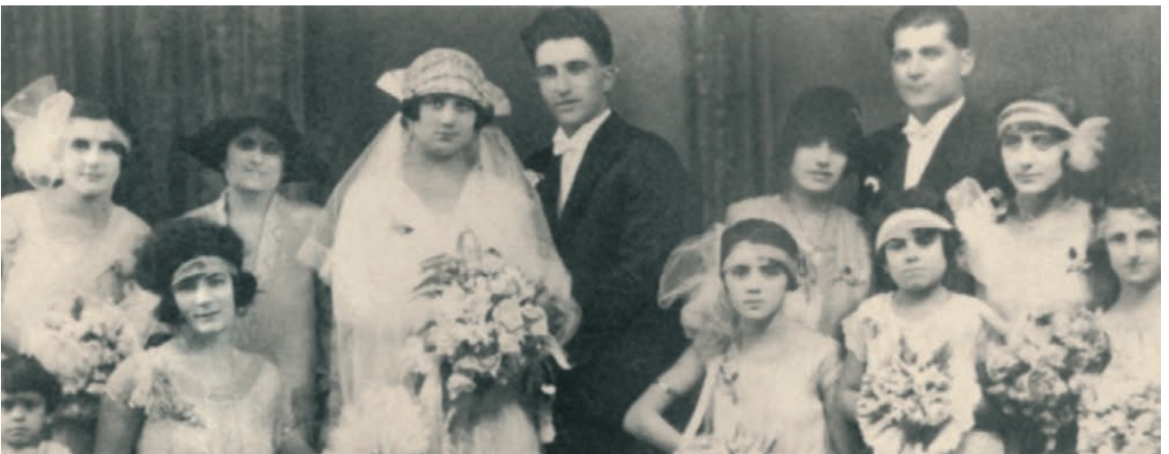
Καστελοριζιακός γάμος στην Πέρθη, το 1905.