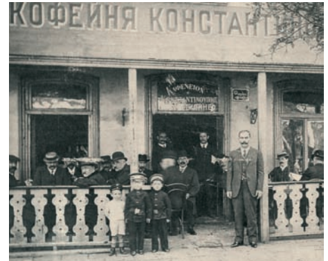
Το καφενείο «Κωνσταντινούπολη» στην Οδησό.

Σήμερα βέβαια ο κοινωνικός ρόλος του καφενείου δεν είναι πια ο ίδιος. Οι άνθρωποι επικοινωνούν με χίλιους άλλους τρόπους. Δεν είναι πια το κέντρο της κοινωνικής ζωής τους.