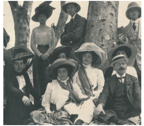
Ελληνική οικογένεια στην Αλεξάνδρεια το 1909.