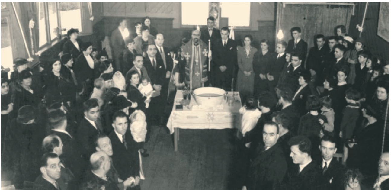
Πέντε βαφτίσεις και δύο γάμους τέλεσε ομαδικά ο μητροπολίτης Αυστραλίας Τιμόθεος στο Ουέλλιγκτον της Νέας Ζηλανδίας το 1938. Τα νεοβαφτισμένα παιδιά φωτογραφήθηκαν στις αγκαλιές των γονέων τους.