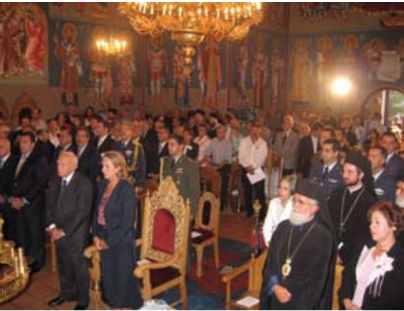
Υποδοχή του Προέδρου της Δημοκρατίας κ. Κάρολου Παπούλια και της συζύγου του Μαίης στην Ι.Μ. Γερμανίας στη Βόννη, το 2006