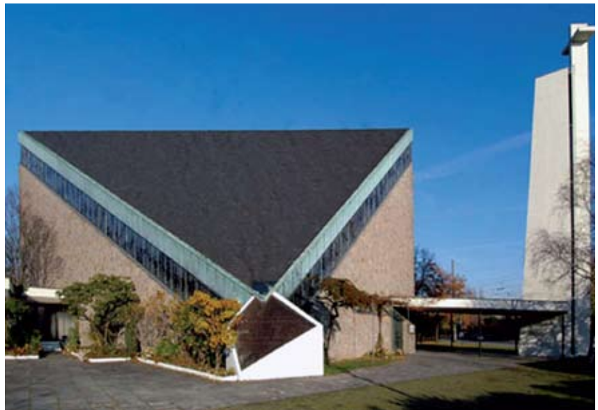
Η Ελληνική Ορθόδοξη Εκκλησία «Υψωσης Τιμίου Σταυρού» στο Mannheim εντυπωσιάζει και ξεχωρίζει με την μοντέρνα αρχιτεκτονική της.