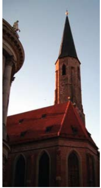
Ενδεικτικό παρακολούθησης μαθημάτων ελληνικής γλώσσας από την ενορία του Kelsterbach. Η ορθόδοξη Εκκλησία συμμετέχει και βοηθά ενεργά σε θέματα εκπαίδευσης των Ελληνοπαίδων της Γερμανίας.