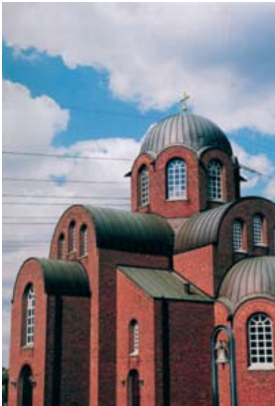
Ο ιερός ναός του Αγίου Αποστόλου Ανδρέου, Ντύσσελντορφ.

Από τους πολλούς ναούς της Γερμανίας εκείνος που ξεχωρίζει, λόγω των αγιογραφιών του, είναι ο ναός του «Αγίου Αποστόλου Ανδρέου» στο Düsseldorf. Χαρακτηριστική είναι η εικόνα της Παναγίας στο Ιερό του ναού.