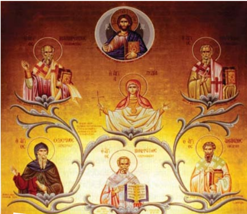
“Άγιοι της Ευρώπης”, από το εσωτερικό του ναού του Αποστόλου Ανδρέα στο Ντύσελντορφ Γερμανίας