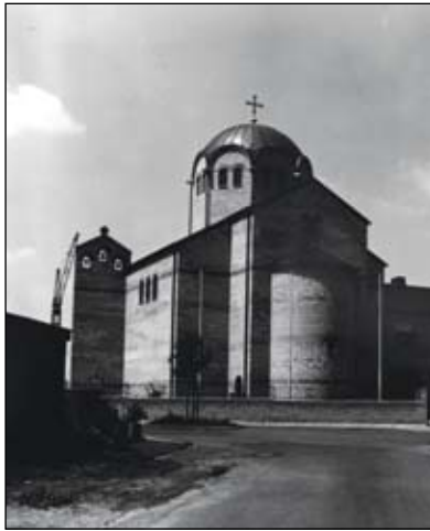
Η Ιερά Μητρόπολη Γερμανίας το 1963