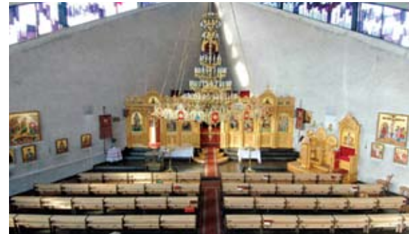
Ο εσωτερικός χώρος της Ελληνικής Ορθόδοξης Εκκλησίας «Ύψωση Τιμίου Σταυρού» στο Mannheim. Από το 1963 δέχεται στέγη σε διάφορες άλλες εκκλησίες μέχρι το 2004 που αποκτά δικό της ναό. Η εκκλησία προσφέρει ένα ποικίλο έργο στους πιστούς της, όπως μάθημα Γερμανικών και Ελληνικών, Κινησιοθεραπεία για γυναίκες, Χορωδία, Χορευτικό, Κύκλο γυναικών.