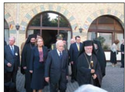
Ο Μητροπολίτης κ. Αυγουστίνος με τον πρόεδρο της Ελληνικής Δημοκρατίας κ. Κάρολο Παπούλια (2006).