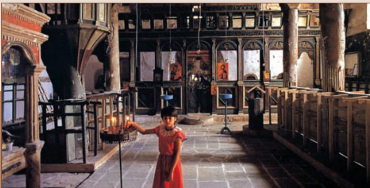
Λεσκοβίκι, το εσωτερικό του ναού της Κοιμήσεως της Θεοτόκου. Η μικρή Λεσκοβίτισσα ανάβει κερι στην εκκλησία