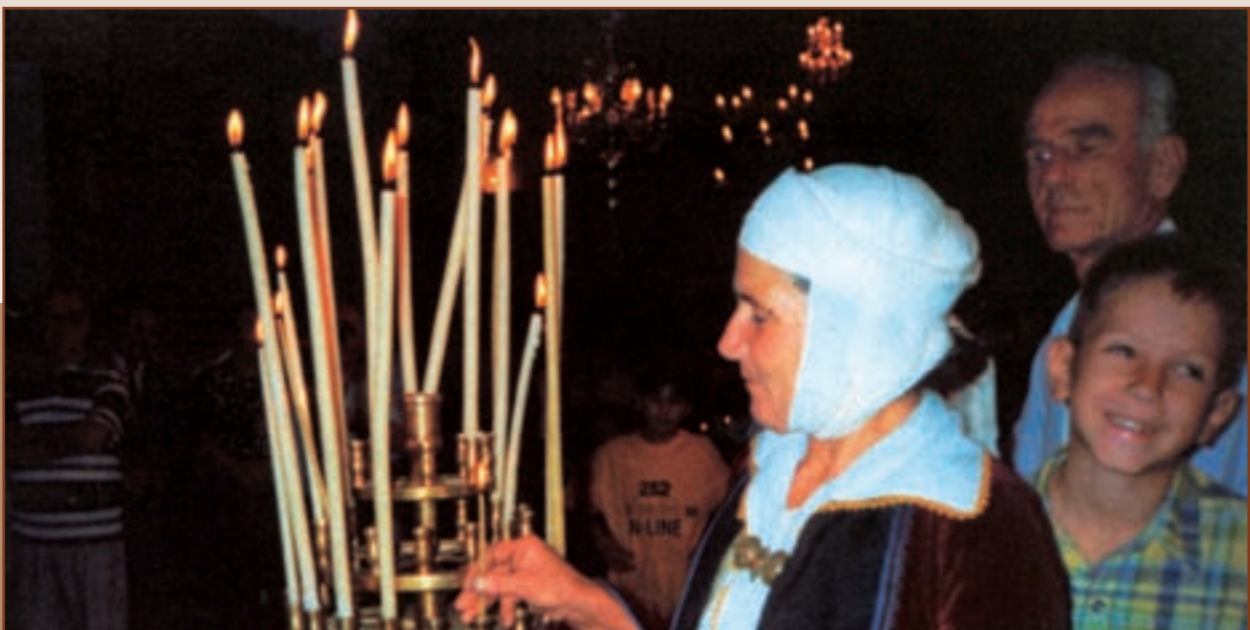
Δεκαπενταύγουστος στη Σωπική (2000)