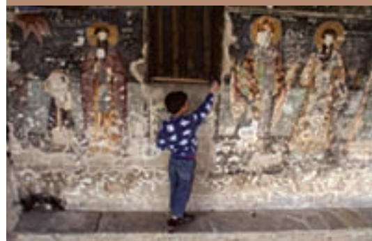
Οι εγκαταλειμμένες εκκλησίες άνοιξαν τις πόρτες τους από το 1991