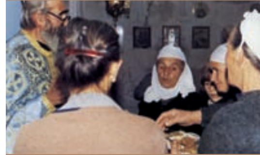
Γυναίκες στη Θεία Λειτουργία της Κυριακής

Είναι αλήθεια ότι ο Αναστάσιος κατά τα πρώτα χρόνια μετά την άφιξή του στην Αλβανία και την ενθρόνισή του ως Αρχιεπισκόπου Τιράνων, Δυρραχίου και πάσης Αλβανίας αντιμετώπισε πολλές δυσκολίες εκ μέρους της αλβανικής κυβέρνησης εξαιτίας της ελληνικής του καταγωγής. Ωστόσο, με την πάροδο των χρόνων και την ανάπτυξη του πολύπλευρου οργανωτικού, κοινωνικού και φιλανθρωπικού του έργου, με την προσωπική του χάρη