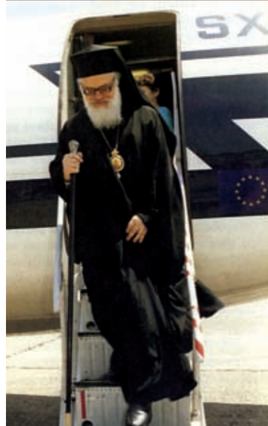
Ο πατριαρχικός Έξαρχος Αναστάσιος Γιαννουλάτος φθάνει στο αεροδρόμιο των Τιράνων. 16 Ιουλίου 1991

Κατά τη μεταπολεμική περίοδο, με το διάταγμα της 13-11-1967, η Αλβανία ανακηρύχθηκε ως «το πρώτο αθεϊστικό κράτος στον κόσμο». Την περίοδο αυτή η αλβανική Εκκλησία τέθηκε σε καθεστώς πραγματικού διωγμού, η εκκλησιαστική περιουσία δημεύτηκε και επιβλήθηκε ισχυρός κρατικός έλεγχος σε κάθε εκκλησιαστική δραστηριότητα.