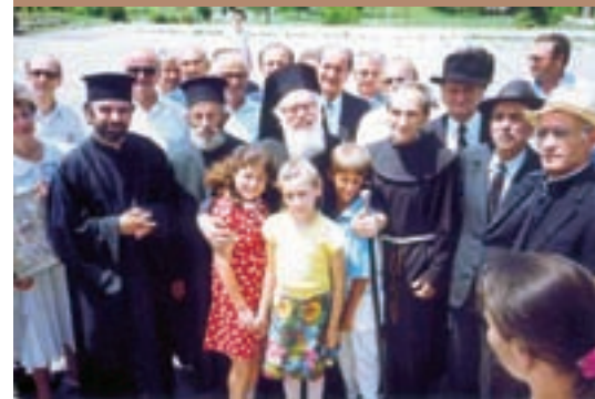
Επίσκεψη Αρχιεπισκόπου Αναστασίου σε μειονοτικό χωριό