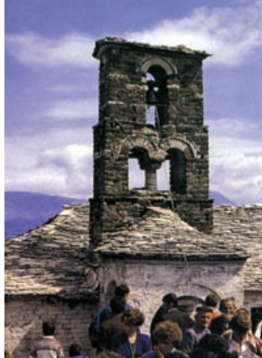
Μονή Αγίας Τριάδος στην Πέπελη Αργυροκάστρου

Ο Αρχιεπίσκοπος Αναστάσιος διατέλεσε Επίσκοπος Ανδρούσης, Γενικός Διευθυντής της Αποστολικής Διακονίας της Εκκλησίας της Ελλάδος, Διευθυντής του Τομέα Θρησκευολογίας και Κοινωνιολογίας και Κοσμήτωρ της Θεολογικής Σχολής του Πανεπιστημίου Αθηνών, Πρόεδρος της Επιτροπής Συμπαραστάσεως του Κυπριακού Αγώνα, Πρόεδρος της Επιτροπής Πρόνοιας της Πνευματικής Κληρονομιάς της Κύπρου, Μέλος του Διοικητικού Συμβουλίου του Κέντρου Μεσογειακών και Αραβικών Σπουδών, πρόεδρος της Επιτροπής Ιεραποστολής και Ευαγγελισμού και του Παγκόσμιου Ιεραποστολικού Συνεδρίου (1989), Επίτιμο μέλος του Kuratorium του ρωμαιοκαθολικού Ιδρύματος Pro Oriente (Βιέννη, 1989). Είναι Αντεπιστέλλον Μέλος της Ακαδημίας Αθηνών (από το 1993). Από το 1998 είναι επίτιμο μέλος της Θεολογικής Ακαδημίας της Μόσχας. Είναι επίτιμος διδάκτωρ Θεολογίας και Φιλοσοφίας 15 πανεπιστημιακών σχολών και τμημάτων.