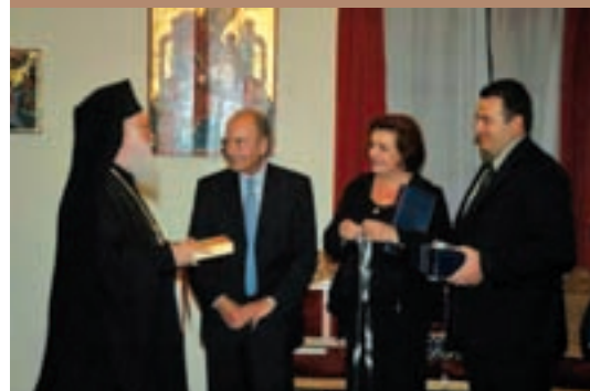
Από την επίσκεψη του τότε Πρόεδρου της Δημοκρατίας Κ. Στεφανόπουλου και της Υπουργού Παιδείας κ. Μαριέτας Γιαννάκου με τον υφυπουργό Εξωτερικών κ. Ευριπίδη Στυλιανίδη στα Τίρανα (2004)