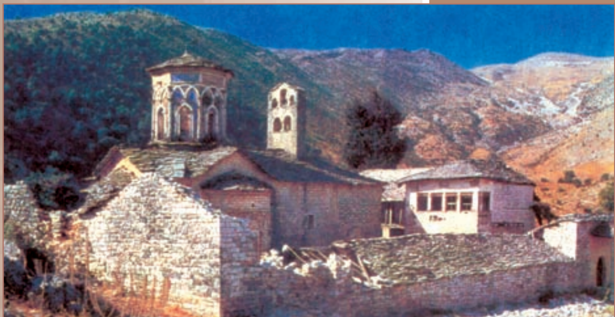
Μονή κοιμήσεως Θεοτόκου Ρεβενίων, το κομψότερο δείγμα αρχιτεκτονικής των Μεταβιζαντινών χρόνων - 6ου αιώνα μ.Χ. Γοραντζή Δερόπολης