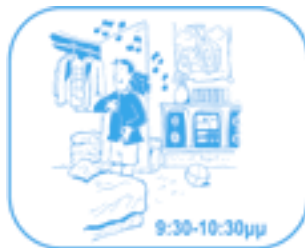
ντύνεται και ακούει