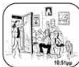
ανοίγει την πόρτα και βλέπει τρεις συμφοιτητές του να περιμένουν...