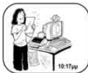
το τυπώνει σε ωραίο μπλε χαρτί