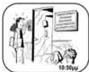
φτάνει στο δικηγορικό γραφείο