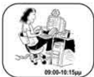
Ο Φίλιππος γράφει το βιογραφικό του στον υπολογιστή