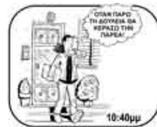
βγαίνει από το σπίτι