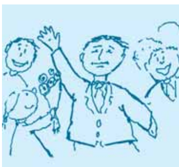
η επίσκεψη του πρωθυπουργού

Ε. Γράψε έναν τίτλο-λεζάντα κάτω από κάθε εικόνα, όπως στο παράδειγμα.