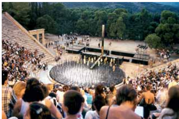
Από την παράσταση Πέρσες στο θέατρο της Επιδαύρου

Επειδή οι παραστάσεις κάθε έργου είναι μόνο δύο, Παρασκευή και Σάββατο, όποιος ενδιαφέρεται πρέπει να κάνει κράτηση εισιτηρίου αρκετά νωρίς.