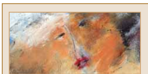
Η ΑΙΘΟΥΣΑ ΤΕΧΝΗΣ «ΑΝΕΜΟΣ»

σας προσκαλεί την Πέμπτη 23 Νοεμβρίου 2006 και ώρα 7.30 μ.μ. στην έκθεση του ζωγράφου