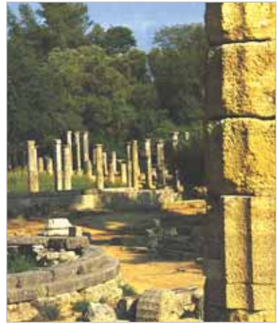
Αρχαιολογικός Χώρος της Ολυμπίας

Οι πρώτοι Ολυμπιακοί αγώνες έγιναν το 776 π.Χ. Οι αγώνες τελούνταν κάθε πέμπτο έτος και διαρκούσαν πέντε μέρες. Το διάστημα των τεσσάρων ετών που μεσολαβούσε λεγόταν Ολυμπιάδα. Γίνονταν κατά τη θερινή πανσέληνο (πρώτη πανσέληνο μετά τη θερινή ισημερία) που ήταν μεταξύ της τελευταίας βδομάδας του Ιουλίου και του πρώτου μισού του Αυγούστου.