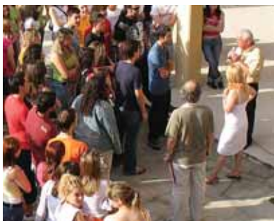
Κουβέντα με καθηγητές

τα Αγγλικά τα Γαλλικά τα Ισπανικά τα Γερμανικά τα Ελληνικά τα Ρωσικά τα Λατινικά