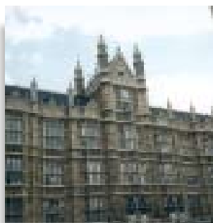
Το κτίριο του Κοινοβουλίου