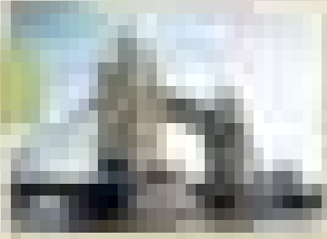
Η γέφυρα του πύργου του Λονδίνου