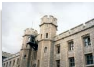
Ο πύργος του Λονδίνου

τα αξιοθέατα τα μνημεία το μουσείο η πινακοθήκη, η γκαλερί η συναυλία, το κονσέρτο η έκθεση το παλάτι, τα ανάκτορα το ποτάμι, ο ποταμός η γέφυρα η βιτρίνα