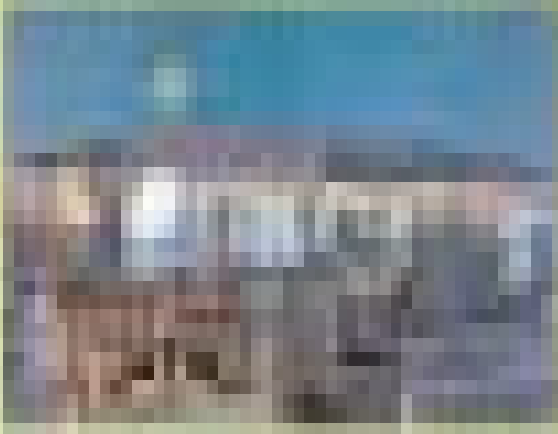
Αθήνα-Νυκτερινό, Σπύρος Βασιλείου