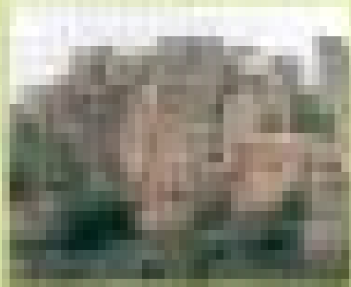
Παραδοσιακός οικισμός στη Μάνη