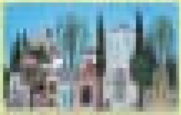
Η Γειτονιά, Ευγένιος Σπαθάρης