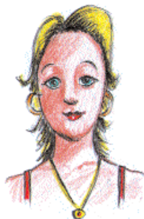
η μητέρα Βασιλική